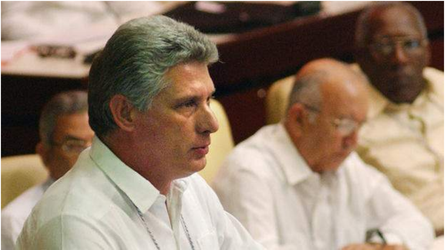
Miguel Díaz-Canel Bermúdez