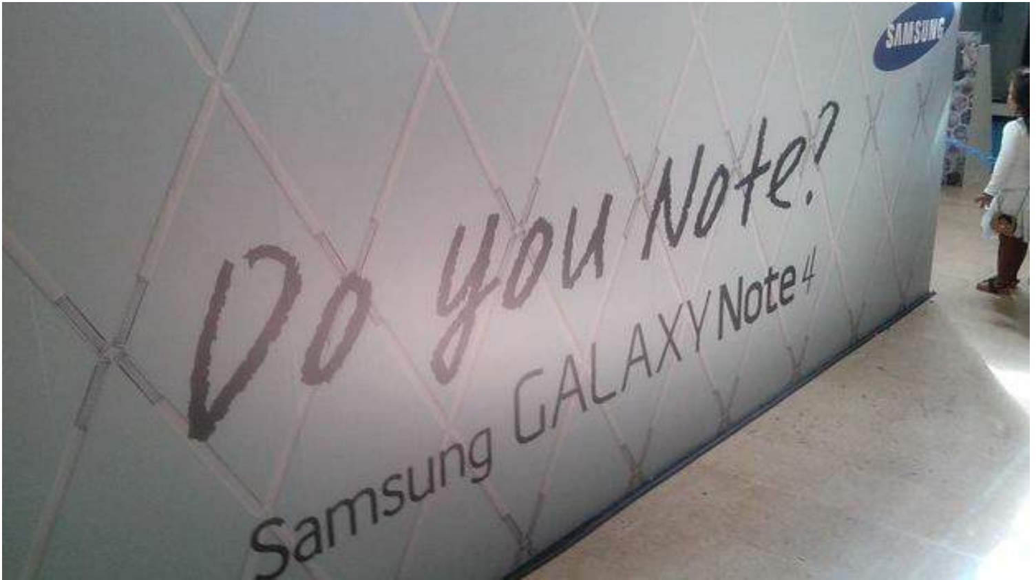
Cartel publicitario de Samsung