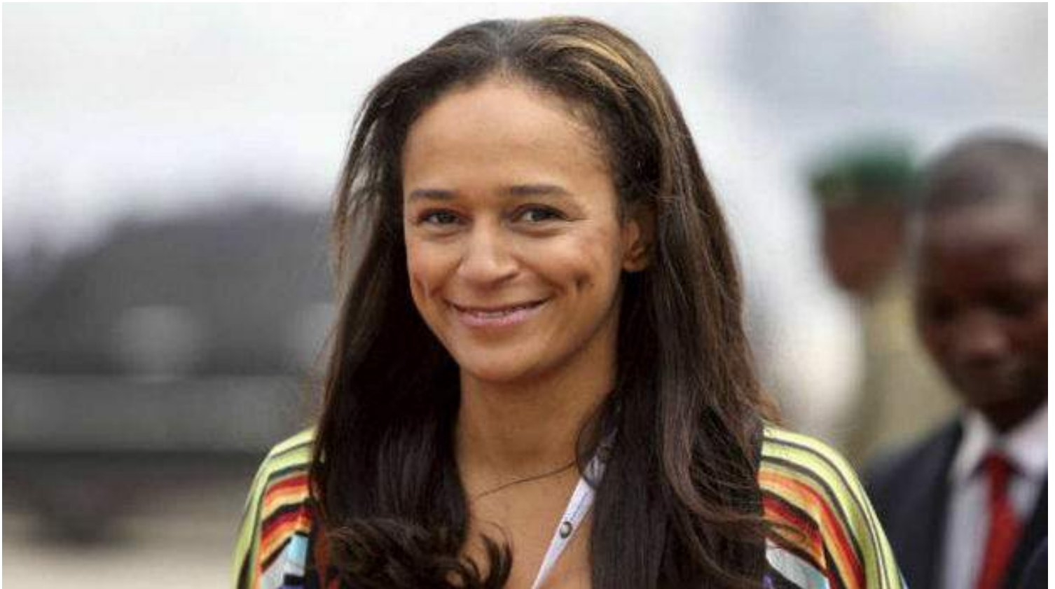
Isabel Dos Santos, la hija del presidente de Angola.