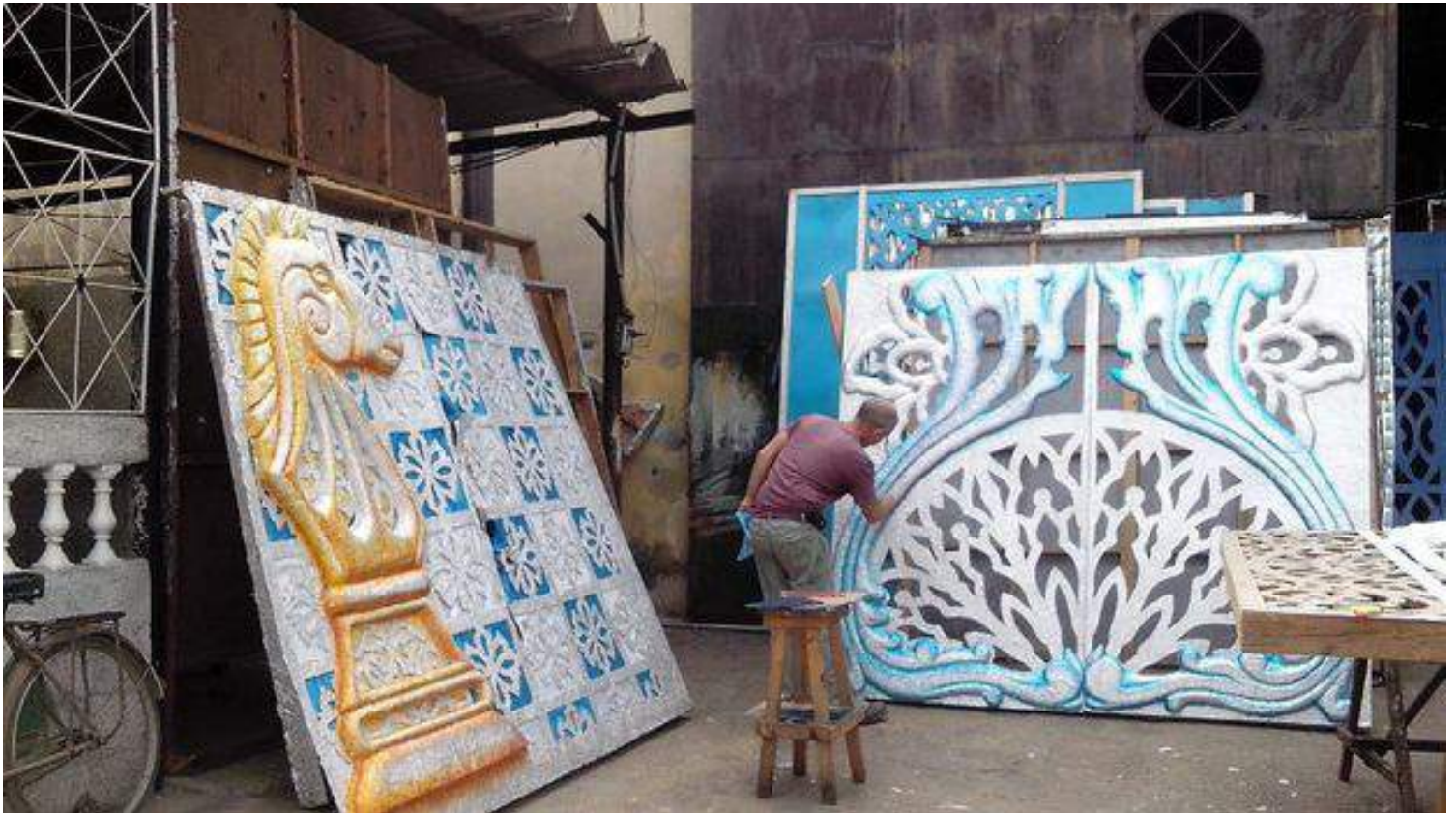
Se ultiman los preparativos para las Charangas de Bejucal