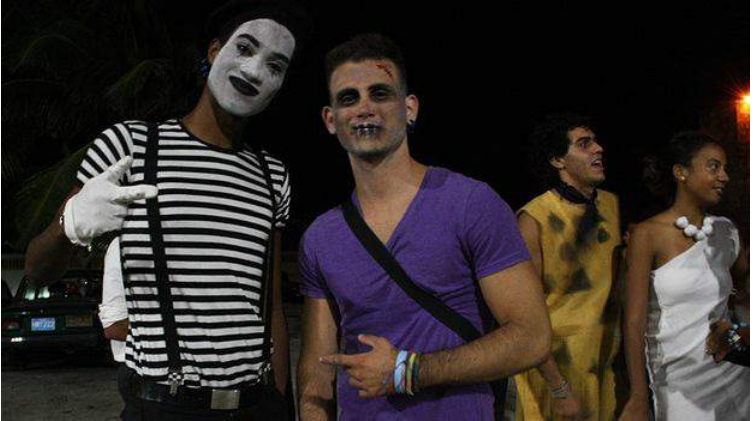
Jóvenes disfrazados durante la celebración de Halloween en La Habana