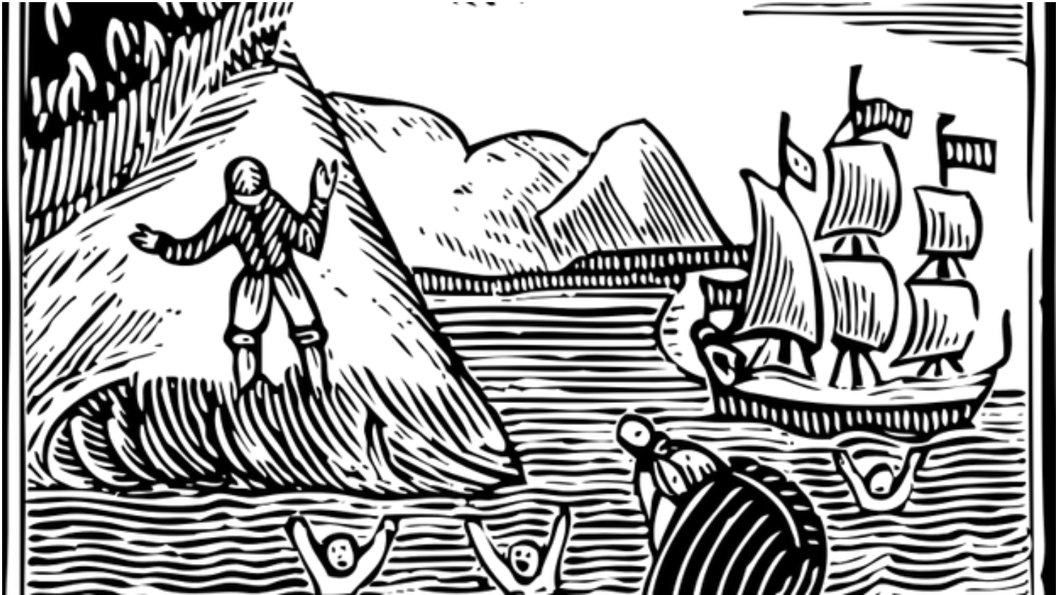
La "soberanía" de Robinson Crusoe (CC)