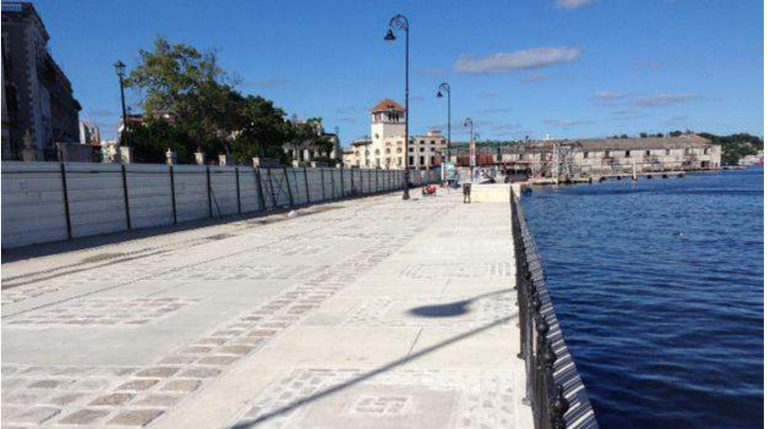
Revitalización del paseo marítimo en la zona de la Bahía de La Habana