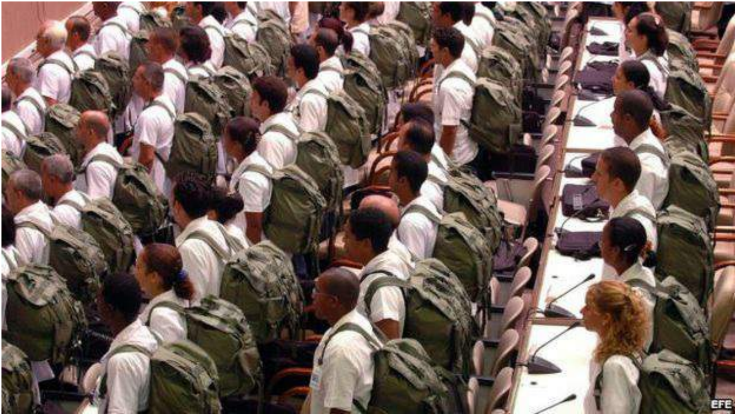
Médicos cubanos antes de salir a una misión.