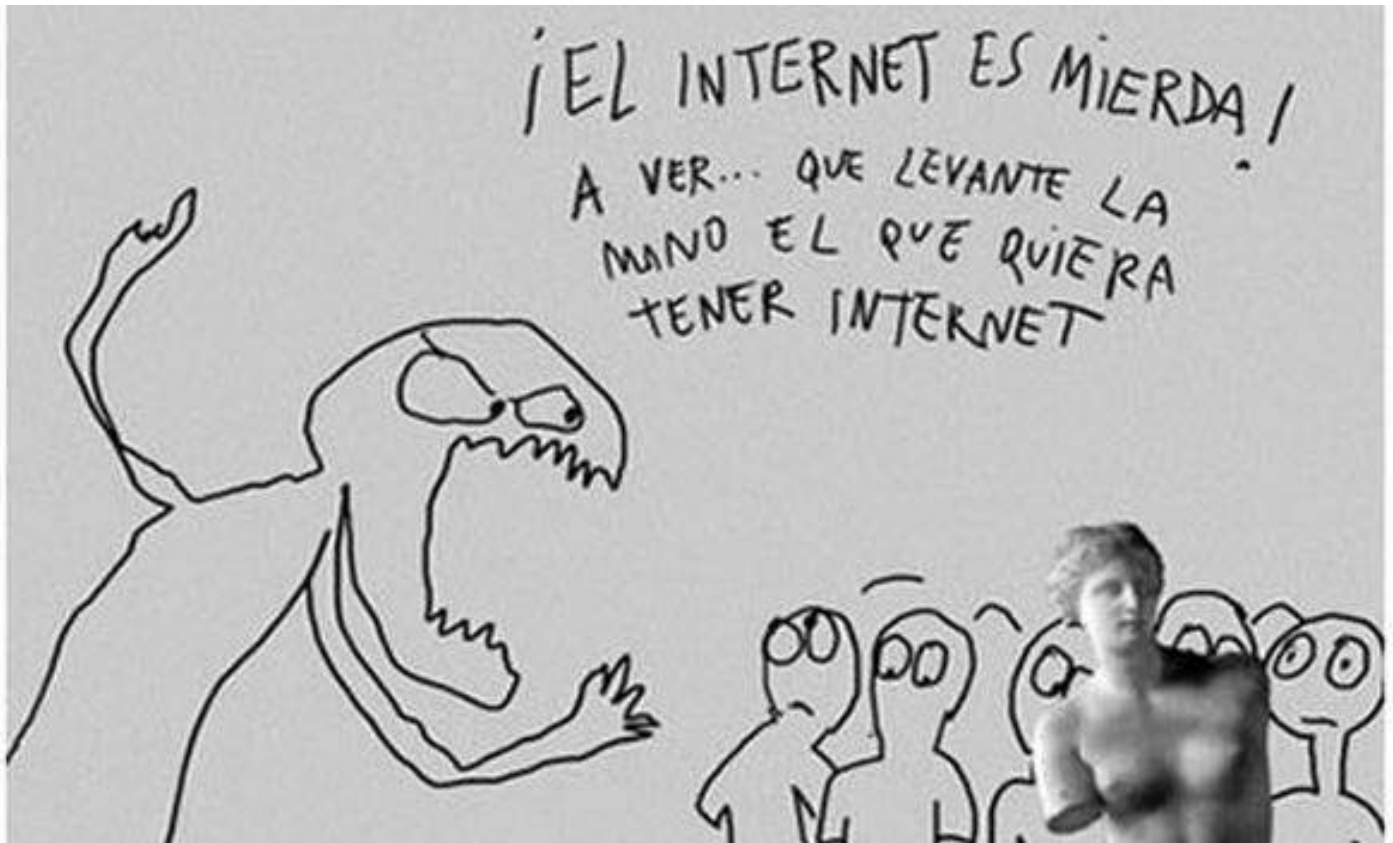
Obra de Lázaro Saavedra