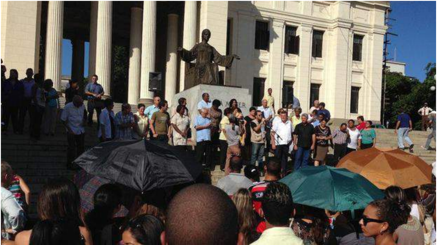
Inicio del curso escolar en la Universidad de La Habana, uno de los centros escolares que brindaría exportación de servicios docentes