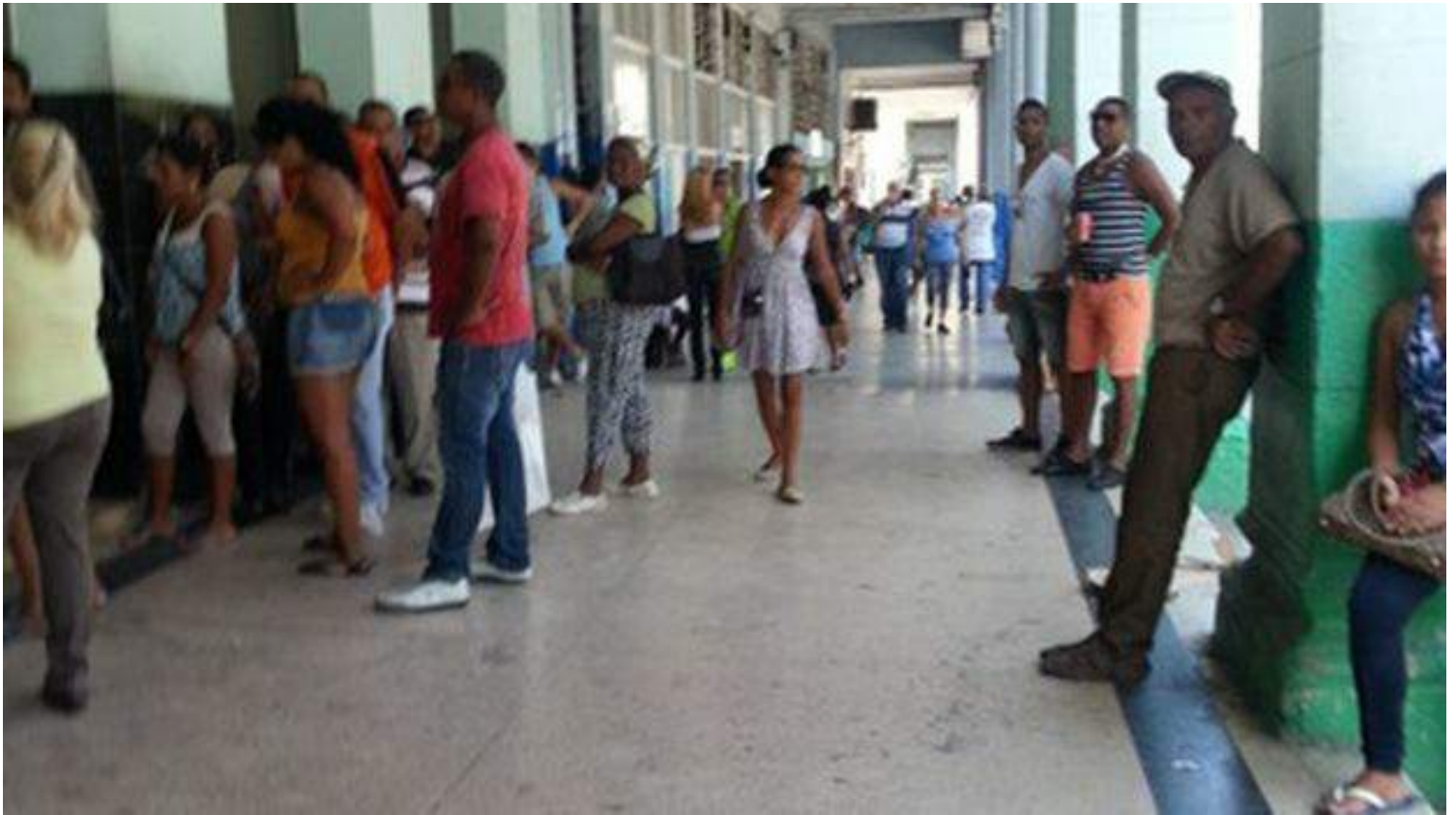
Colasen las afueras del Banco Metropolitano de la Calle Galiano en La Habana.