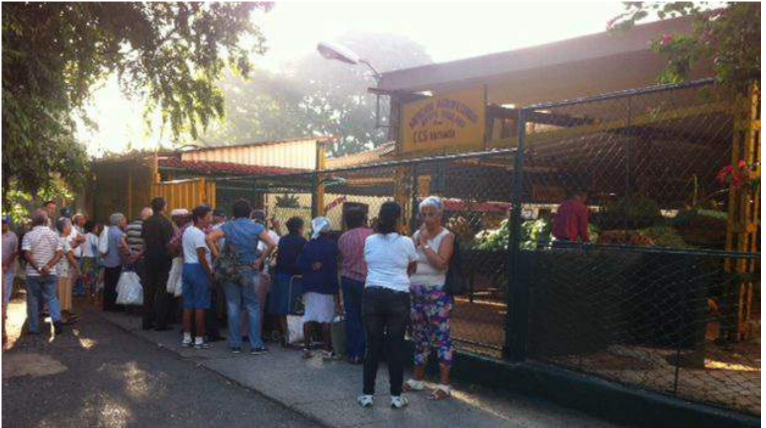
A las afueras del Mercado de la Calle Tulipán, muchos vecinos esperaban su reapertura esta mañana