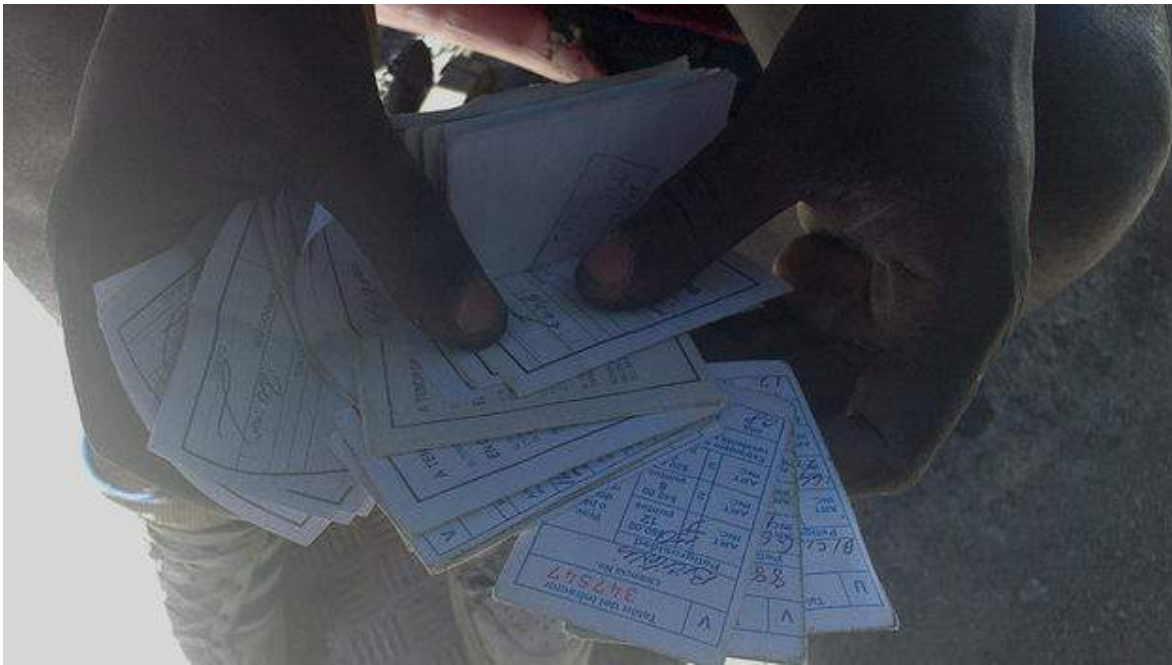
La "colección" de multas que le han impuesto al Conde Black

Los llamados "trabajadores por cuenta propia" de alguna forma representan el embrión de la pequeña empresa. Son sus propios empleadores e invierten en su trabajo sus pocas ganancias. "Nosotros no tenemos tiendas que nos vendan las gomas a precios más bajos. Tenemos que resolverlo todo por la izquierda porque aquí no venden nada, todo es inventado por nosotros", aseguran algunos bicitaxistas de la calle Zanja.