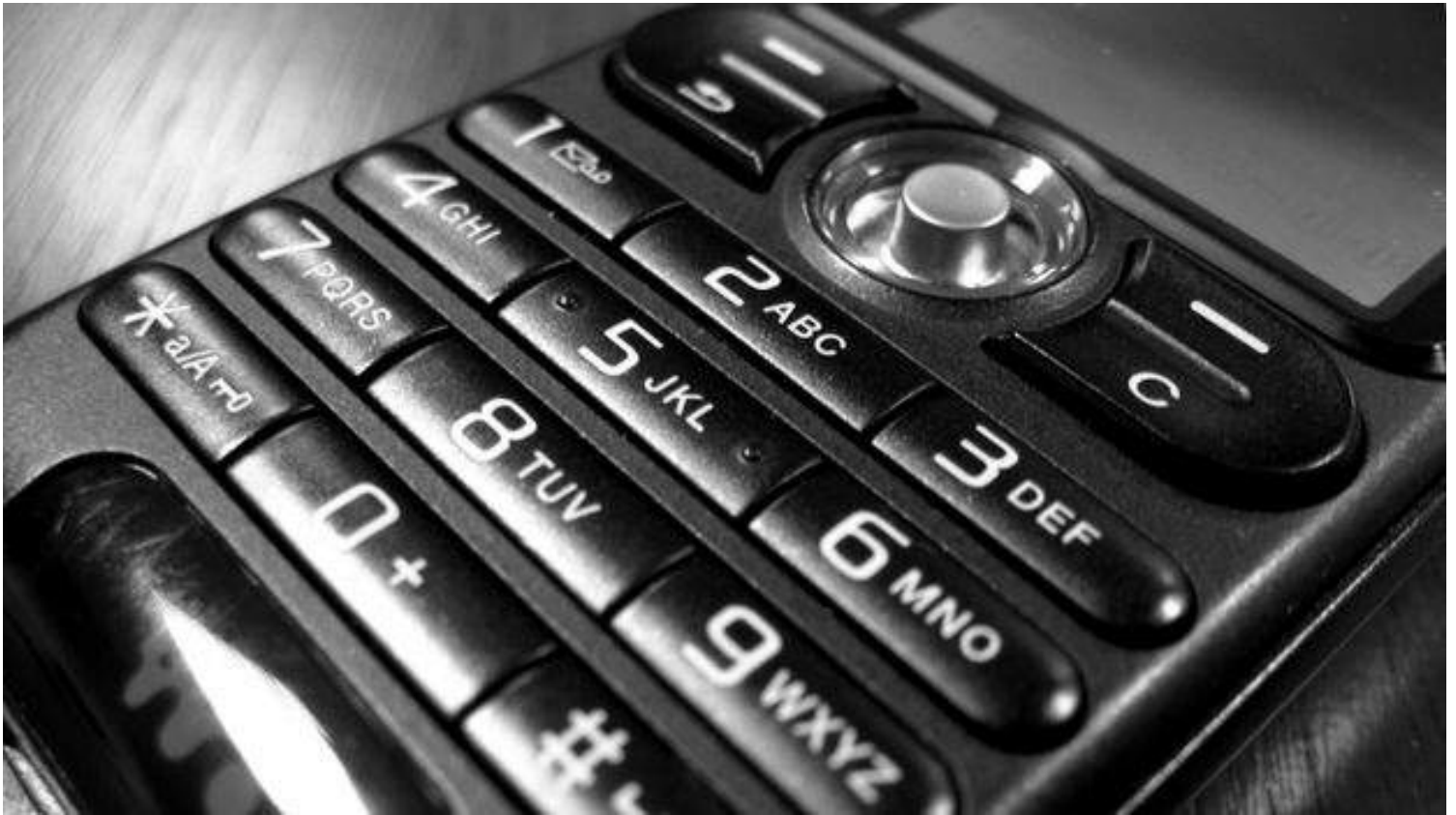
Teléfono móvil (CC)