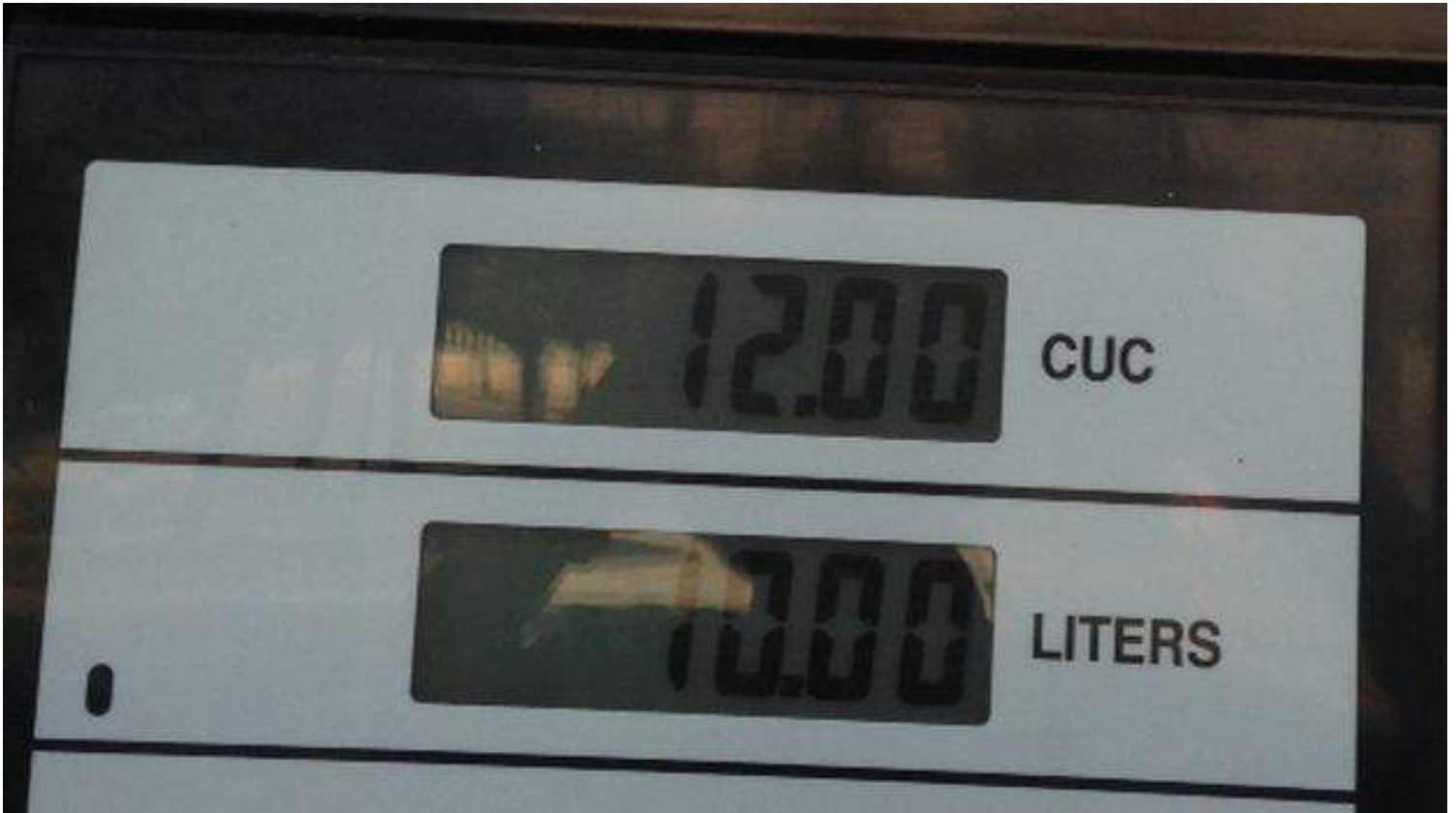
Precios de la gasolina regular 1.20 CUC el litro