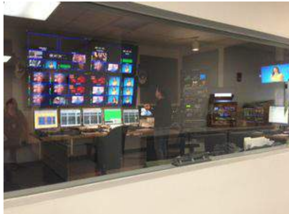
Estudios de 'MegaTv' en Miami.

P. Cuando haces entrevistas a disidentes cubanos y les preguntas sobre problemas internos frente a las cámaras. ¿Tienes un dilema entre darle armas al gobierno, o no tocar esos temas delicados?