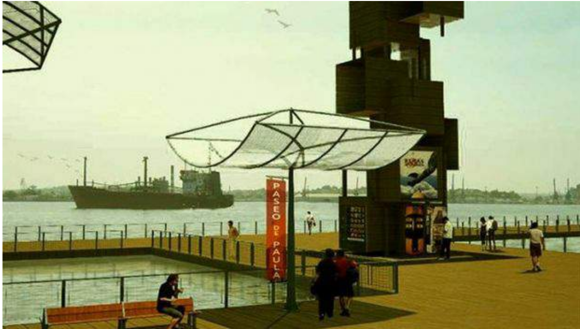
El proyecto del paseo marítimo flotante.

Dentro del perímetro en remodelación se encuentra también el edificio de la Aduana, el Emboque de Luz o el almacén de la madera y el tabaco, donde se inauguró desde marzo pasado una gran cervecería. Se espera que la revitalización de toda el área quede lista para la celebración del 500 aniversario de la fundación de la villa de San Cristóbal de La Habana en 2019, aunque ya en los próximos meses se inaugurarán algunos de sus tramos más importantes.