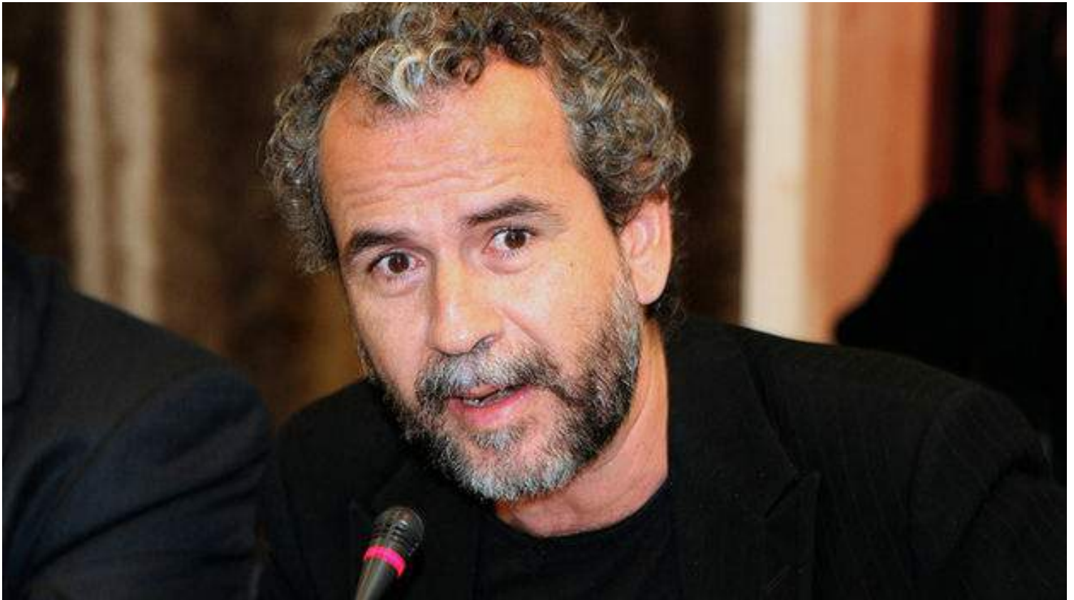
El actor y activista español Willy Toledo. (CC)