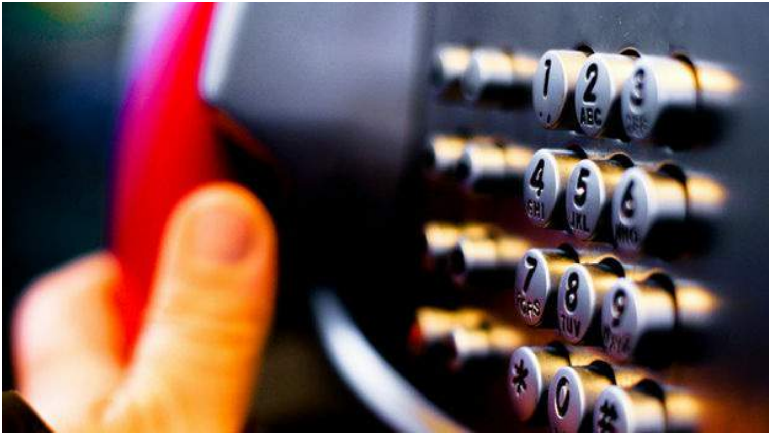
El teclado de un teléfono. (CC)