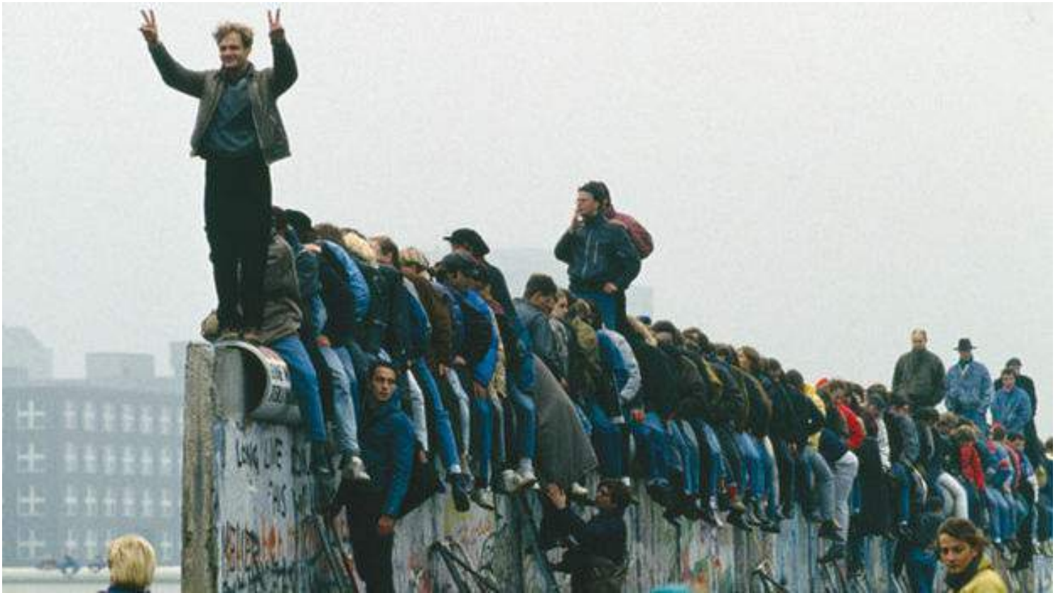
La caída del Muro de Berlín o el nacimiento de una nueva era