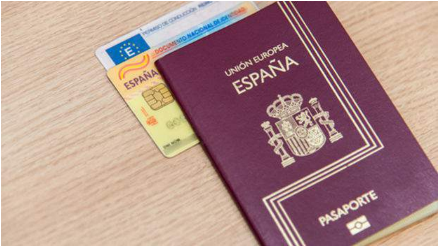
Pasaporte español (CC)