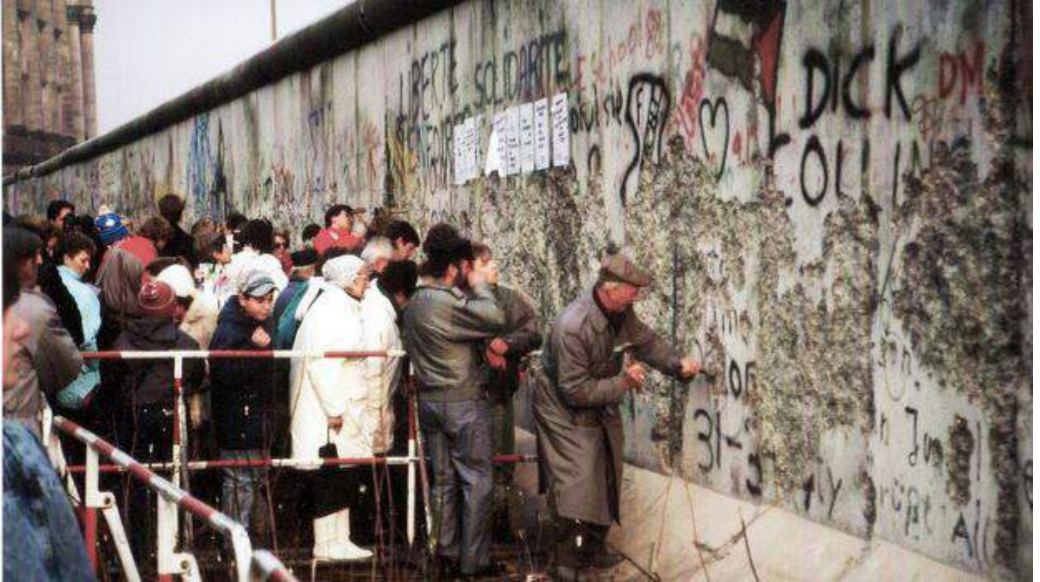
Los alemanes la emprenden contra el muro de Berlín, 1989 (CC)