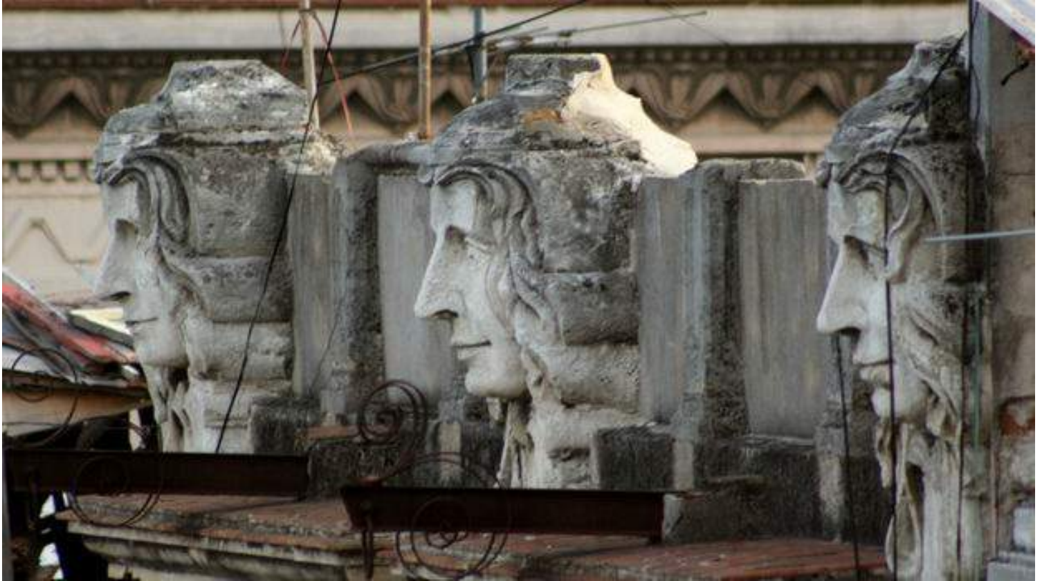
Detalles arquitectónicos de La Habana