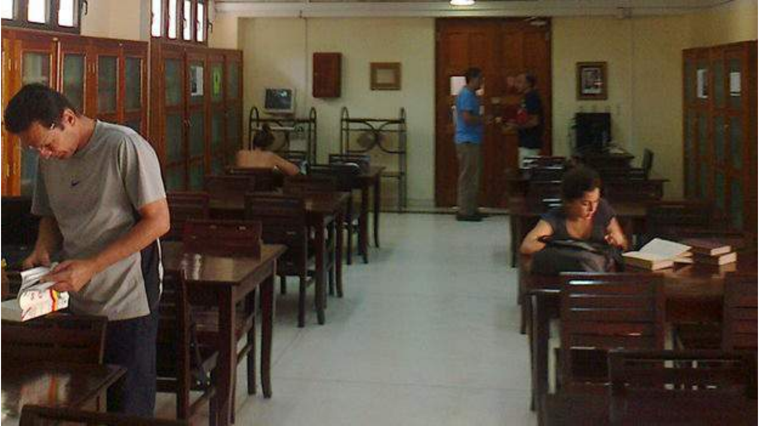
El interior de la Biblioteca Diocesana Manuel García-Garófalo en Santa Clara.