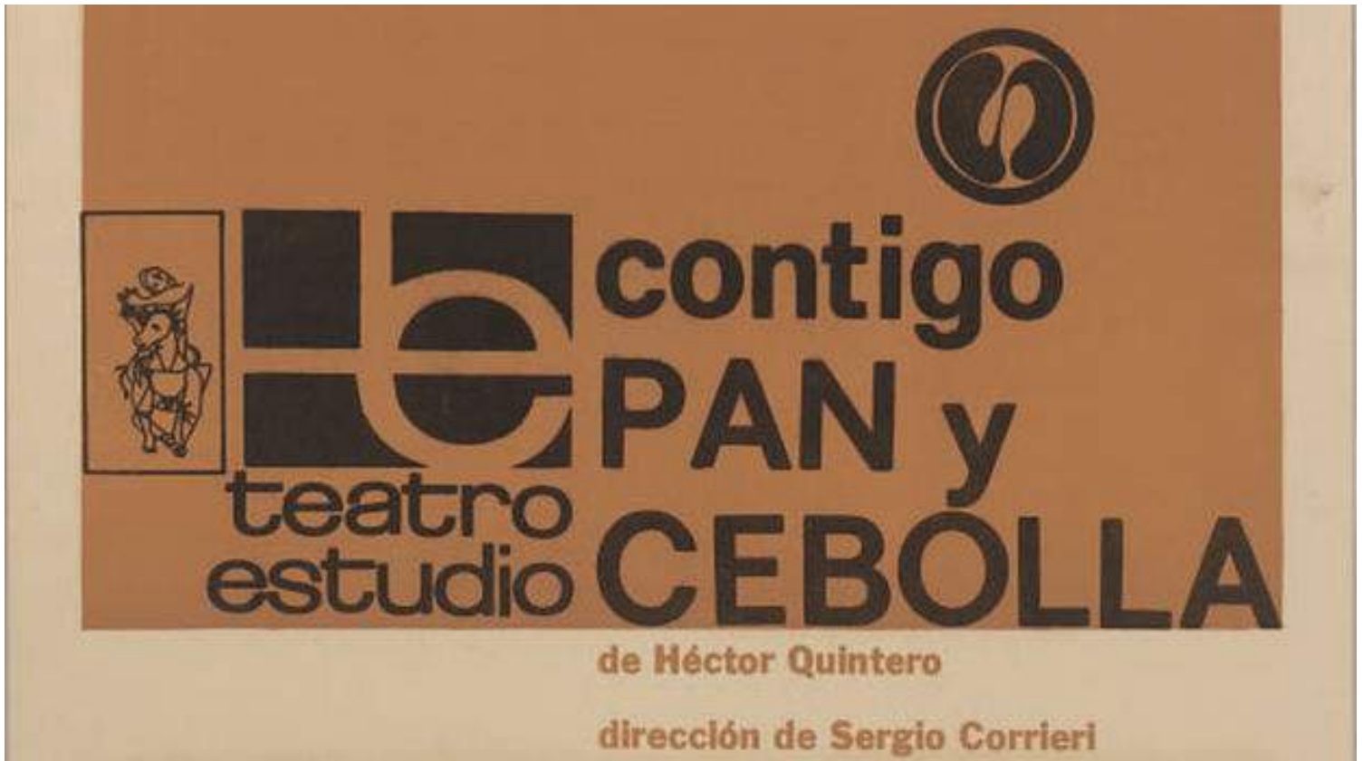
El folleto promocional de la obra de teatro 'Contigo pan y cebolla'.