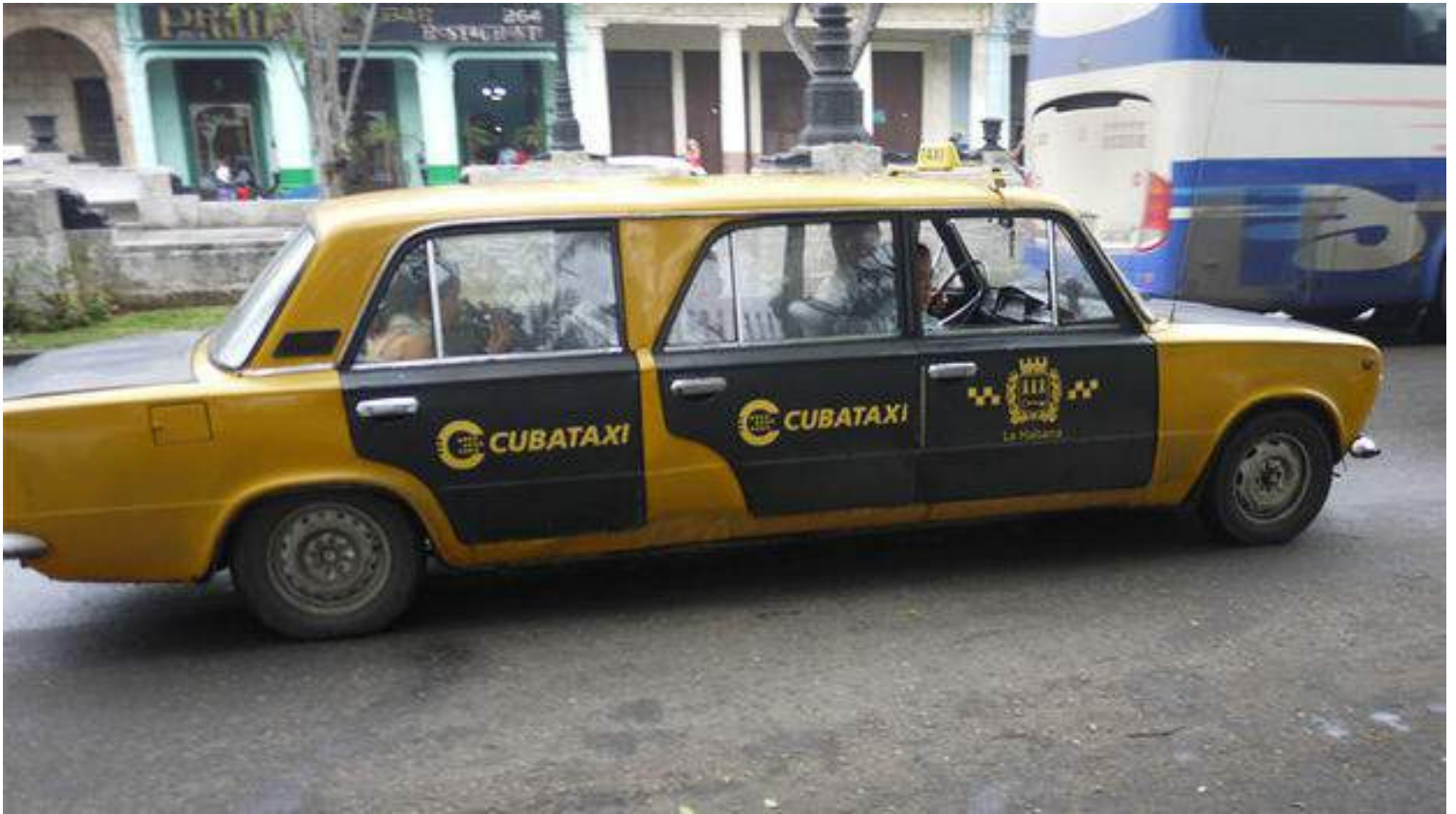
Una limusina Lada.