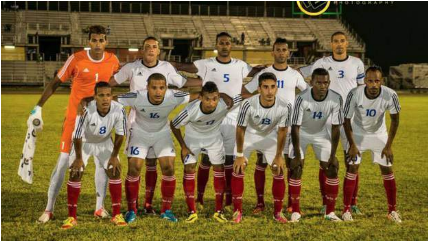
La selección cubana de fútbol.