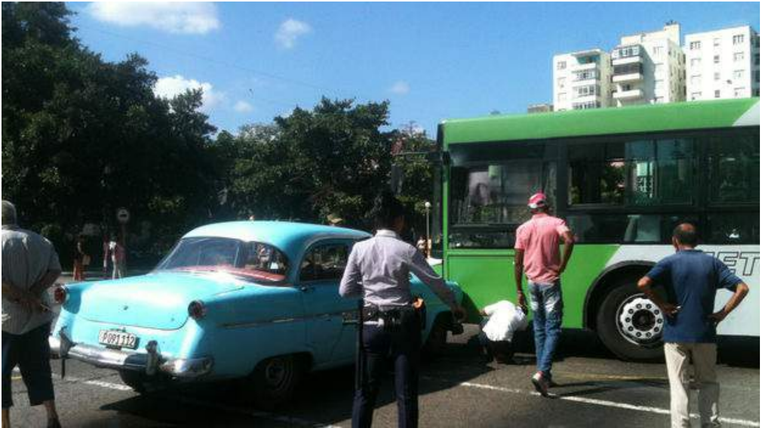
Accidente de tráfico. (LuzEscobar)