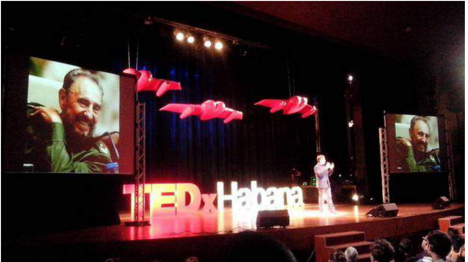
El evento TEDx en La Habana. (Víctor Ariel González)