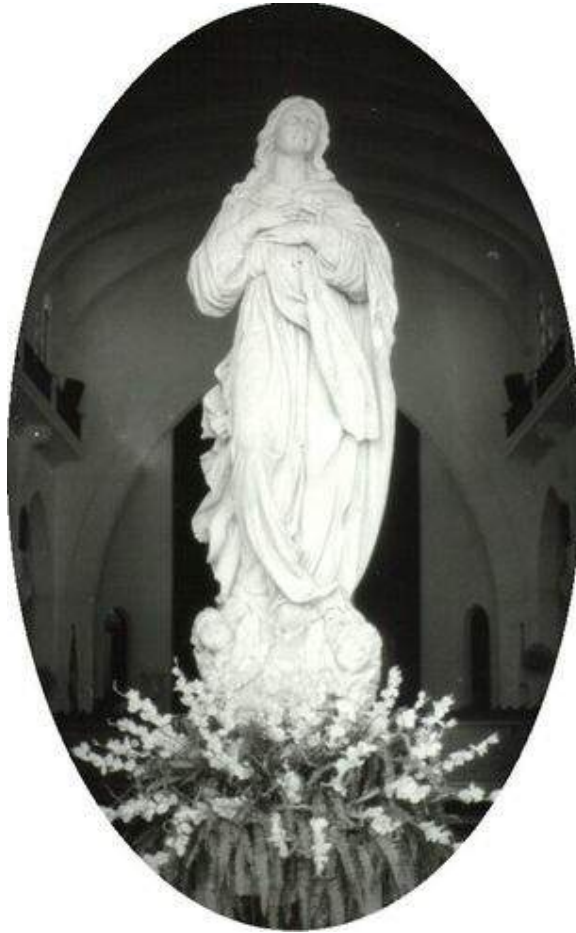
La talla de la Virgen de la Charca, hecha en mármol de Carrara

La pista de la Virgen de la Charca se pierde por años a partir de que los compañeros de la contrainteligencia militar le echaran de nuevo el guante. A principios de los años noventa, sin embargo, por la ciudad corría sottovoce el comentario de que estaba escondida en una unidad militar en la periferia de Santa Clara. Fue entonces cuando una dama, que ha preferido hasta ahora el anonimato, pero que algún día merecerá el homenaje público de sus conciudadanos, se atrevió a hacer gestiones para su devolución ante un joven político, el cual, en un gesto no muy común entre sus congéneres, puso en riesgo un promisorio futuro e hizo lo propio ante un Poder Central tan antirreligioso y poco dado a ceder como siempre.