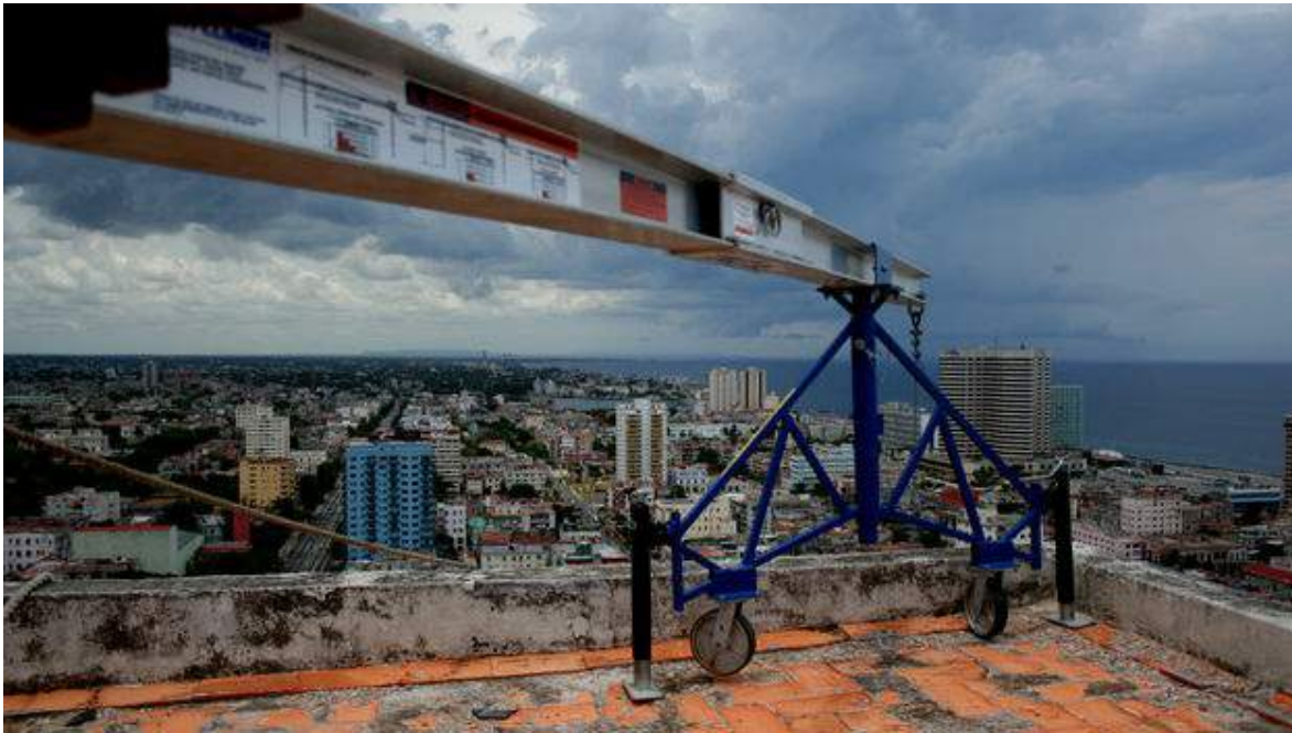
Parte de La Habana vista desde una azotea

Cuando se entregue un inmueble en propiedad, mediante venta, aparte del cumplimiento de las regulaciones urbanísticas establecidas, deberán agregarse las exigencias de tipo arquitectónico, artísticas y otras, con el objetivo de, independientemente del uso al que se destine, mantener su valor patrimonial en caso de que lo posea.