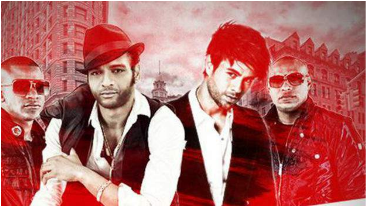
Bailando, tema musical que se ha alzado con tres Grammy Latinos