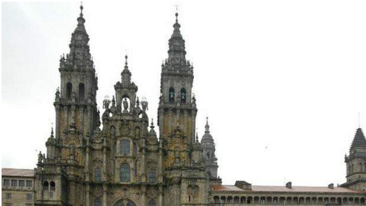
Catedral de Santiago de Compostela

Pero ocurre aquí dentro el milagro mayor: un sacerdote comienza a dar cuenta de los que hemos llegado hoy. Por cientos se enumeran los que vienen de todas las latitudes españolas y extranjeras. A nadie sorprende nada; sin embargo, un murmullo se levanta en la iglesia y un jolgorio, entre los quince hermanos que he hecho en el camino cuando allí, entre la humareda de incienso, dicen: ¡Ha llegado uno de Cuba! Entonces ningún llanto es más copioso que este.