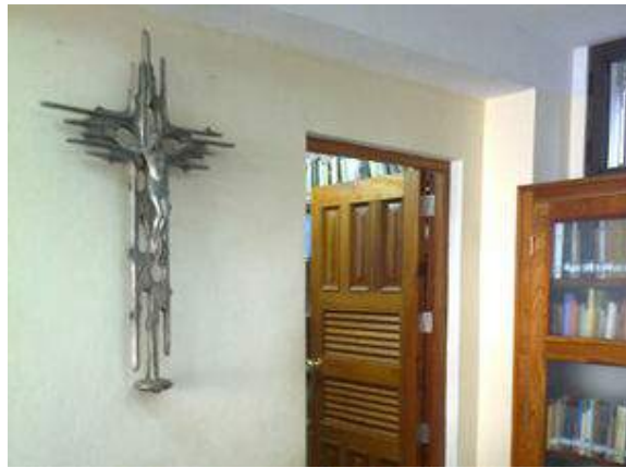
Su fondo de libros "Raros y valiosos" incluye más de 500 ejemplares de los siglos XVI, XVII, XVIII, XIX y principios del XX

Esta biblioteca cuenta, en la actualidad, con más de 22.000 títulos al acceso de público. Pero además, poco más de otros 12.000 libros están pendientes de ser clasificados y ubicados. La razón fundamental, la falta de espacio físico, está en camino de solucionarse con labores de ensanchamiento y posible apertura de nuevas salas de lectura especializada.