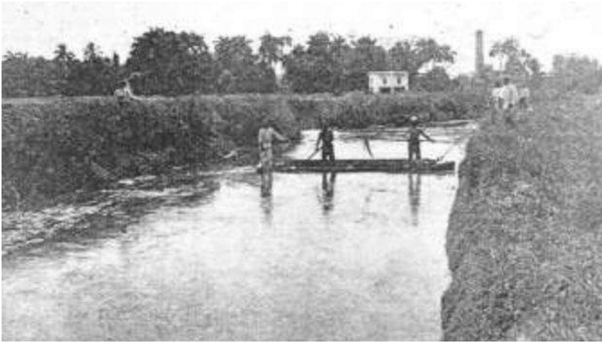
Canal de la Zanja, imagen de archivo

El premio de consolación fue el surgimiento del Parque Metropolitano de La Habana, 700 hectáreas de vegetación que cubren desde las inmediaciones del río Almendares en la calle 100 hasta la desembocadura del río. Entre los objetivos del Parque, se enunciaba preservar el área como pulmón de la ciudad, sanear el río, hacer sustentables los asentamientos humanos localizados en su perímetro y buscar financiamiento mediante un turismo ecológico. Todo hacía indicar que se cumpliría el legado del arquitecto francés Jean Claude Nicolas Forestier, quien en 1930 diseñó un proyecto para proveer a nuestra ciudad de un gran parque. Pero con la crisis económica conocida en Cuba como Período Especial, la ambición del proyecto se desinfló.