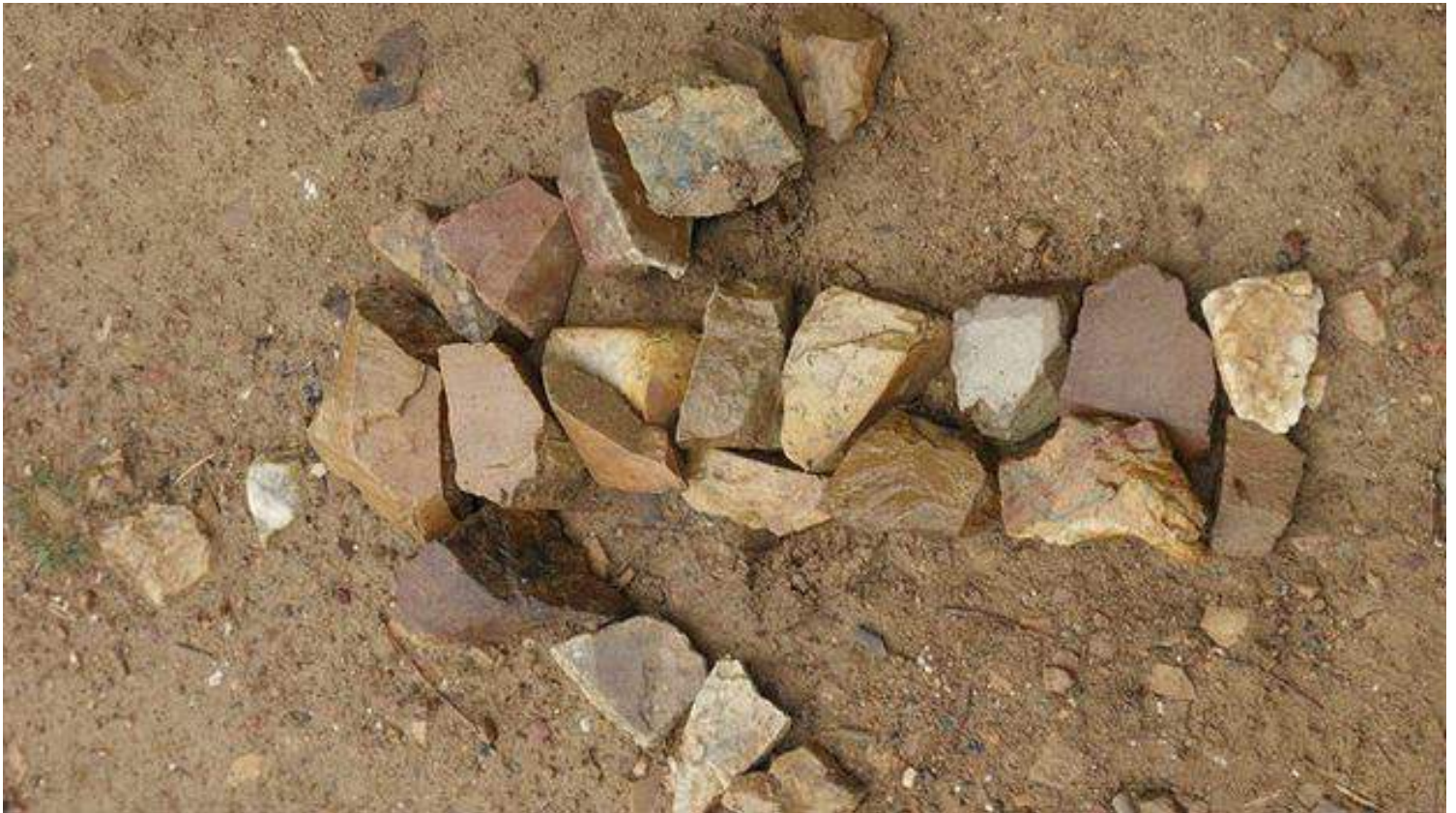
Una de las tantas flechas que le indican a los peregrinos el Camino de Santiago