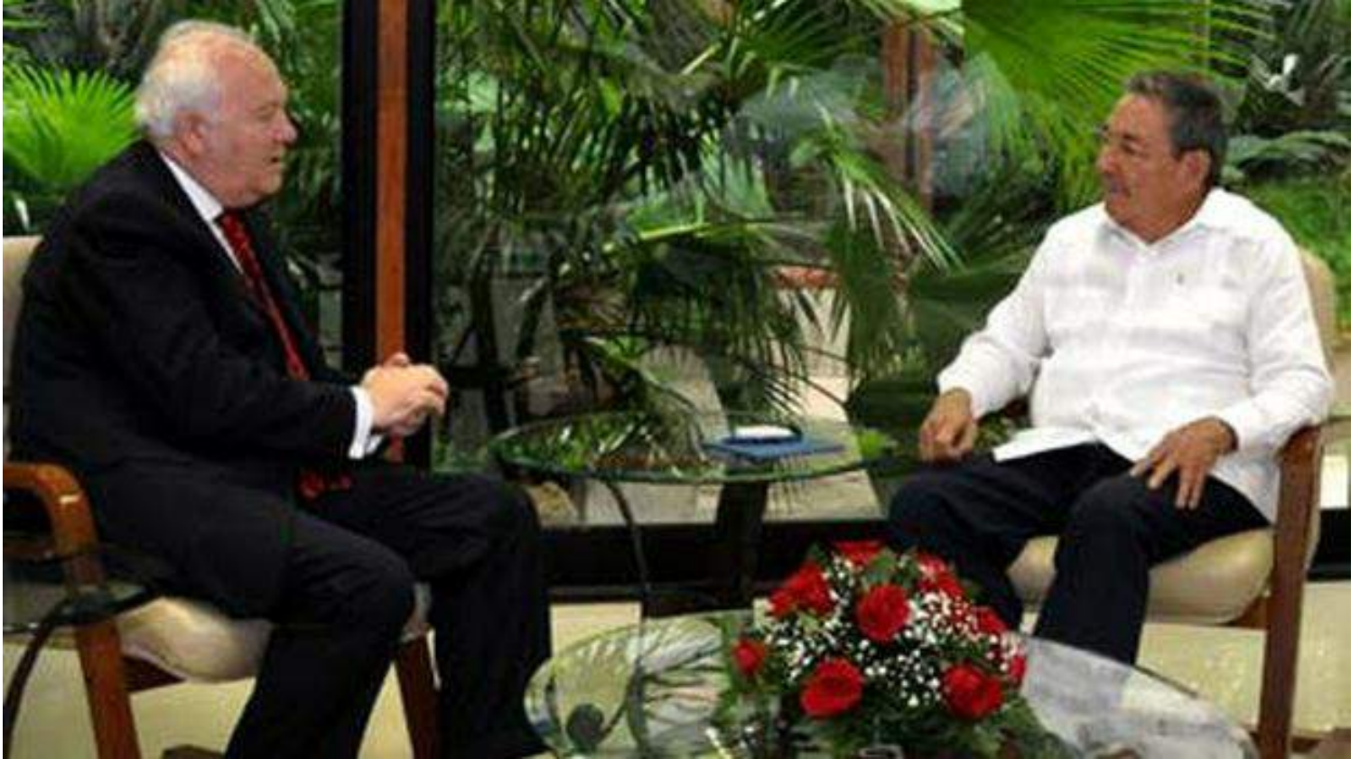
El último viaje a Cuba del ministro de Exteriores español, Miguel Ángel Moratinos, en 2010.