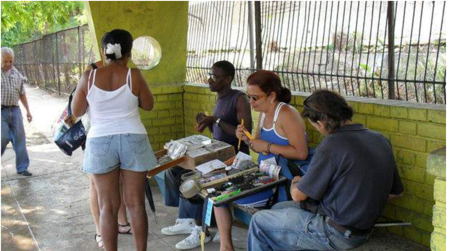
Vendedores en una parada de ómnibus en La Habana.