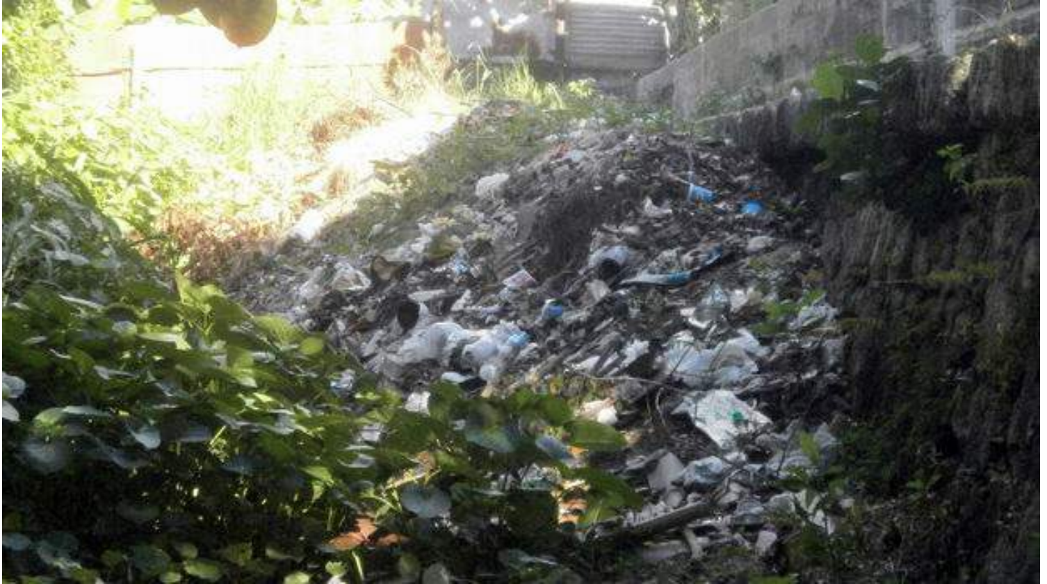
Vertedero a la salida del canal