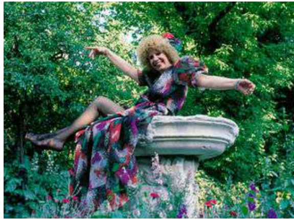
Una imagen de la duquesa de joven.

Ahijada de Alfonso XIII, leal sin fisuras a Juan Carlos I y "encantada" con su heredero, el rey Felipe VI, Cayetana de Alba, siempre se declaró monárquica, aunque nunca tuvo reparos en confesar que en algún momento fue votante socialista. "Felipe González es un hombre muy importante y muy amigo mío", reconocía Cayetana de Alba. Era a comienzos de los años ochenta del siglo pasado, cuando un joven abogado sevillano, Felipe González, se convertía en presidente del Gobierno de España, tras ganar unas elecciones generales en las que la duquesa de Alba, mujer de carácter y con criterio, no dudó en votar por el cambio, en votar socialista, como ella misma se encargó de proclamar públicamente.