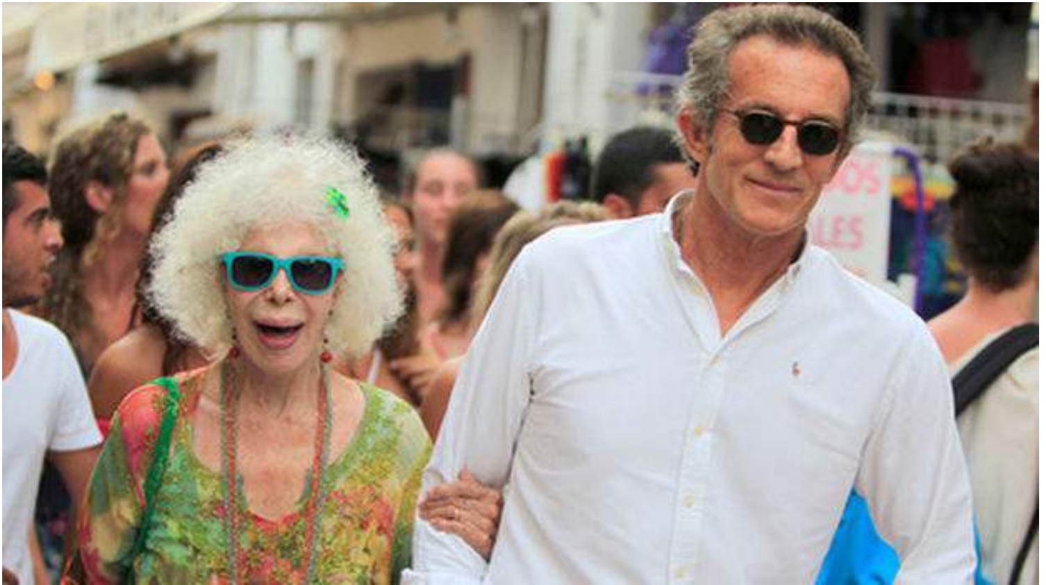
Cayetana de Alba con su marido, Alfonso Díez