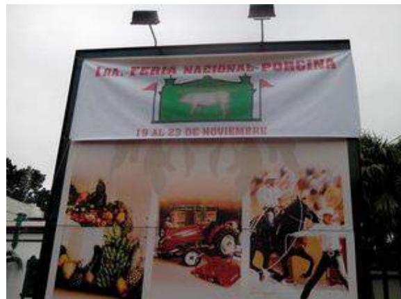
Cartel en la entrada de la Feria porcina

Todos los asistentes, tanto el público como los participantes del evento, son cubanos. Aunque la feria está contemplada dentro de la llamada cartera de inversiones de la reciente Ley de Inversión Extranjera, no se ha visto un solo visitante de otro país.