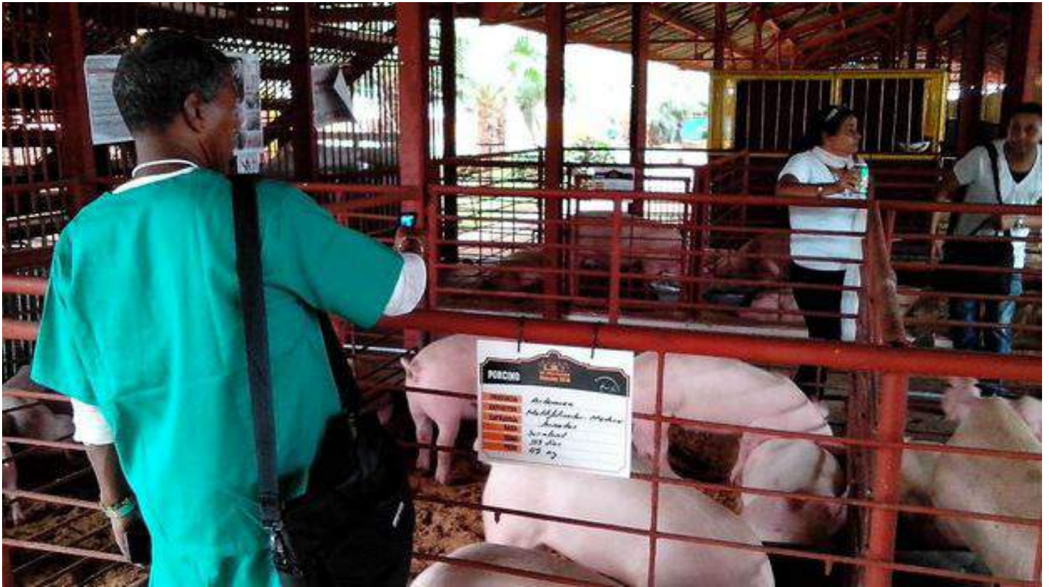
Un productor toma una foto en la Feria Nacional Porcina.