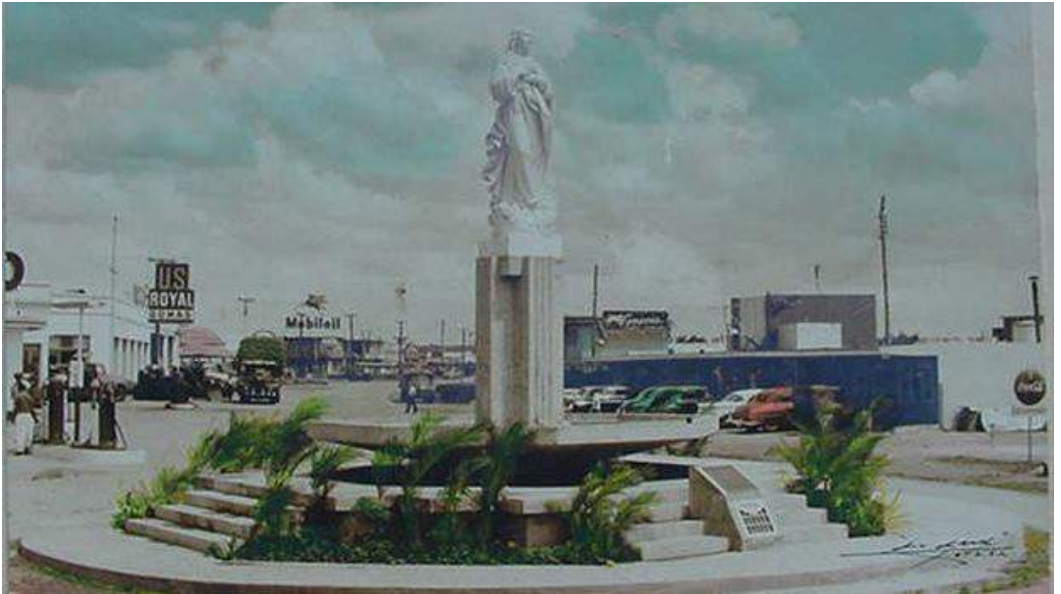
La Virgen de la Charca en una imagen de época