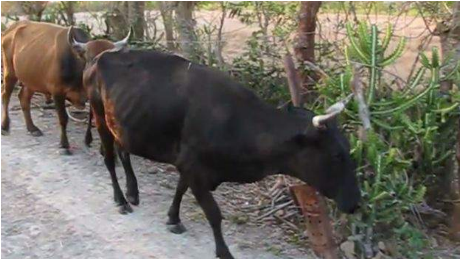
Vacas en Cuba (CC)