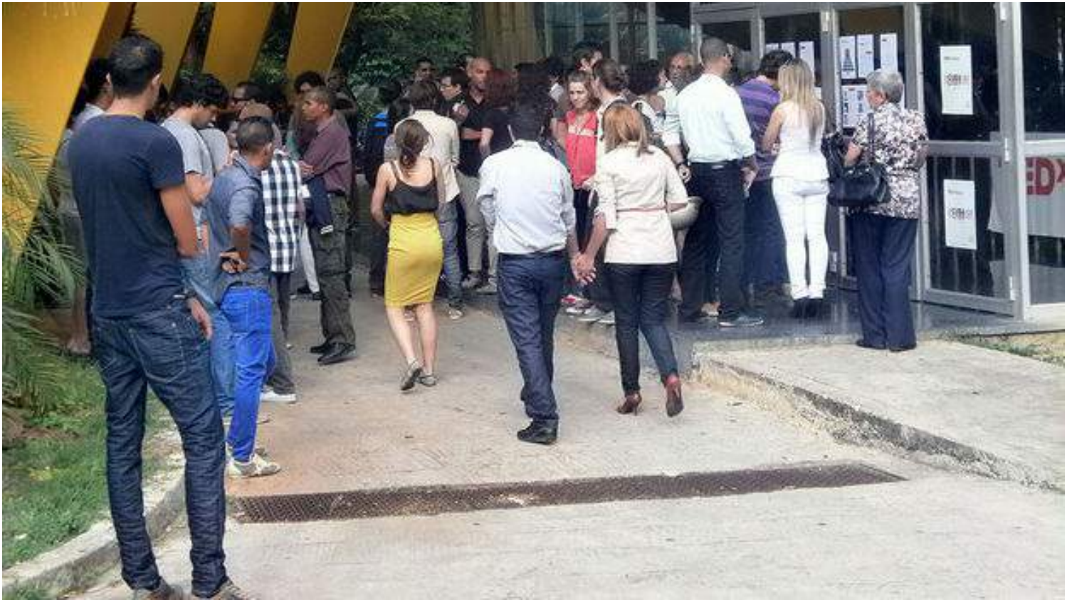
A la entrada de la Sala Covarrubias del teatro Nacional, para entrar al TEDx Habana