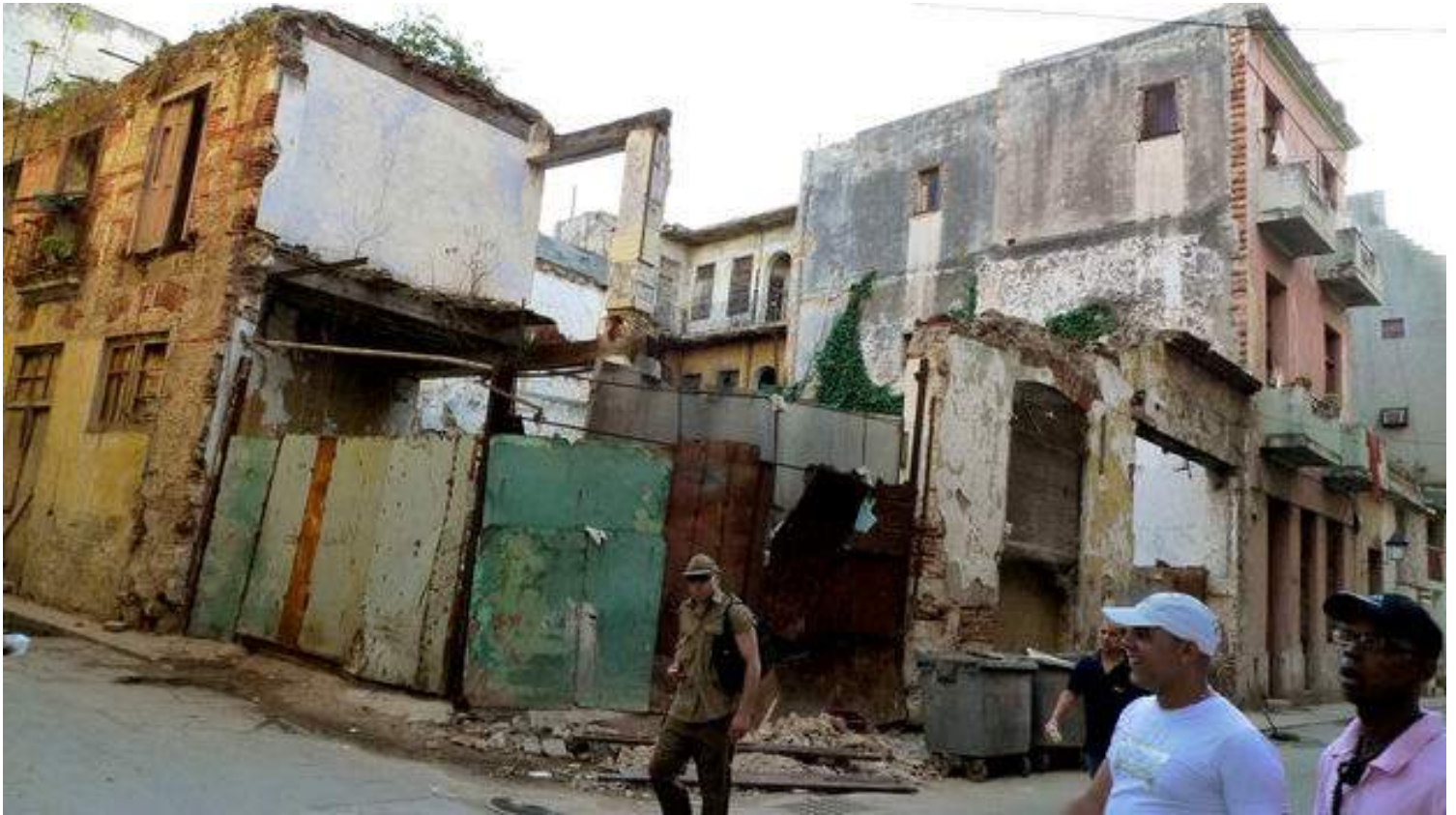
Derrumbe en La Habana