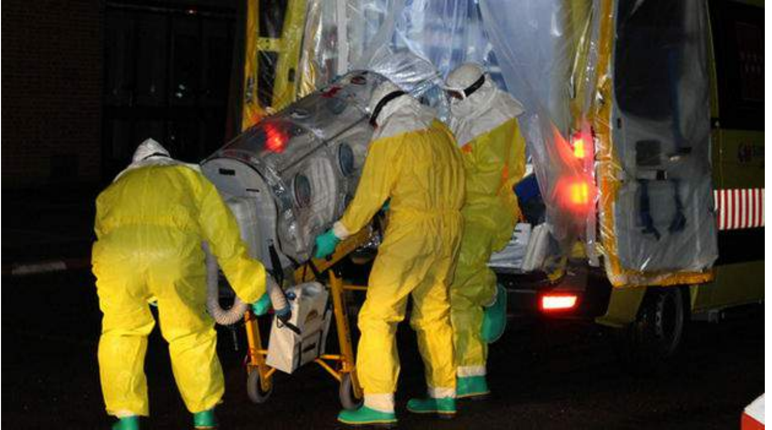
Repatriación el pasado septiembre de un religioso enfermo de ébola a España. (Hospital de La Paz)