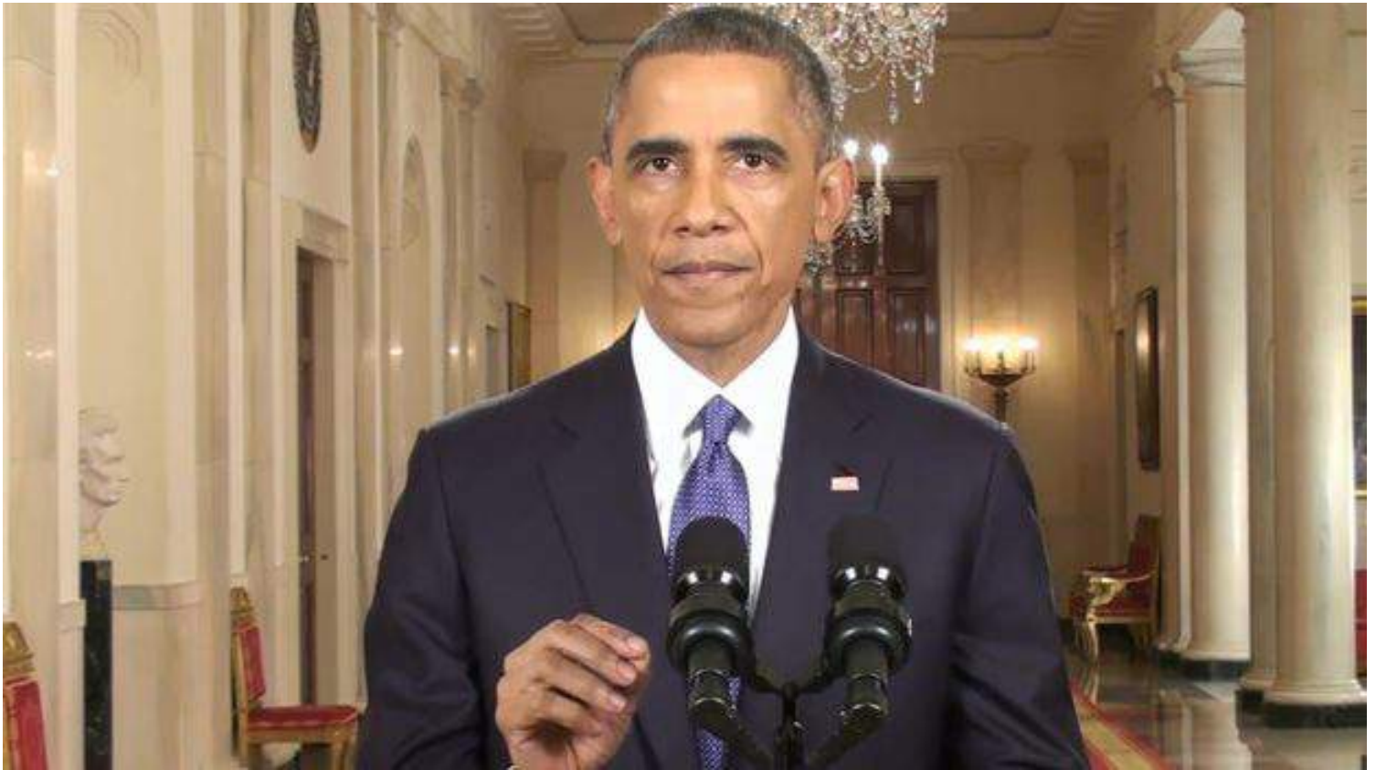
Barack Obama durante su alocución desde la Casa Blanca