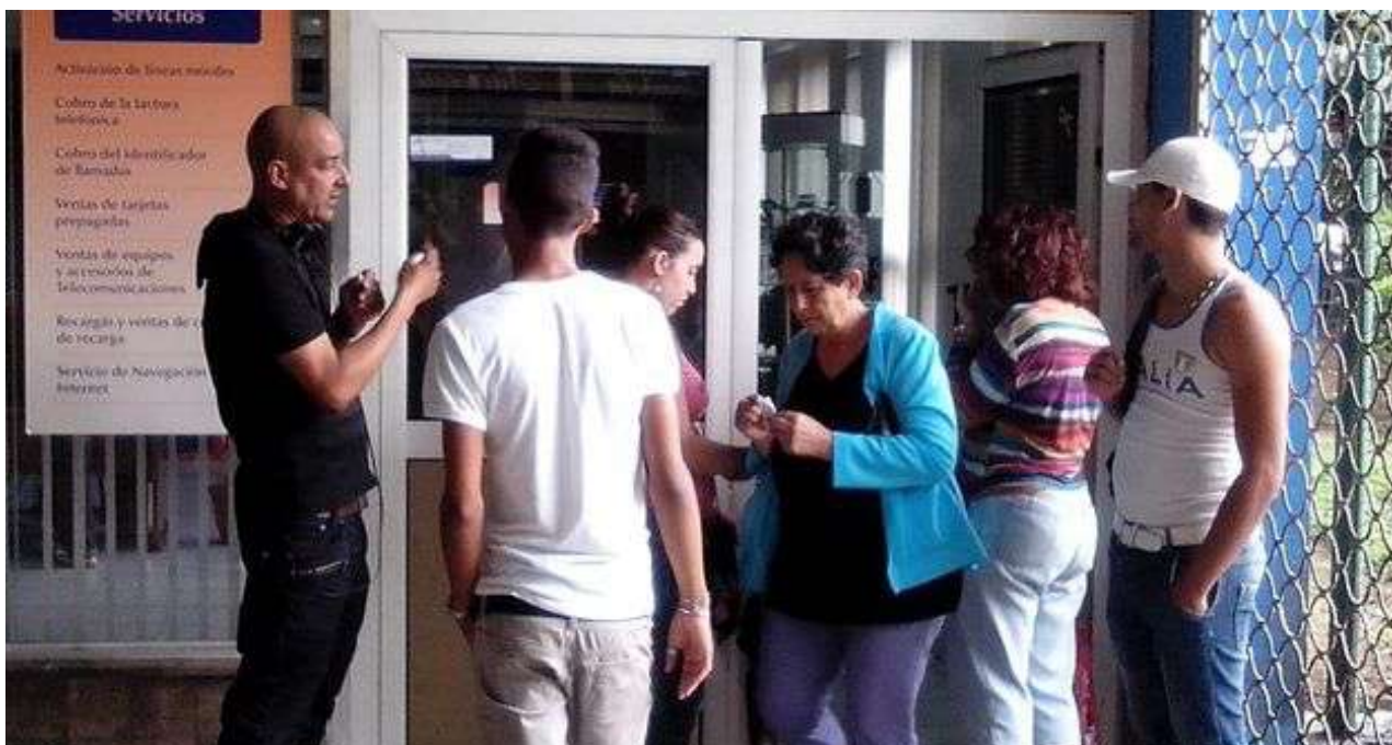
El monopolio estatal vuelve a ser blanco de quejas respecto a la brevedad y limitación del paquete llamado 'Bonifica tu recarga con minutos y SMS'. (14ymedio)

En estos momentos Costa Rica está estudiando la posibilidad de reactivar las deportaciones de cubanos hacia su país de origen, suspendidas desde 2016 como consecuencia de un fallo de la Sala Constitucional.