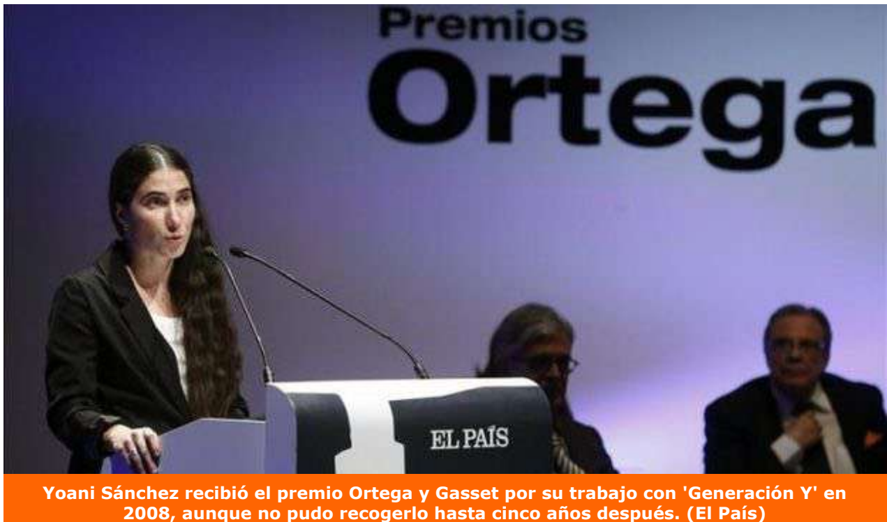
Yoani Sánchez recibió el premio Ortega y Gasset por su trabajo con 'Generación Y' en 2008, aunque no pudo recogerlo hasta cinco años después.