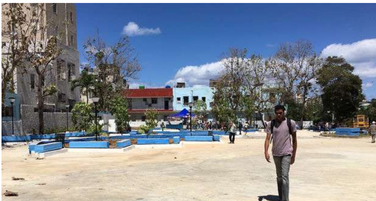
La inauguración de una zona wifi para el acceso a internet busca revitalizar el local gastronómico. (14ymedio)