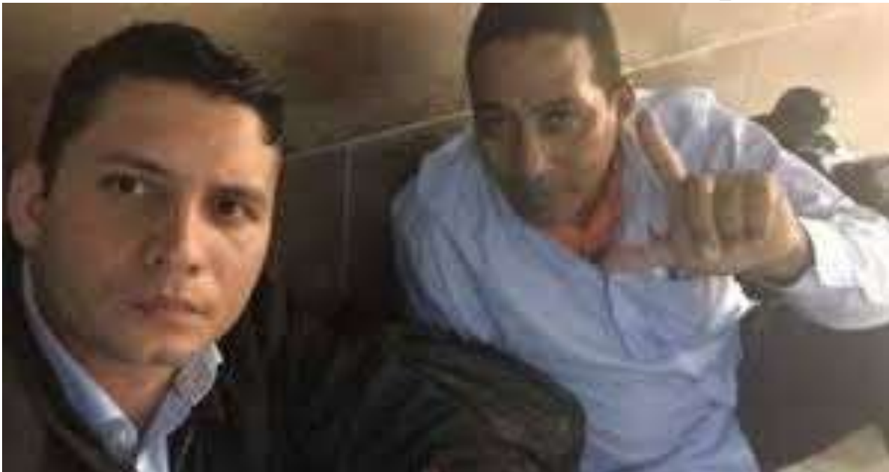
Protesta de Somos+ en el Aeropuerto Internacional José Martí, La Habana.