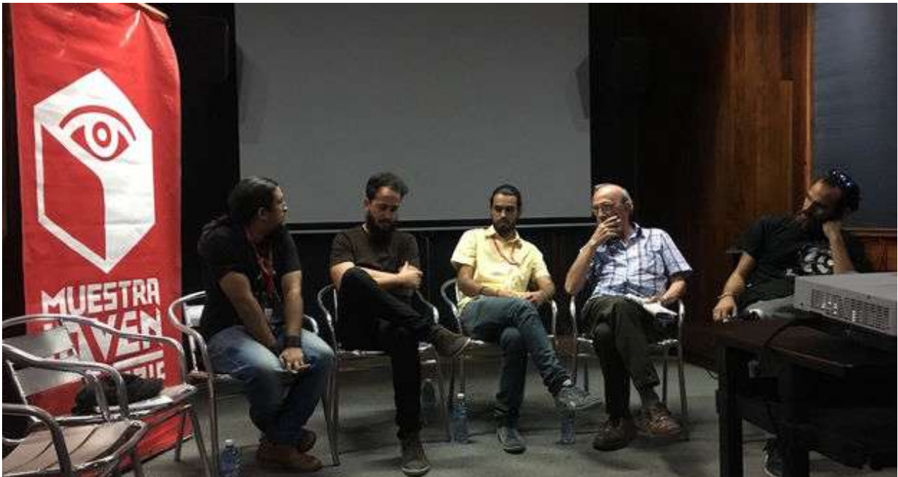
Jóvenes directores presentan sus muestras en la sección 'Moviendo Ideas' de la 16 Muestra Joven del ICAIC, en La Habana.