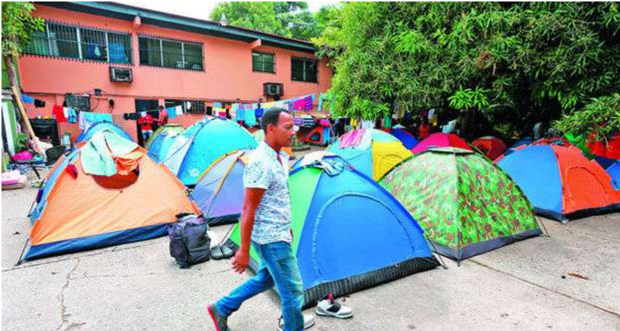
Cientos de cubanos pernoctan en carpas a las afueras de las instalaciones de Cáritas Panamá que apenas dan abasto para acoger a los varados.