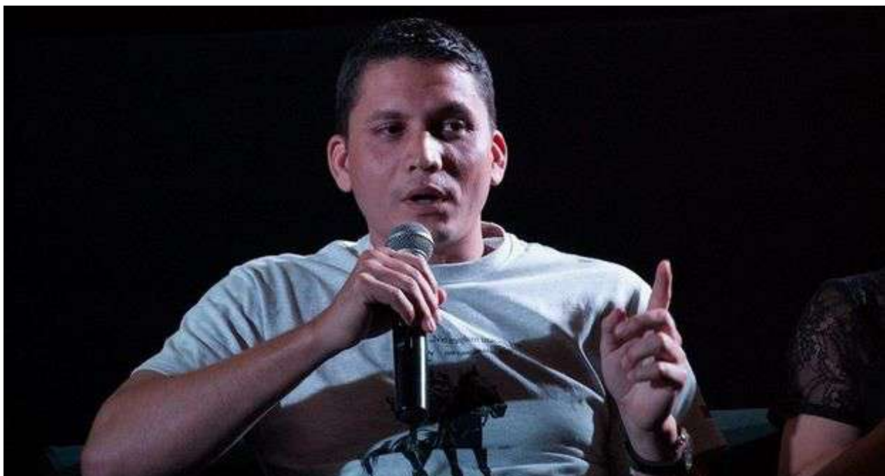
Eliécer Ávila, líder del Movimiento Somos+. (CC)