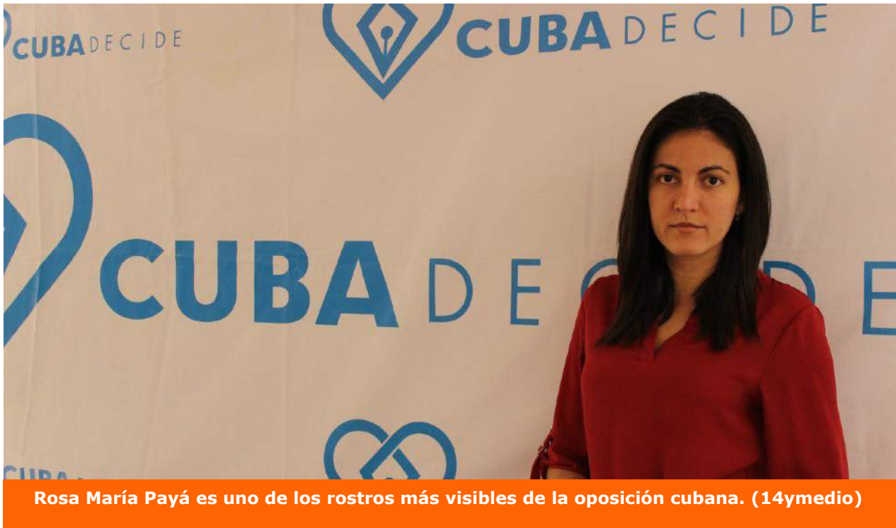
Rosa María Payá es uno de los rostros más visibles de la oposición cubana.