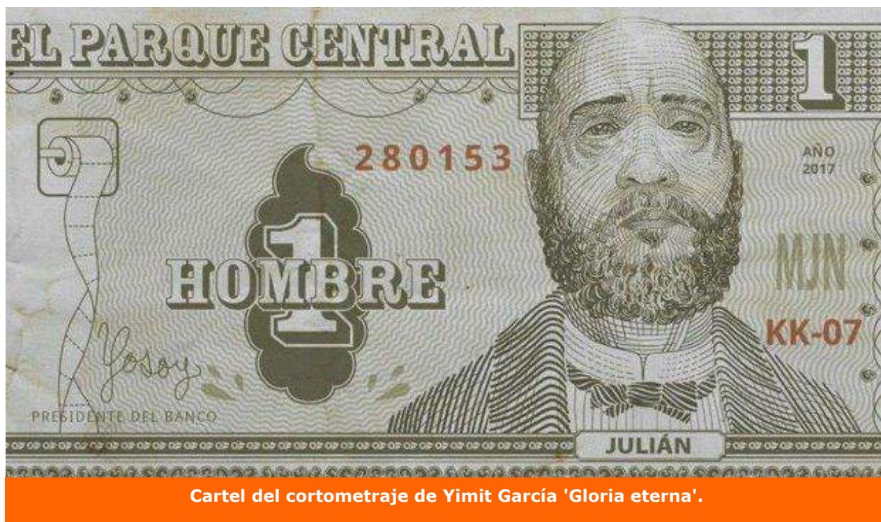
Cartel del cortometraje de Yimit García 'Gloria eterna'.