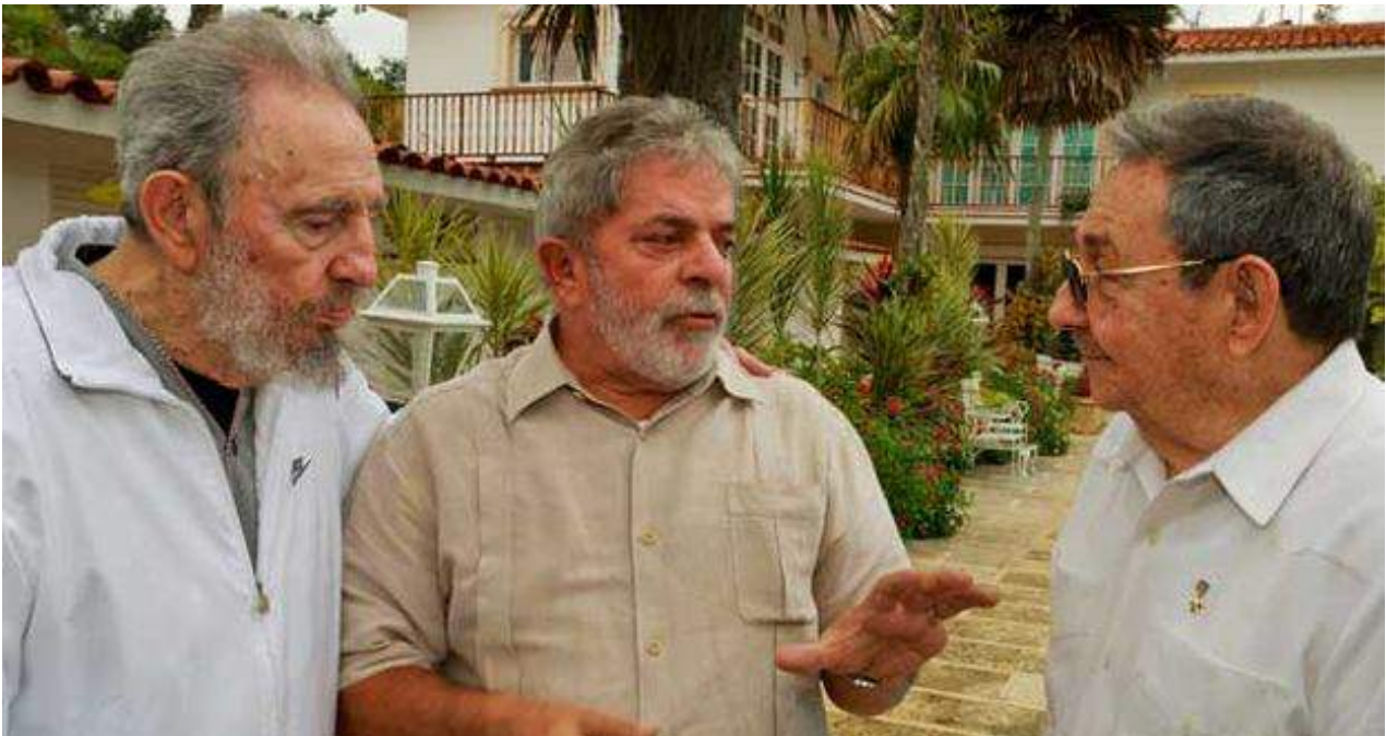
Los hermanos Raúl y Fidel Castro junto a Lula en 2010, cuando el expresidente brasileño visitó la Isla coincidiendo con la muerte de Orlando Zapata Tamayo.