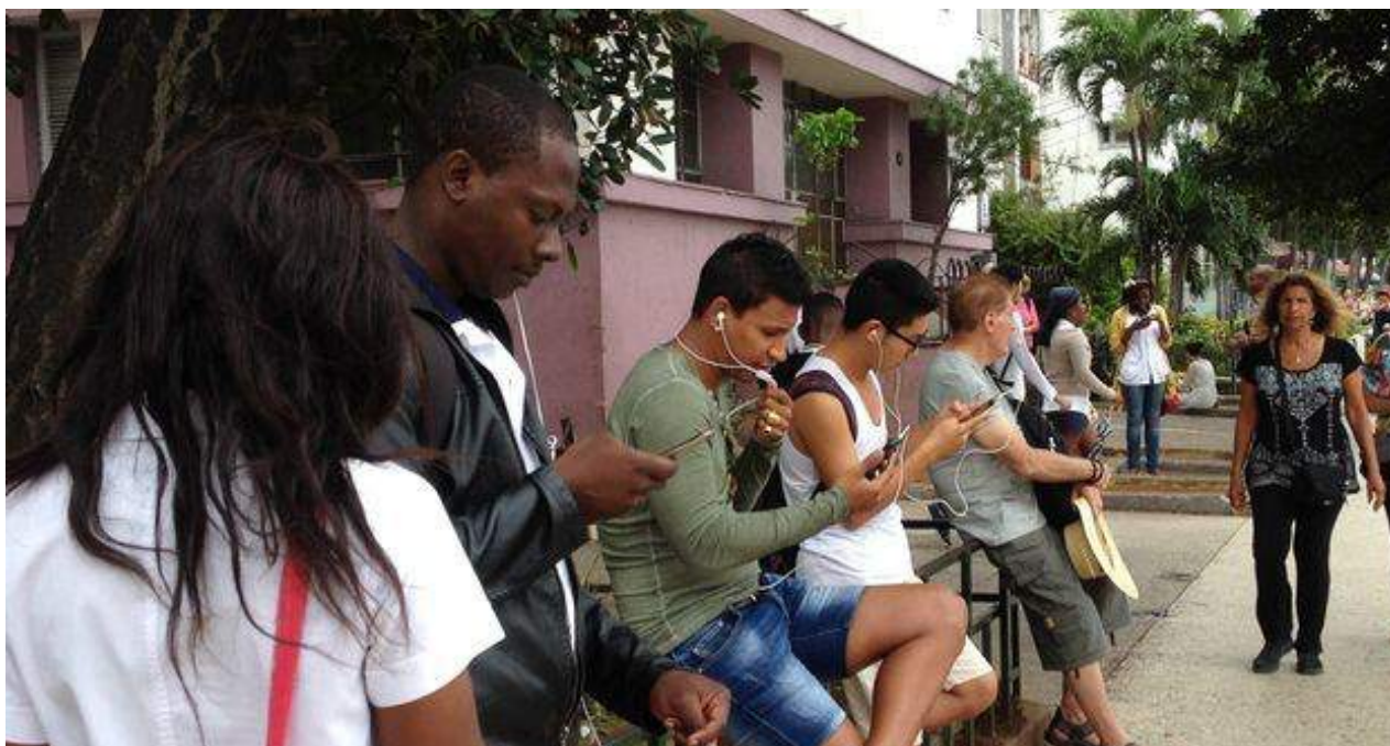
Jóvenes utilizan sus teléfonos celulares para conectarse a la red wifi en La Habana.