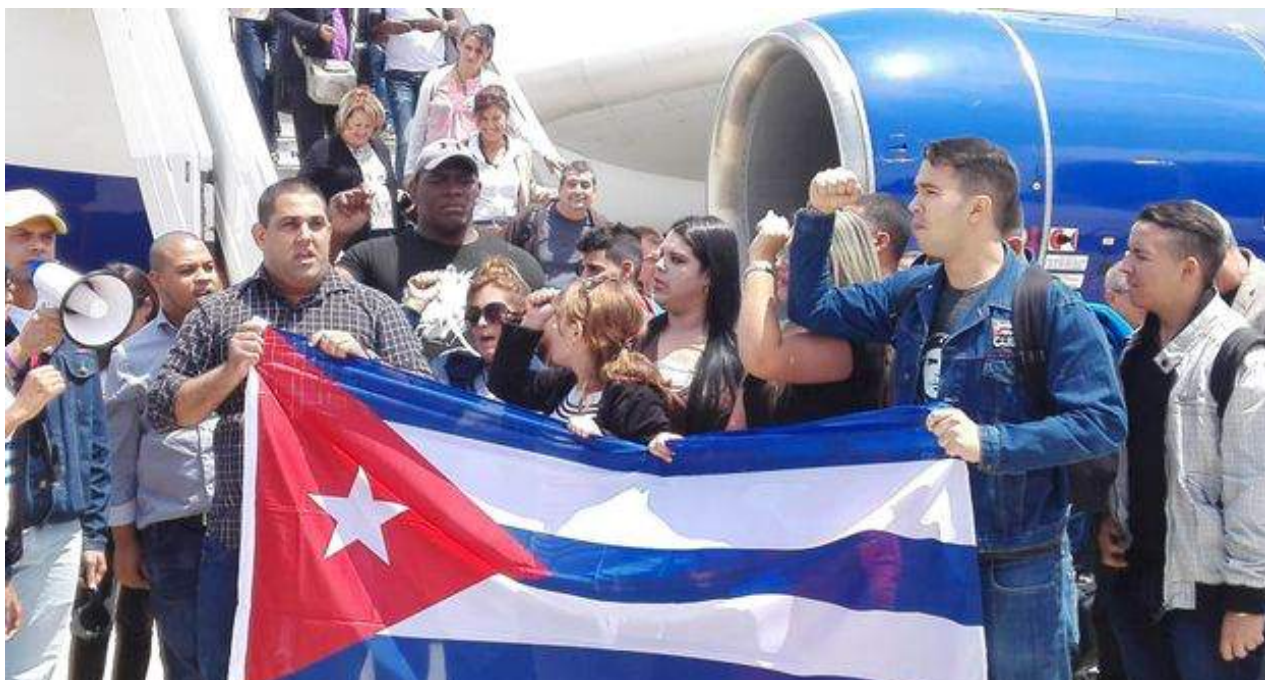
La delegación oficialista representa, según la prensa oficial, a la verdadera sociedad civil de Cuba.