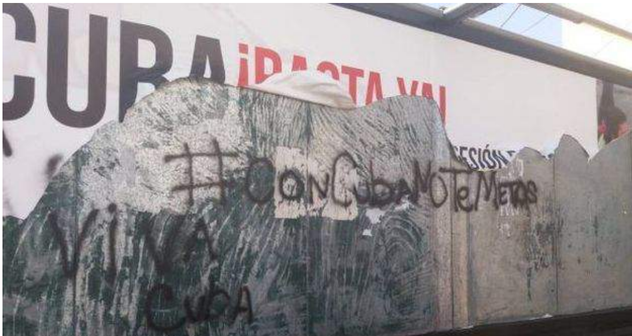
Así quedó el cartel después de ser destrozado en Perú.