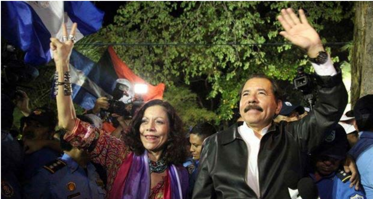
Daniel Ortega y Rosario Murillo forman tándem en la candidatura a la presidencia de Nicaragua.