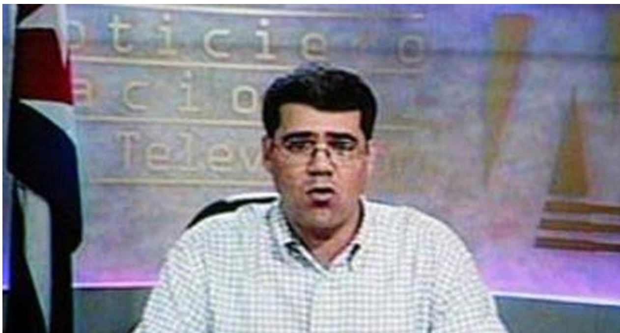
Carlos Valenciaga lee la Proclama en la televisión nacional.