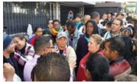
MÉXICO FRENA EL PASO DE CUBANOS