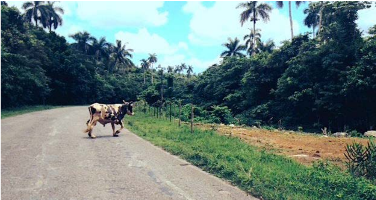
Animales en la vía.

R. No. Creo que los estudiantes de economía reciben muy buena educación, con manuales modernos. Lo desestimulante es que muchos profesores de alta calificación han salido de la Universidad de La Habana, entre ellos de la Facultad de Economía, por no estar estimulados o recibir pocos ingresos. Ya los alumnos no estudian por los libros de la época soviética, pero cuando se gradúan y se les pone a trabajar no siempre pueden aplicar los conocimientos adquiridos, por la elevada centralización en la toma de las decisiones en el país.