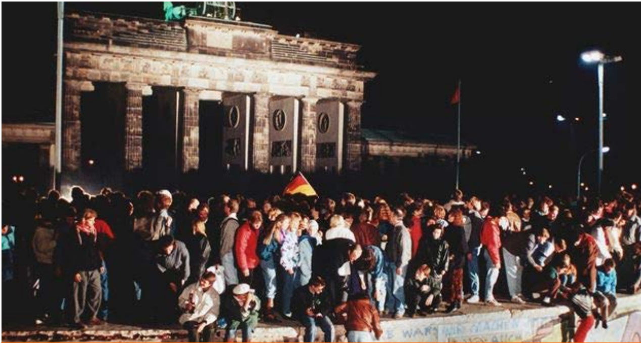
Caída del Muro de Berlín.