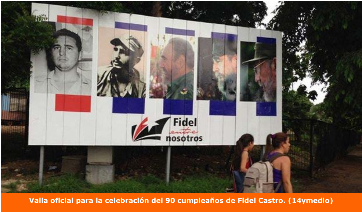
Valla oficial para la celebración del 90 cumpleaños de Fidel Castro. (14ymedio)