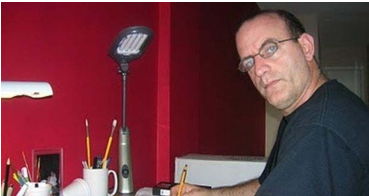
Gustavo Rodríguez, 'Garrincha'. (Cortesía)

Una selección con lo mejor de la semana del primer diario independiente hecho en Cuba