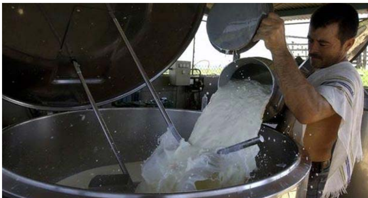
Fábrica de leche en Cuba.