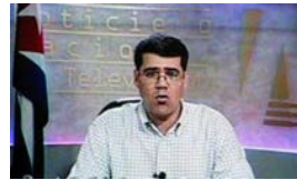
INCUMPLIMIENTOS DE FIDEL CASTRO