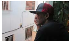
'CANDYMAN', LA LEYENDA