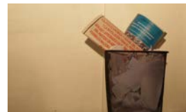
LOS NUEVOS LINEAMIENTOS