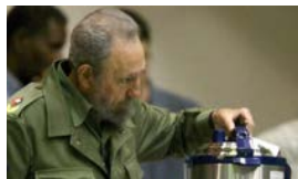
OLVIDAR A FIDEL CASTRO