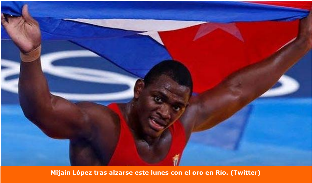
Mijaín López tras alzarse este lunes con el oro en Río.