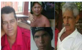
BALSEROS SIGUEN DESAPARECIDOS