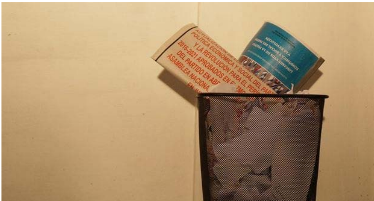
Lineamientos del VI Congreso del Partido Comunista.