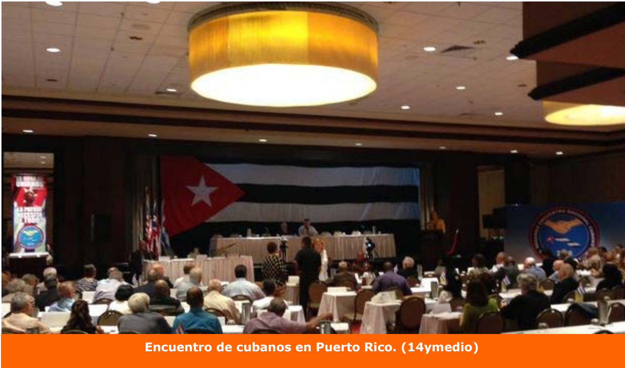
Encuentro de cubanos en Puerto Rico.