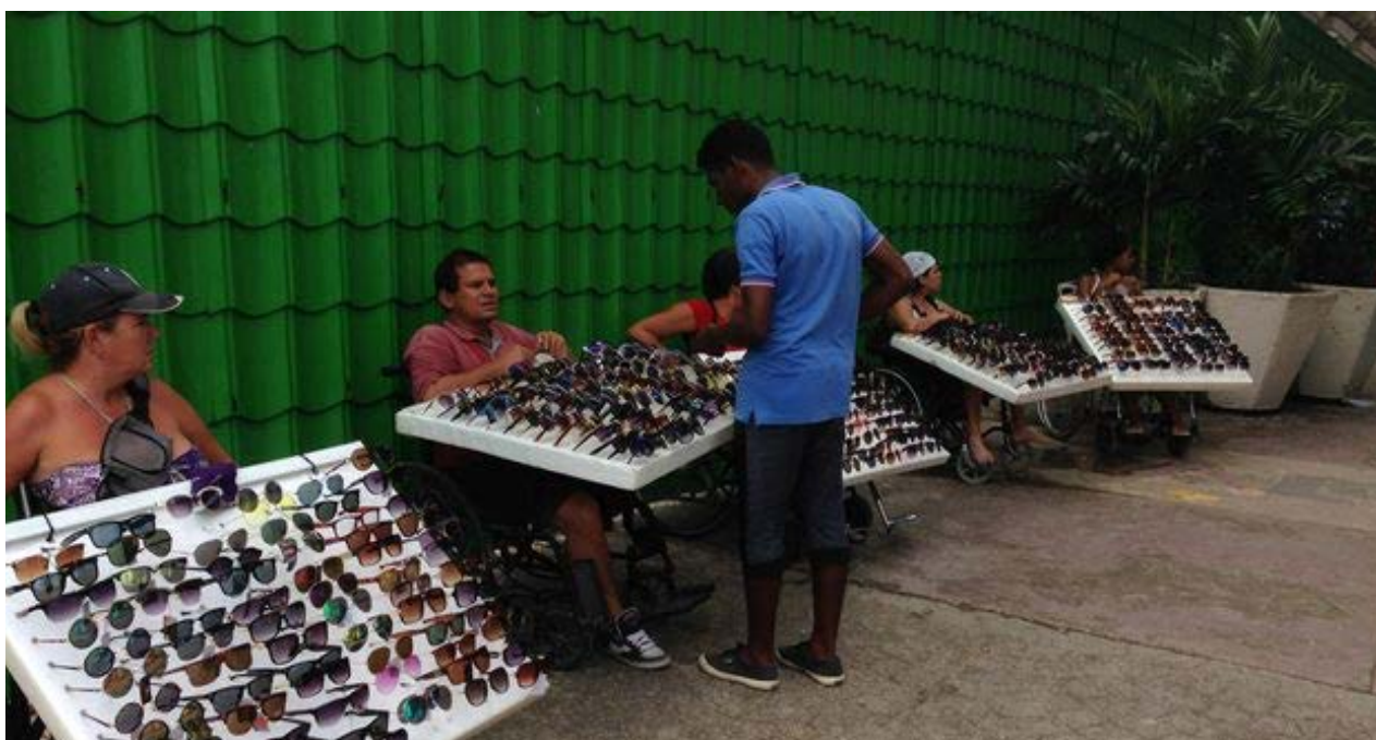
Vendedores informales de gafas, un producto que llega mayoritariamente a través de las mulas.