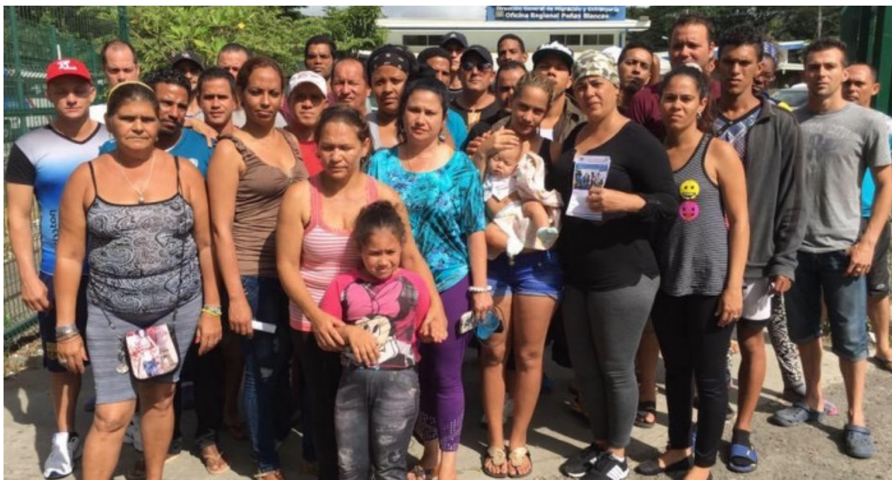
Cubanos en la frontera entre Costa Rica y Nicaragua