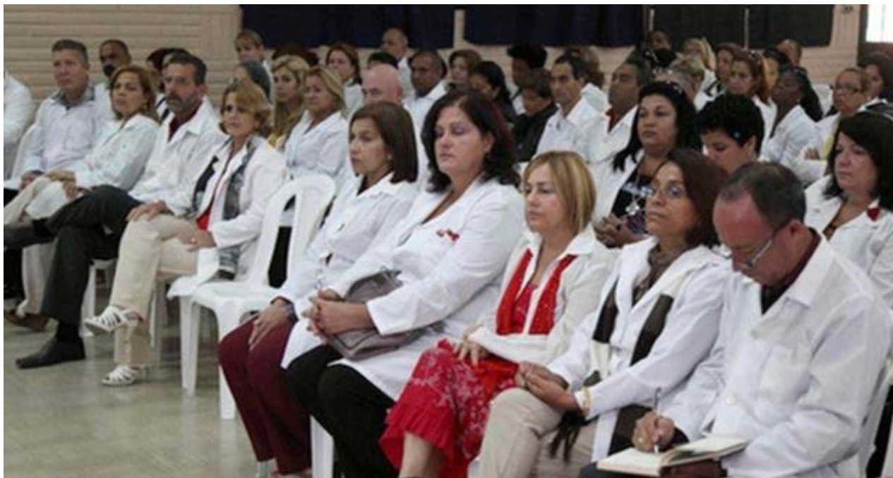
Misión de médicos cubanos en Ecuador (Americateve.com).