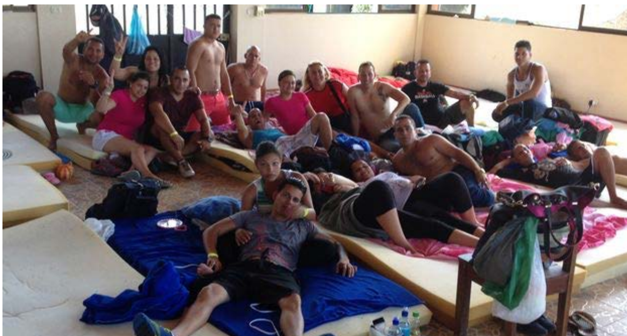
Migrantes cubanos en un albergue en La Cruz, a pocos metros de la frontera entre Costa Rica y Nicaragua