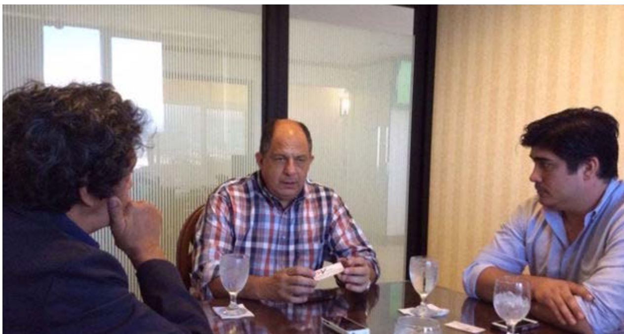
El presidente costarricense Luis Guillermo Solís y el ministro Carlos Alvarado Quesada durante la entrevista.

Una selección con lo mejor de la semana del primer diario independiente hecho en Cuba