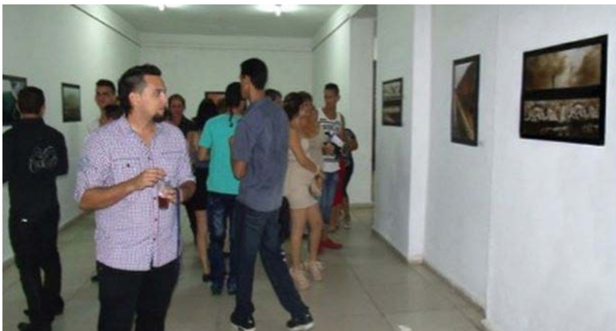
Imagen de la exposición Horizontes Líricos en Camagüey.

la mejor etapa de su vida y con su muerte perdimos a un defensor de la dignidad de los campesinos cubanos.