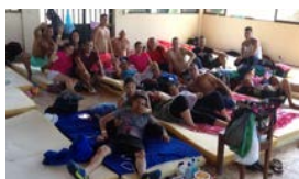
ILUSIÓN Y TEMOR EN LA FRONTERA