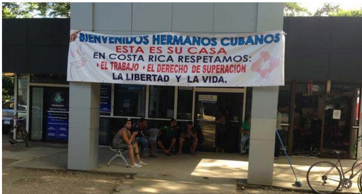
A pocos metros de la frontera con Nicaragua, los costarricense reiteran su solidaridad con los cubanos