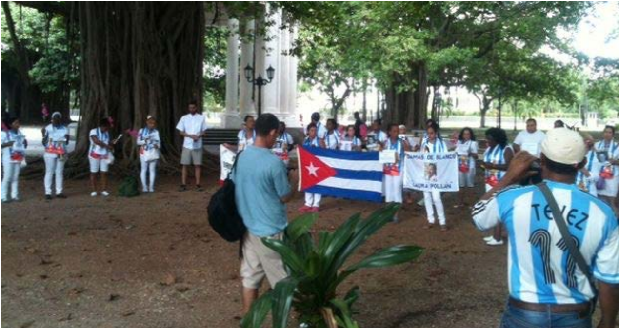
Damas de Blanco y activistas congregados en el parque Gandhi.