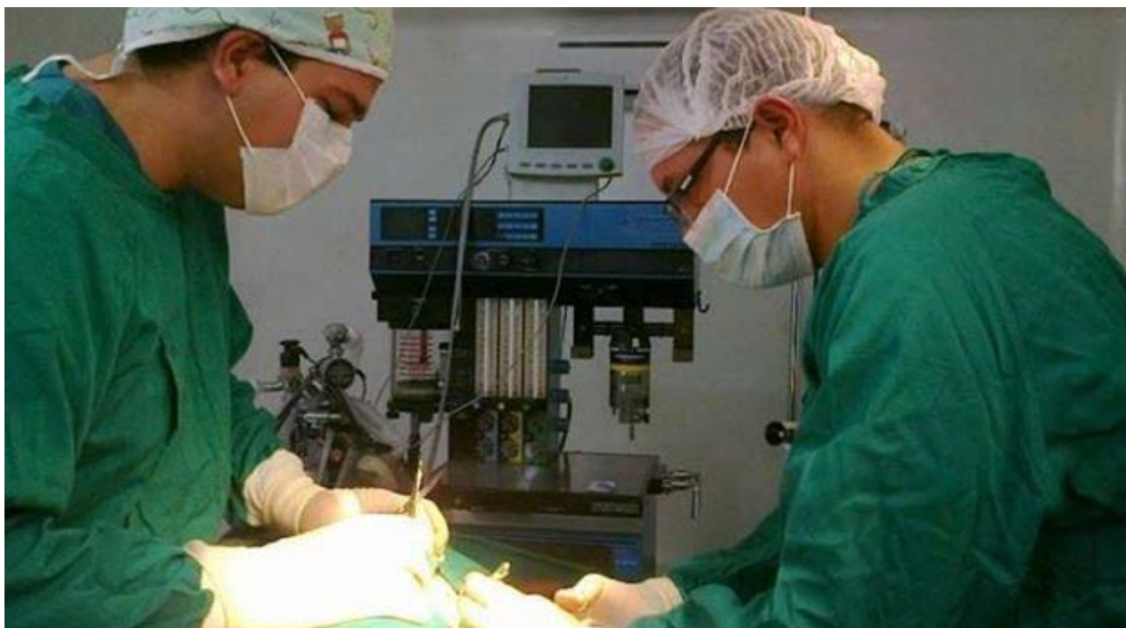
Médicos cubanos en Ecuador.