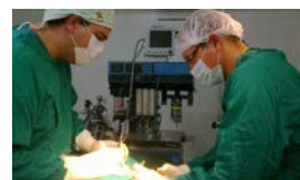
RESTRICCIONES A MÉDICOS