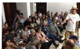
LOS CINEASTAS SE MOVILIZAN