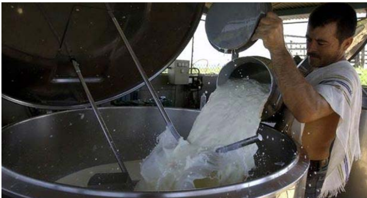
Producción de leche en Cuba (CC)