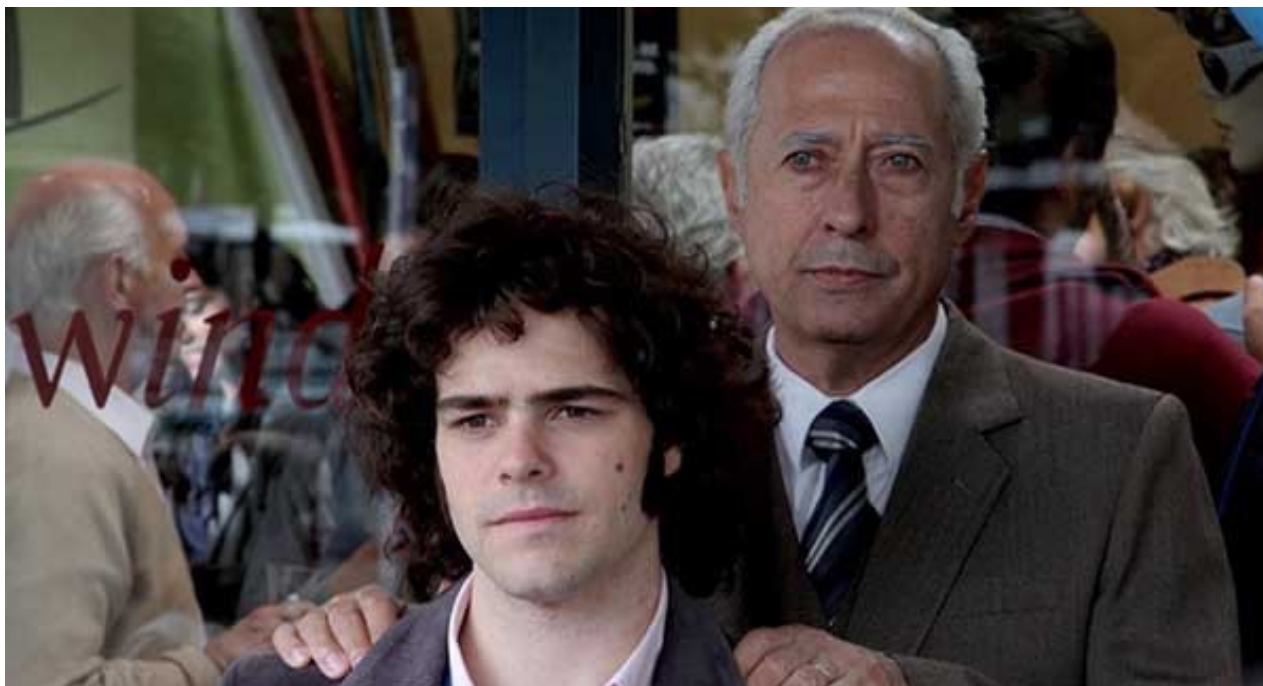
Escena de 'El Clan' (CC)