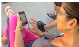
IMO, PERSONAJE DEL AÑO