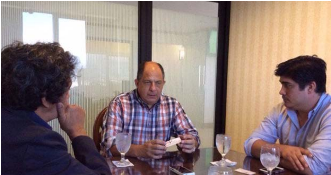
El presidente costarricense Luis Guillermo Solís y el ministro Carlos Alvarado Quesada durante la entrevista.