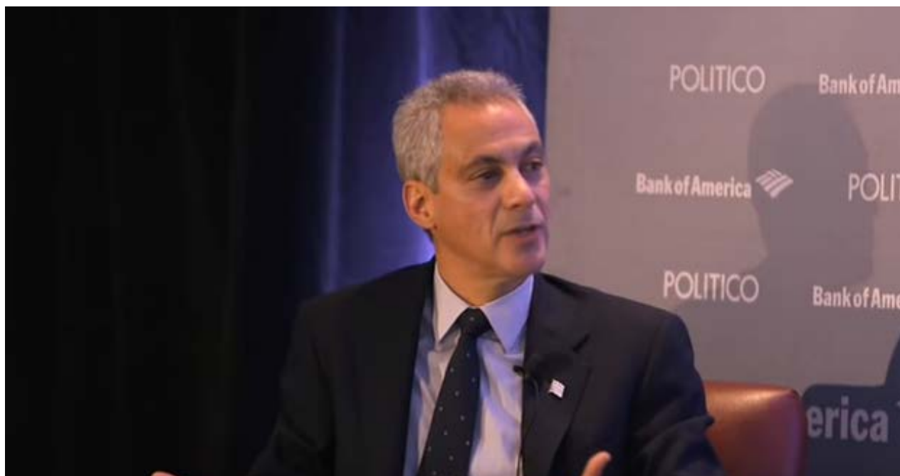
El alcalde de Chicago, Rahm Emanuel, durante la entrevista.

R. El mayor sueño de todos ellos es alcanzar la libertad. Muchos de ellos sueñan desde niños con una libertad que no han tenido.