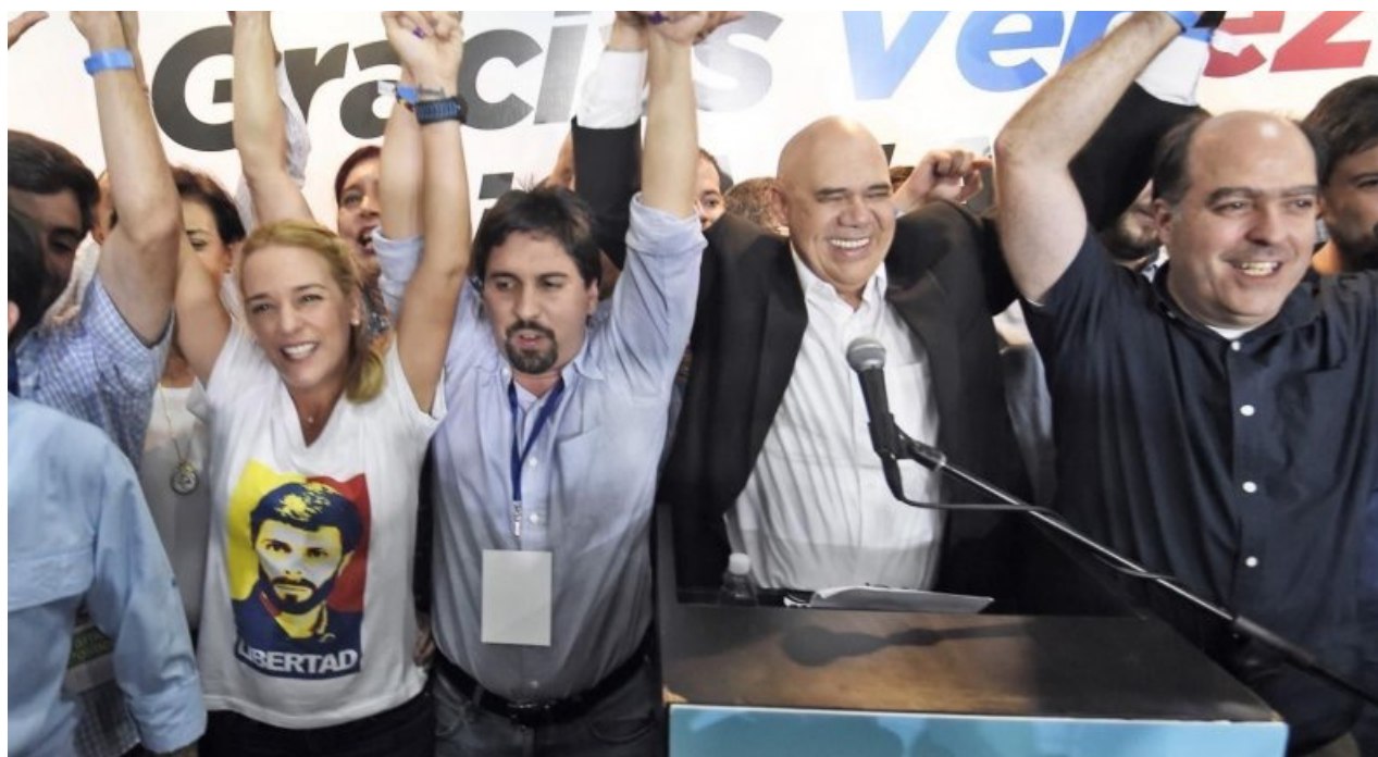
La alianza opositora Mesa de la Unidad Democrática logró la mayoría absoluta, según datos oficiales.