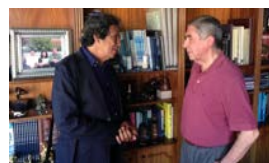
LA POBREZA SIN PASAPORTE