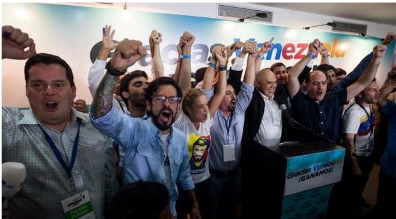
Miembros de la coalición opositora Mesa de Unidad Democrática (MUD) celebran la victoria

Una selección con lo mejor de la semana del primer diario independiente hecho en Cuba