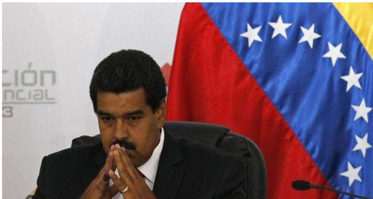
Nicolás Maduro, presidente de Venezuela.