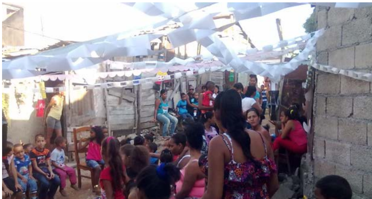
Casa en Palma Soriano donde irrumpió la policía este domingo mientras miembros de la Unpacu celebraban una fiesta infantil.