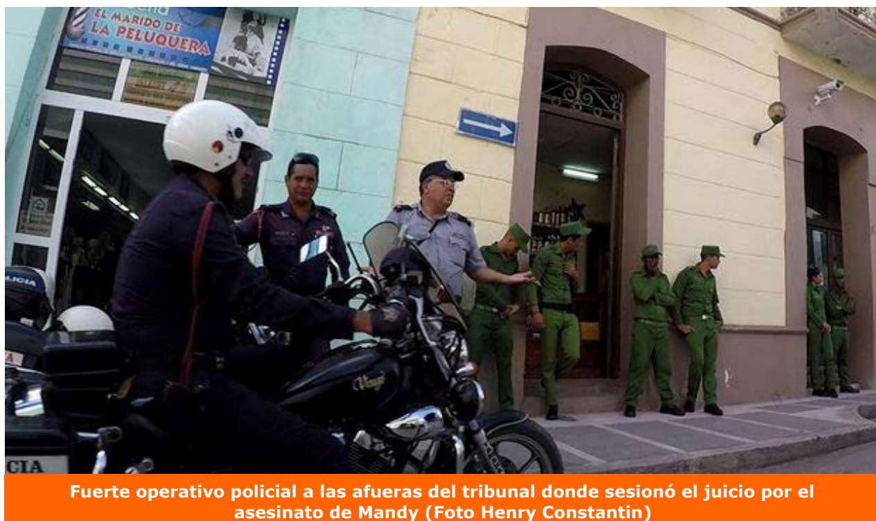
Fuerte operativo policial a las afueras del tribunal donde sesionó el juicio por el asesinato de Mandy

En su último informe, la disidente Comisión Cubana de Derechos Humanos y Reconciliación Nacional (CCDHRN) reportó 1.447 detenciones por motivos políticos durante el mes de noviembre, la cifra más alta en años, según aseguró esta organización.