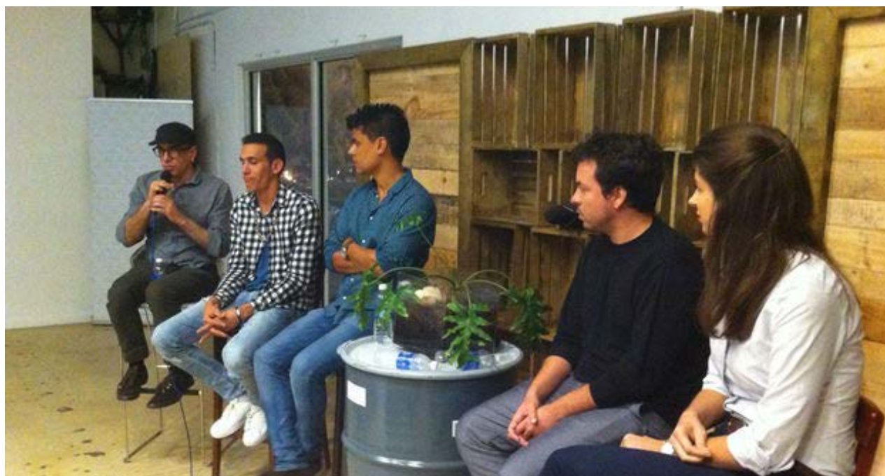
Panel de emprendedores cubanos en Miami, durante el evento 'Emerging Tech In Cuba: Meet Its Pioneers'.

Otro aspecto que afecta a los restaurantes estatales es que el suministro de especias y de condimentos a veces es insuficiente y obliga a los cocineros a comprar estos productos pagando de su propio bolsillo.