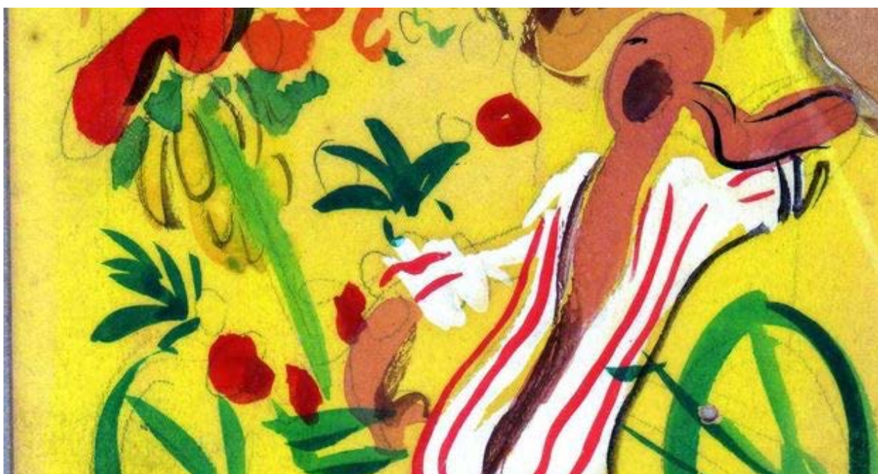
Carretillero, de Andrés García Benítez.