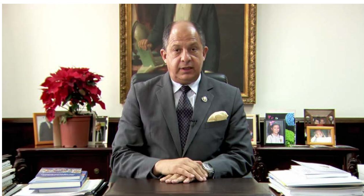
El presidente de Costa Rica, Luis Guillermo Solís, se dirige en un video a los migrantes cubanos.

R. Si queremos que estas cosas no vuelvan a suceder, es imperioso que Cuba se abra, que se abra a la democracia y a la libertad.