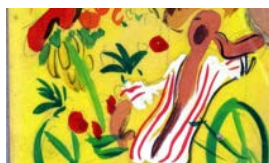
EL CARRETILLERO DE ANDRÉS