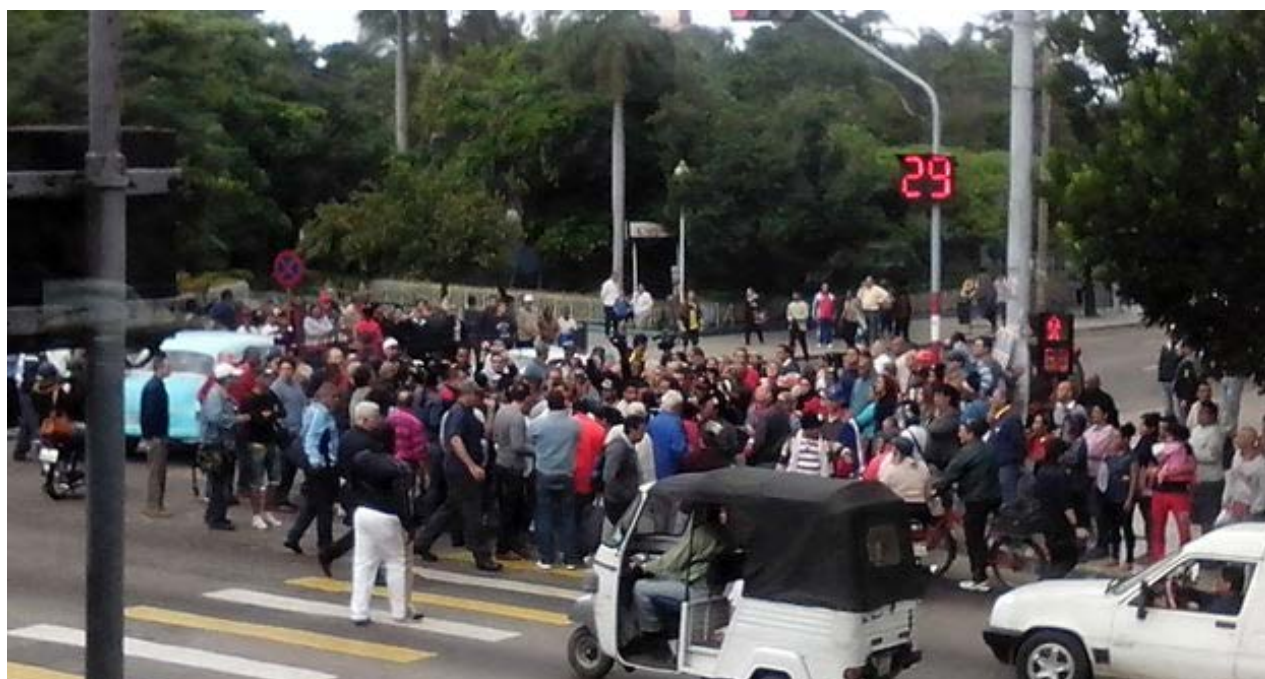
Concentración en La Habana para el Día de los derechos humanos de 2014.