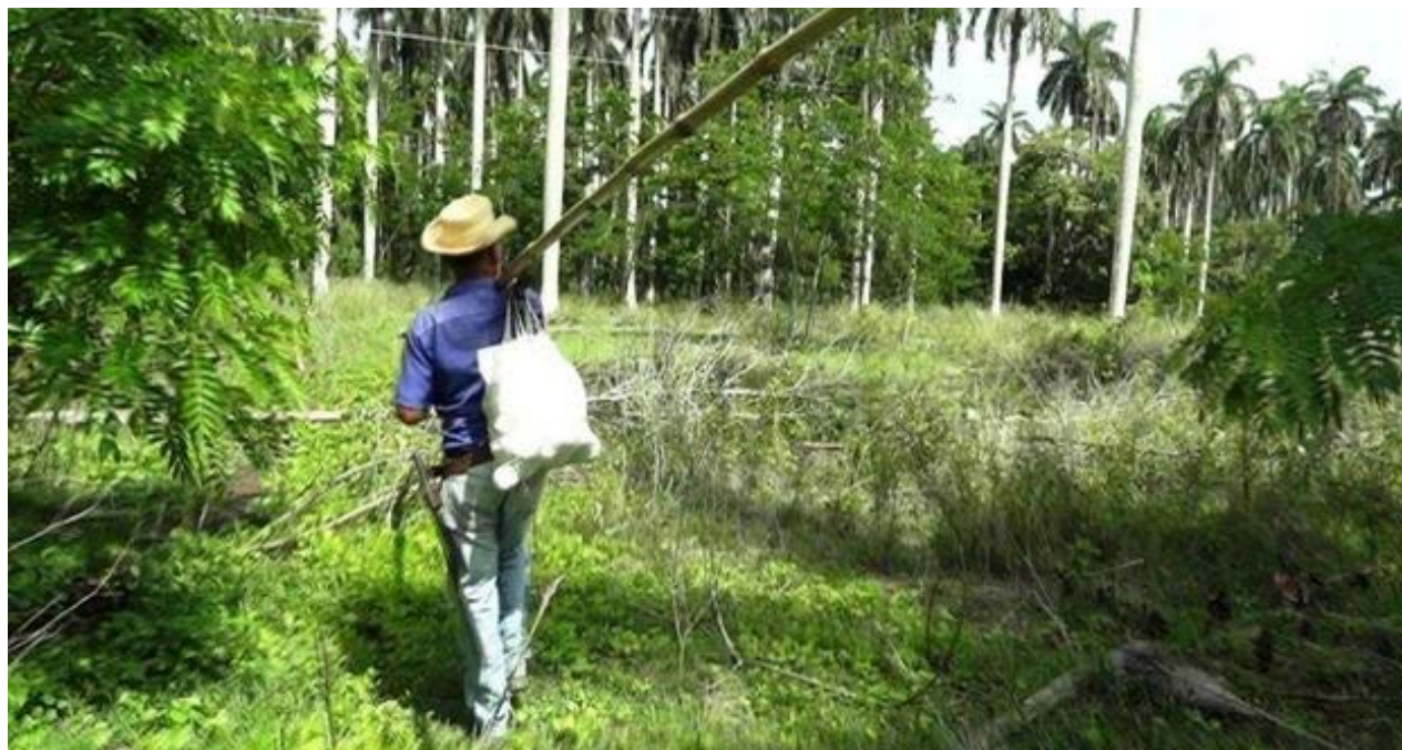
Tendido eléctrico alternativo en Camagüey.