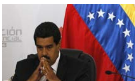
FRACASÓ EL CHAVISMO