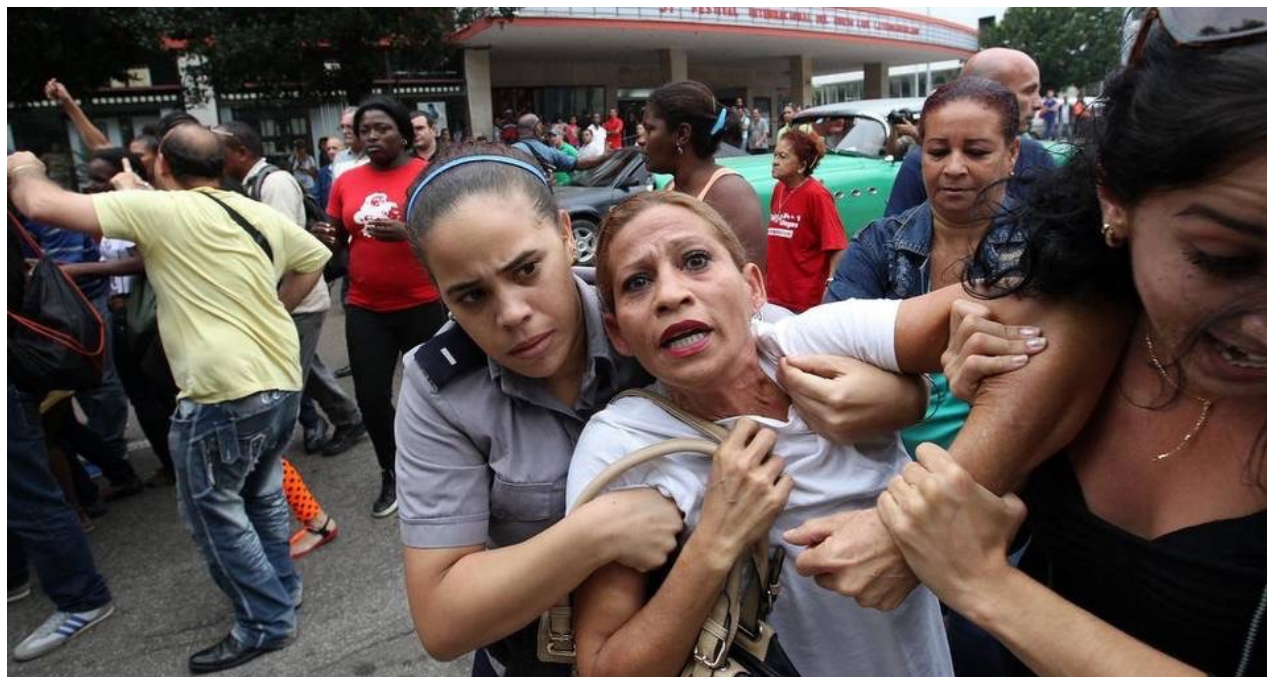
Una Dama de Blanco detenida en La Habana durante el Día de los derechos humanos este 2015.