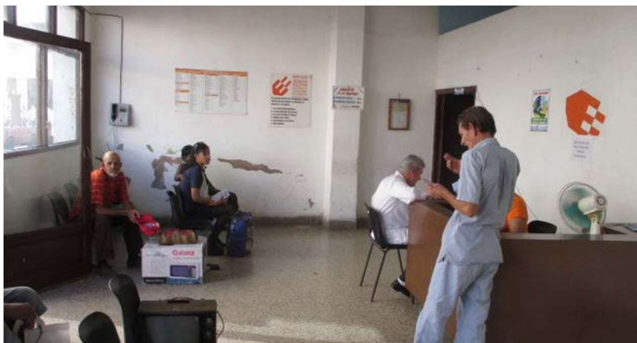
Recepción del taller de la calle Aguilera esquina Mártires.

A la interrogante de cuánto ha cambiado la Isla después del 17 de diciembre pasado, con el restablecimiento de relaciones entre Cuba y Estados Unidos, los jóvenes emprendedores coincidieron en verlo como "una oportunidad" para conocer el modelo de negocios en el país del Norte y también para formar a los empresarios del mañana en universidades y centros de intercambio académico estadounidenses.