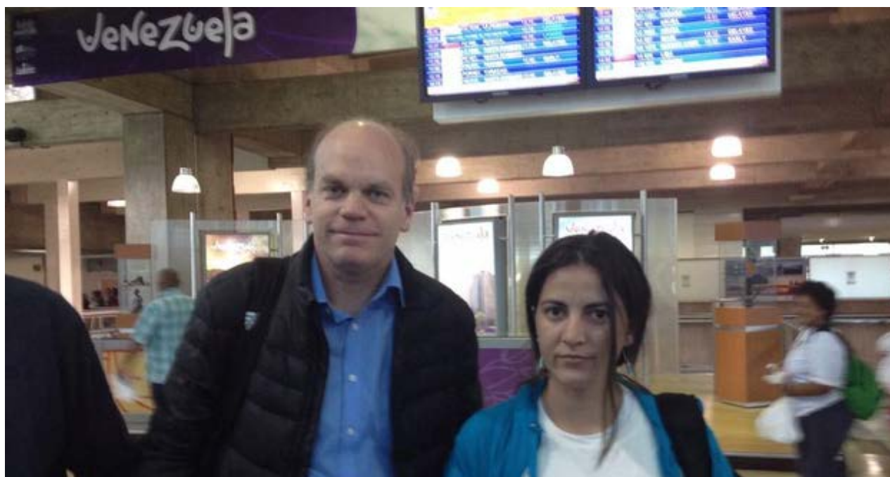
La activista Rosa María Payá y el presidente del senado de Chile, Patricio Walker, en Caracas.