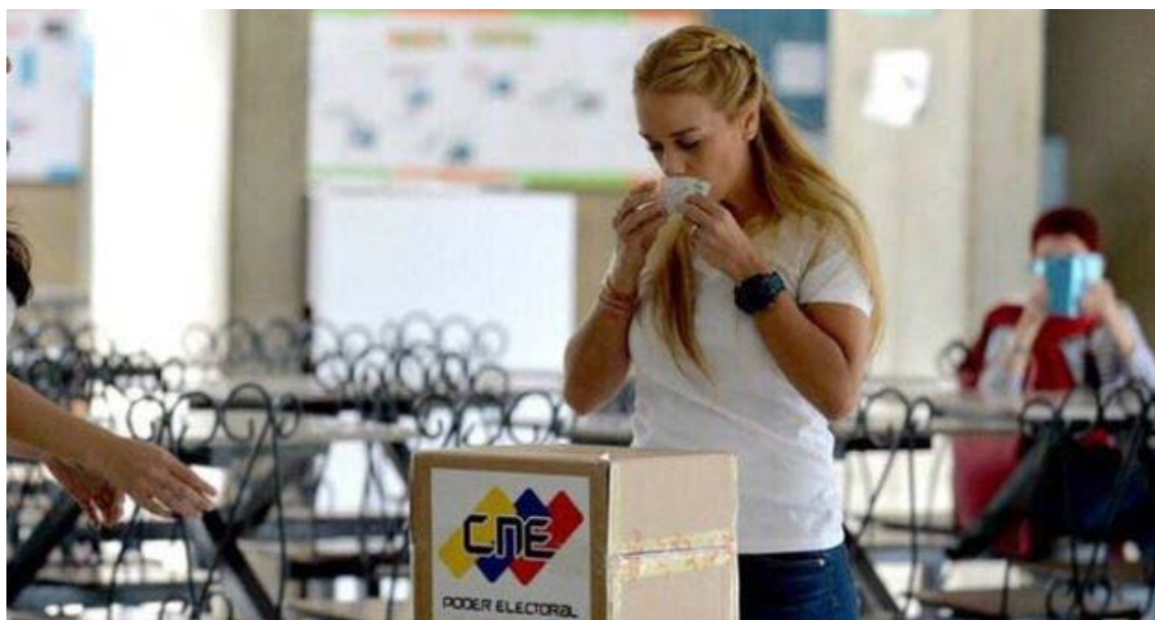
La opositora Lilian Tintori este domingo.