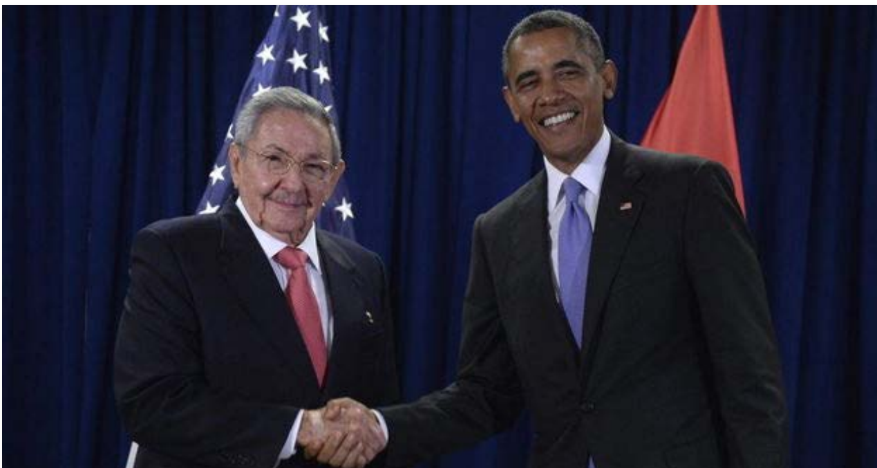
El presidente de Estados Unidos, Barack Obama, y su homólogo cubano, Raúl Castro, en la sede de las Naciones Unidas.

Una selección con lo mejor de la semana del primer diario independiente hecho en Cuba