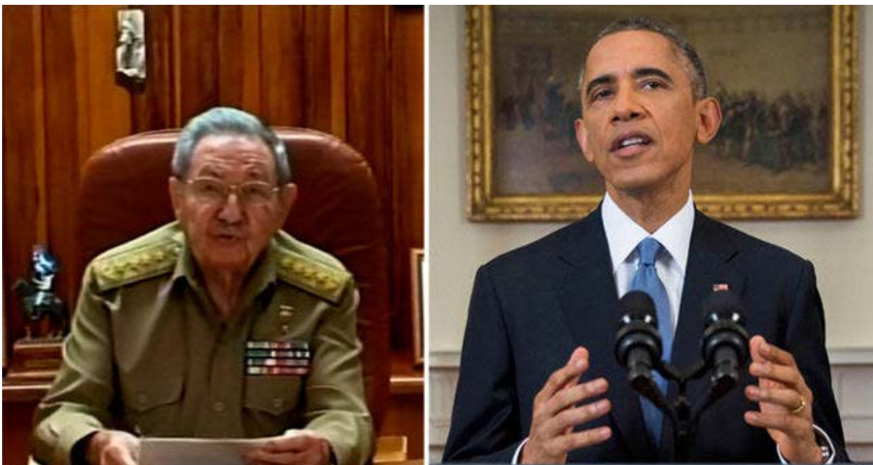
Raul Castro y Barack Obama anunciaron el 17 de diciembre de 2014 la normalización de relaciones entre Cuba y EE UU.

Los terrenos comprados a cada lado de la línea ferroviaria empezaron hoy a devaluarse porque el dichoso tren no acaba de desplazarse sobre los carriles.