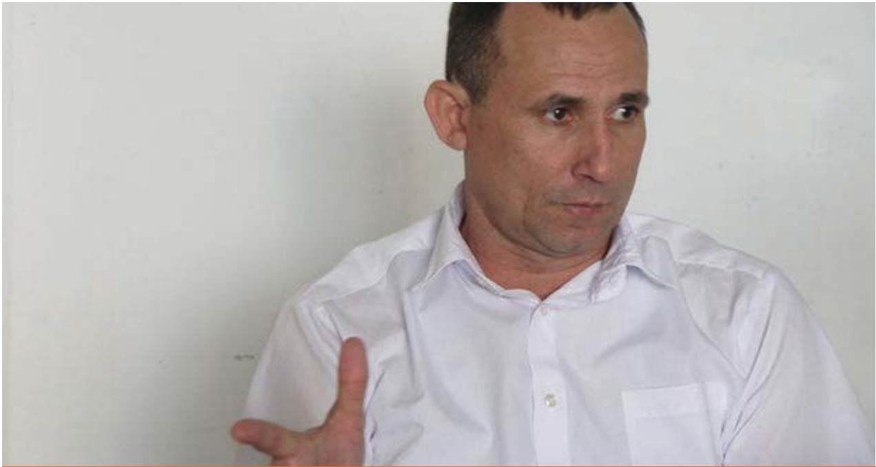
José Daniel Ferrer, líder de la Unión Patriótica de Cuba, Unpacu.