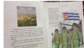
"LA LETRA, CON POLÍTICA, ENTRA"