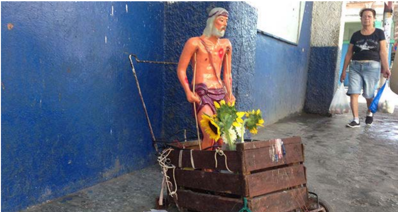
Una imagen de San Lázaro en una calle habanera.