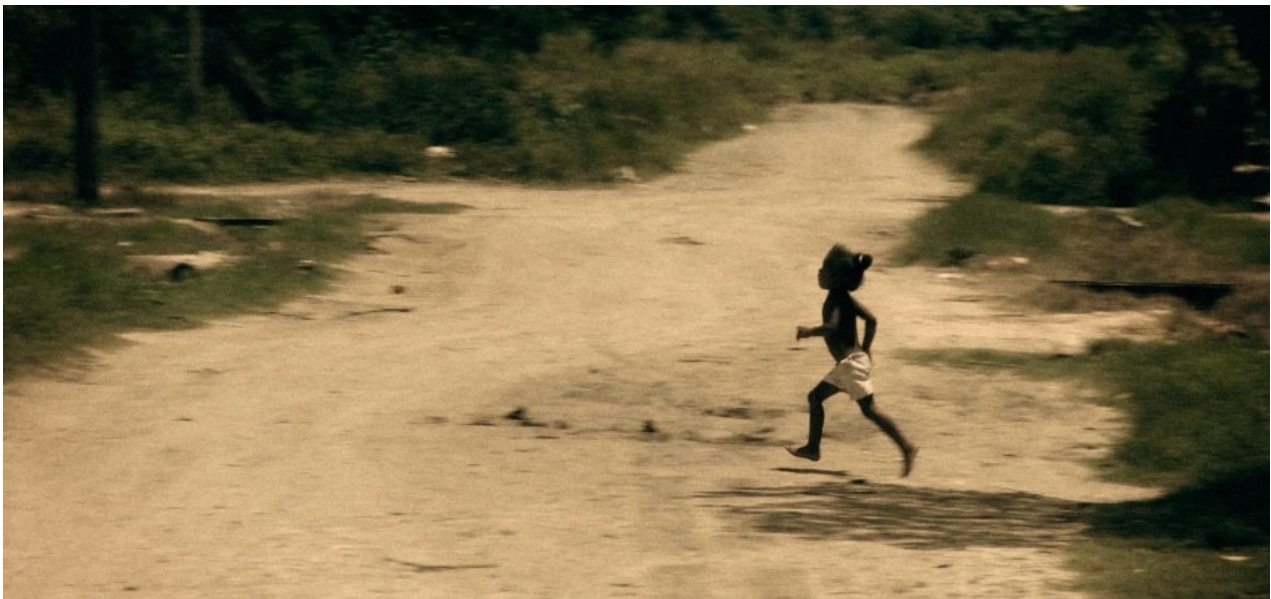
Fotograma de 'El tren de la línea Norte'.