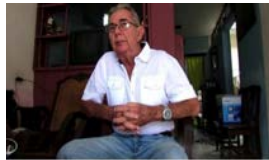
EL 'CASO MANDY' EN CAMAGÜEY