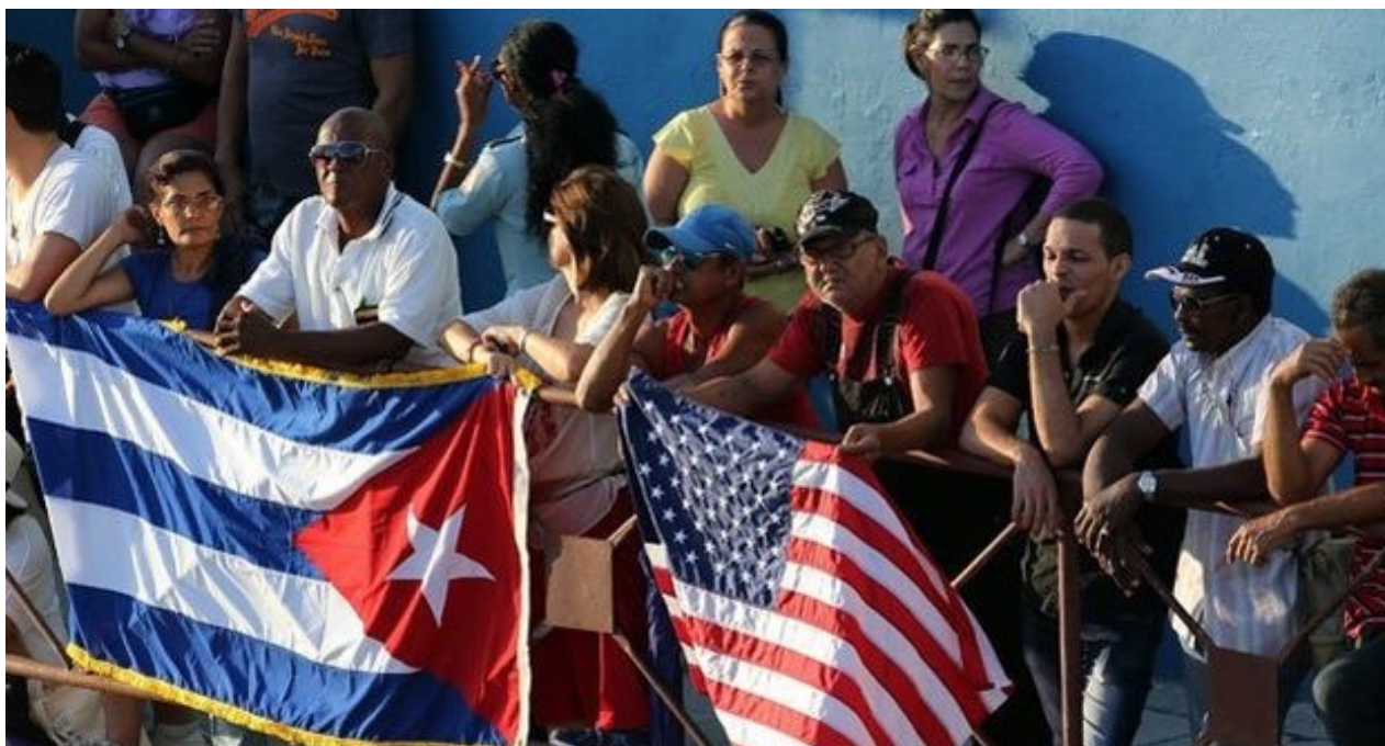
Banderas de Cuba y Estados Unidos en una calle habanera.