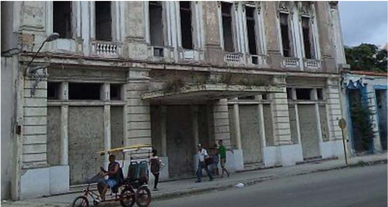
El gigantesco inmueble en la calle Dragones que un día albergó el Hotel Nueva York, el primero expropiado por Fidel Castro después de la Revolución.