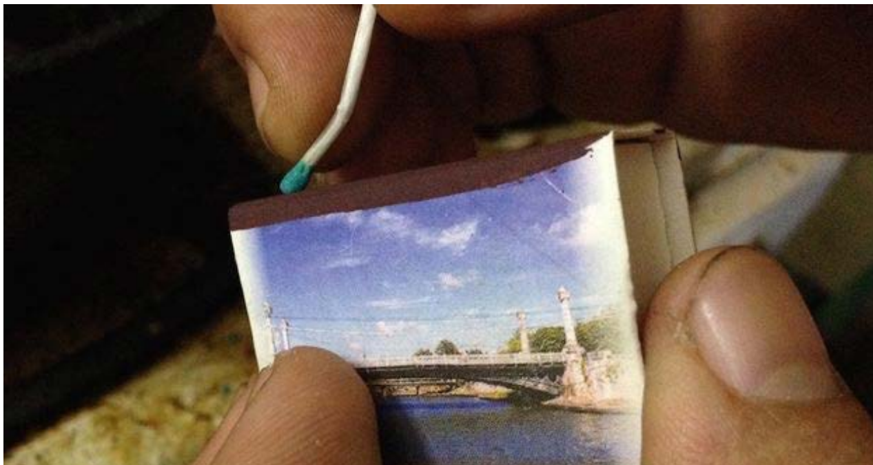
Caja de fósforos.