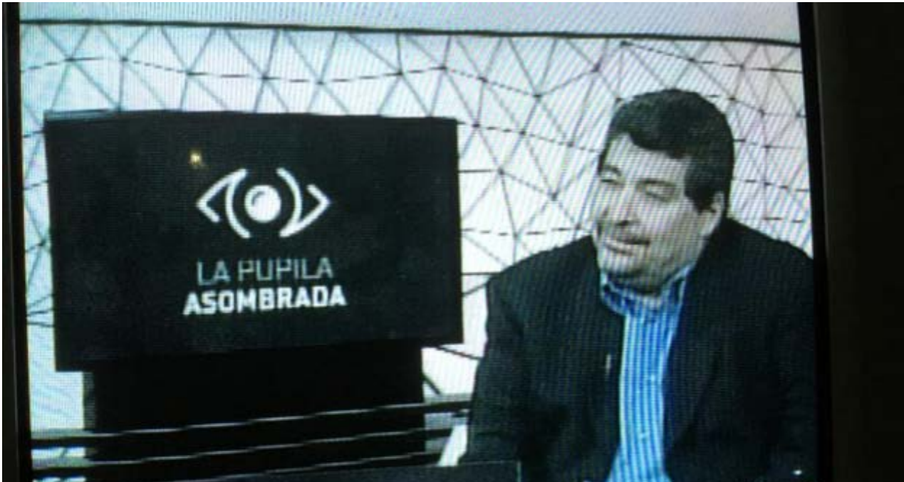
Fotograma del programa de televisión 'La pupila asombrada', dirigido por Iroel Sánchez.