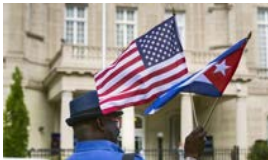
NI MCDONALD'S, NI LIBERTAD