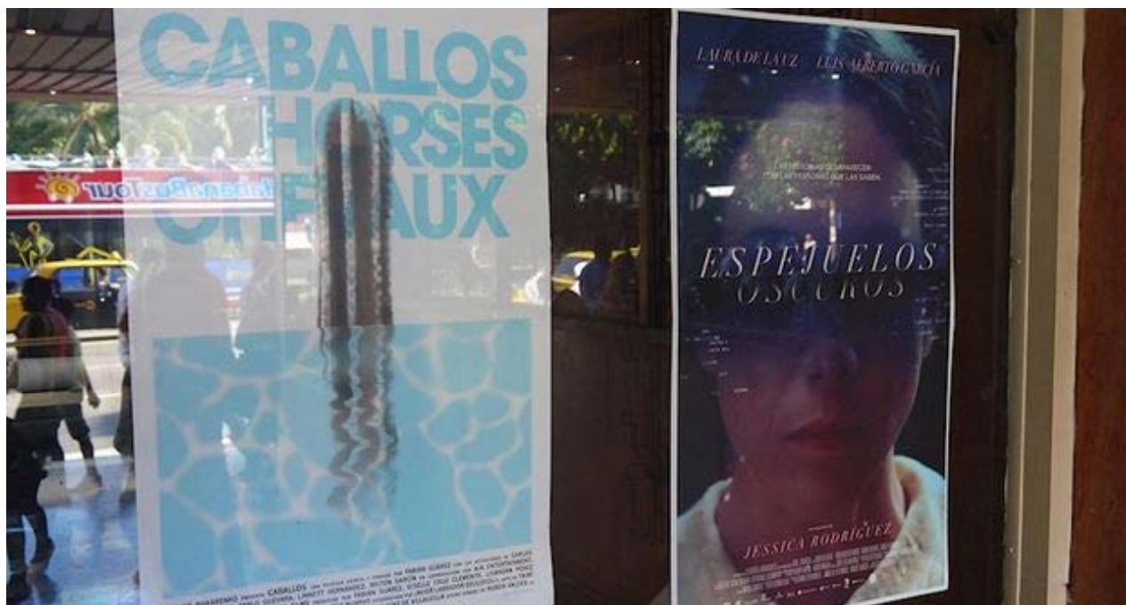
Los carteles de las películas 'Caballos' y 'Espejuelos oscuros'.