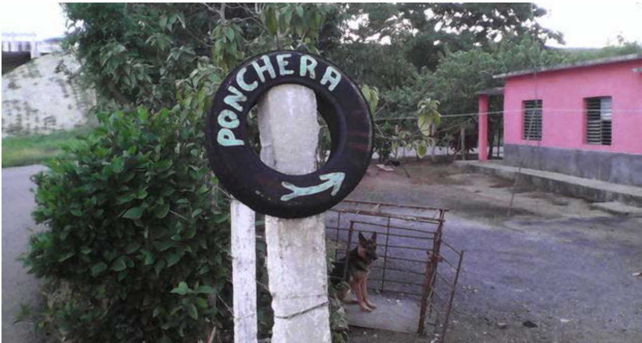
La entrada a la ponchera de Julito cuando aún funcionaba.