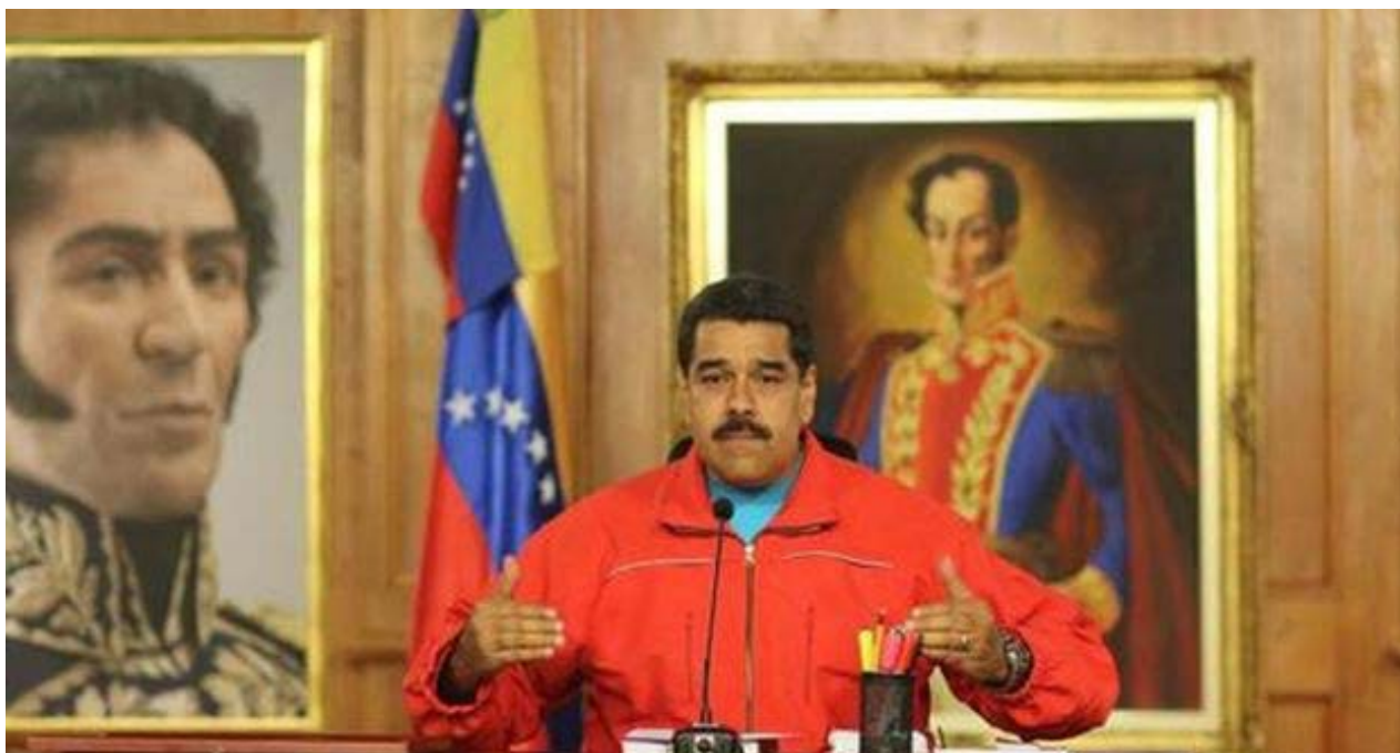
El presidente de Venezuela, Nicolás Maduro.