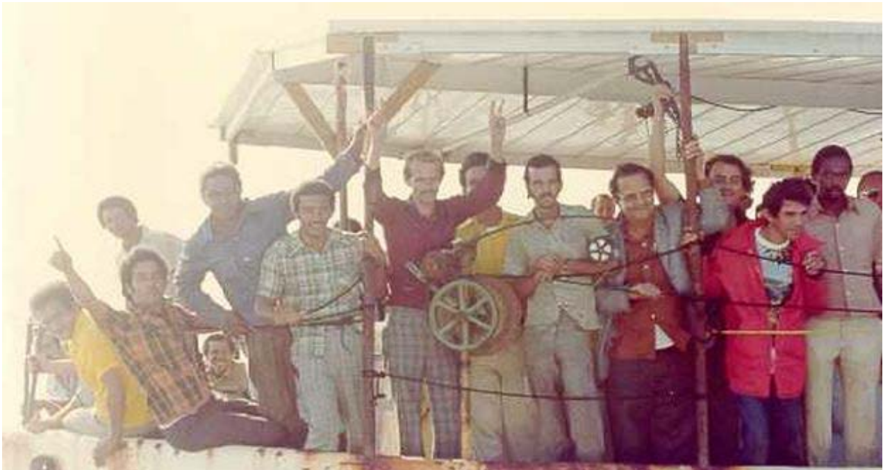
Durante el éxodo del Mariel salieron de la Isla más de 30.000 ciudadanos.