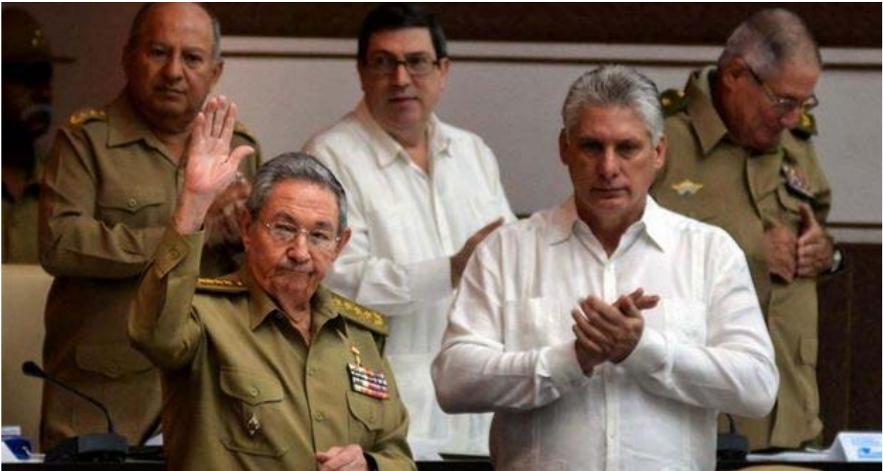
El presidente de Cuba, Raúl Castro, y el primer vicepresidente, Miguel Díaz-Canel, en la sesión de la Asamblea Nacional del Poder Popular.