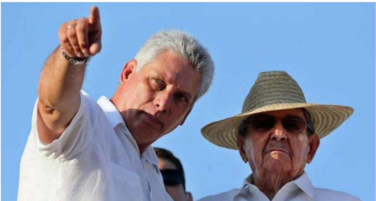
El general presidente cubano, Raúl Castro acompañado por Miguel Díaz Canel, vicepresidente, el primero de mayo.

Así son ciertos políticos. Laman –por enésima vez– a ajustarse el cinturón y recortar las expectativas de una vida mejor, mientras ellos malgastan enormes cantidades de recursos nacionales en jugar a la guerra.