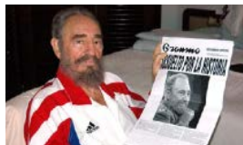
FIDEL CASTRO SE ENVUELVE EN PROHIBICIONES