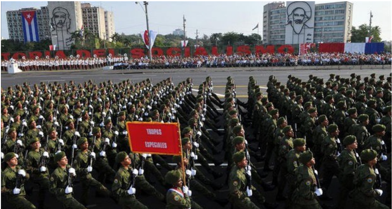
Raúl Castro presidirá este enero su primer desfile sin la sombra de su hermano.