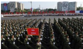
TIEMPOS DE APRETARSE EL CINTURÓN