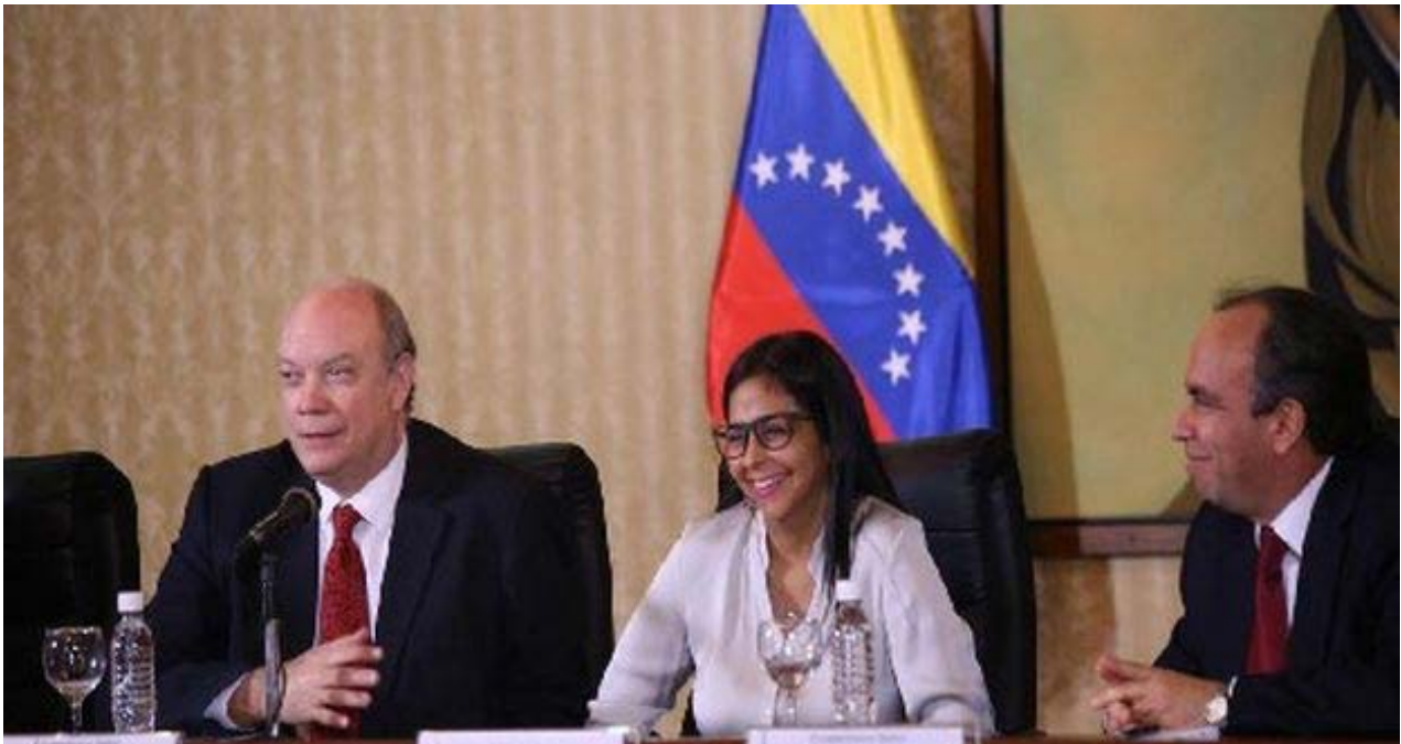
Rodrigo Malmierca y Delcy Rodríguez en la comisión intergubernamental del convenio integral de cooperación entre Cuba y Venezuela.