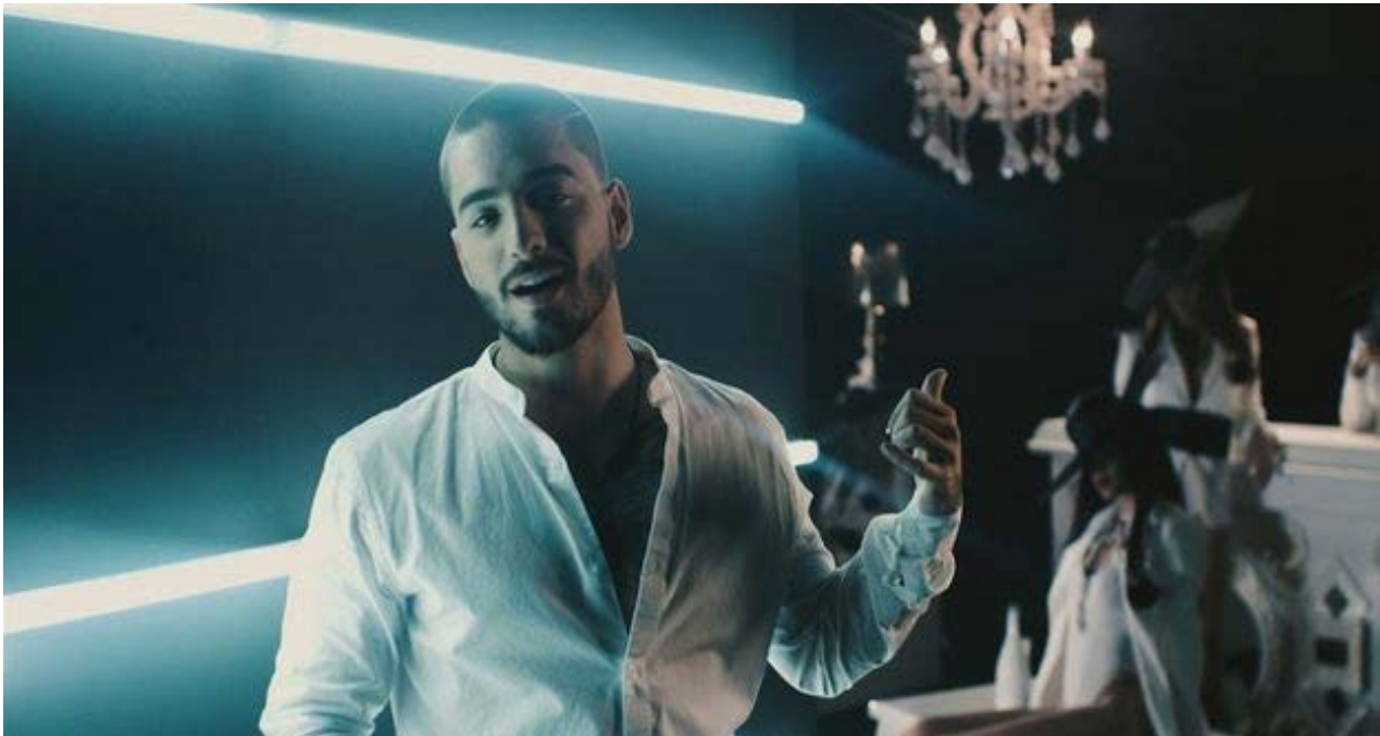
Fotograma del videoclip 'Cuatro Babys' de Maluma.