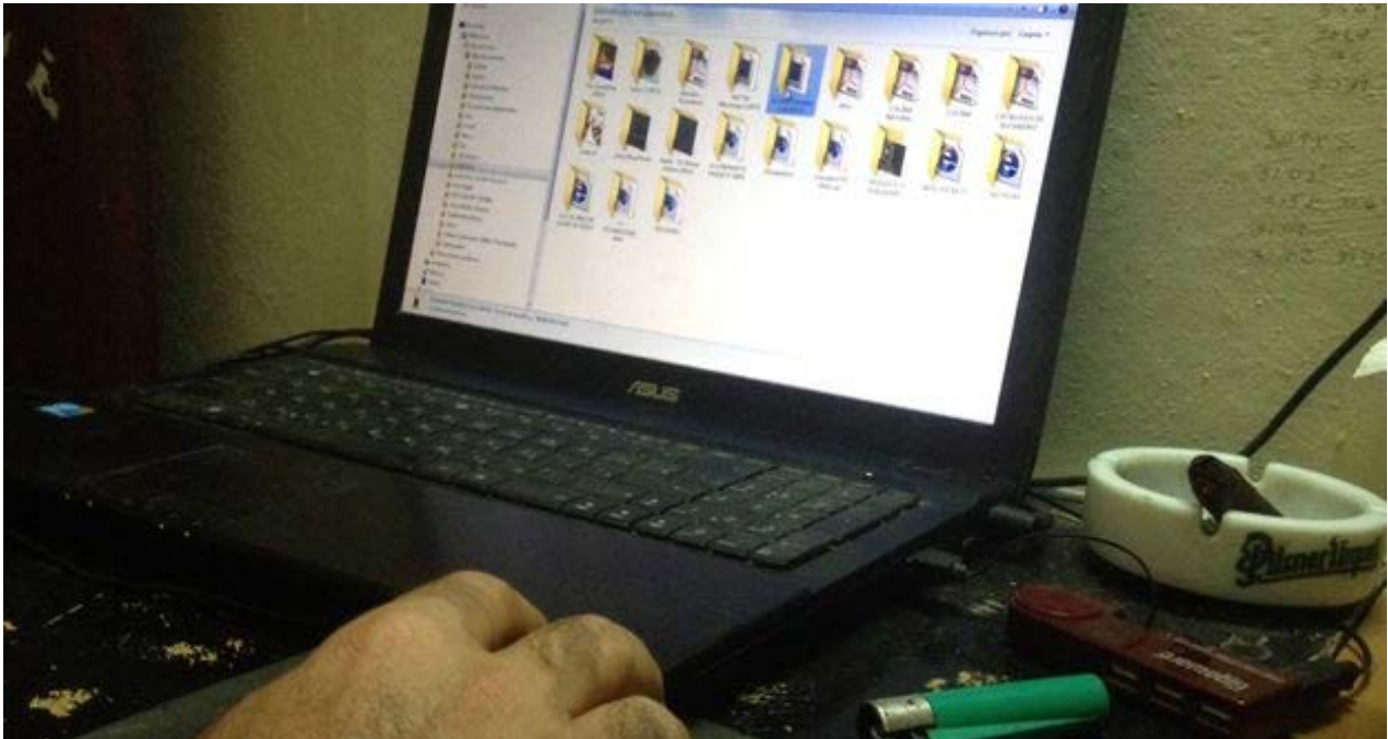
Un cubano accediendo al 'paquete' desde su 'laptop'. (14ymedio)