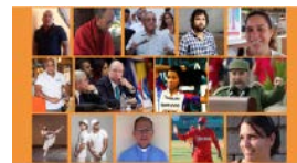
LOS ROSTROS DE 2016 SEGÚN 14YMEDIO