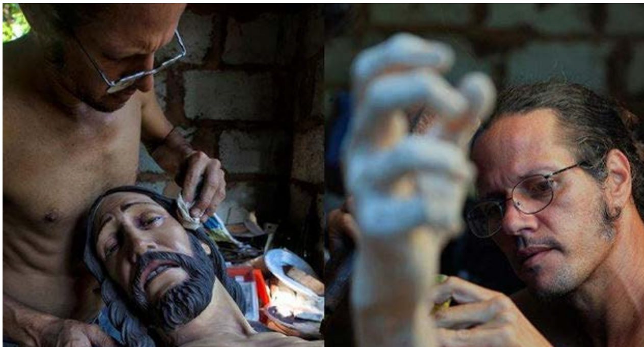
Dos momentos durante la creación del Cristo del Milagro. (Jorge César Sáenz)