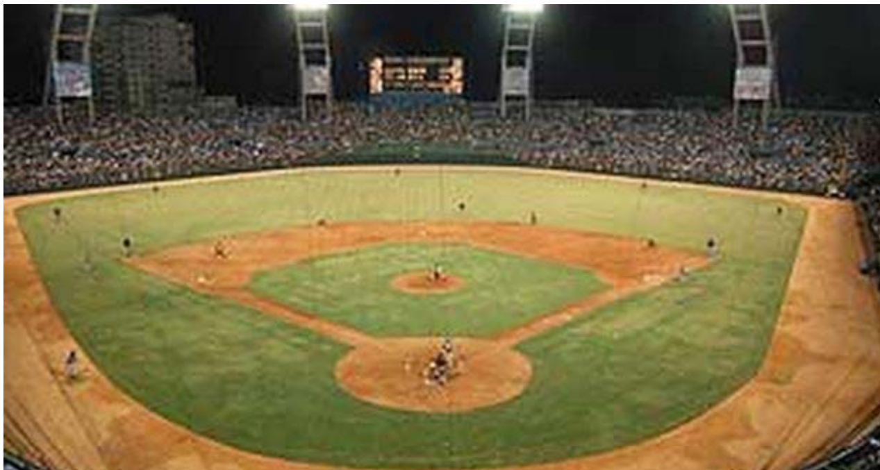
El Estadio Latinoamericano de La Habana.