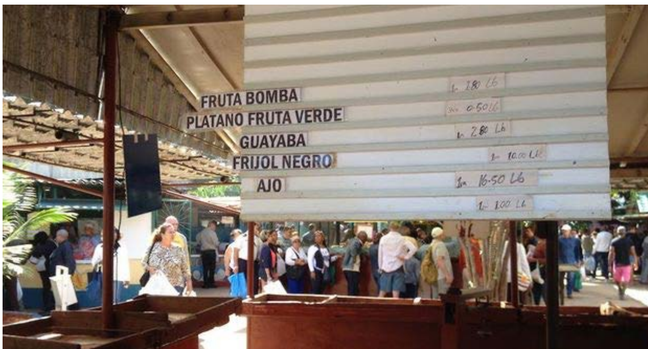
El mercado del Ejército Juvenil del Trabajo en la calle Tulipán, La Habana.