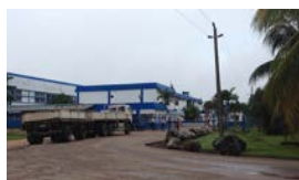
JOVELLANOS Y SU NOSTALGIA