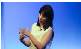
HAY FESTIVAL HAVANA