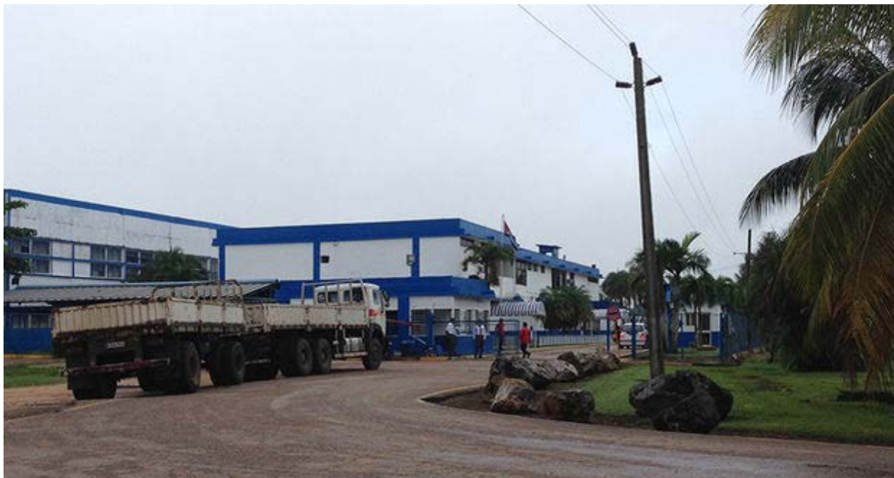
Antigua fábrica de pasta dental Gravi, hoy Jovel, perteneciente a la empresa de capital mixto Suchel.