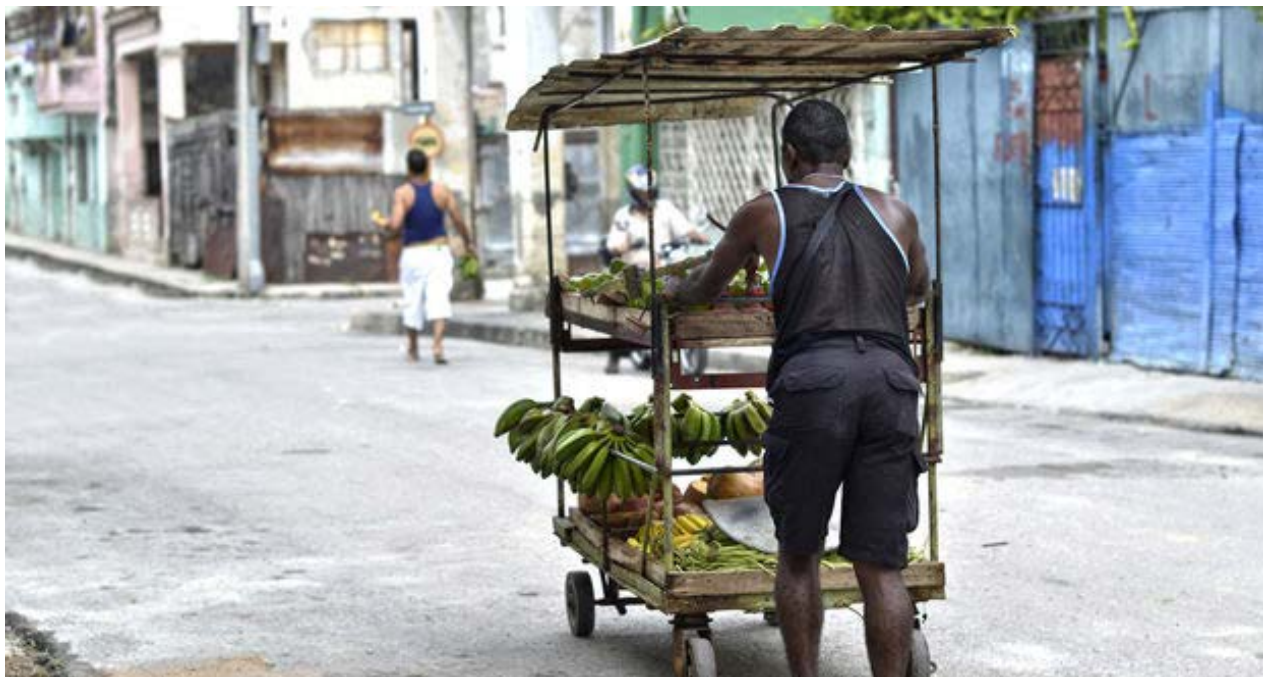
Carretillero en una calle de La Habana. (CC)