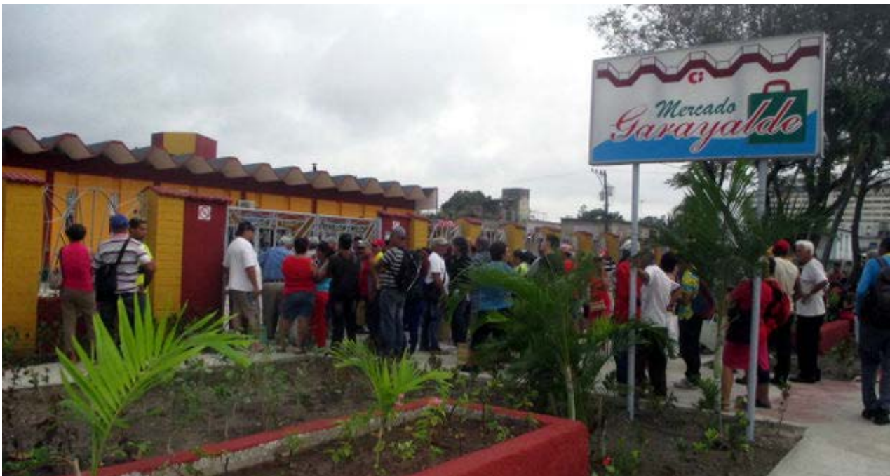
El mercado Garayalde en la ciudad de Holguín, durante su reapertura este martes 19 de enero. (Fernando Donate)