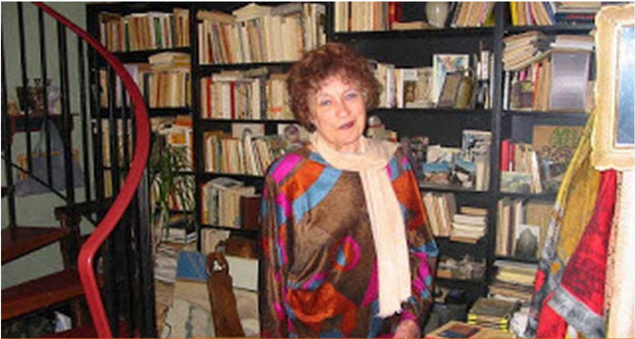
La escritora canario-cubana Nivaria Tejera falleció en París el pasado 6 de enero.