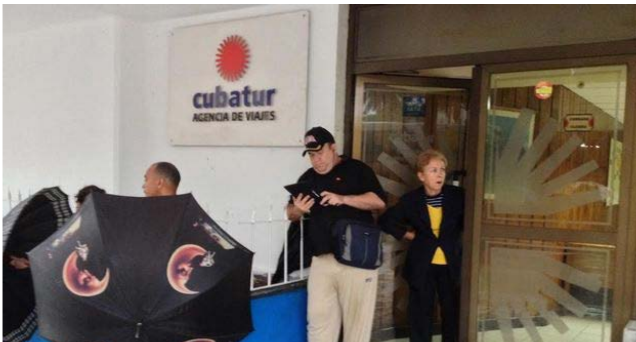
Oficina de la agencia turística Cubatur, en los bajos del Hotel Habana Libre.