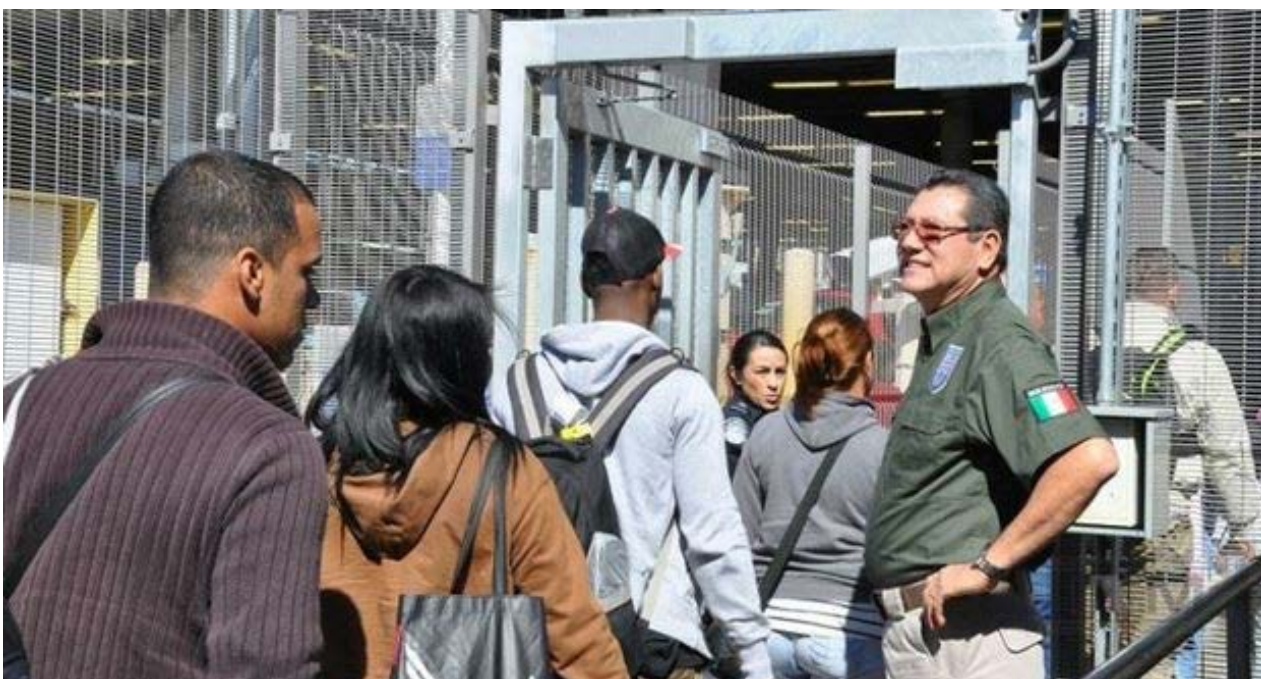
Miles de cubanos han entrado este año a Estados Unidos por la frontera mexicana.

Una selección con lo mejor de la semana del primer diario independiente hecho en Cuba