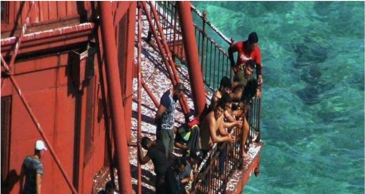
Balseros cubanos se refugiaron en la parte más alta de un faro en los cayos de Florida por temor a ser repatriados a Cuba.