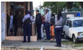
EL NUEVO MINISTRO DESATA OLA REPRESIVA