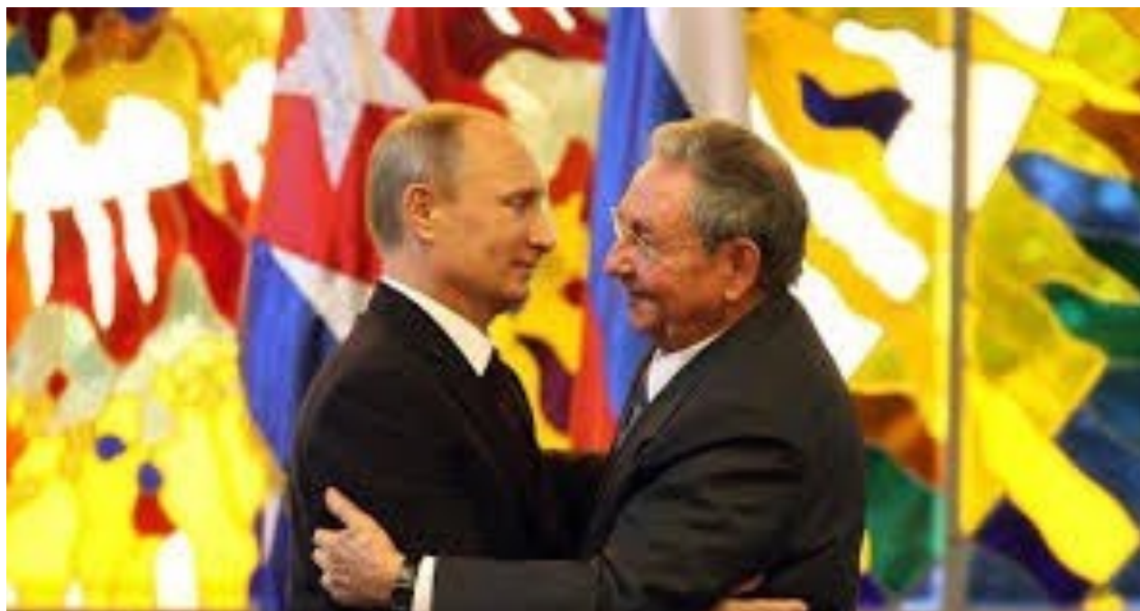
Raúl y Putin en el Palacio de la Revolución.