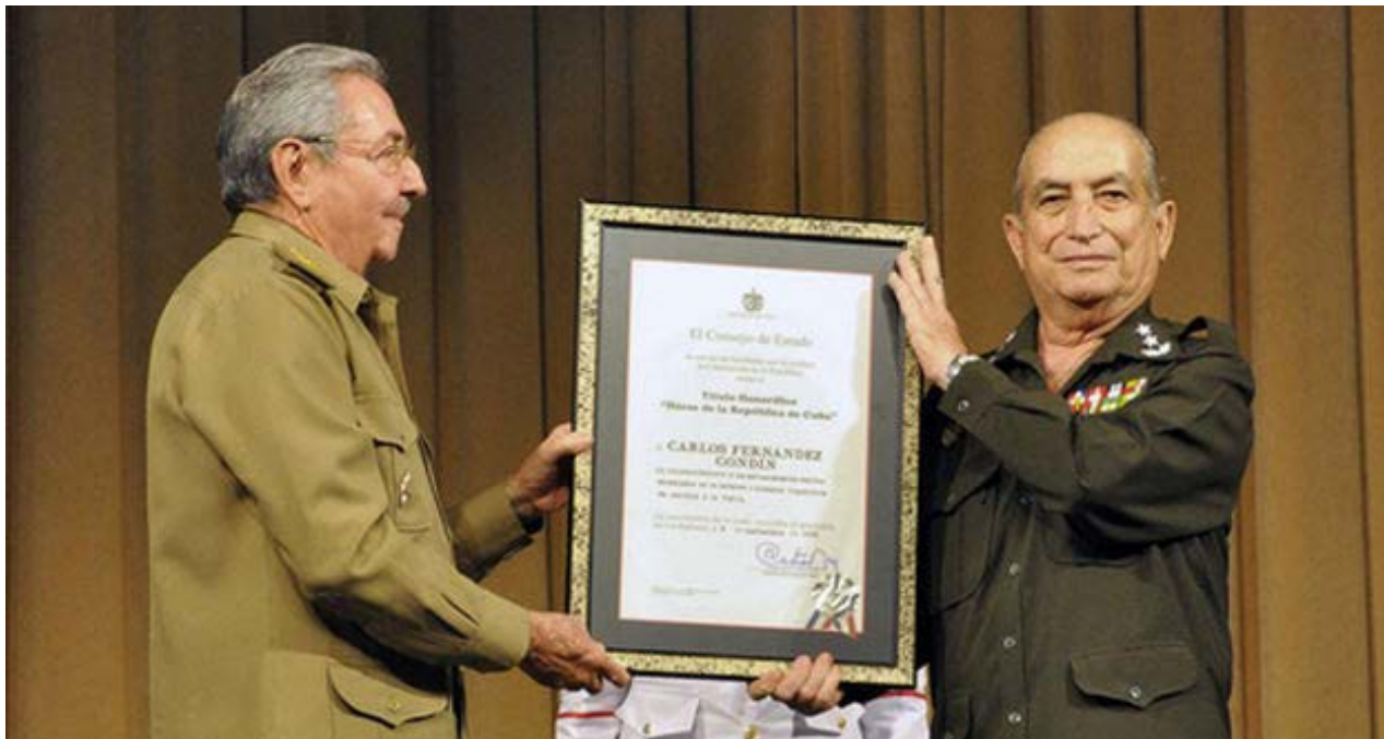
Carlos Fernández Gondín marcó con su impronta el Ministerio del Interior.