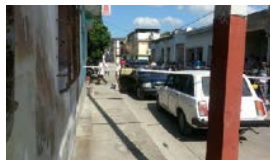
ASESINAN A UN ANCIANO EN HOLGUÍN