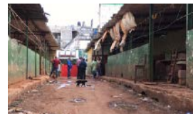
EL MERCADO DE EGIDO Y LOS PRECIOS TOPADOS