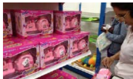
LOS REYES MAGOS TAMBIÉN SON SEXISTAS