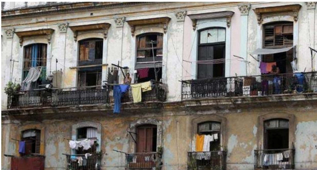
Edificio de apartamentos en La Habana.