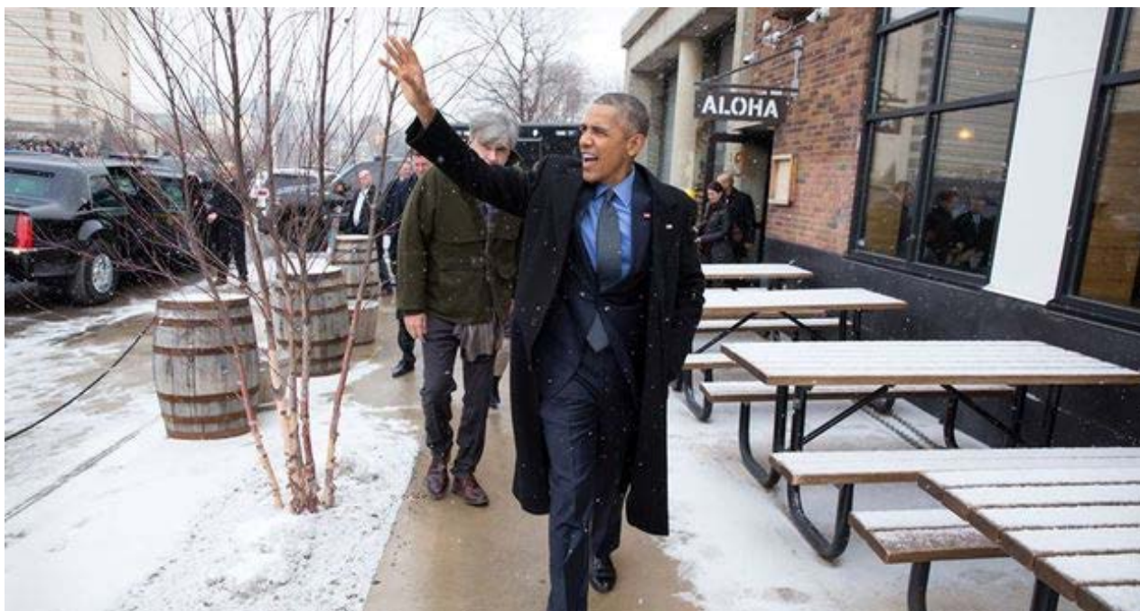
El presidente de EE UU, Barack Obama, el pasado mes de enero.