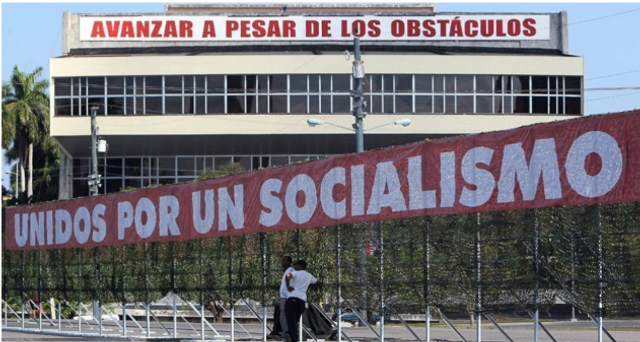
Una valla durante los preparativos para un primero de mayo en la Plaza de la Revolución, La Habana.