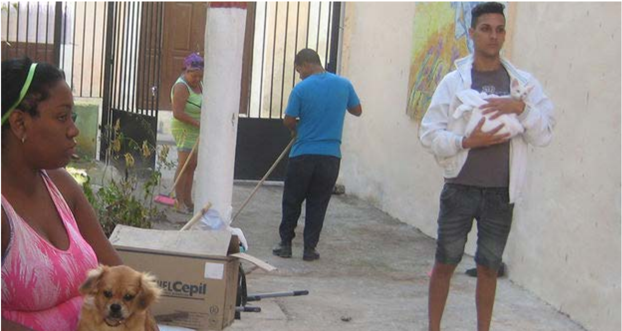
Campaña de esterilización.