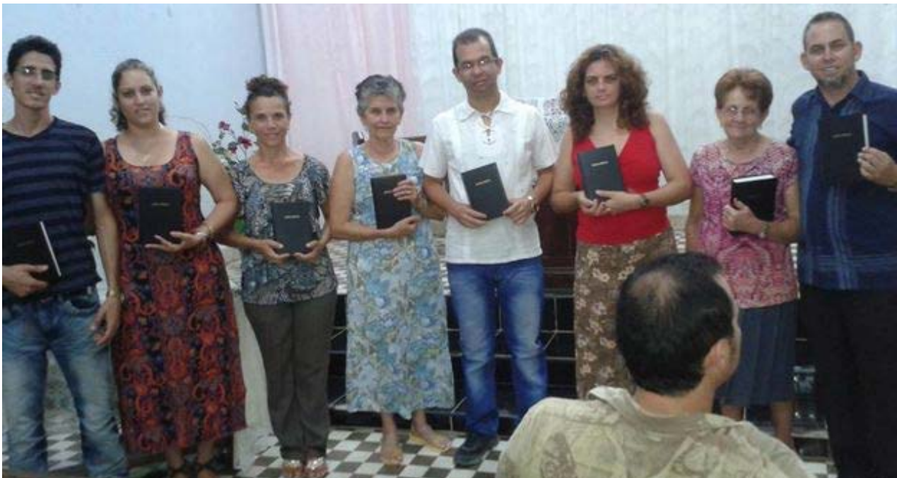
Escuela Bíblica de Verano en la que se repartieron gratuitamente 80 ejemplares de la Biblia.