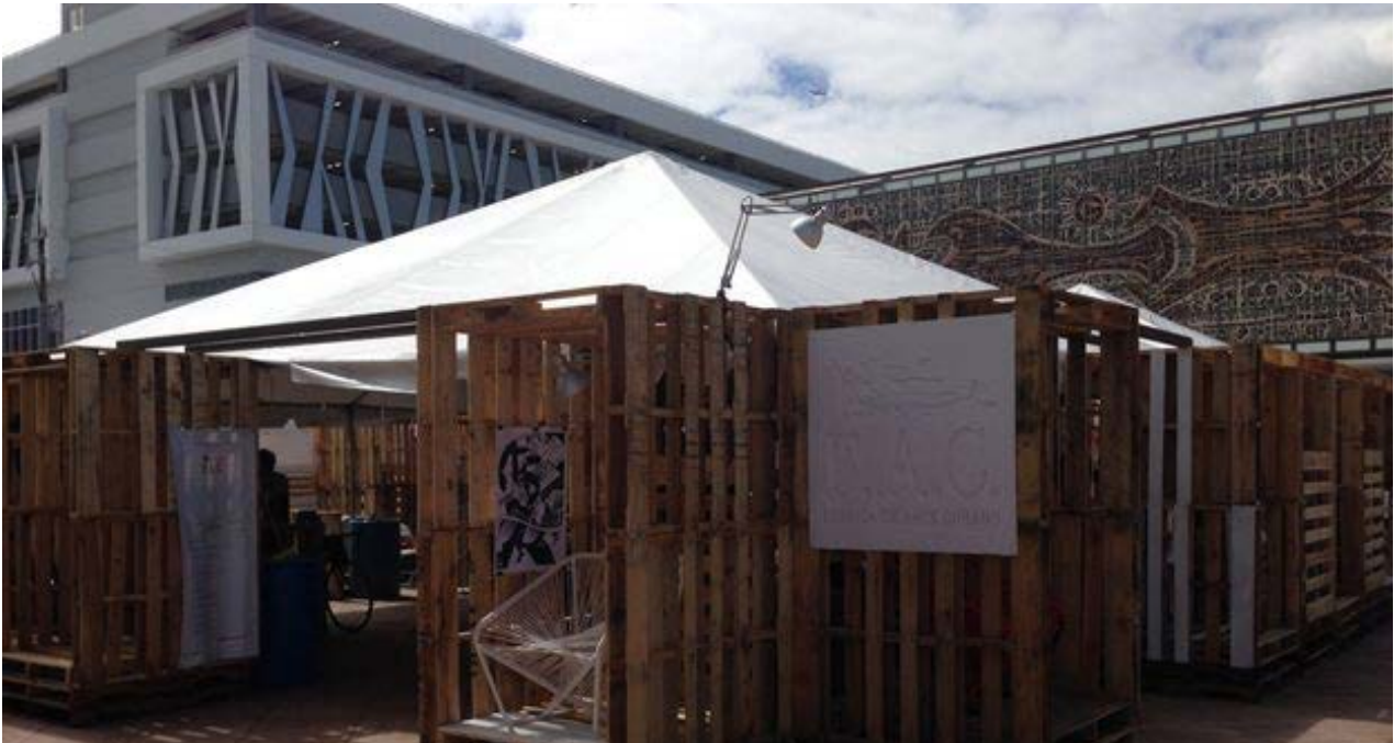
Pabellón cubano en la Miami Mini Maker Faire. Su nota distintiva es el uso de materiales reciclados.