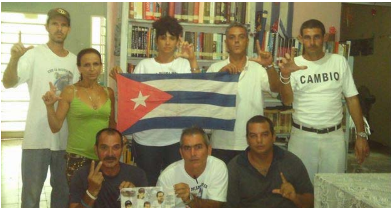
Miembros de la Comisión Política de Concilio Cubano reunidos en 2010.

Mientras para algunos de los asistentes fue recordar los años vividos, para otros fue asomarse a una historia que ha estado vedada a los cubanos durante decenios por intereses partidistas. La historia de Cuba en tres lecciones reclama continuidad. Conocida es la aseveración de que aquel pueblo que desconoce su historia está condenado a repetirla, o como decía Cicerón, "no saber lo que ha sucedido antes de nosotros, es como ser eternamente niños." Ya es hora de que crezcamos.