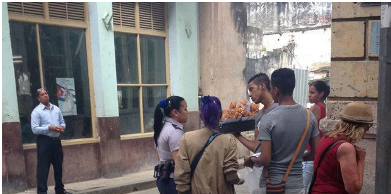
Una policía pide los documentos a un vendedor ambulante de alimentos en una calle de La Habana Vieja.