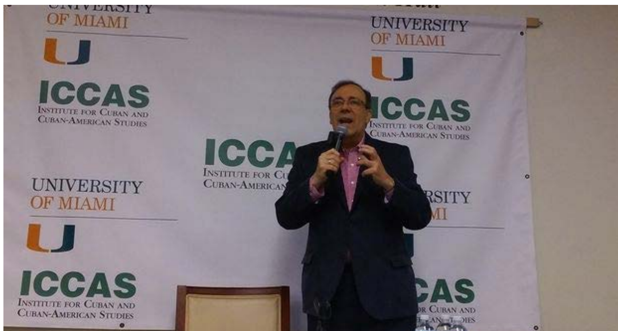
Carlos Alberto Montaner durante una de las conferencias que impartió en la Casa Bacardí.