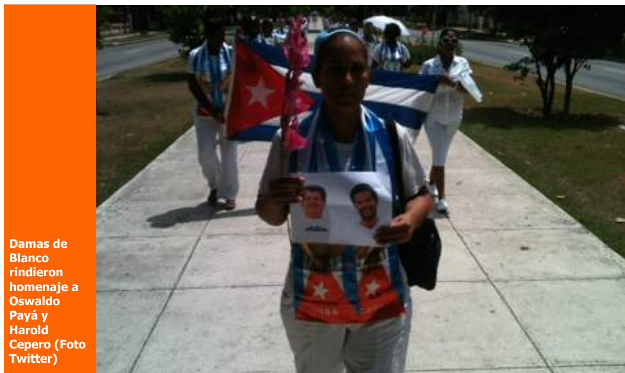
Damas de Blanco rindieron homenaje a Oswaldo Payá y Harold Cepero