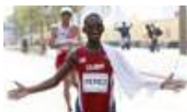
UN AMARGO CUARTO PUESTO EN TORONTO