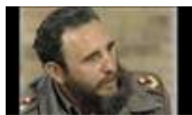
LA FALSA PROFECÍA DE FIDEL CASTRO