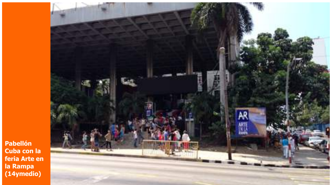
Pabellón Cuba con la feria Arte en la Rampa

Su cuerpo será expuesto durante la mañana de este martes y horas de la tarde en la funeraria de Calzada y K en el Vedado, La Habana.