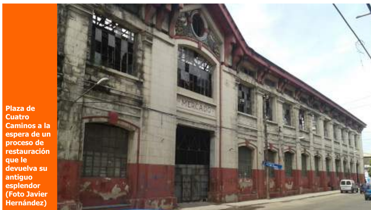
Plaza de Cuatro Caminos a la espera de un proceso de restauración que le devuelva su antiguo esplendor

Le bastaron unos meses en Cuba a Lanz Fuentes para darse cuenta de "la verdad verdadera de la actual realidad cubana, todas las mentiras que nos dice el Gobierno de Maduro sobre el Gobierno cubano y el fabuloso sistema propagandístico que tienen los Castros para seguir engañando al resto del mundo".