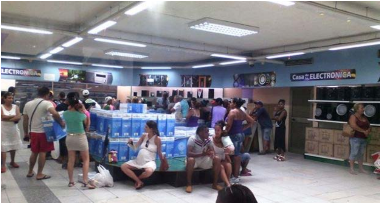
Cientes de una tienda de productos electrónicos en La Habana, en cola para comprar ventiladores.