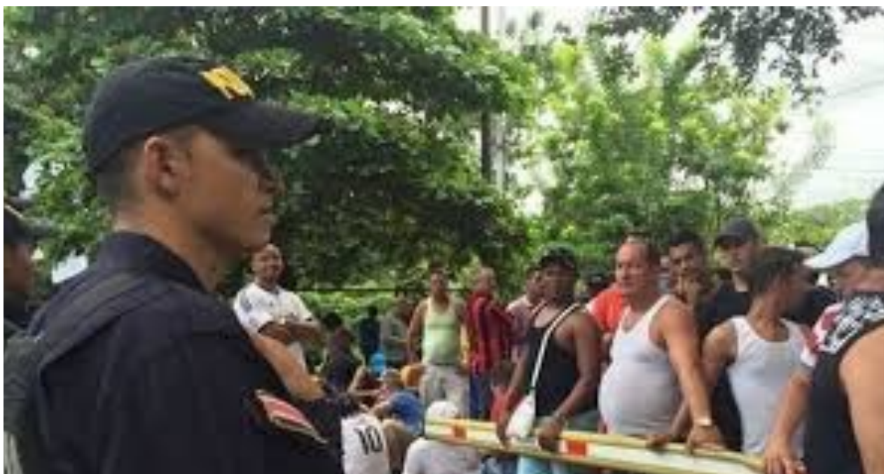
Cubanos Varados en Ecuador.