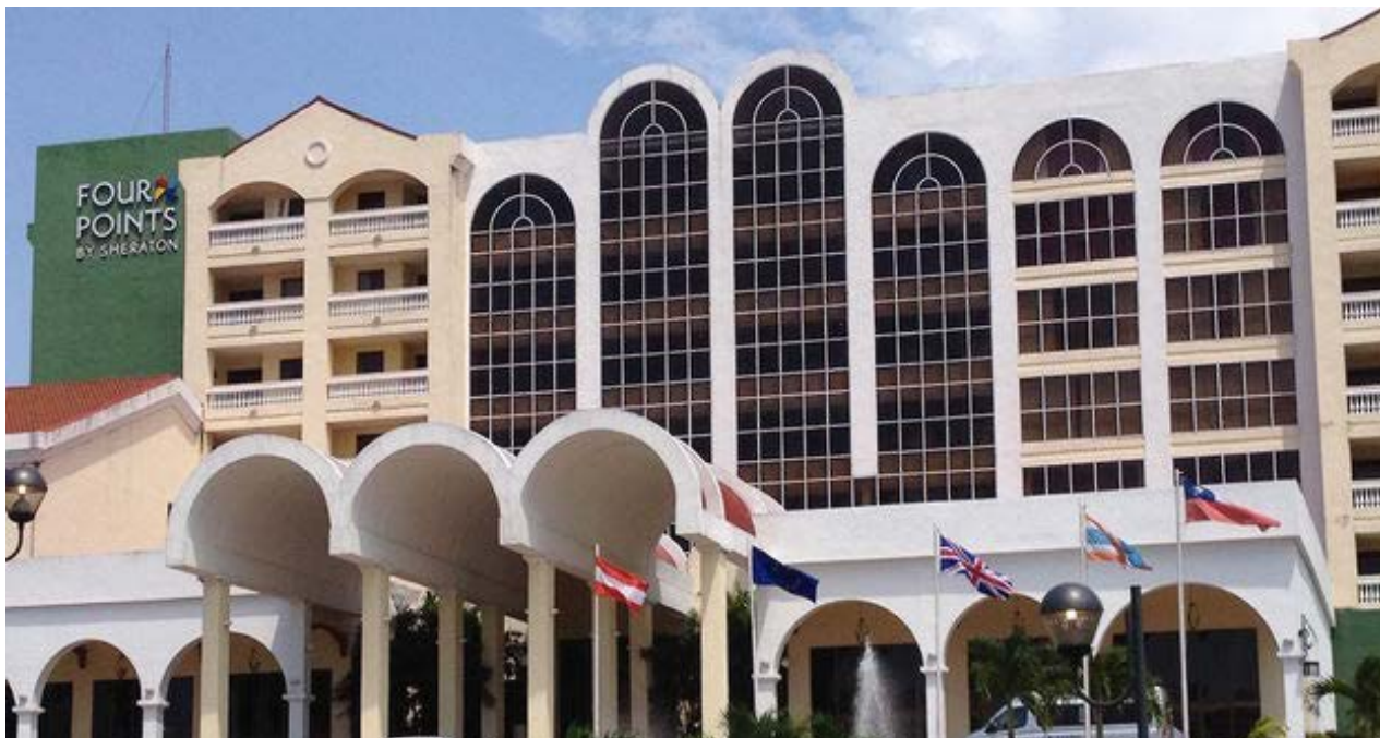
El Hotel Four Points abre sus puertas en La Habana.