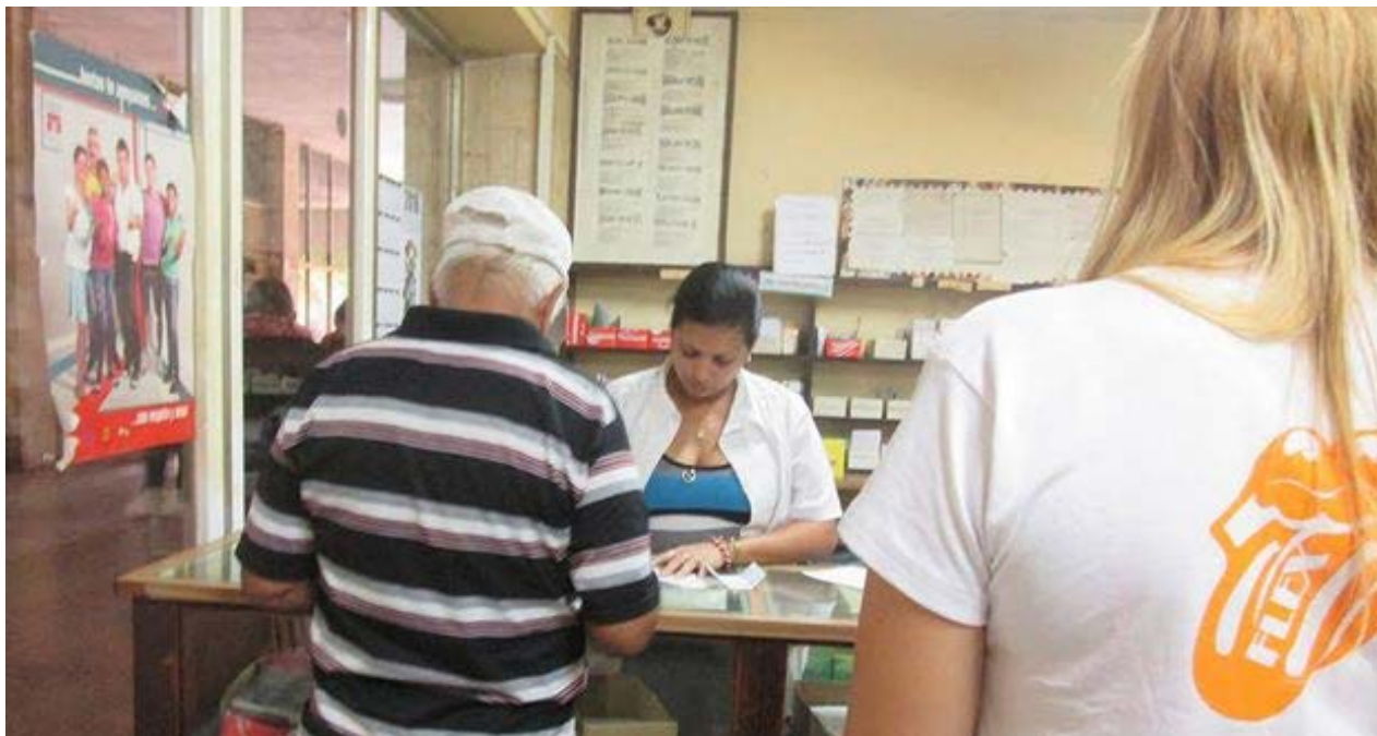
Farmacia en La Habana.