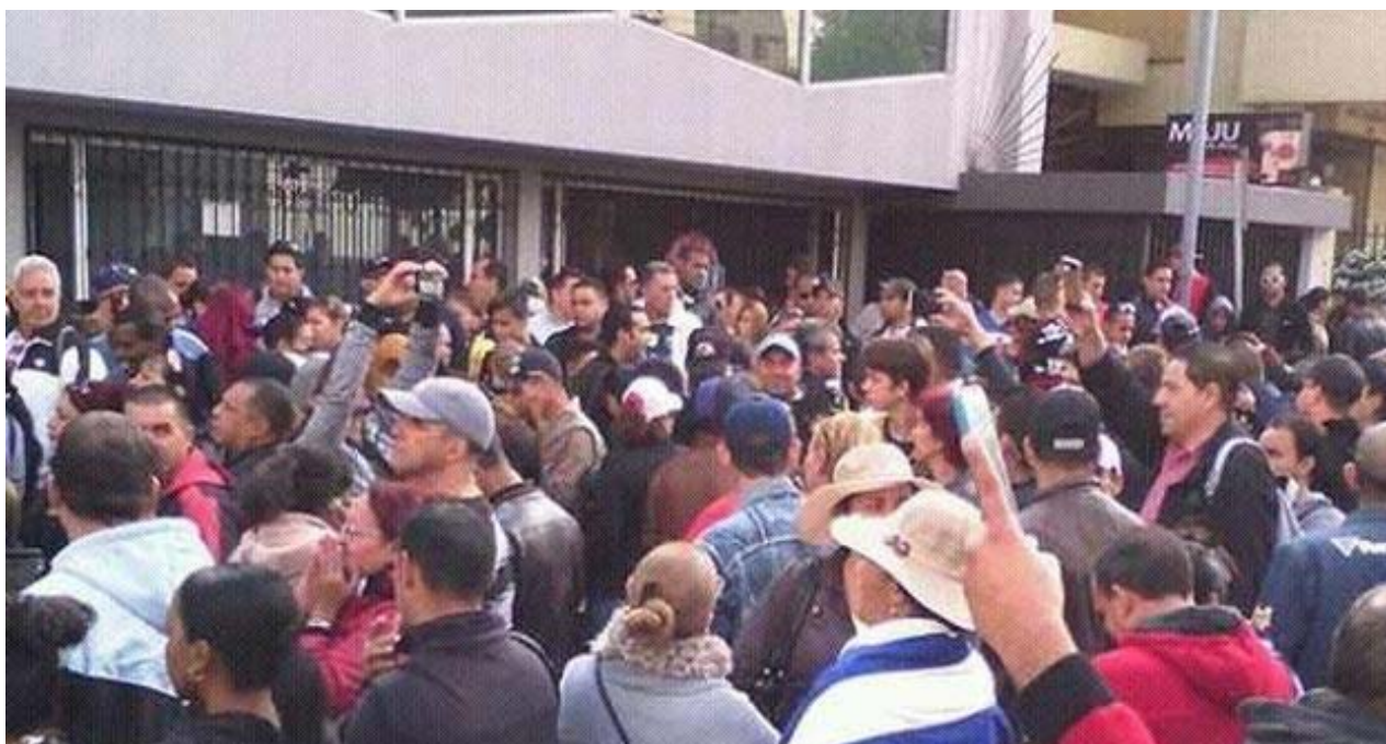
Concentración de cubanos.

Una selección con lo mejor de la semana del primer diario independiente hecho en Cuba