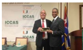
BISCET EN LA CIUDAD DE MIAMI