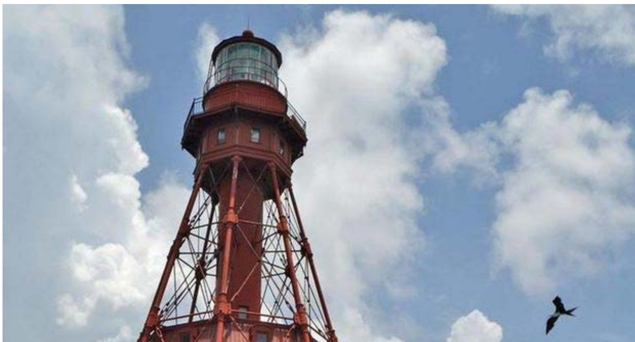
El faro American Shoal, cerca de las costas de Sugarloaf Key.