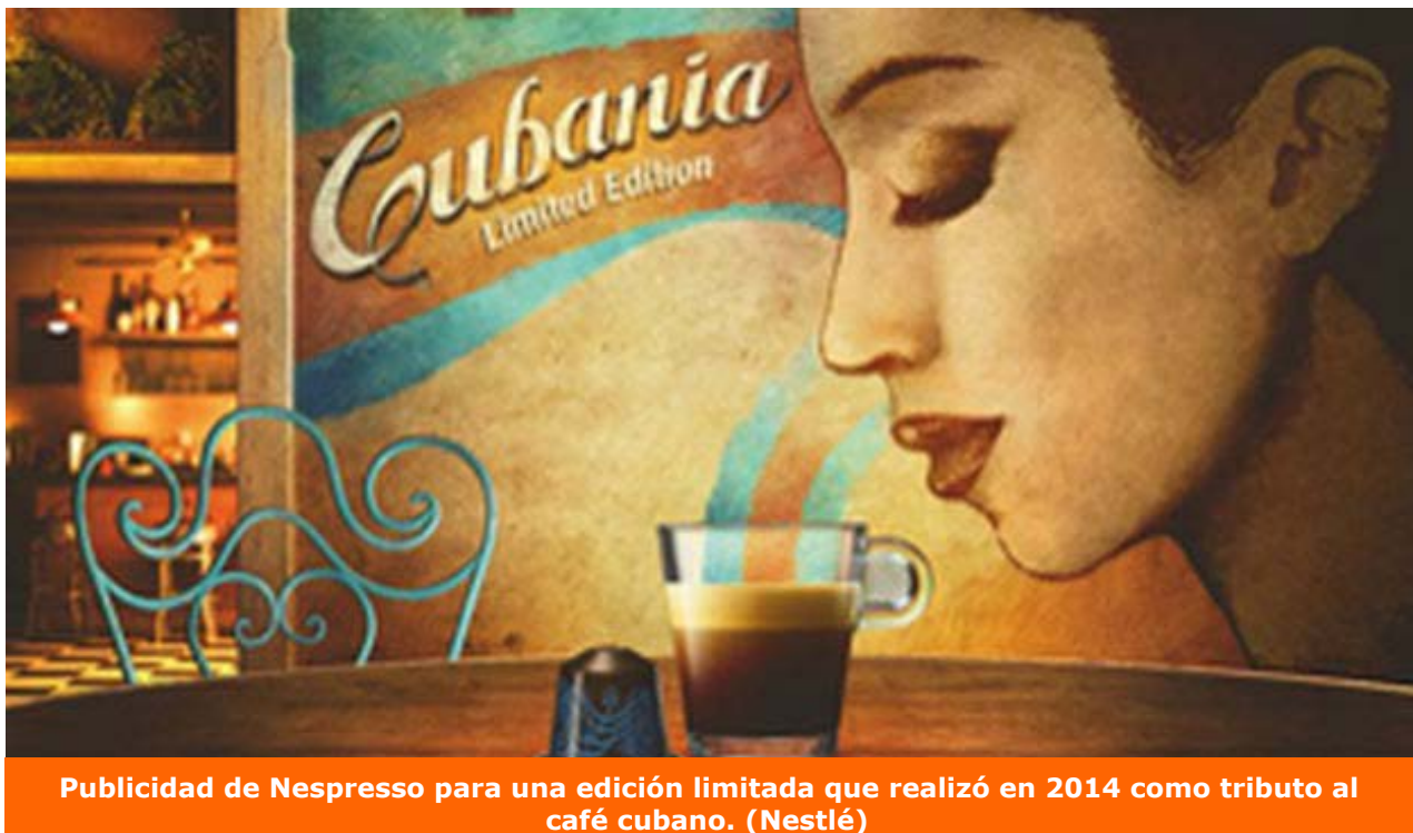
Publicidad de Nespresso para una edición limitada que realizó en 2014 como tributo al café cubano. (Nestlé)