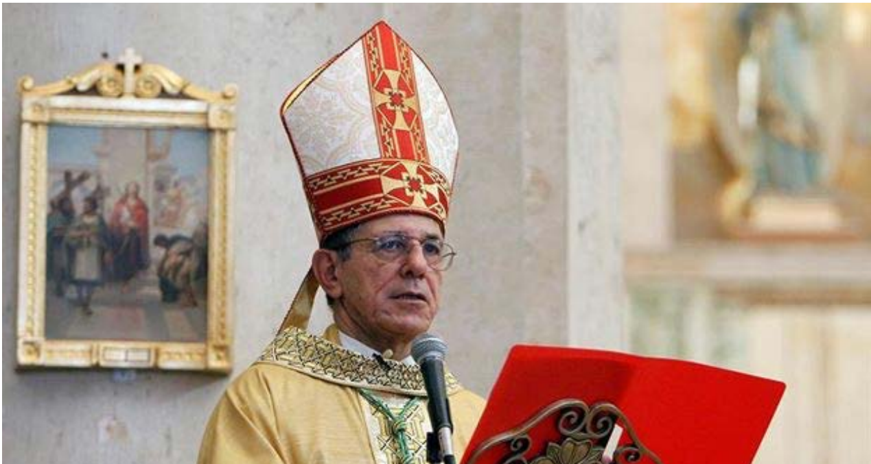
El arzobispo de La Habana, Juan de la Caridad García Rodríguez.

Activistas y opositores cubanos han denunciado con regularidad la confiscación por parte de las autoridades de literatura, computadoras, discos duros externos y también tarjetas de presentación. Por regla general, y a pesar de seguir el proceso de reclamación, los viajeros no logran recuperar sus pertenencias.