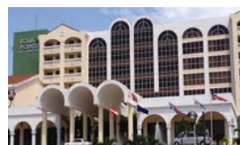
EE UU ABRE HOTEL EN CUBA