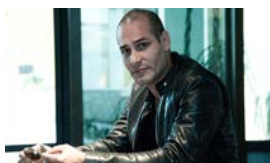
ACTORES TRABAJAN DE CAMAREROS