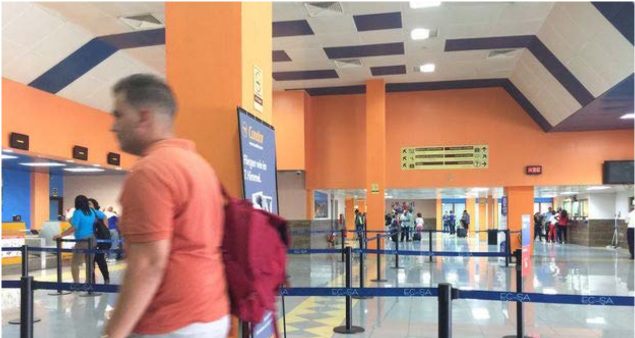
El aeropuerto de La Habana.