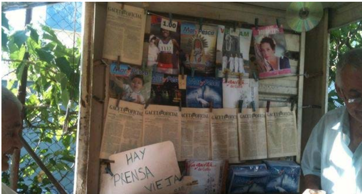
Venta de prensa en Cuba. (Luz Escobar)

autoridades cubanas, o que la intransigencia del Estado haya logrado doblegar las buenas intenciones de la Administración Obama. Pero de una cosa pueden estar seguros: el nuevo Cuban Nespresso Grand Cru, Cafecito de Cuba, tendrá sabor a sueños rotos, porque será hecho a costa de nuestros derechos.