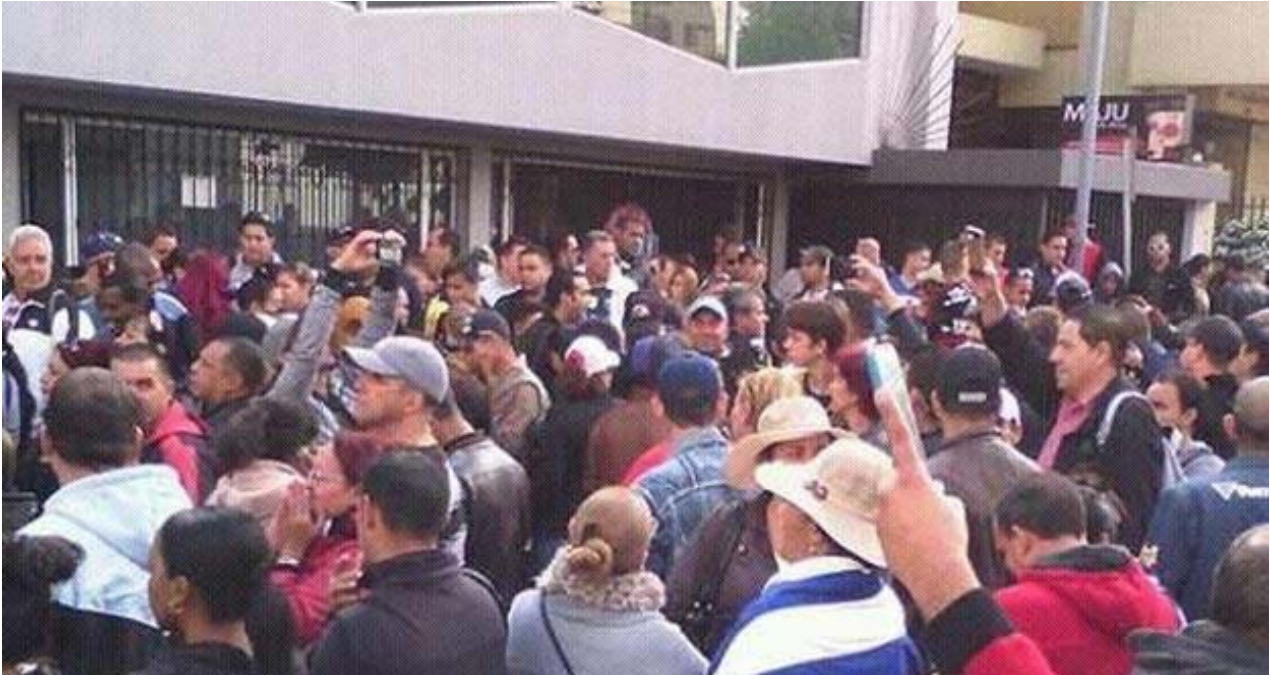
Concentración de cubanos ante la embajada de México en Quito.