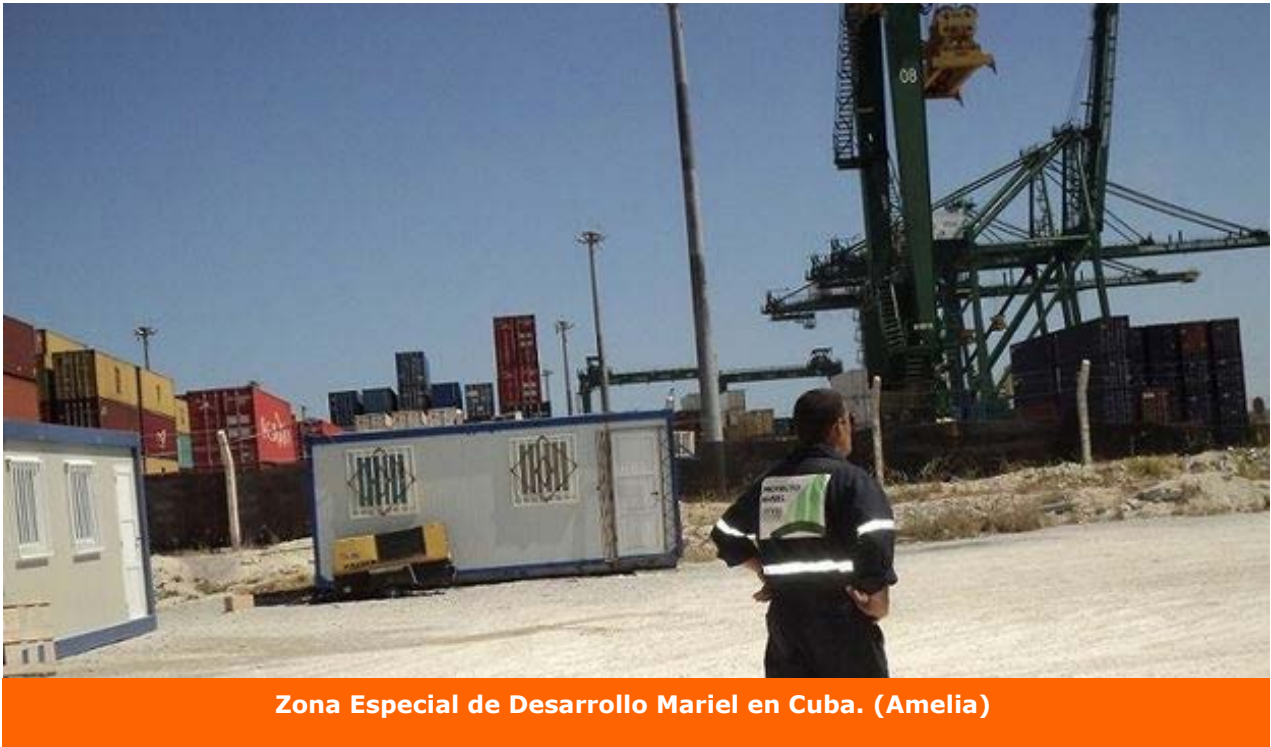
Zona Especial de Desarrollo Mariel en Cuba. (Amelia)