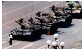
TIANANMEN Y EL SILENCIO