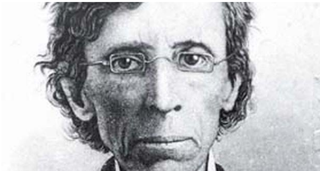
Félix Varela, "el primero que nos enseñó a pensar", como dijo su discípulo José de la Luz y Caballero.