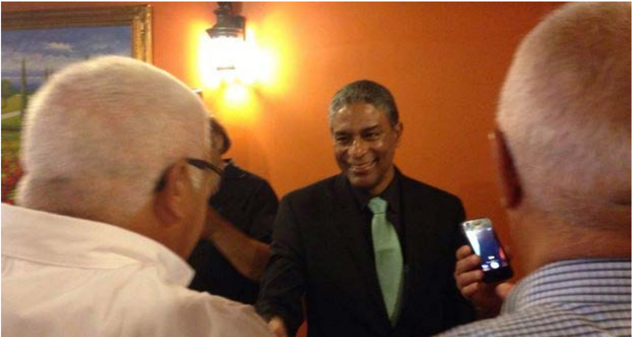
El doctor cubano Óscar Biscet tras su conferencia de prensa.