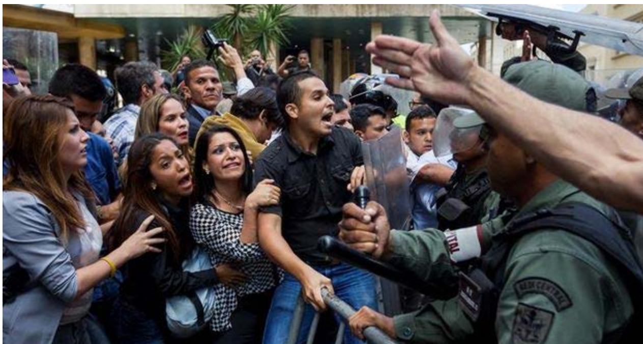
Diputados de la Asamblea Nacional participan en una manifestación en la sede del Consejo Nacional Electoral.