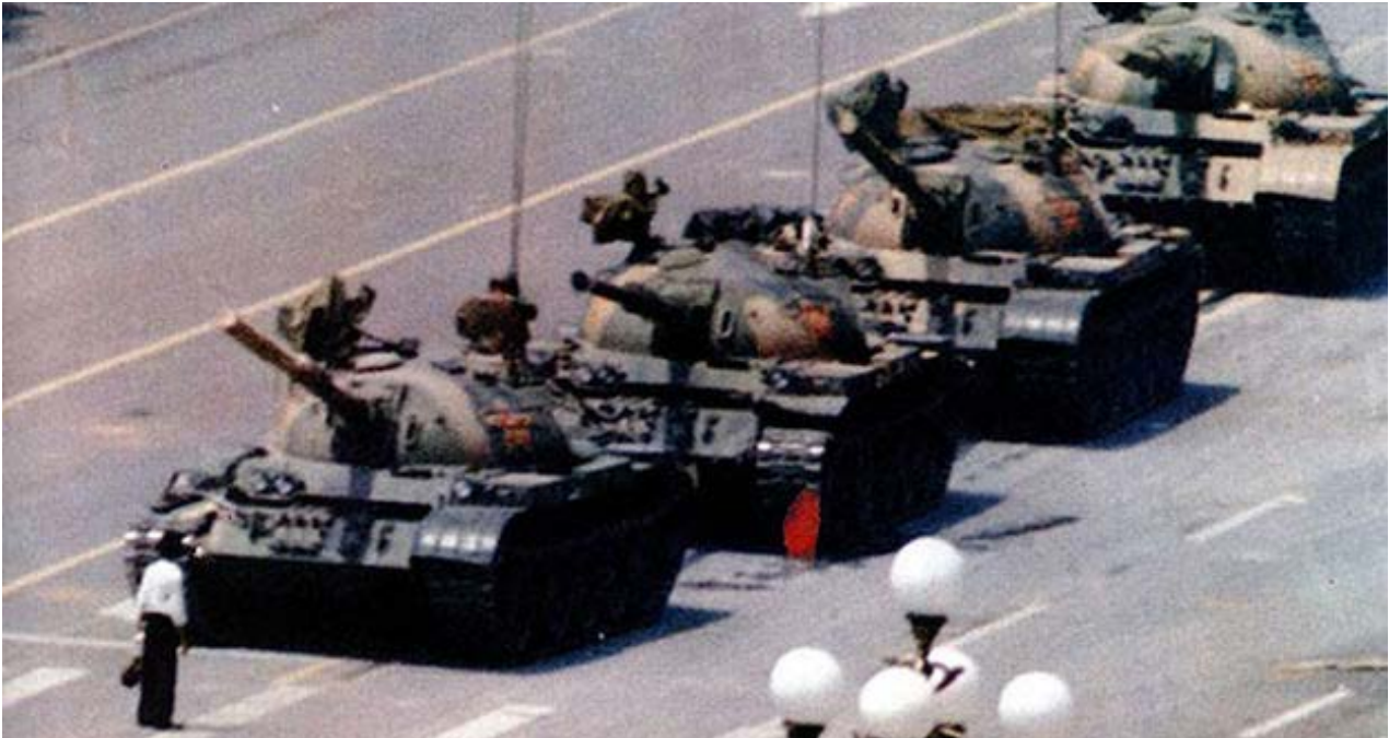
La plaza de Tiananmen en China fue escenario de protestas pidiendo más apertura en 1989