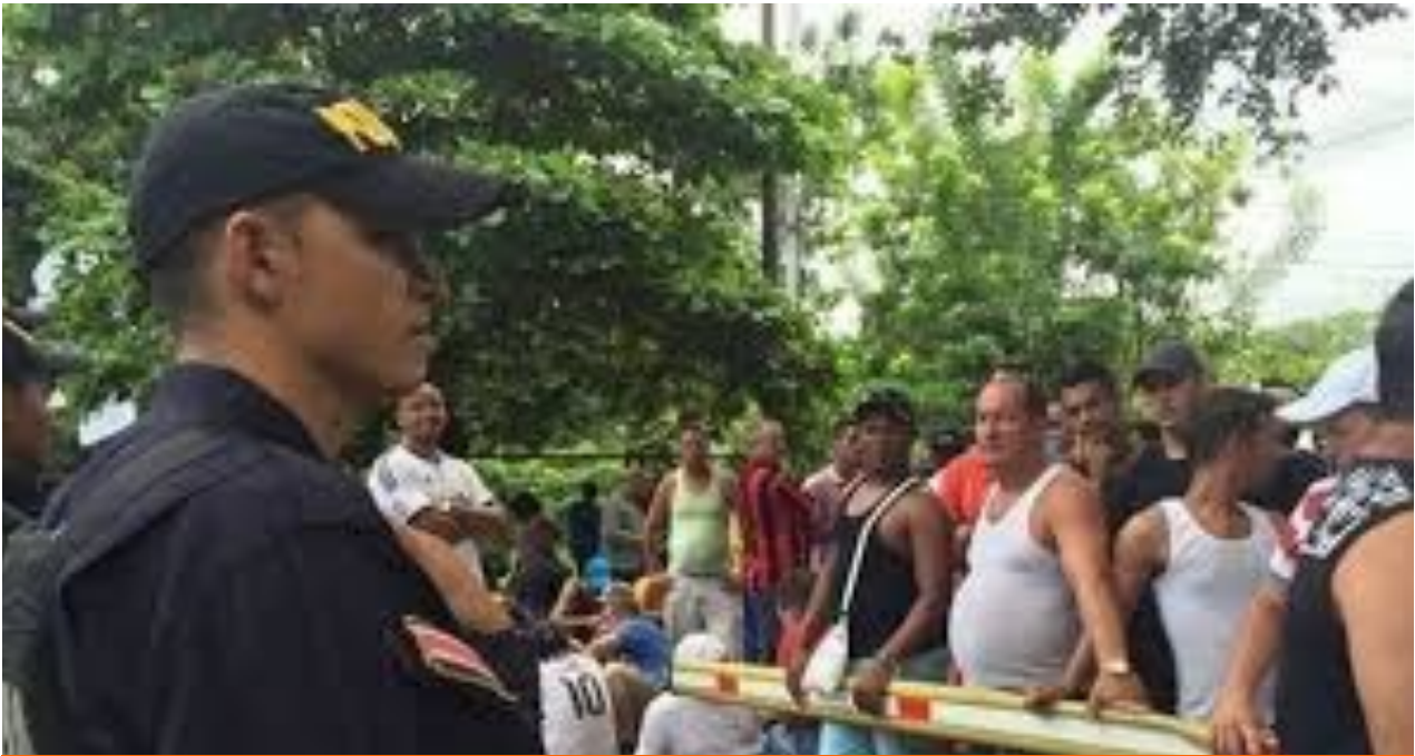
Cubanos Varados en Ecuador.