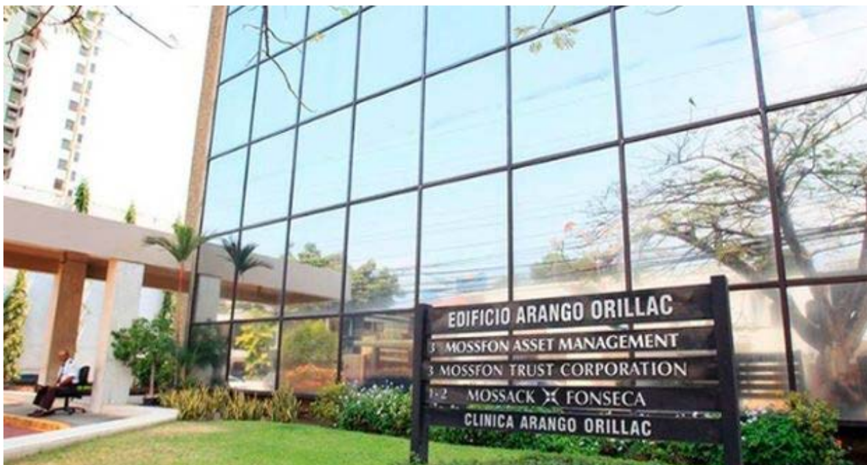
El edificio donde está ubicado el bufete Mossack Fonseca del caso Panamá Papers.