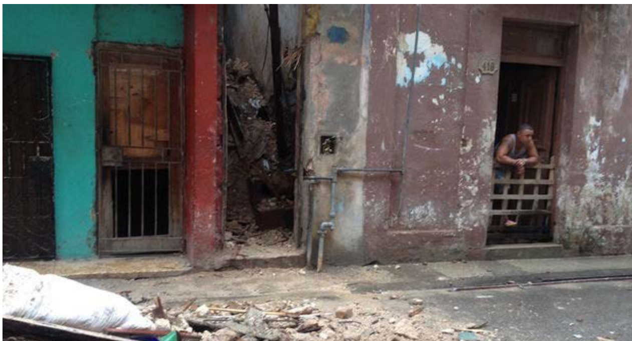
La fachada del 418, donde se puede ver la escalera llena de escombros.