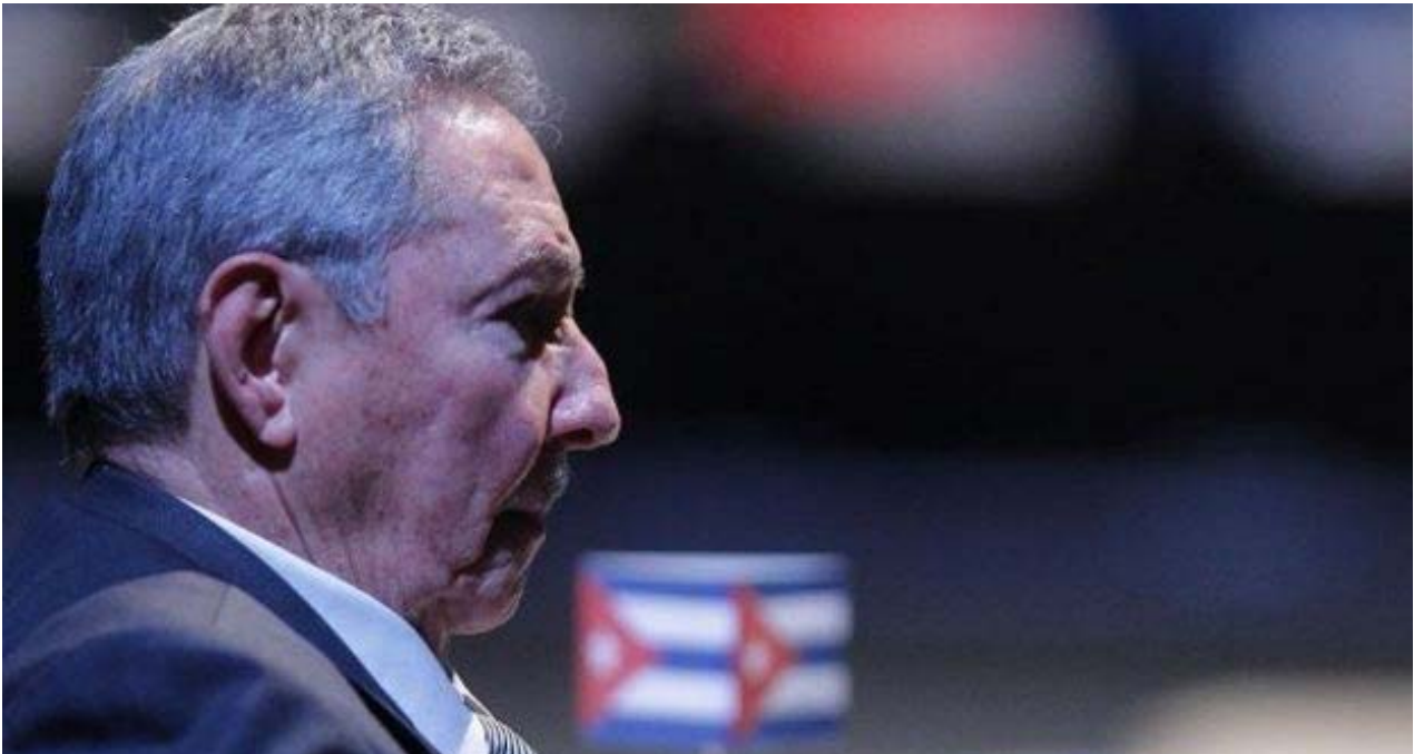
Raúl Castro, presidente de Cuba y primer secretario del Partido Comunista, nació en 1931.