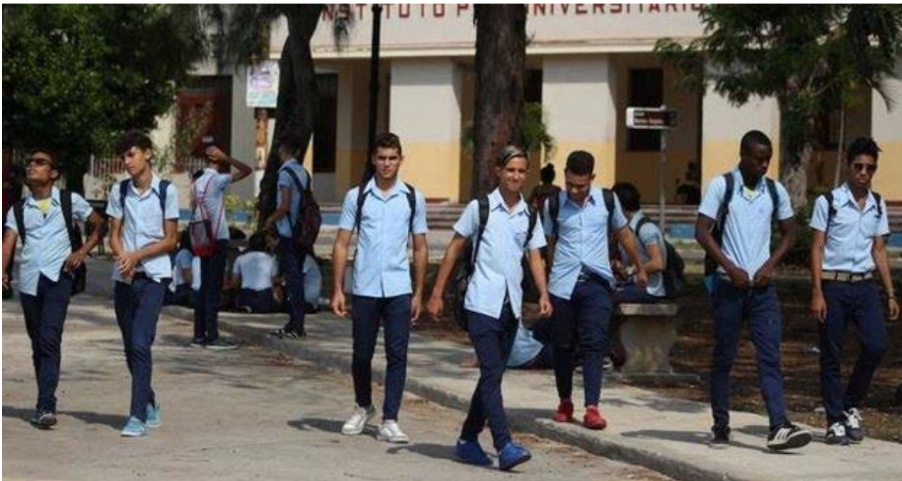
Estudiantes de la enseñanza media superior en La Habana.