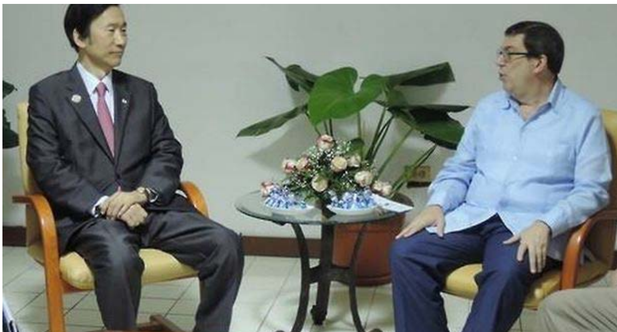
El canciller surcoreano Yun Byung-se y su homólogo cubano, Bruno Rodríguez, en La Habana.

Para unos se trata de un presunto espía, implantado por el omnipresente Departamento de la Seguridad del Estado cubana, con el fin de asegurar una fuente de divisas para el Gobierno de la Isla; para otros es el mesías que se propone llevar al pueblo a la tierra prometida, Estados Unidos, en medio de las turbulencias.