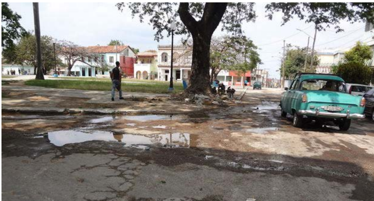
Las calles de La Habana carecen de reparaciones desde hace décadas.