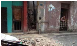
17 DERRUMBES POR LA LLUVIA