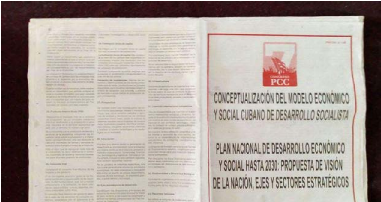
Conceptualización del Modelo Económico y Social Cubano de Desarrollo Socialista y Plan Nacional de Desarrollo y Social hasta 2030.