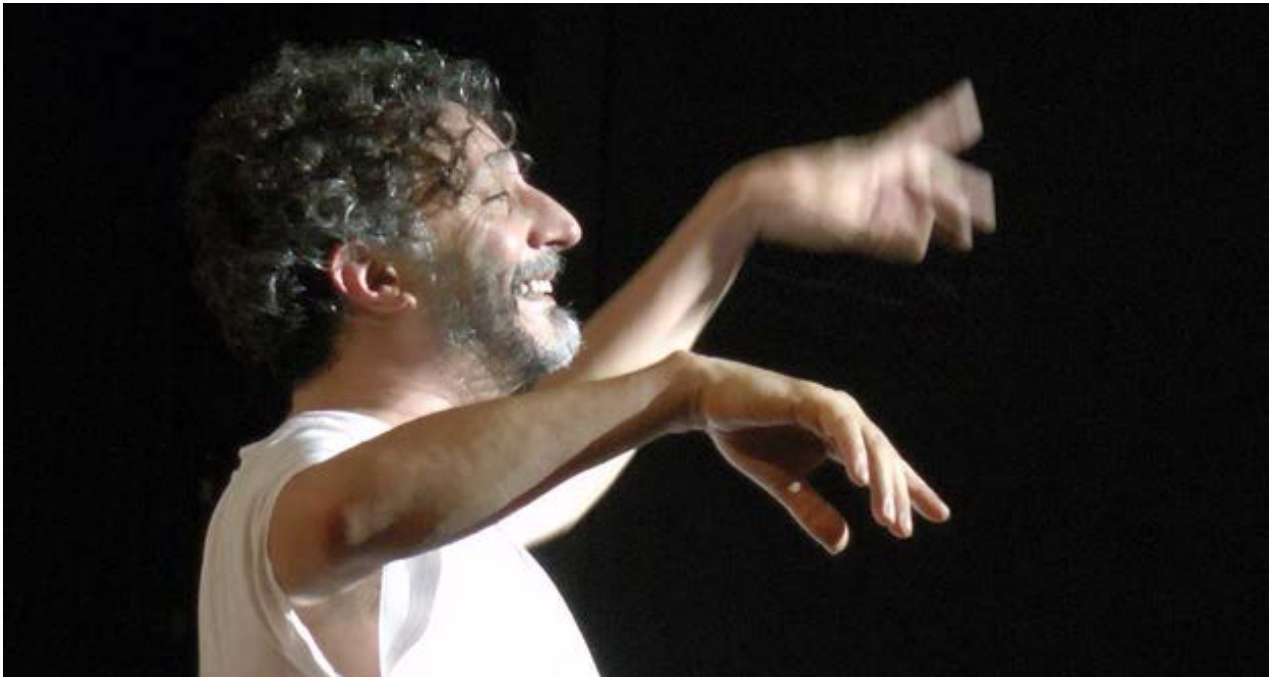
Fito Páez en el concierto de este lunes en La Habana.