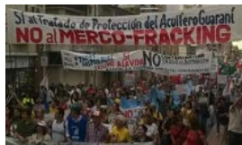
AMÉRICA LATINA ANTE EL 'BREXIT'