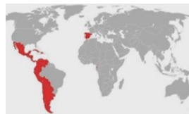
LA PATRIA ACÚSTICA