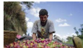
NESPRESSO Y EL CAFÉ CUBANO