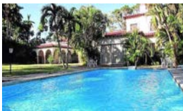
LA INQUIETANTE PAZ DE EL LAGUITO