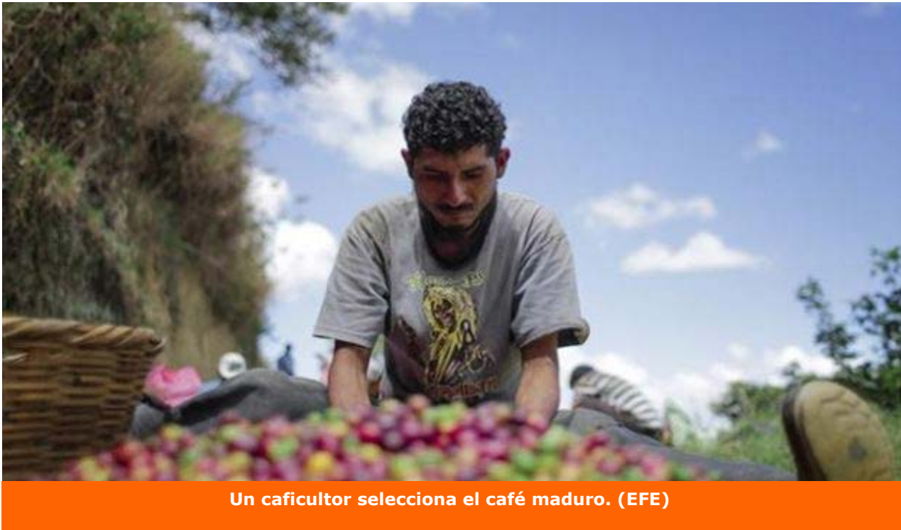
Un caficultor selecciona el café maduro.

a la política de pies secos/pies mojados, bajo la cual todo nacional cubano tiene refugio automáticamente después de pisar suelo norteamericano. En lo que va del presente año fiscal, que comenzó en octubre, más de 3.600 balseiros han sido interceptados en alta mar según la oficina de la Guardia Costera estadounidense.