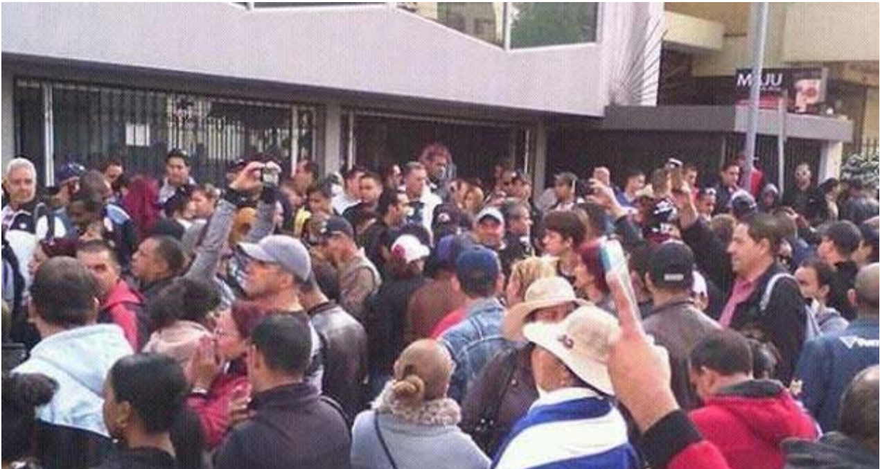
Concentración de cubanos ante la embajada de México en Quito.