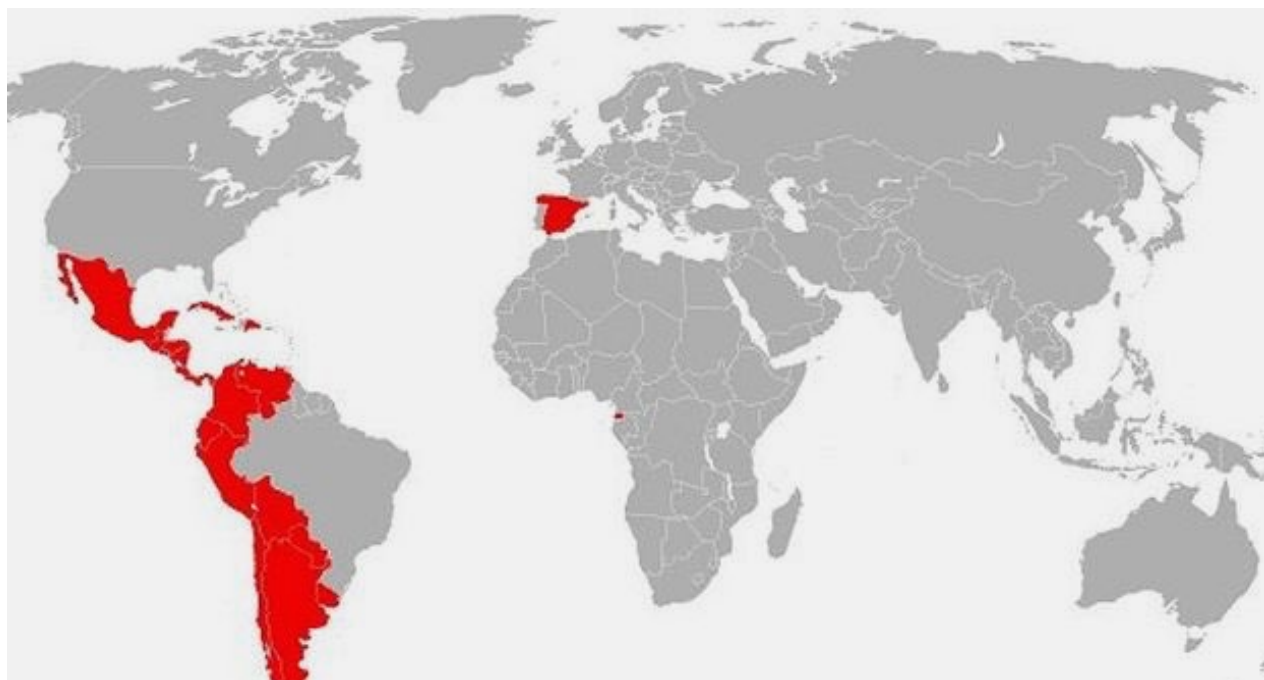
Mapa de países en los que se habla español.