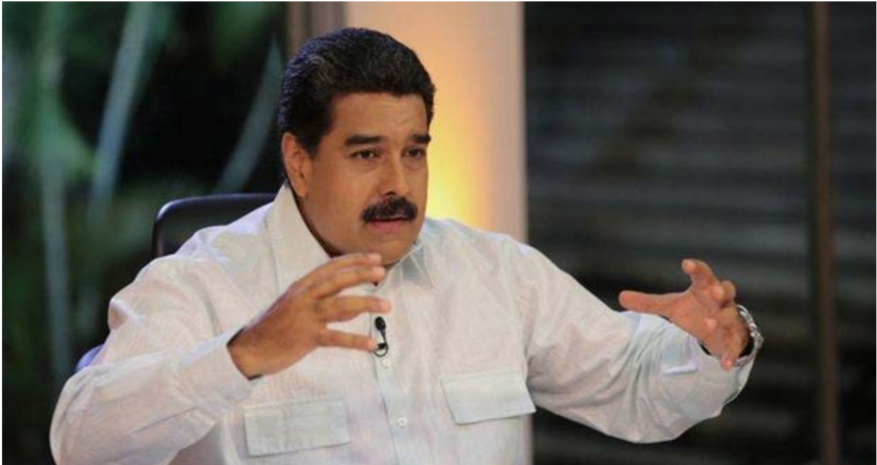
El presidente venezolano este martes en su programa En contacto con Maduro.

Los médicos cubanos no escapan solo hacia EE UU. Miles aprovecharon la brecha entre la aplicación de la nueva política migratoria cubana en 2012 y el cierre en 2015 para establecerse en países como Ecuador, donde sus títulos eran reconocidos y podían incorporarse al sistema sanitario nacional.