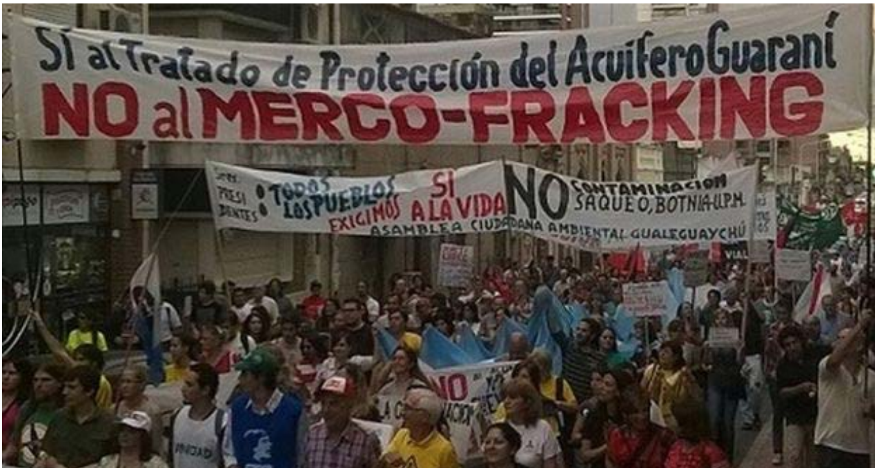
Manifestación en Paraná contra los gastos de la Cumbre de Mercosur en 2014.