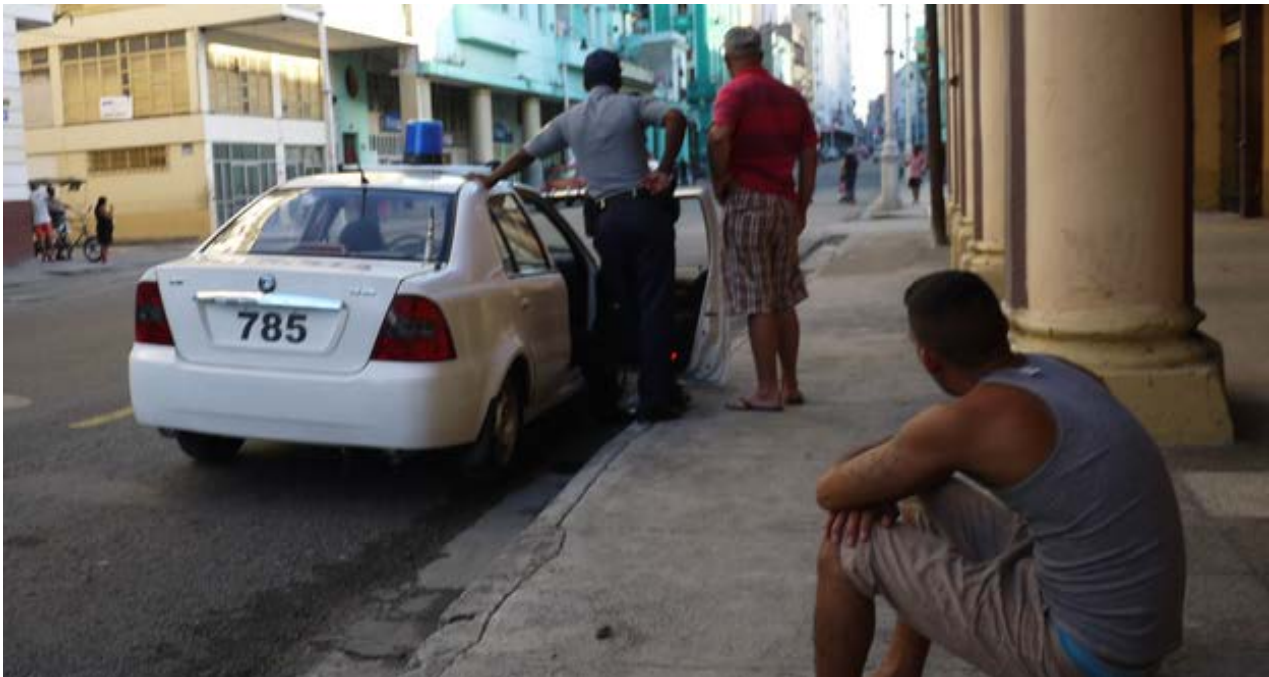
El mayor temor de los residentes ilegales en La Habana es que la policía les exija mostrar el carné de identidad.

Sin embargo, las amenazas no disuaden a muchos que prefieren pasar la convalecencia en la "trinchera" de su casa. Allí, sin mosquiteros o repelentes se aproxima el sigiloso enemigo que todo el país está buscando. Basta una pequeña picadura y se vuelve a perder una batalla.