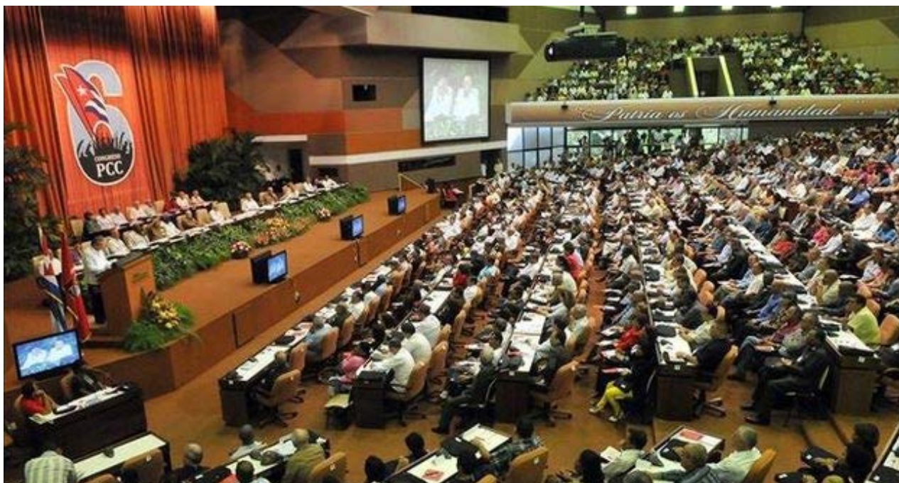
El Palacio de las Convenciones durante el VI Congreso del Partido Comunista de Cuba.