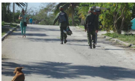
UN ENEMIGO SOBRE LA HABANA