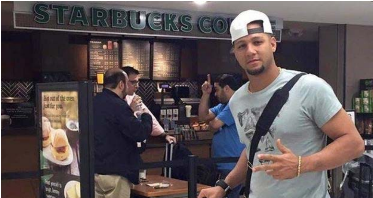
Yulieski Gourriel en el aeropuerto de Miami.