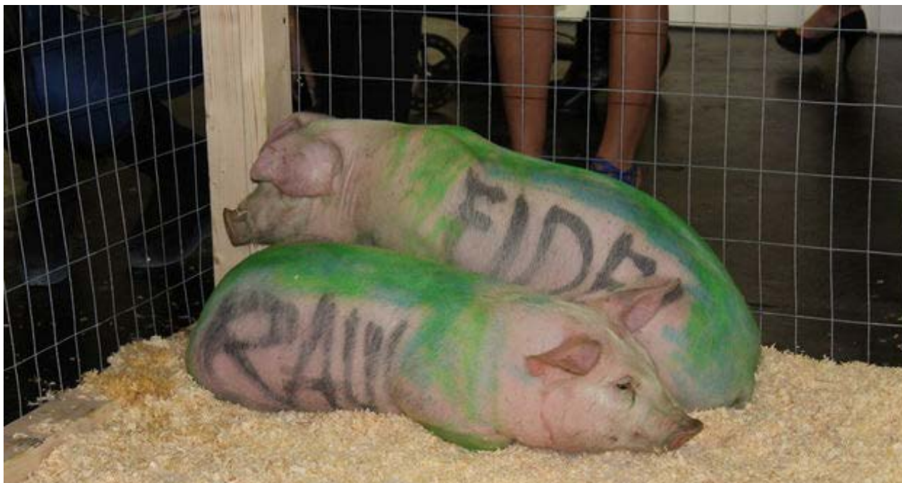
'Raúl' y 'Fidel', los cerdos de la performance prohibida en Cuba, salieron este jueves a desfilarse por la Market Gallery de Miami. (14ymedio)