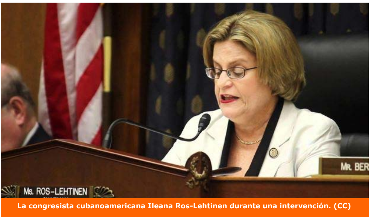
La congresista cubanoamericana Ileana Ros-Lehtinen durante una intervención.