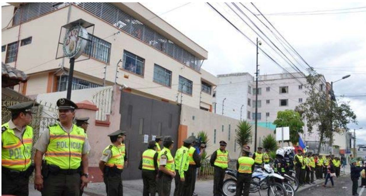
A las afueras del hotel-prisión un cordón de policías vela porque los cubanos allí recluidos no puedan salir.