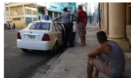
ALCANZAR EL SUEÑO HABANERO