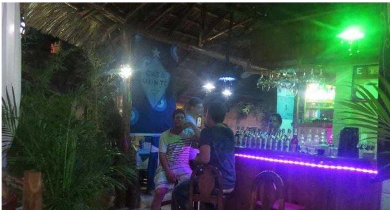
Paladar Casa Monte en el poblado de Herradura.