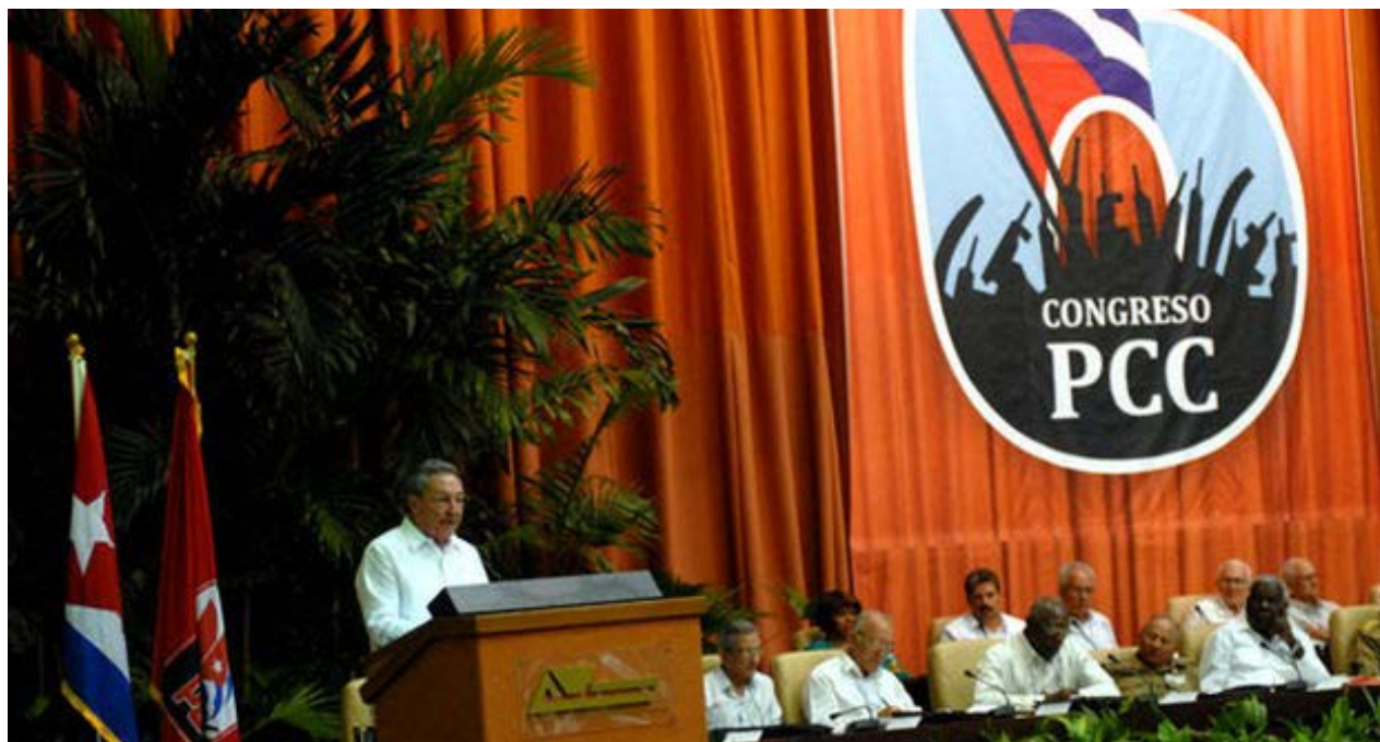
El presidente Raúl Castro en la inauguración del VI Congreso del Partido Comunista de Cuba.