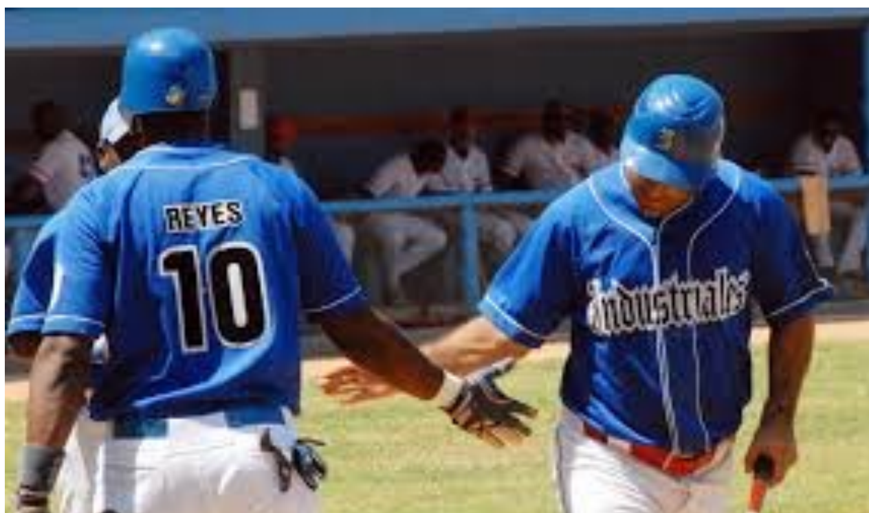
Jugadores del Equipo Industriales.