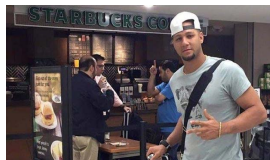
LOS GOURRIEL LLEGAN A MIAMI