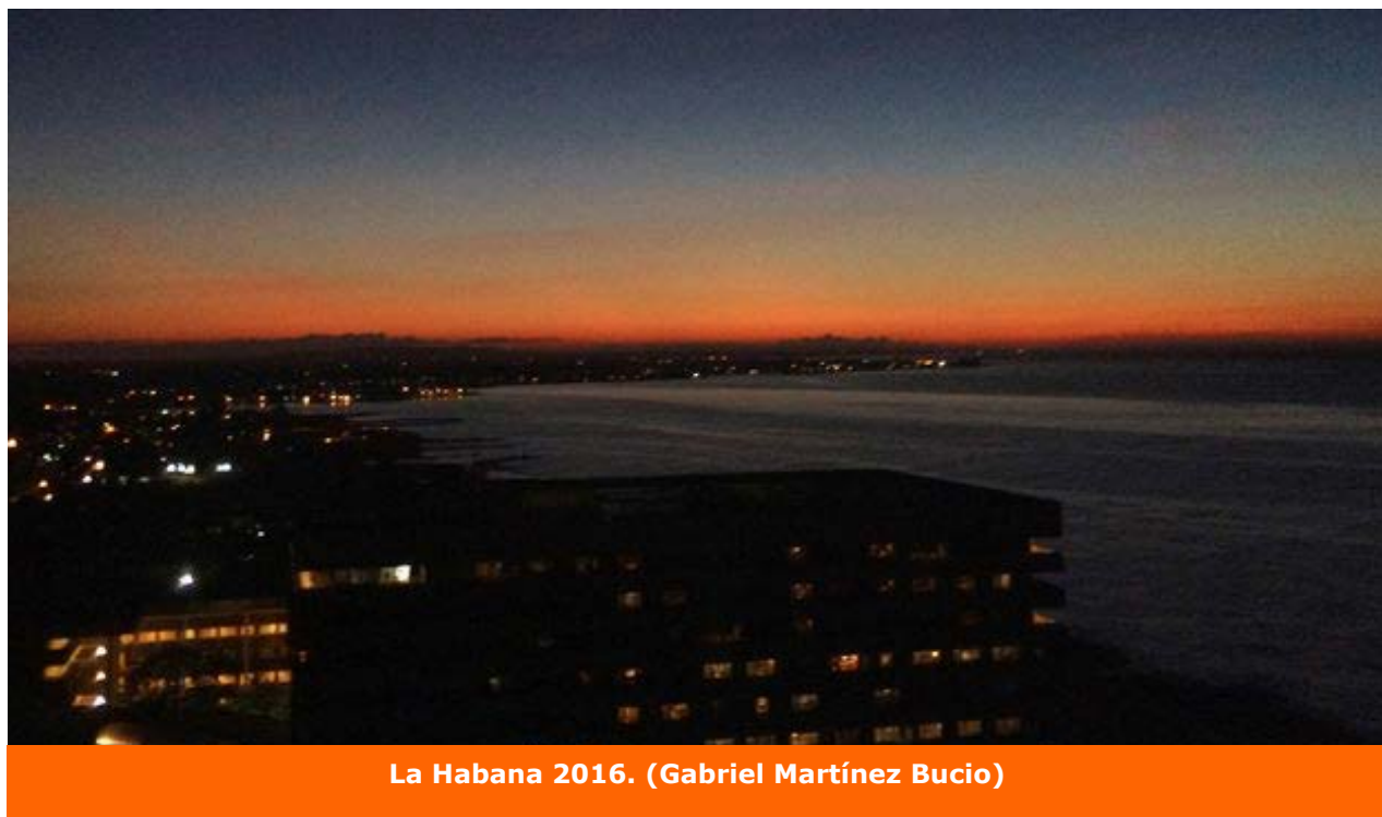
La Habana 2016. (Gabriel Martínez Bucio)