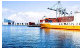
NUEVAS RESTRICCIONES A LAS IMPORTACIONES