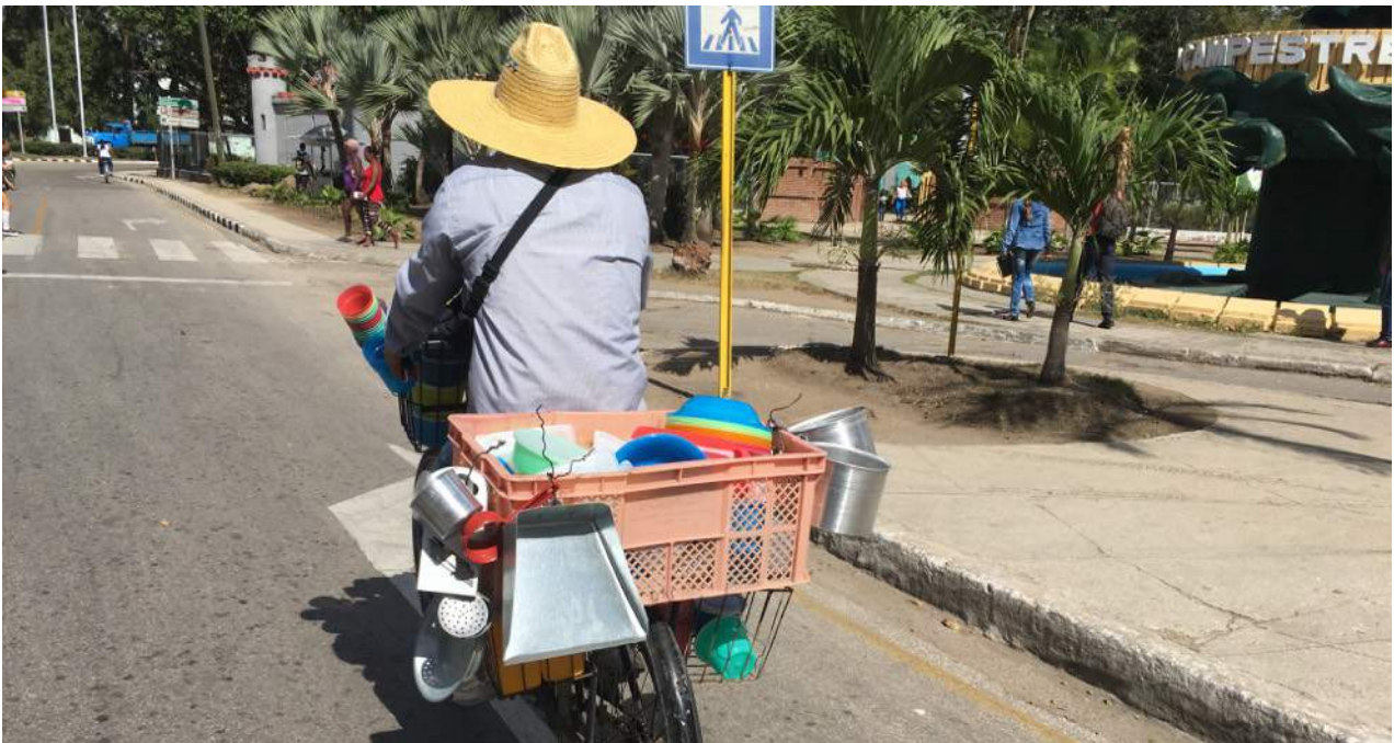
Un vendedor de utensilios domésticos vende su mercancía en las calles de la ciudad ed Camagüey.