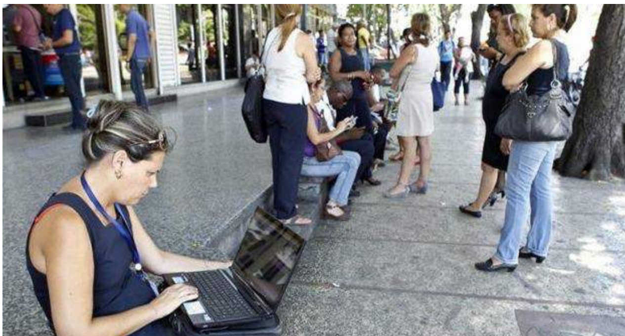
Una mujer se conecta a internet en la zona wifi de La Rampa en La Habana.