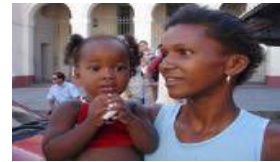
24 HORAS NO SON TODA LA VIDA DE UNA MUJER