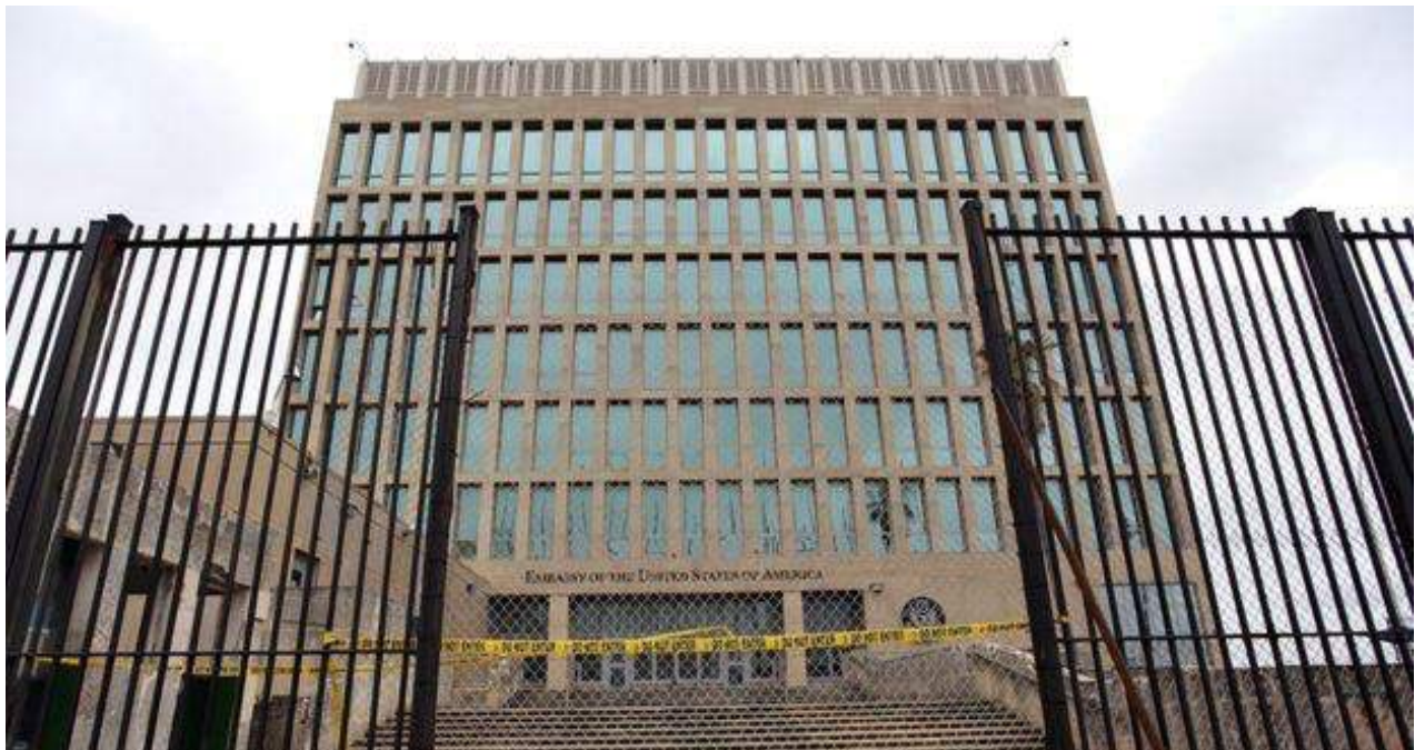
La embajada de EE UU en La Habana ha quedado bajo mínimos a partir del incidente, aún sin explicación oficial.

"Si tengo que ir hasta el fin del mundo por estar con mis seres queridos lo haría. Ningún dinero puede pagar el valor de una familia", agrega.