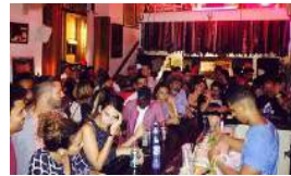
CUBA VISTA A TRAVÉS DE LA SEXUALIDAD