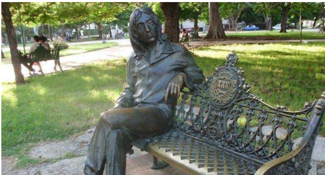
Estatua de bronce de John Lennon en La Habana, donde cientos de turistas se sientan a su lado diariamente.