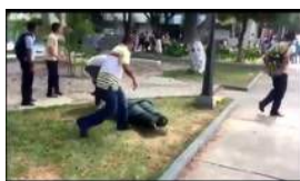
DERRIBAN UNA ESTATUA DE CHÁVEZ