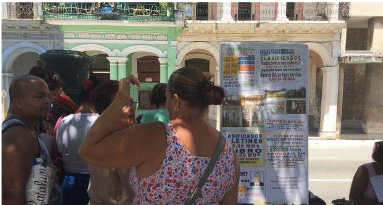
La "bolsa de permutas" en el Prado habanero, el mercado inmobiliario al aire libre más importante de la Isla, se ha transformado en los últimos meses.