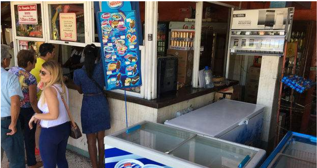
El desabastecimiento de helados Nestlé es consecuencia del funcionamiento irregular de la fábrica de la compañía, que está en un proceso de sustitución de calderas.