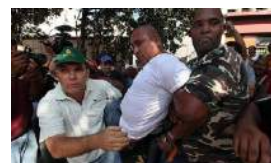
SE DUPLICAN LOS PRISIONEROS POLÍTICOS