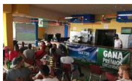
LA FIESTA DEL FÚTBOL SE INSTALA EN CUBA