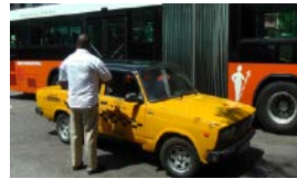
LAS FALSAS COOPERATIVAS DE TRANSPORTE