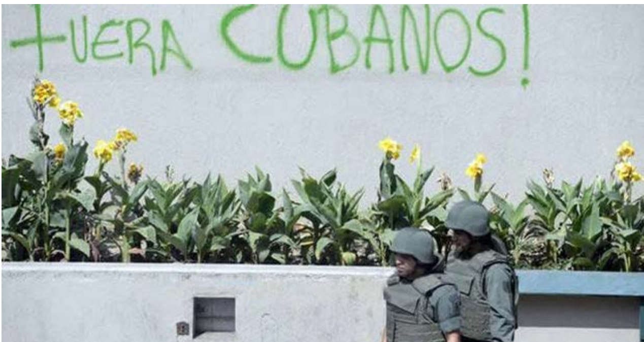
Los médicos cubanos son vistos desde la oposición como un ejército de ocupación. (D.R.)

Una selección con lo mejor de la semana del primer diario independiente hecho en Cuba