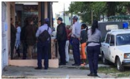
CONVIVENCIA: "NO NOS VAMOS DE CUBA"