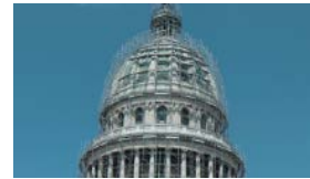
RUSIA "FORRA DE ORO" LA CÚPULA DEL CAPITOLIO