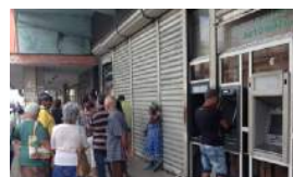
DÓNDE GUARDAN LOS CUBANOS EL DINERO