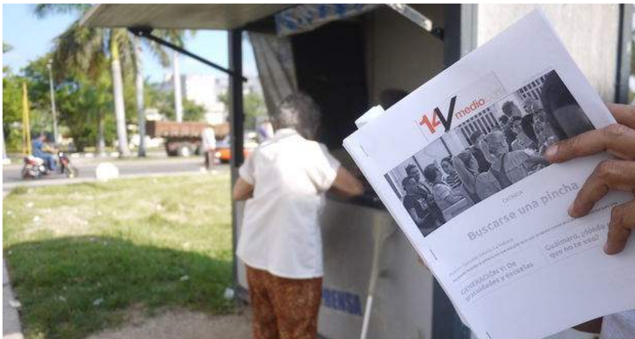
Un hombre lee la versión impresa de '14ymedio' que circula en formato PDF dentro de Cuba.