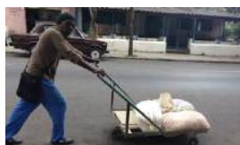
LOS RIESGOS DEL DELITO ECONÓMICO