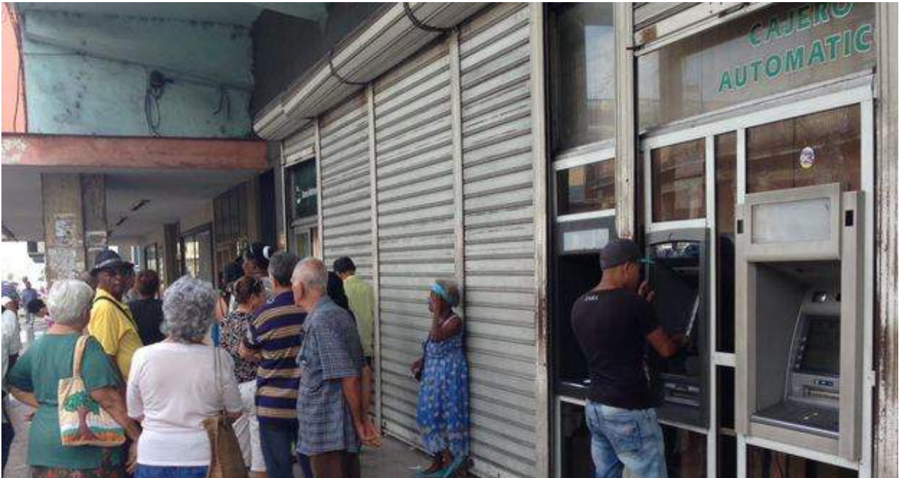
Un hombre intenta sacar dinero en un cajero automático a las afueras de un Banco Metropolitano en La Habana.

"Los rendimientos del sector están estancados o han decrecido ligeramente" advierte el informe, que pronostica que en la medida en que la agricultura "no aumente sus rendimientos y explote su potencialidad productiva, la economía tendrá que asumir importantes erogaciones para poder suplir su demanda interna".