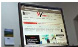
LECTORES OPINAN SOBRE '14YMEDIO' EN SU TERCER AÑO