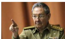
EL 'RAULISMO' APURA LAS TAREAS PENDIENTES