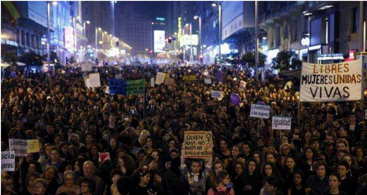
La marcha por el 8 de marzo, Día de la Mujer, en Madrid.