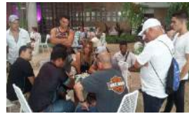
EL CAPABLANCA COMIENZA SIN LEINIER DOMÍNGUEZ