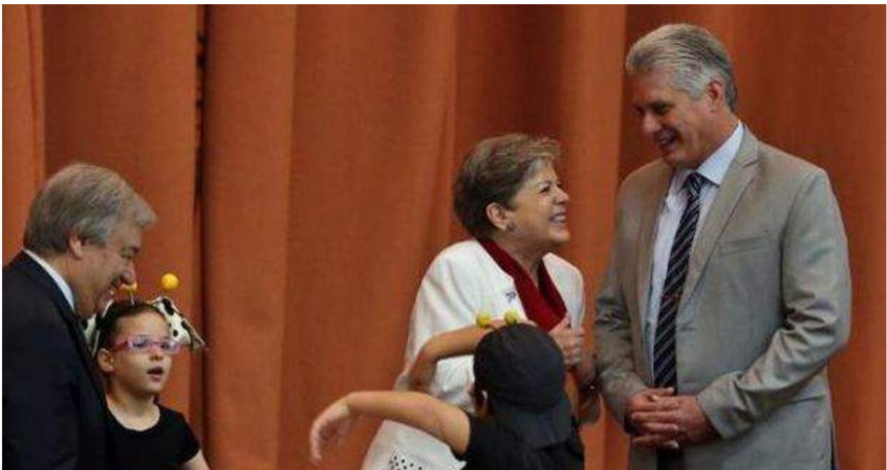
Alicia Bárcena, secretaria ejecutiva de Cepal, junto al presidente Miguel Díaz-Canel.

Una selección con lo mejor de la semana del primer diario independiente hecho en Cuba