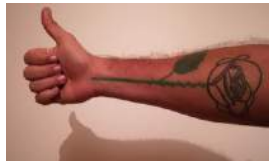
LOS JÓVENES CINEASTAS CIERRAN FILAS