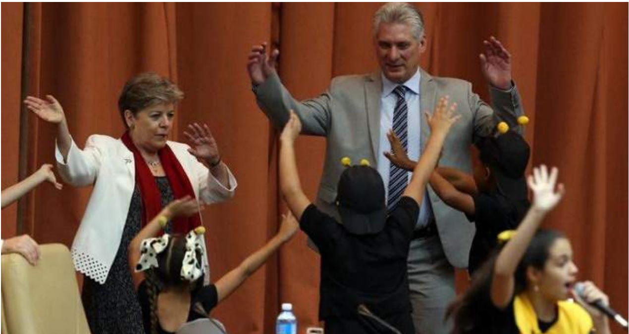
Alicia Bárcena, secretaria ejecutiva de Cepal, junto al presidente Miguel Díaz-Canel.