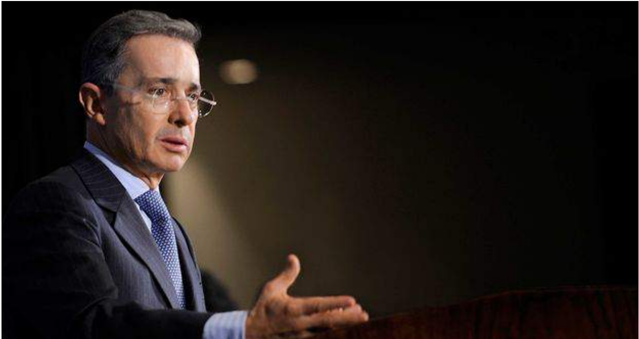
El expresidente de Colombia, Álvaro Uribe.

Además, el texto finalizaba con un elogio a las Damas de Blanco, algo que sin duda no ha gustado al diplomático y que se refleja en su rechazo a lo que llaman promoción del negocio de la disidencia.