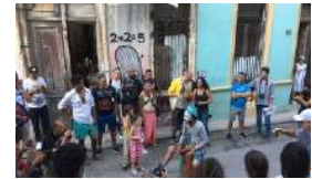
SE INAUGURA LA #00BIENAL INDEPENDIENTE