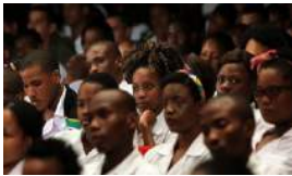
ABRIL SE SALDA CON MÁS DE 300 ARRESTOS