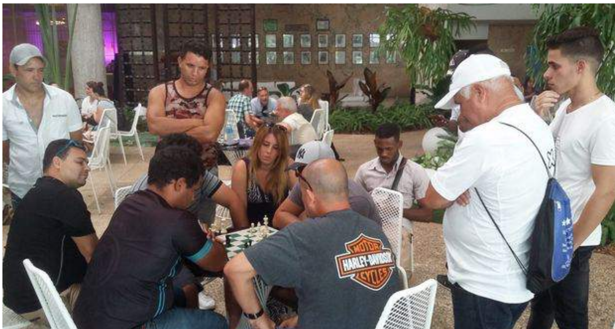
Inicios de la edición 53 del Torneo Internacional de Ajedrez Capablanca In Memoriam en La Habana.