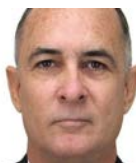
EL PERIODISMO EN CUBA HOY