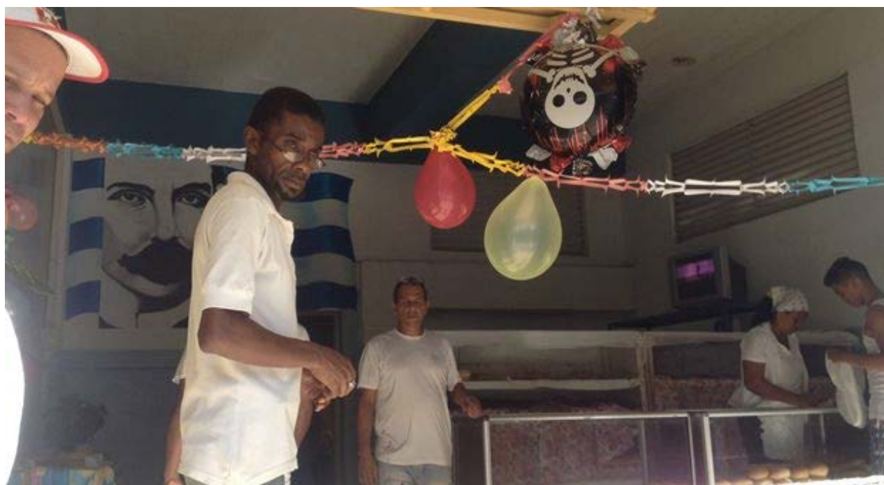
Una panadería estatal mostraba su decoración por Halloween