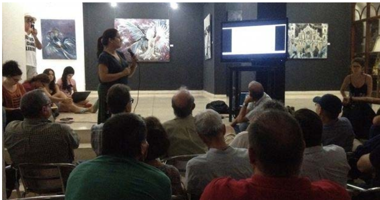
El grupo de G-20, compuesto por artistas y productores, reunidos en La Habana.