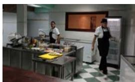
EL BIKY Y LA CLASE EMERGENTE