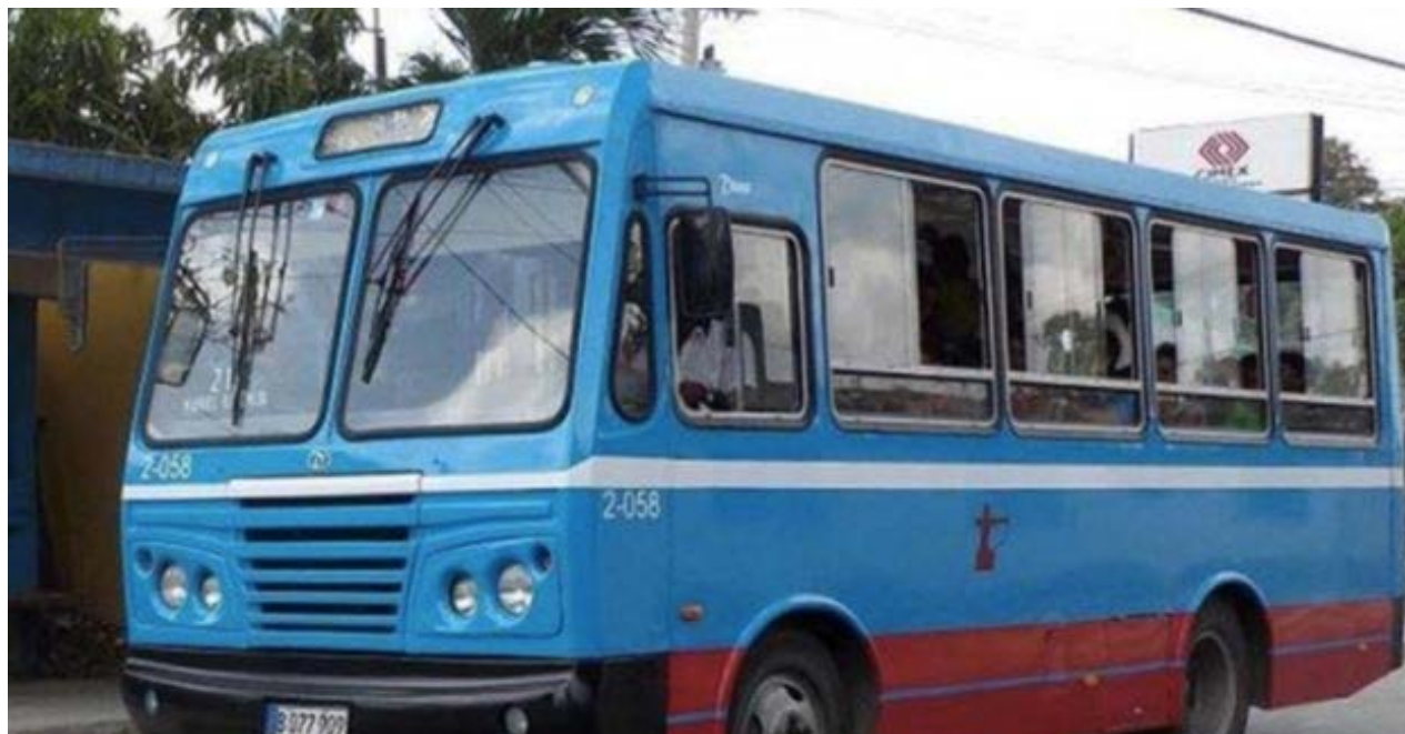
Ómnibus de la marca Diana en la provincia de Artemisa.

en el sistema constructivo erigido en el litoral derivado de la excesiva explotación turística de la zona.