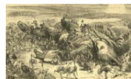
LA REBELIÓN DE LILIPUT