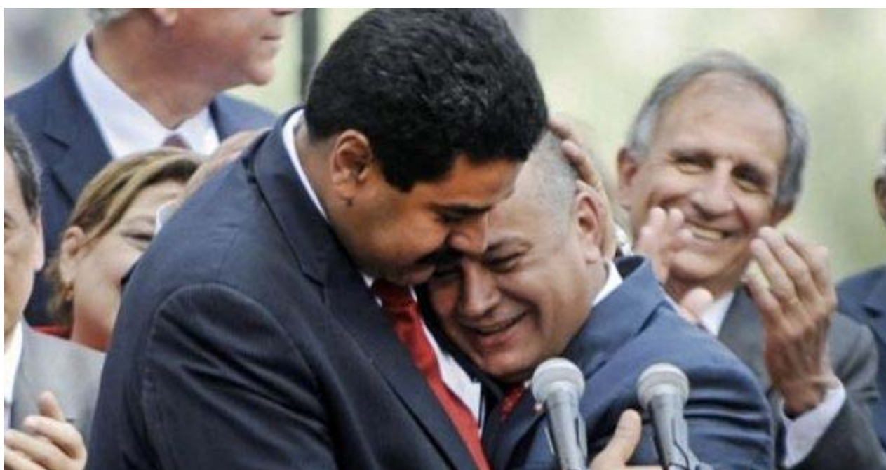
Nicolás Maduro y Diosdado Cabello

Algunos clientes sospechan que el regreso de las papas no llega en un momento casual, ya que el país se enfrentará dentro de un mes a elecciones legislativas en las que el partido socialista podría sufrir su primera gran derrota en las urnas.