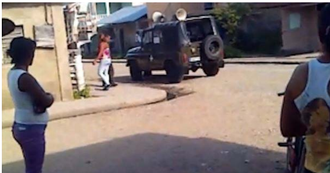
Auto con altavoces advirtiendo a los residentes de Palma Soriano que deben redoblar las medidas sanitarias. (Unpacu)