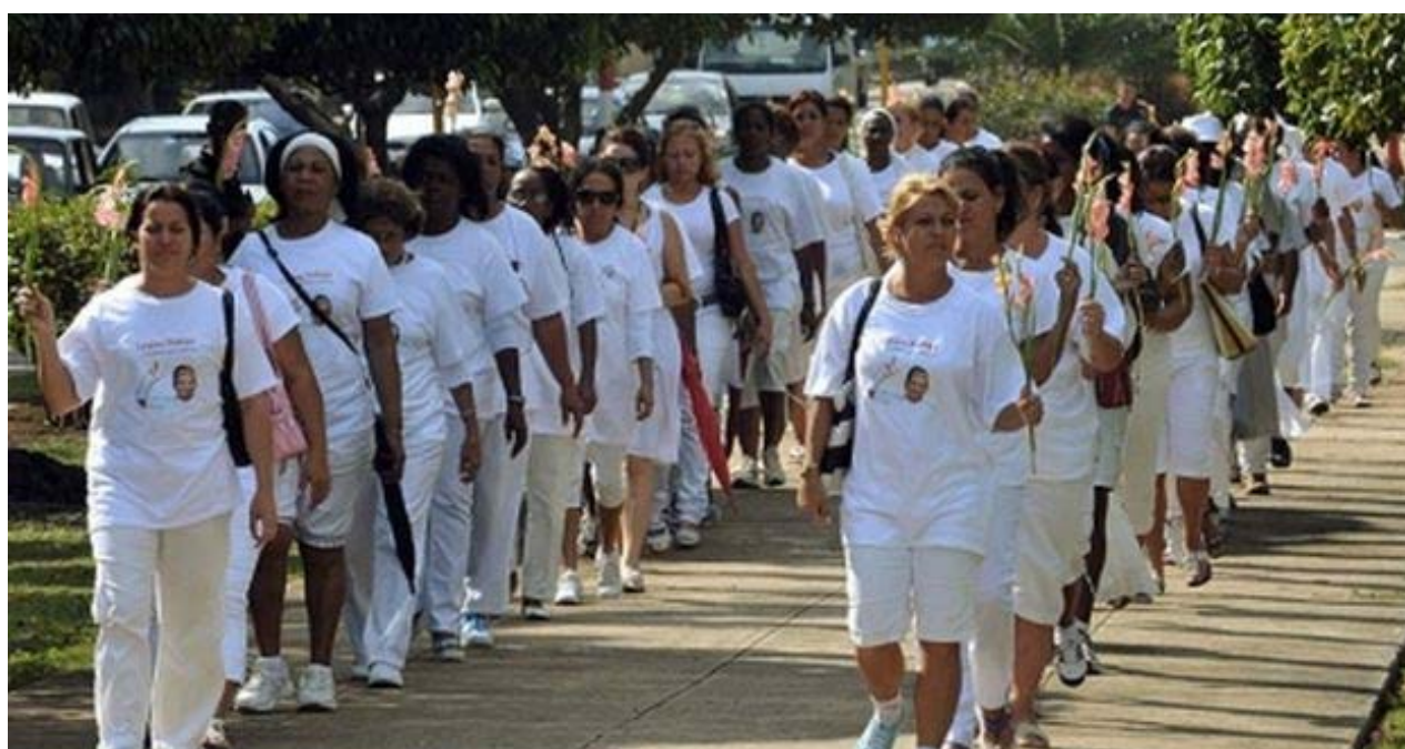
Marcha de las Damas de Blanco por La Habana.