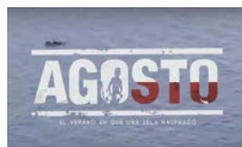
CRISIS DE LOS BALSEROS