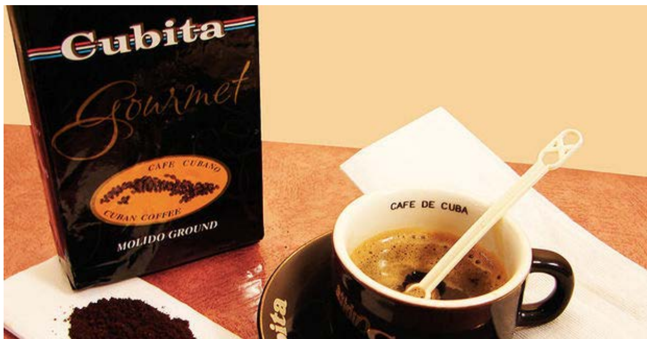
Café 'Cubita' de la variedad gourmet.