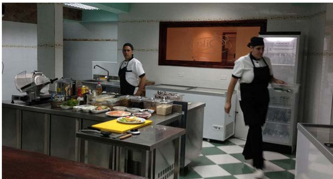
Cocinas de El Biky.