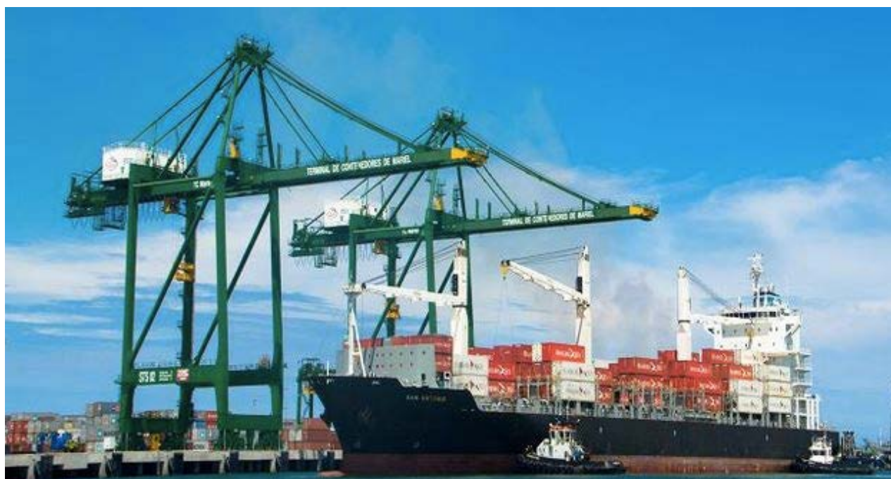
Terminal de Contenedores de la Zona Especial de Desarrollo Mariel

R. El periodismo independiente le ha puesto muy alta la varilla –usando una metáfora deportiva– al periodismo oficial. Las redes sociales y los caminos de distribución alternativas de las noticias también han significado una posibilidad de empoderamiento a través de la información. La gente se pasa las noticias y eso ha beneficiado al periodismo independiente cubano, que vive un buen momento.