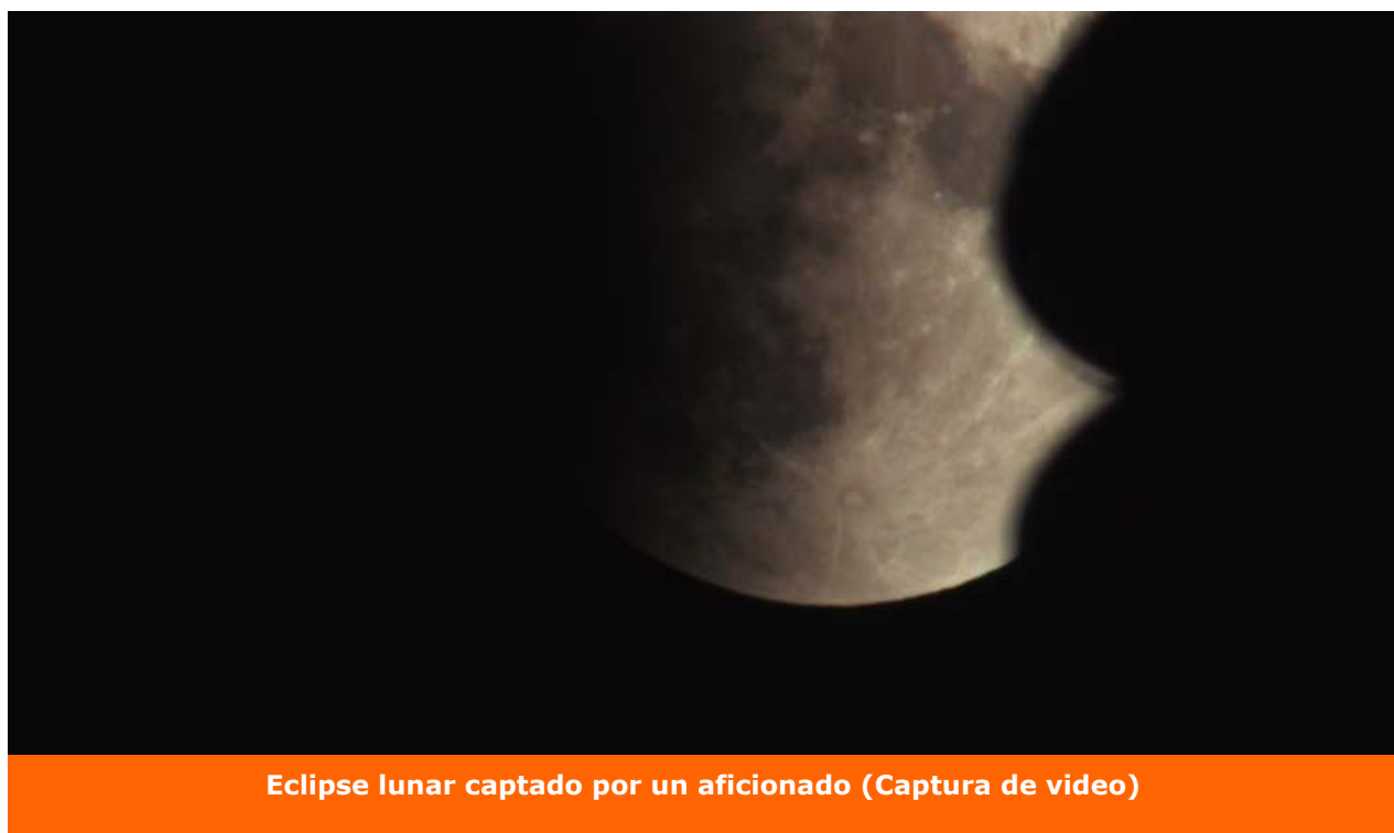
Eclipse lunar captado por un aficionado (Captura de video)