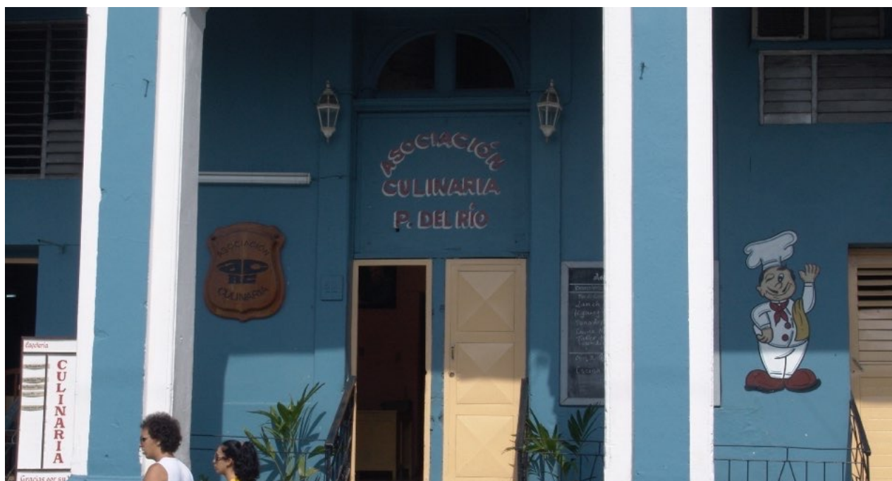
La Asociación Culinaria Provincial en la ciudad de Pinar del Río