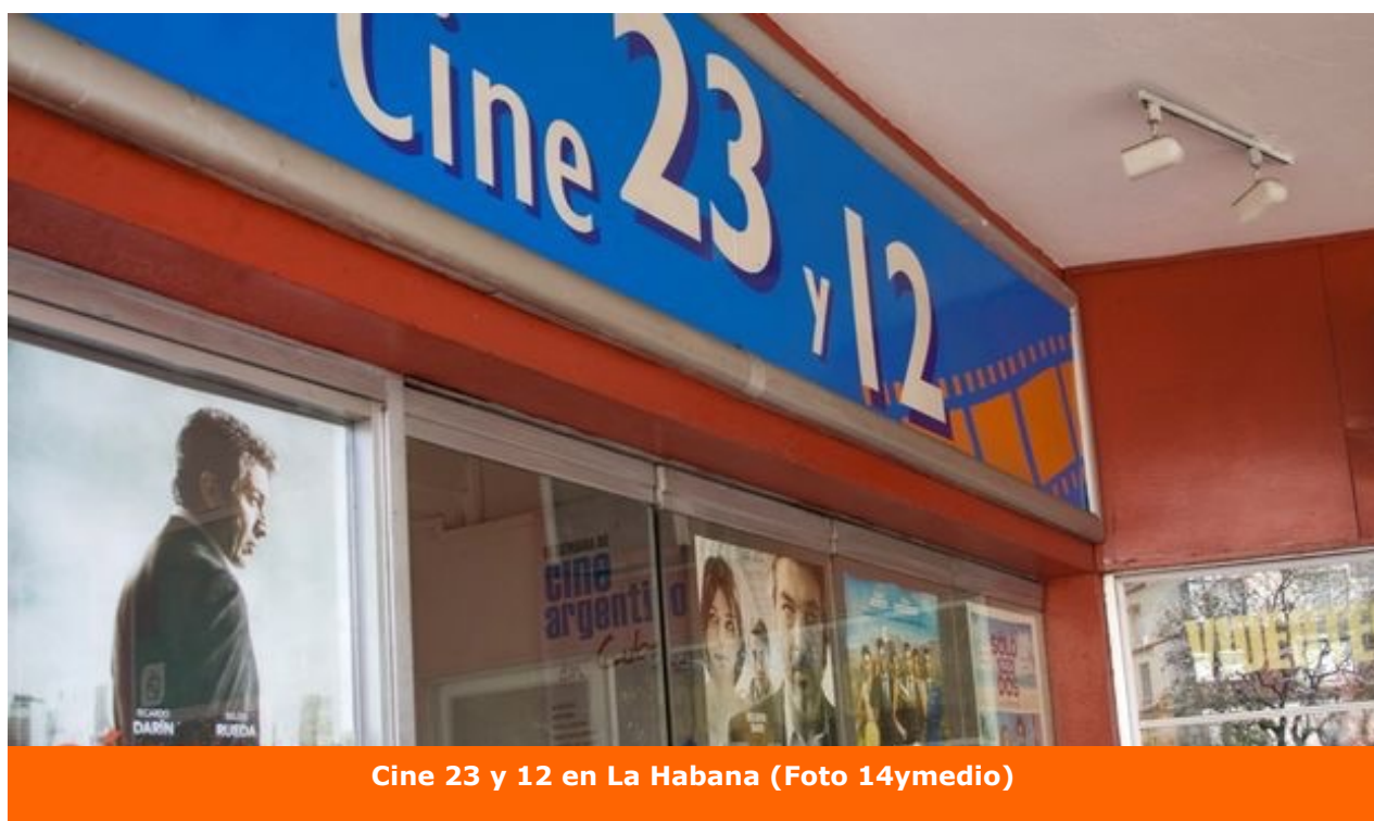
Cine 23 y 12 en La Habana

Stevie Wonder (Michigan, 1950) ha sido incluido en el Salón de la Fama del Rock and Roll de los compositores famosos. Tiene 25 Grammy en su palmarés y más de 100 millones de discos vendidos. Se ganó la simpatía del público cubano desde su intervención, en 1985, en la grabación del tema We are the world.