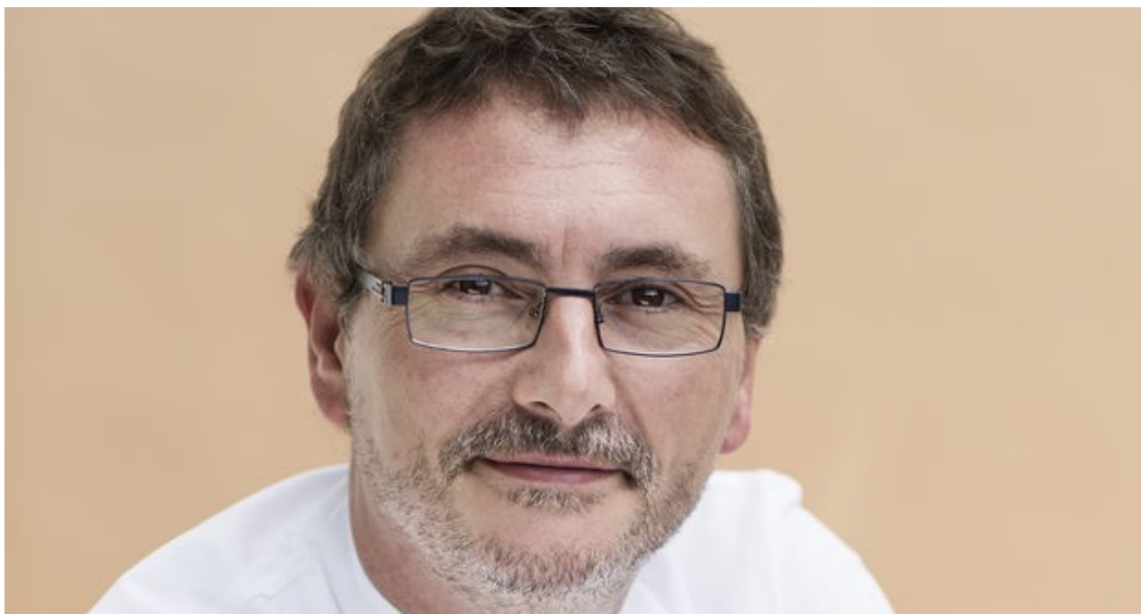
El chef español Andoni Luis Aduriz

una selección con lo mejor de la semana del primer diario independiente hecho en Cuba