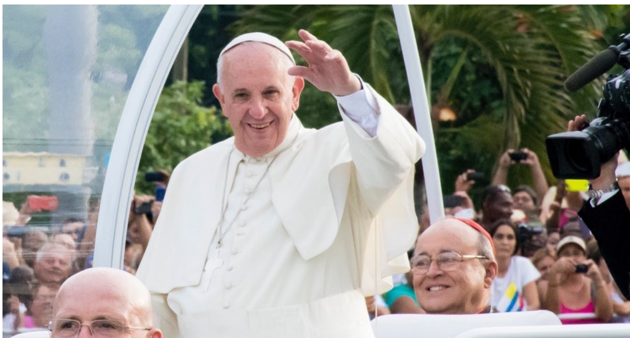
El papa Francisco a su llegada a la Plaza de la Revolución en La Habana