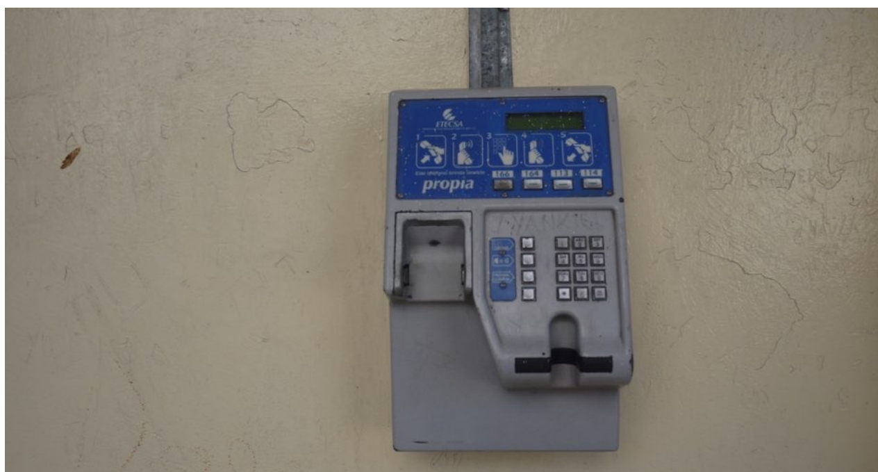
Un teléfono público con el auricular arrancado, La Habana

Si todo eso tenemos que agradecerse a EE UU y al levantamiento de su "bloqueo"... siga usted, lector.