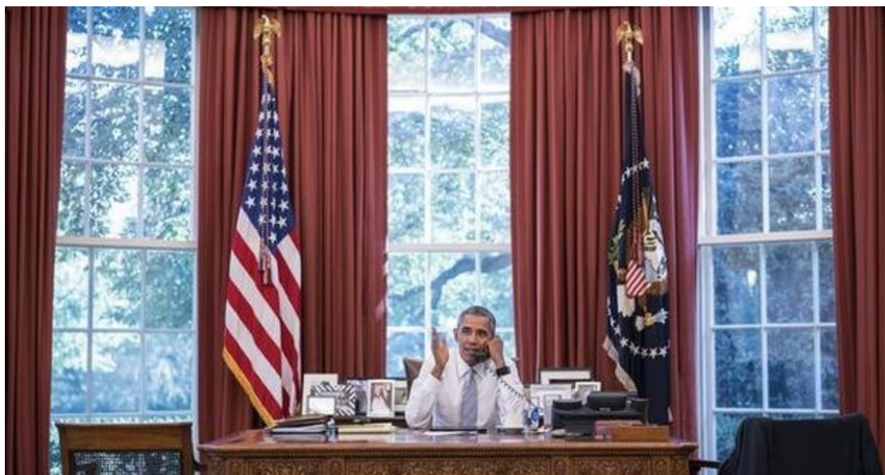
El presidente Barack Obama habla con su homólogo Raúl Castro sobre las nuevas medidas encaminadas a aliviar el embargo.