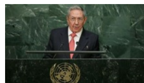
RAÚL CASTRO EN LA ONU