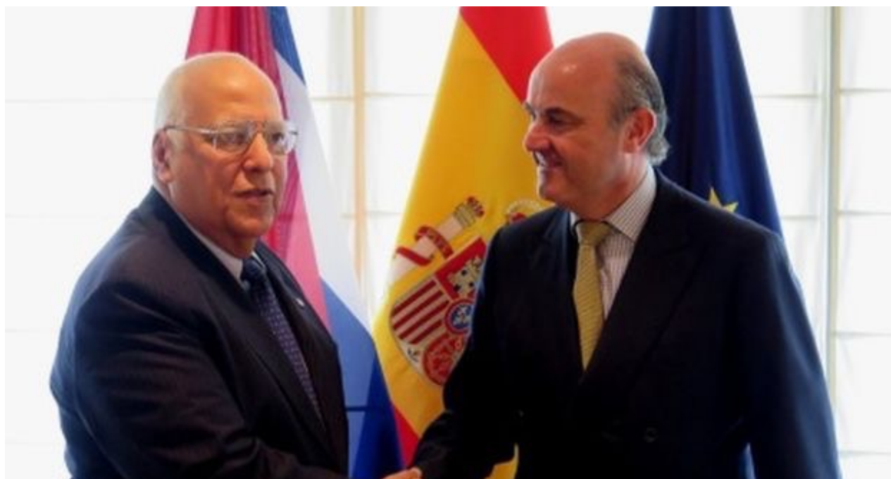
Ricardo Cabrisas y el ministro español de Economía y Competitividad, Luis de Guindos (CC)

El primer paso en esas cadenas de irregularidades muchas veces consiste en la falsificación de documentos, las transferencias ficticias o apropiación del efectivo no depositado en los bancos, los fraudes en nóminas y la introducción ilegal de mercancías.