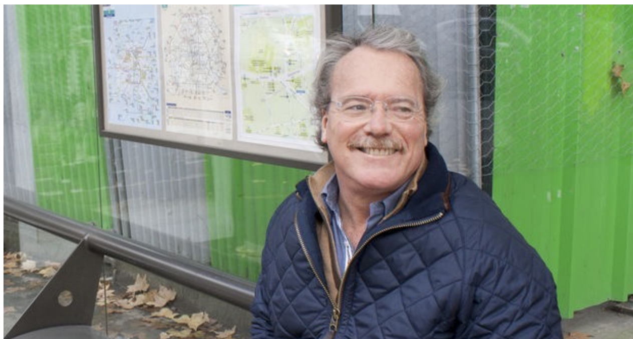
Alberto Barrera Tyszka acaba de ganar el Premio Tusquets de Novela