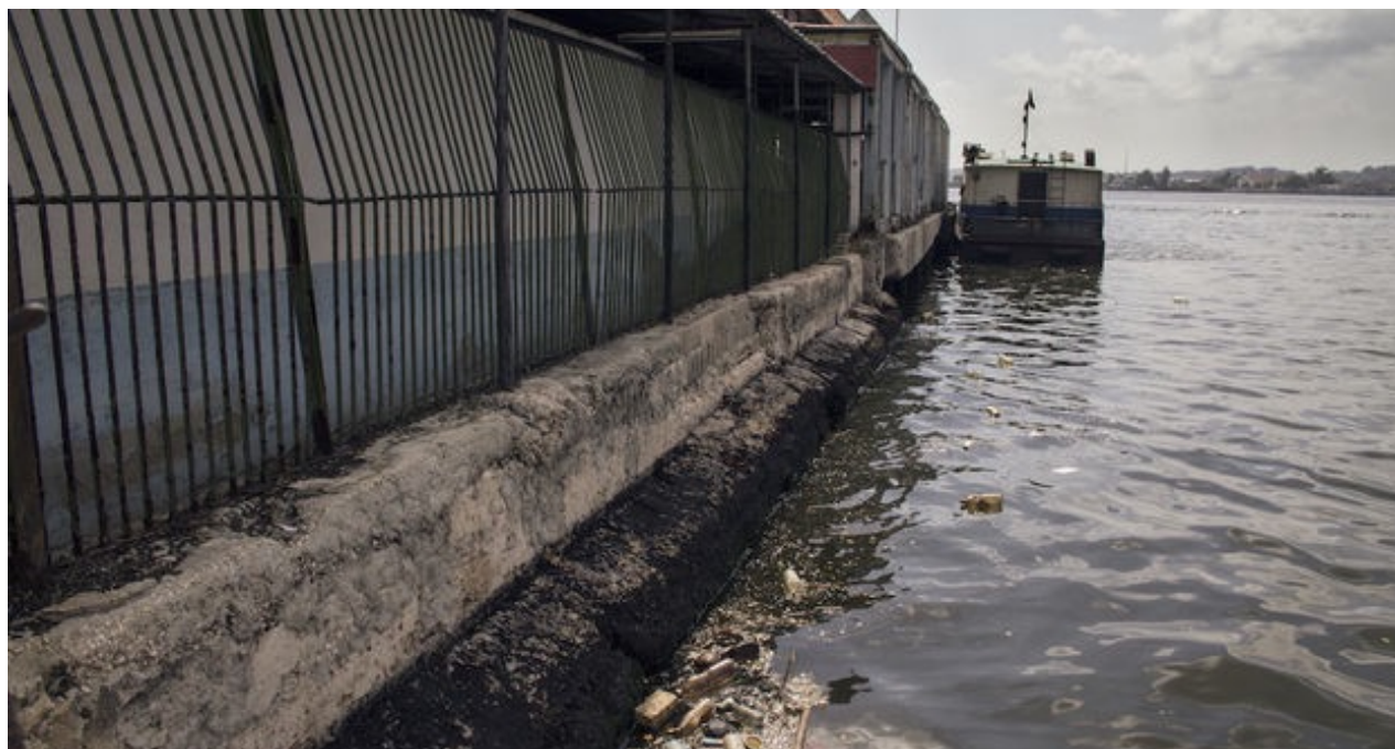
Embarcadero para las lanchas hacia Regla y Casablanca en La Habana