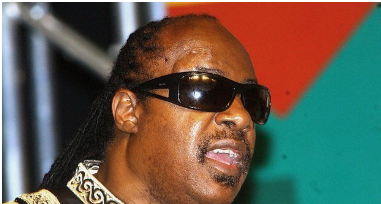
Stevie Wonder en el año 2006. (CC)

R. Creo que novelista. Es donde me siento mejor. Donde creo que me expreso más plenamente. Narrando historias.