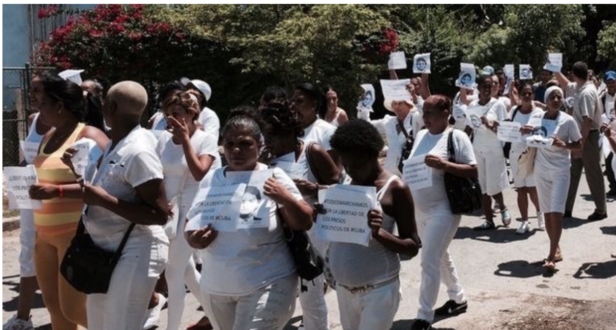
Damas de Blanco desfilan por la 5ta Avenida, La Habana