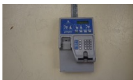
¿SOMOS INDISCIPLINADOS ?