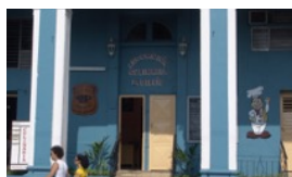
GUAYABITA DEL PINAR