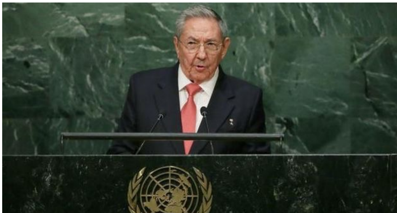
Raúl Castro durante su discurso en la ONU