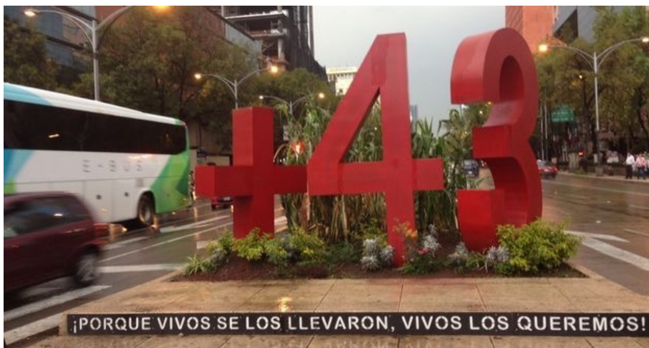
Recordatorio por los 43 estudiantes de la Normal de Ayotzinapa