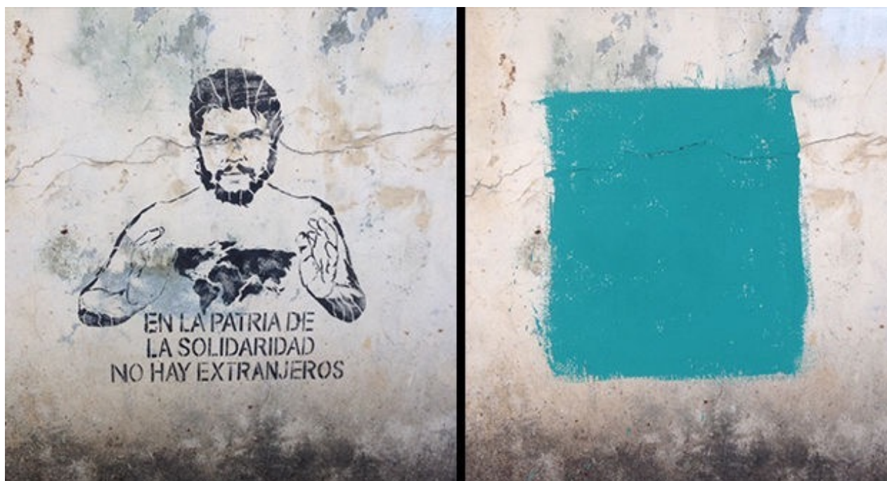
Graffiti aparecido en un muro de La Habana y el recuadro de pintura con el que fue cubierto horas después