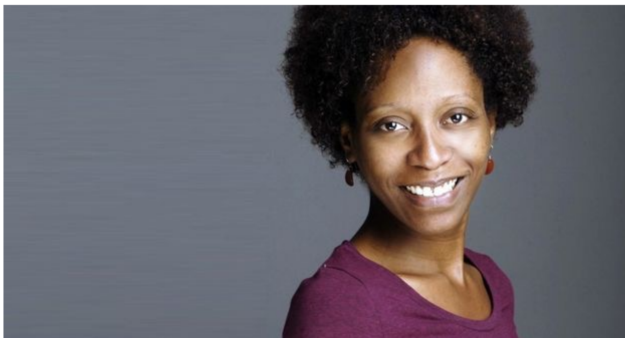
Yordanka Ariosa, ganadora de la Concha de Plata en el Festival de San Sebastián