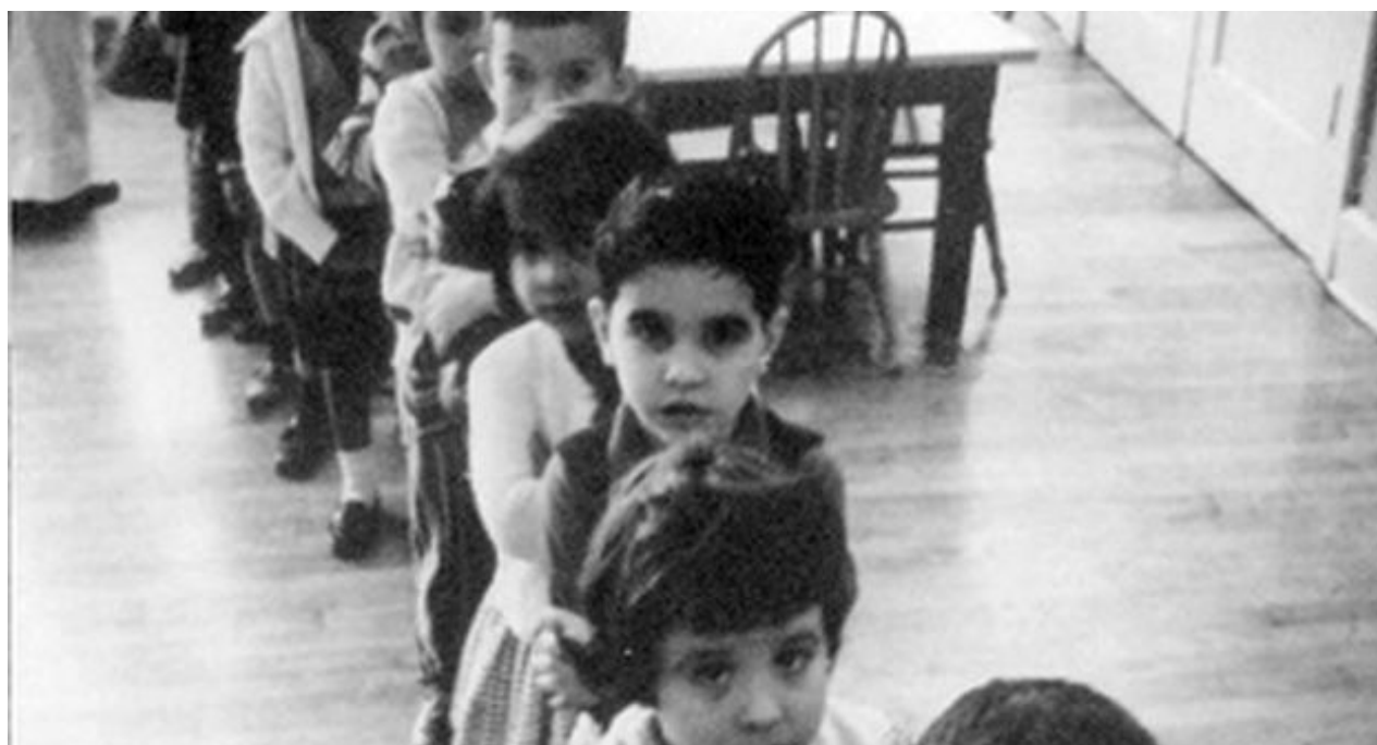
Niños cubanos que salieron del país durante la llamada Operación Pedro Pan (CC)