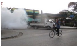
FUNCIONARIOS ROBAN QUÍMICO