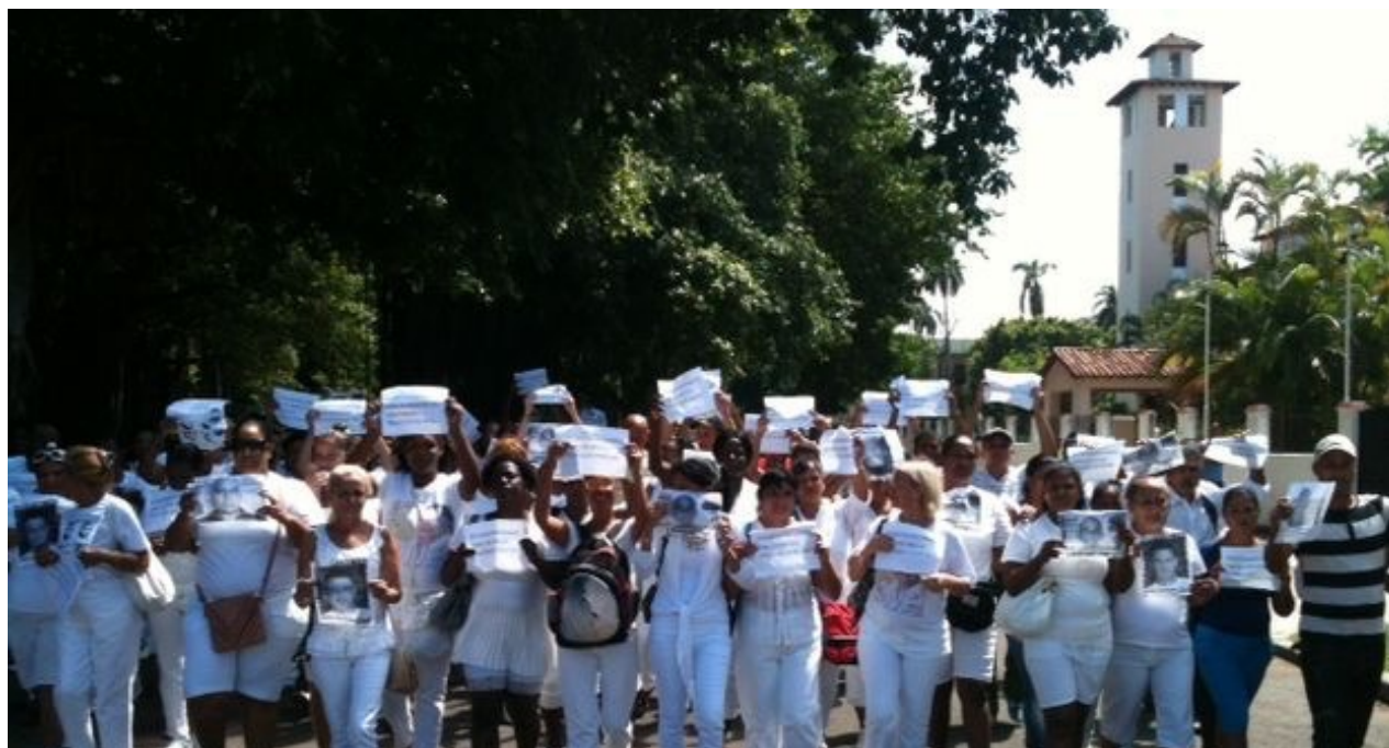
Damas de Blanco caminan por la Quinta Avenida de La Habana