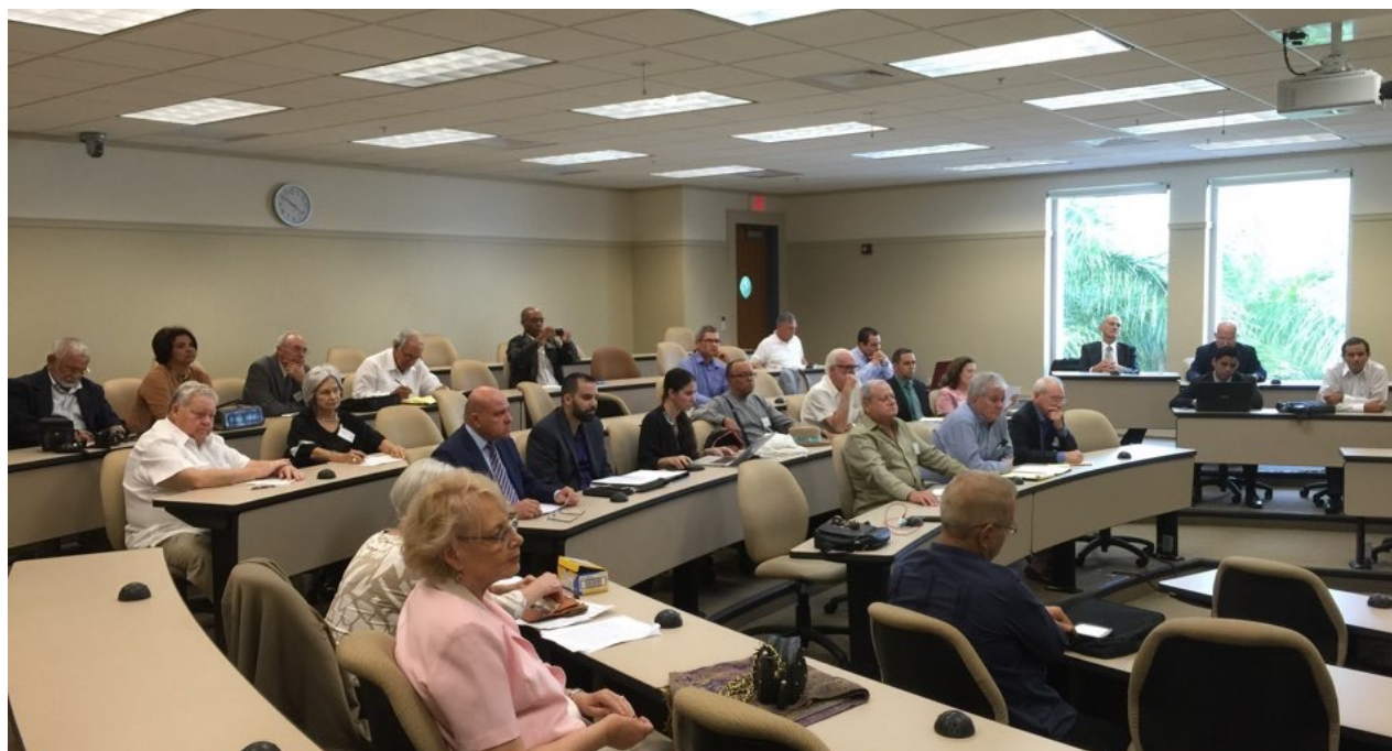
Primer encuentro de 'Abriendo Espacio' que sesionó en Miami entre el 10 y el 11 de octubre de 2015