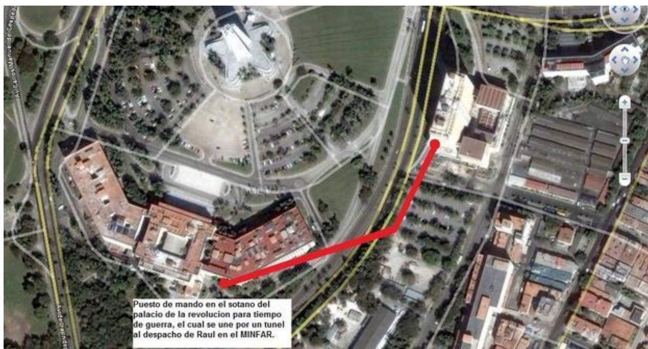
Vista aérea de un túnel que une el edificio del Consejo de Estado con el Ministerio de las Fuerzas Armadas (CC)

una selección con lo mejor de la semana del primer diario independiente hecho en Cuba