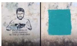
EN LA PATRIA DE LA SOLIDARIDAD