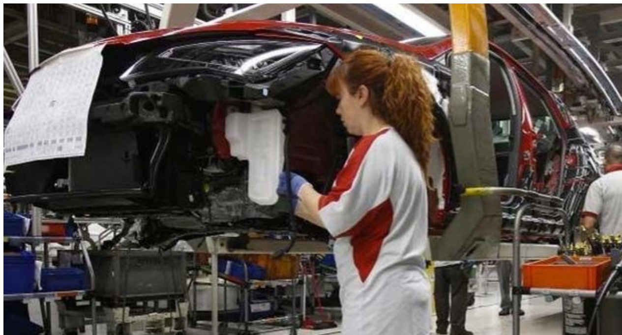
Una empleada en una planta de ensamble de Seat en Martorell, España (CC)

Quedan muchos temas pendientes, la educación, la salud, los asuntos jurídicos, la cultura, la ciencia y la tecnología, entre otros. Si el espíritu de los encuentros precedentes se mantiene, tanto en la Isla como fuera de ella, en esa nación transfronteriza donde los cubanos viven y sueñan se habrá dado un paso de enorme importancia. Se habrán compilado el pensamiento, las soluciones, los asideros de las discusiones del futuro. Los dilemas que no tenemos hoy, pero que inevitablemente tendremos mañana, cuando haya libertad para tener dilemas.