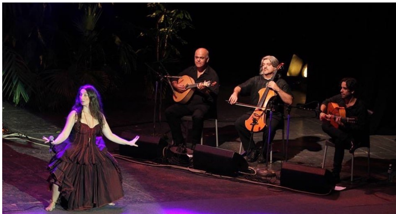
La cantante portuguesa Dulce Ponte se presentó en La Habana en el marco del Festival Les Voix Humaines (CC)