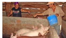
SOBRA LECHE EN NICARAGUA