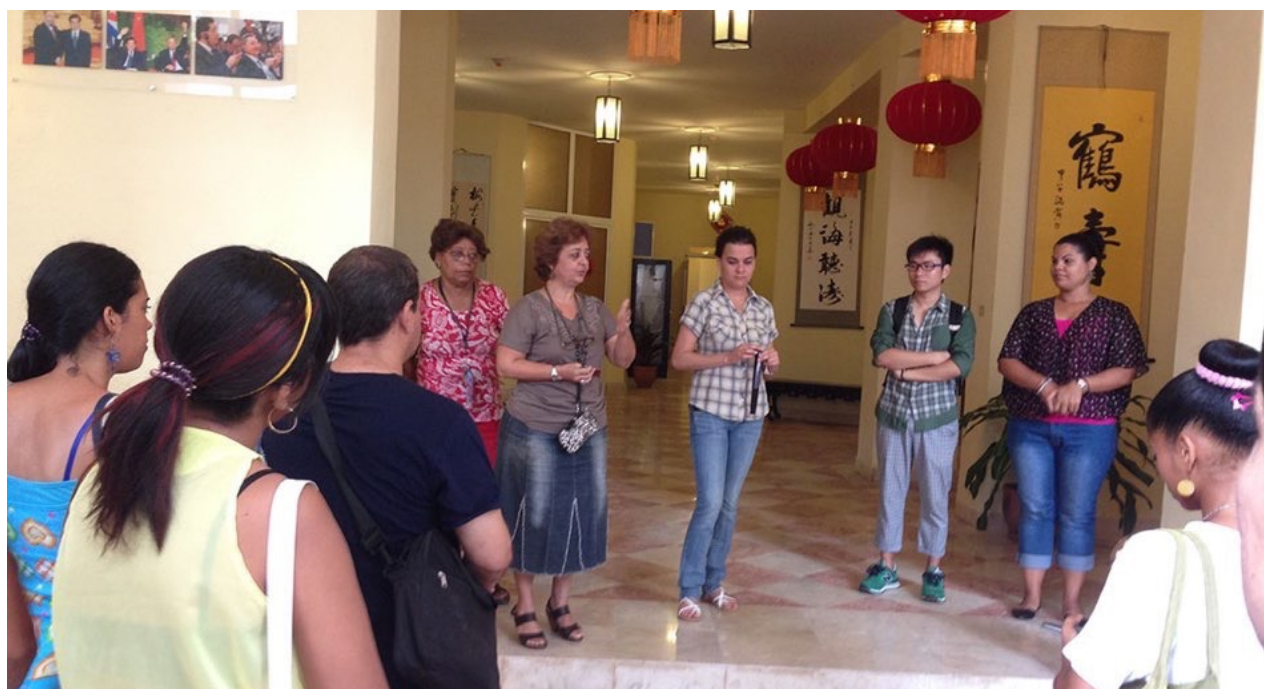
Primer día de curso en la nueva sede del Instituto Confucio de La Habana