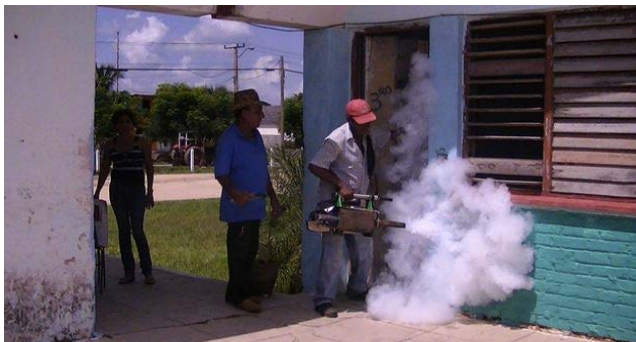
Fumigaciones en Camagüey para prevenir el dengue.