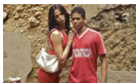
BAJOS FONDOS DE LA HABANA