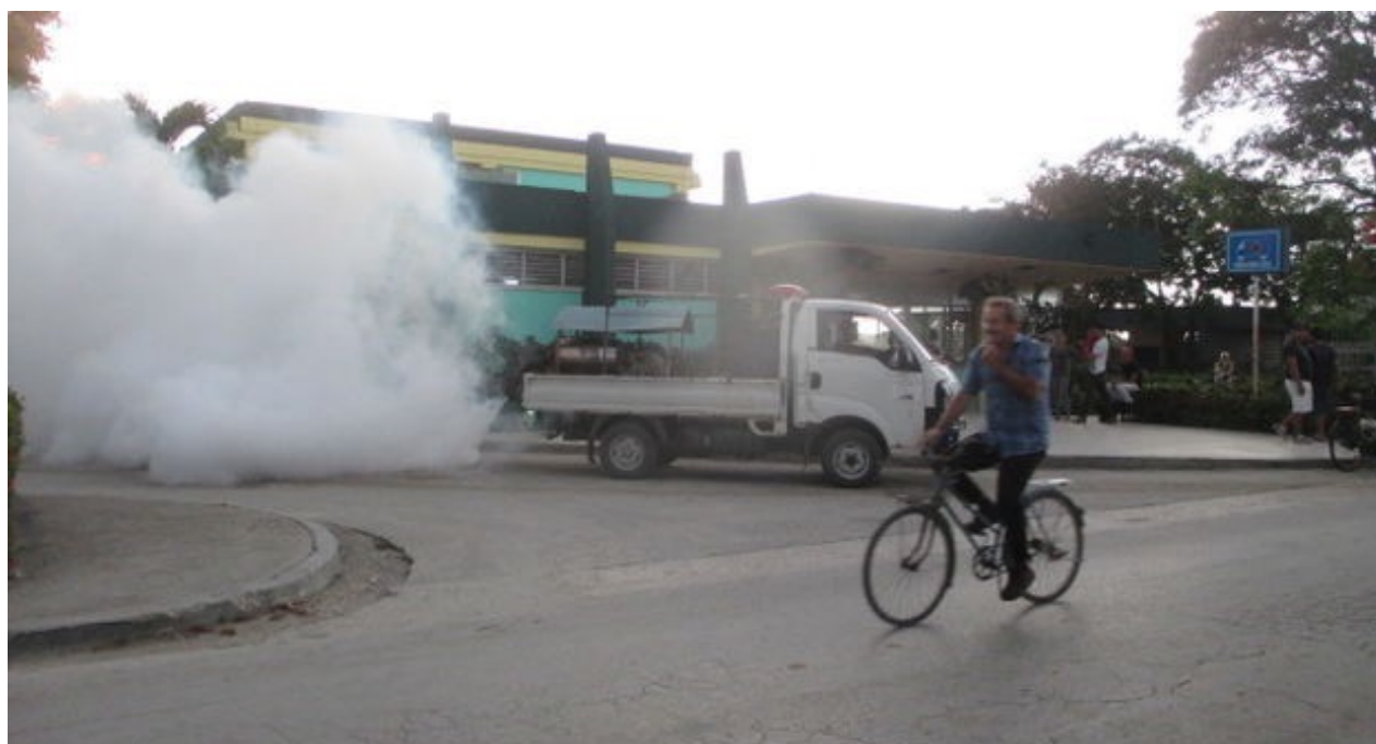
Un vehículo administra la fumigación contra el ' Aedes aegypti ' en la ciudad de Holguín