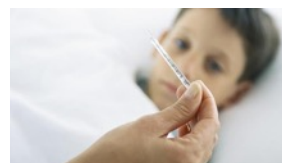
CUBA SIN TERMÓMETROS