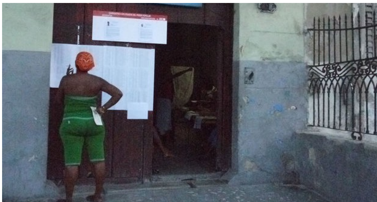
Una mujer revisa la lista de candidatos a las elecciones municipales. (14ymedio)