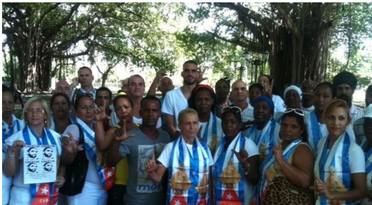
El artista Danilo Maldonado, 'El Sexto' acompañó este domingo a las Damas de Blanco