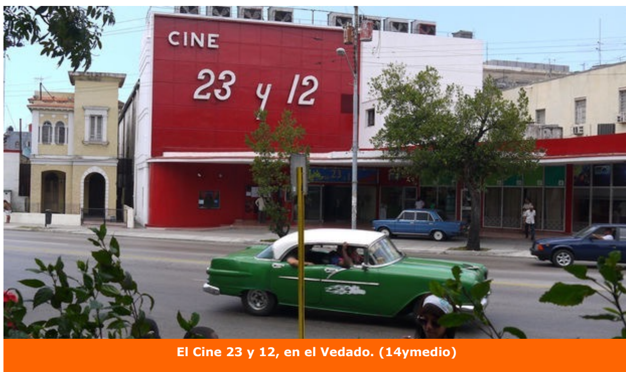
El Cine 23 y 12, en el Vedado.