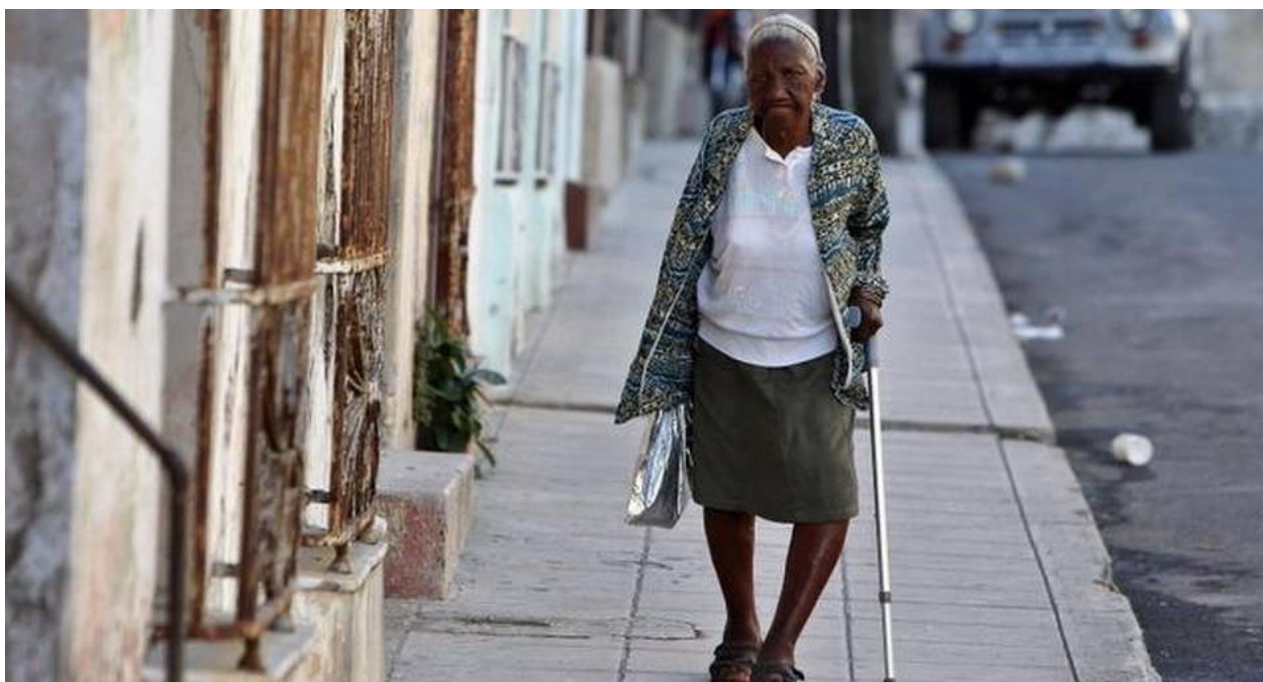
Una anciana camina por una calle de La Habana.