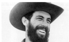
YA NO QUIERO ENCONTRARTE