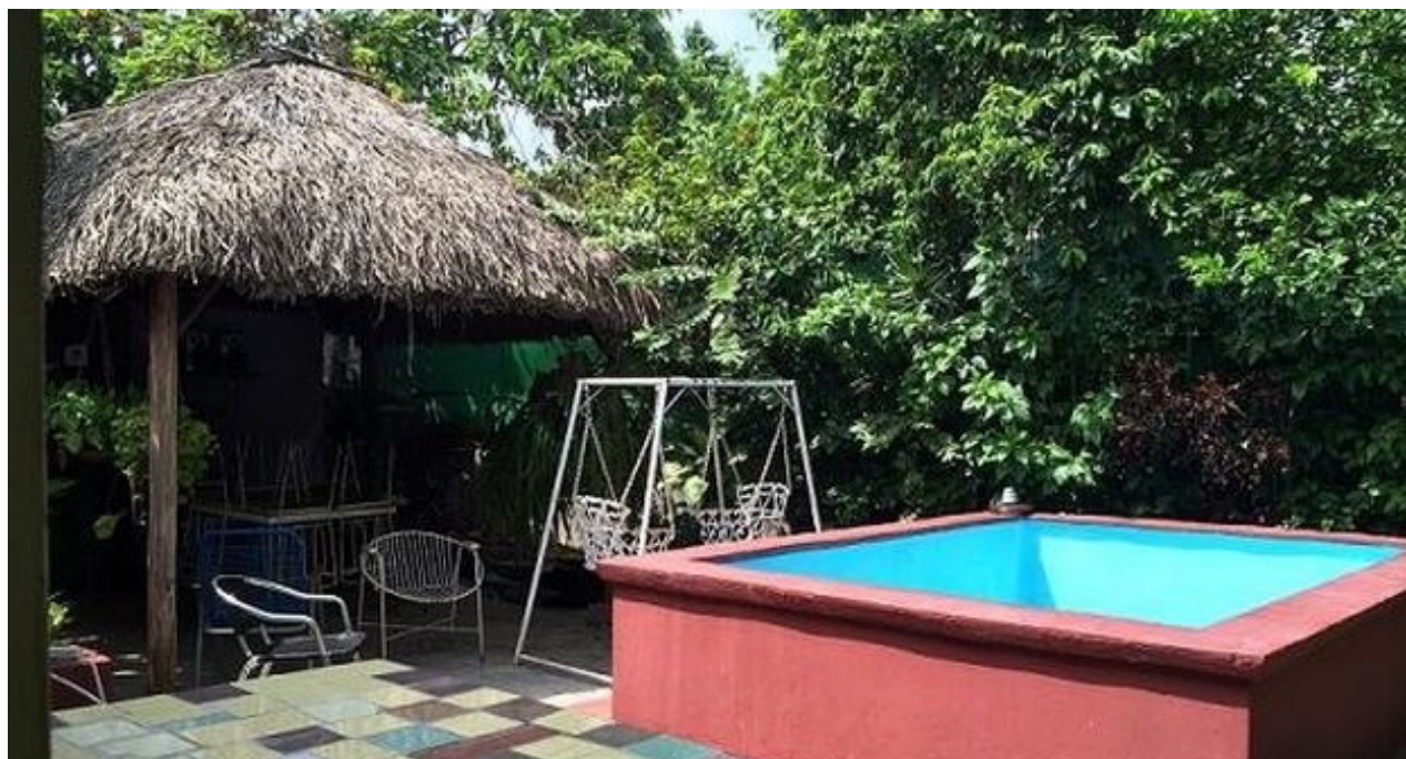
Casa a la venta en Altahabana (CC)