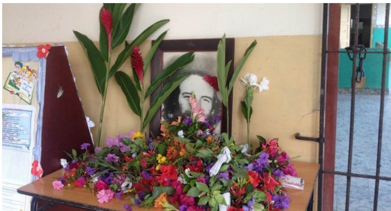
Flores a Camilo Cienfuegos en una escuela primaria en el municipio Plaza.