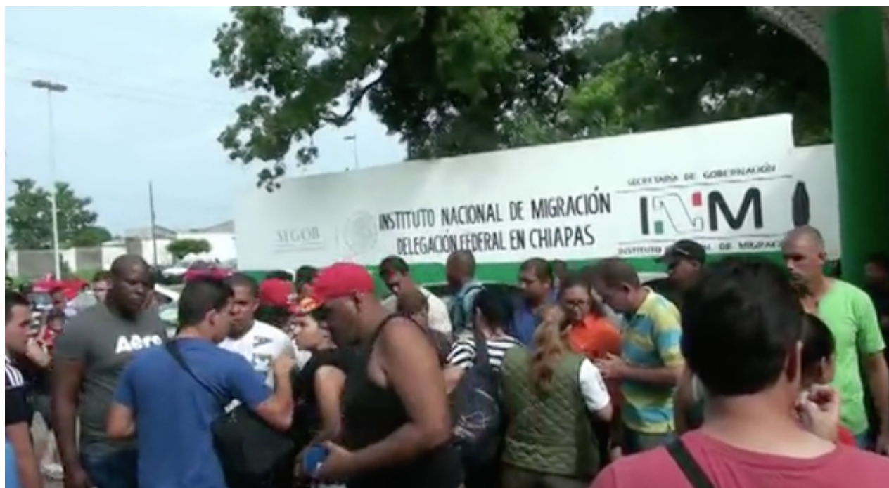
Cubanos esperando su salvoconducto a las puertas del Instituto Nacional de Migración en Tapachula.