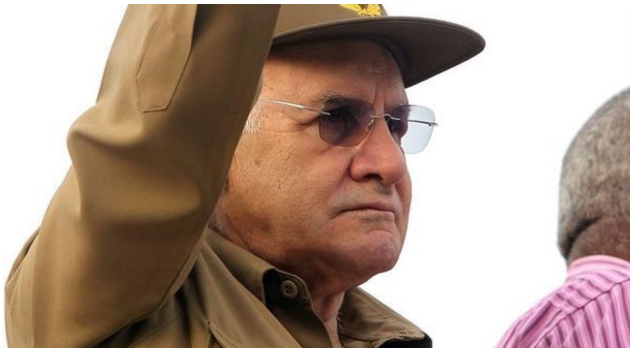
El general Abelardo Colomé Ibarra, alias 'Furry', ministro del Interior desde 1989 hasta su renuncia, este lunes

La mayoría de los cubanos se sienten muy atraídos por la fibra roja, quizás por representar lo prohibido o por una tradición culinaria que ensalza la carne. La Organización Mundial de la Salud tendrá que trabajar muy duro para convencerlos de lo contrario.