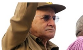
EL LEGADO DE 'FURRY'