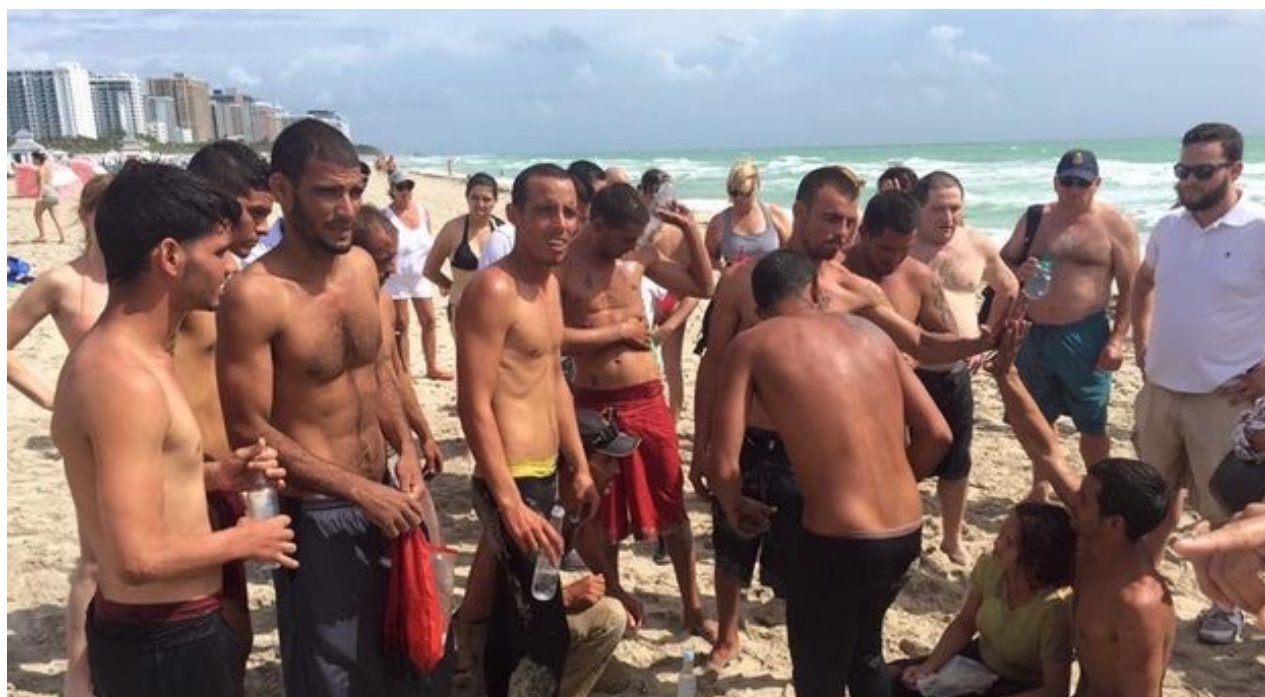
Doce balseros llegan a la zona turística de Miami Beach. (Oscar Alfonso)