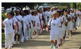
MARCHAR O NO MARCHAR