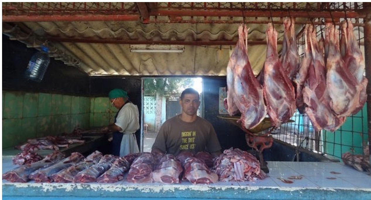
Venta de carne en el mercado de Camagüey.