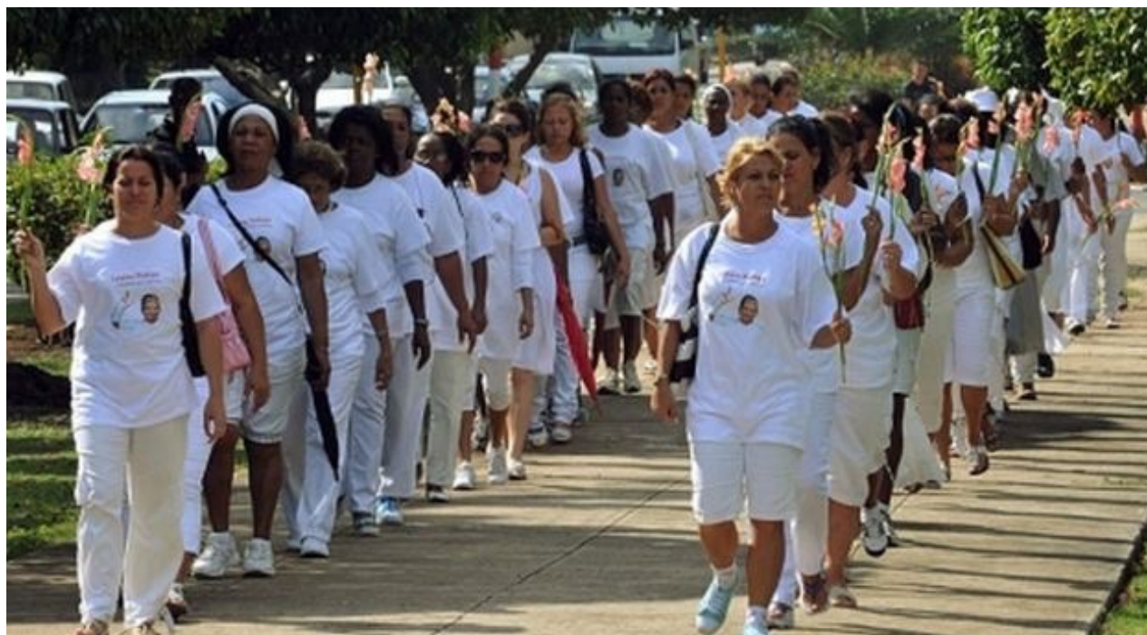
Marcha de las Damas de Blanco por La Habana.