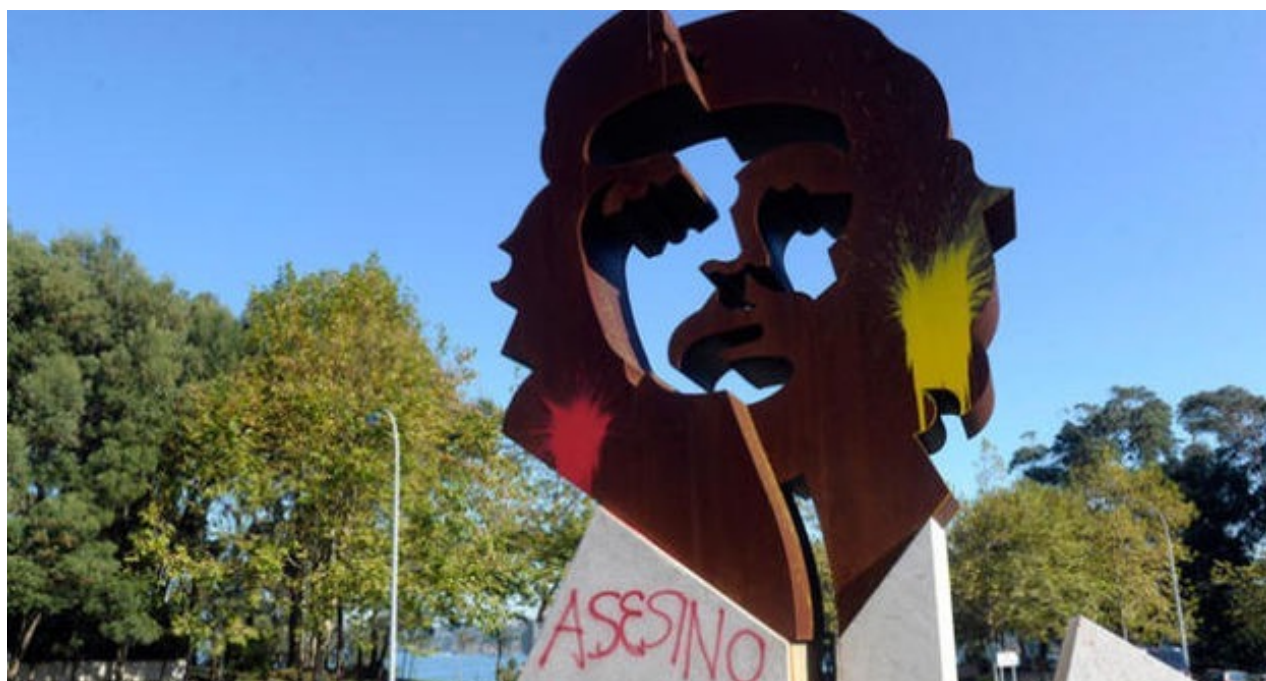
Pintadas en la estatua del Che en la ciudad gallega de Oleiros.