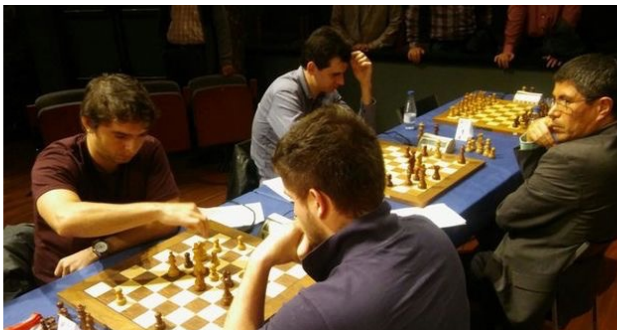
El enfrentamiento entre Bruzón y Martínez de este jueves.