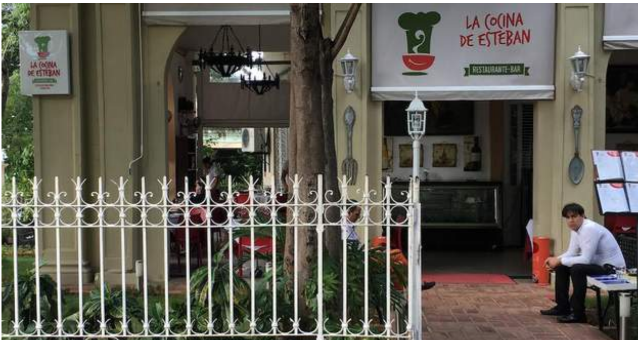
La paladar La cocina de Esteban en el Vedado, La Habana.

Una selección con lo mejor de la semana del primer diario independiente hecho en Cuba