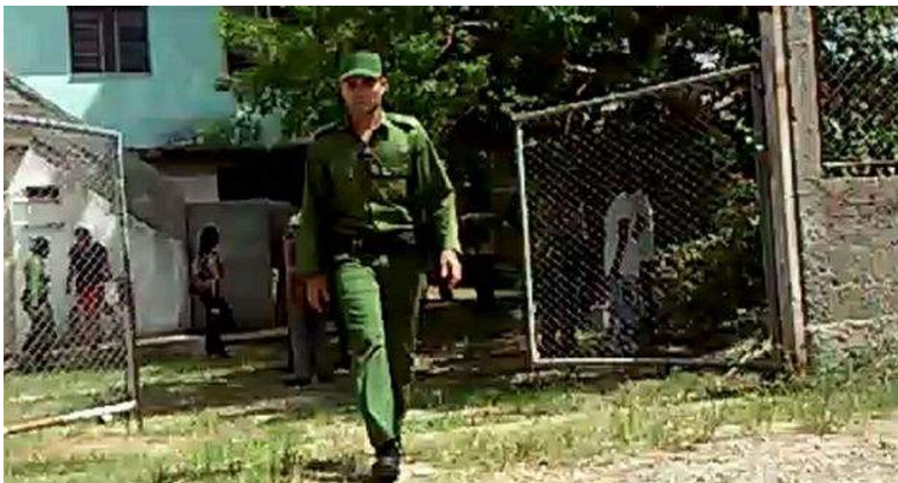
Registro policial a la sede de Cubalex.