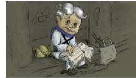
LA VEJEZ DE ELPIDIO VALDÉS