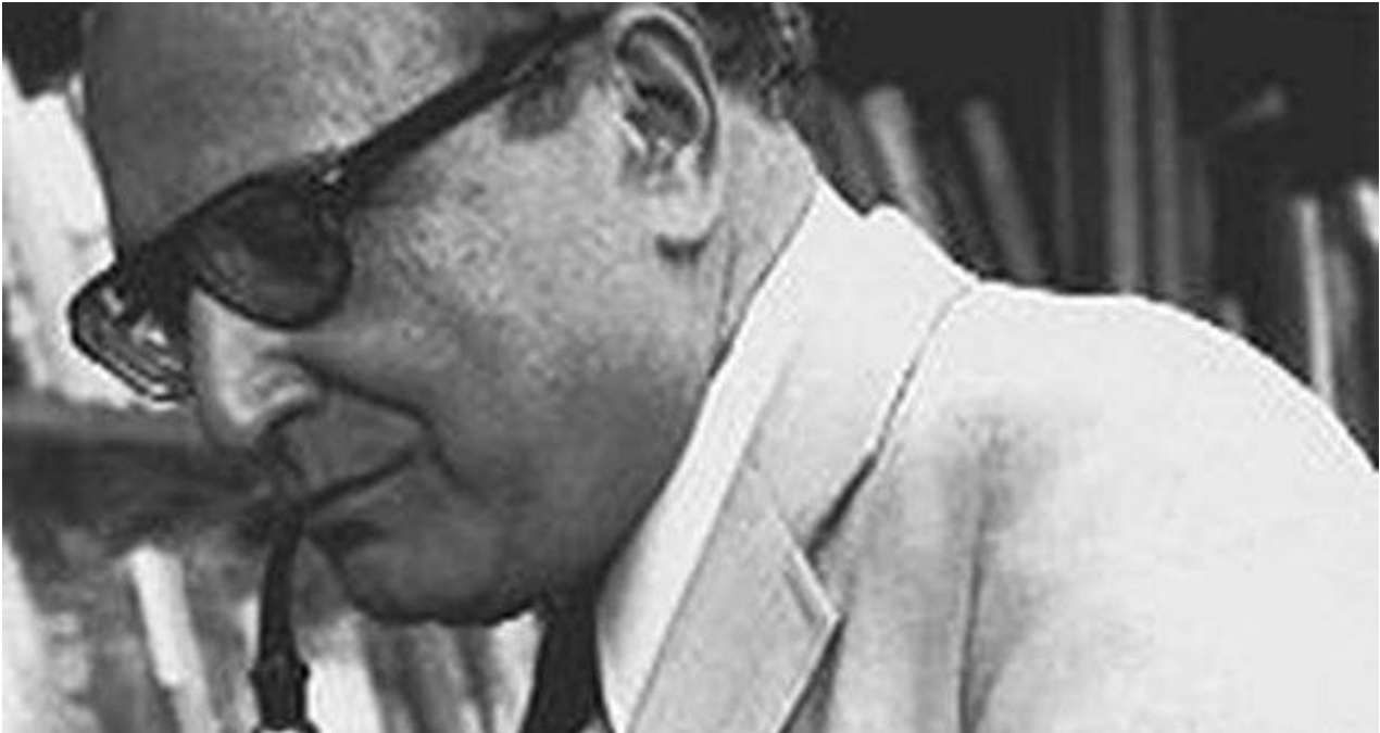
El sociólogo político Seymour Martin Lipset.

La historia ha demostrado que los populismos no consiguen sus propósitos y que al final reinan la miseria y la corrupción. Pero al liberalismo contemporáneo también le quedan asignaturas pendientes. El libro que lo explique detalladamente, exento de propaganda ideológica, está por escribir.