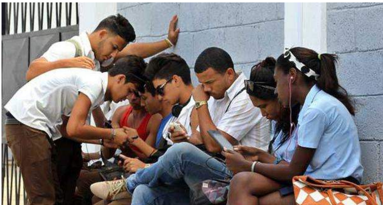
Un grupo de jóvenes se conecta a internet en una zona wifi de La Habana.