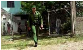
ÉXODO Y PASIVIDAD