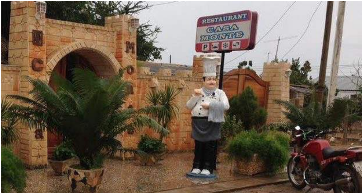
A las afueras de la paladar Casa Monte la figura rolliza de un cocinero invita a entrar.