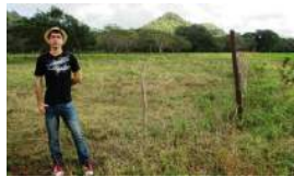
REPORTERO GRABA INTERROGATORIO