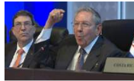
EL 'RAULISMO' FRENA EN SECO