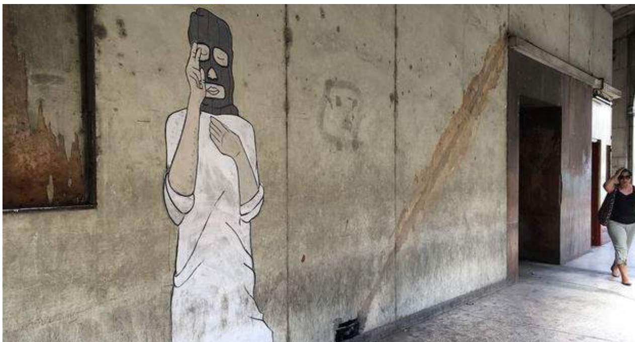
Grafiti de 2+2=5 en un muro de La Habana.