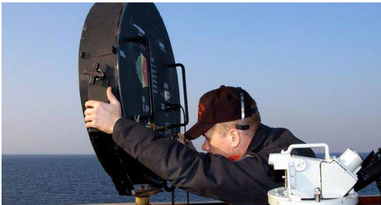
Dispositivo acústico de larga distancia utilizado en un buque de guerra de la armada estadounidense.