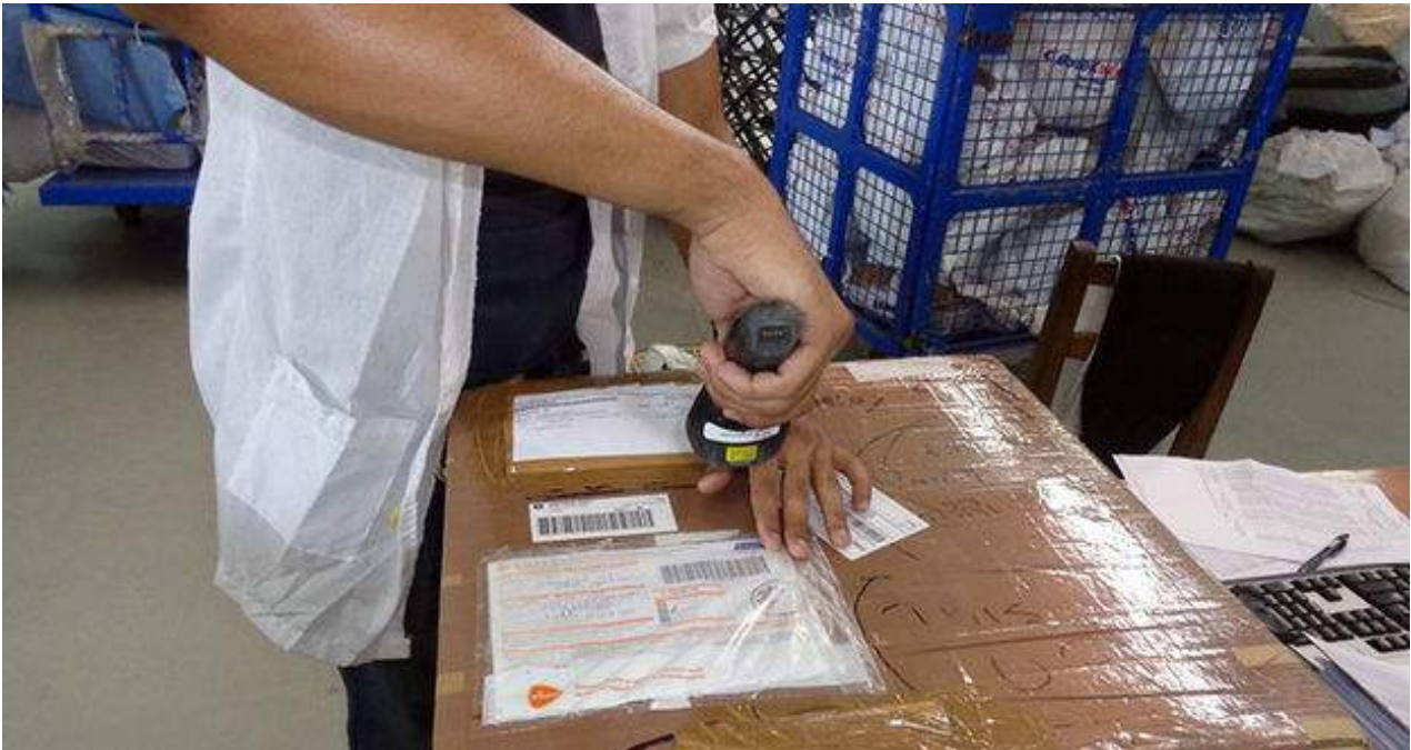
Una funcionaria inspecciona un paquete enviado a la Isla.