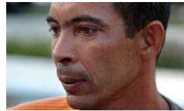
MUERE EN MIAMI EL OPOSITOR DARSI FERRET