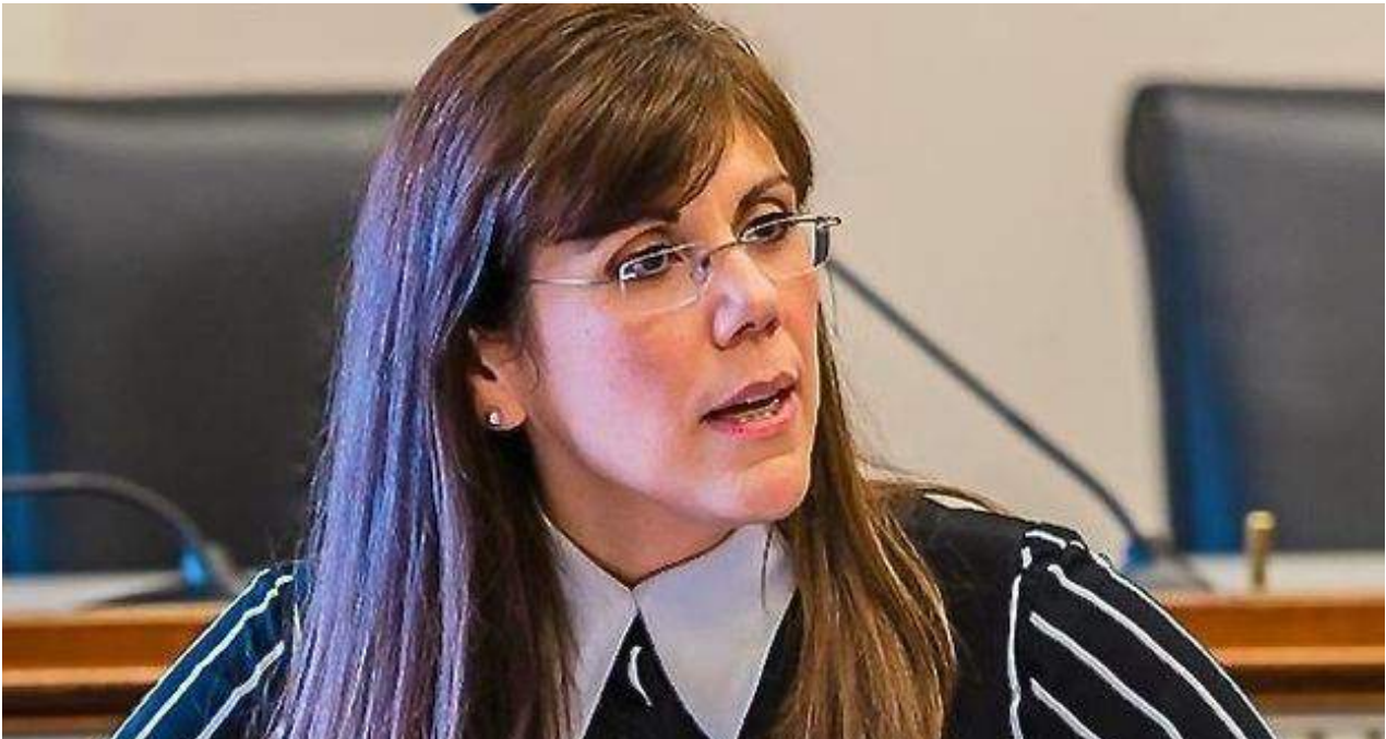
La experta cubanoamericana en política exterior y seguridad nacional cubanoamericana Yleem Poblete.