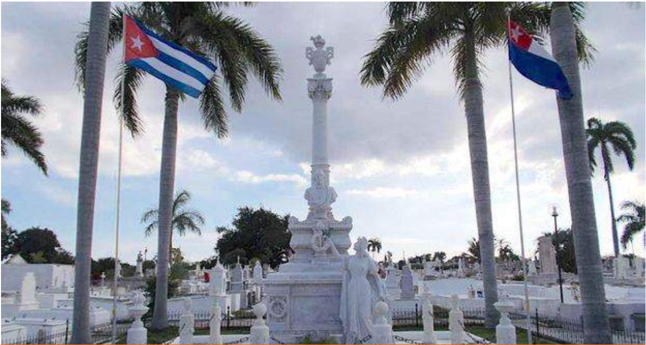
Panteón de Carlos Manuel de Céspedes en el cementerio de Santa Ifigenia, en Santiago de Cuba. (Convivencia)