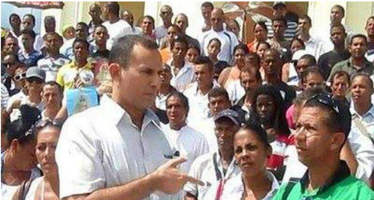
José Daniel Ferrer, líder de la organización opositora Unión Patriótica de Cuba (Unpacu), depuso este viernes su huelga de hambre.