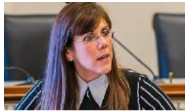
EL GOBIERNO DE TRUMP FICHA A UNA CUBANOAMERICANA