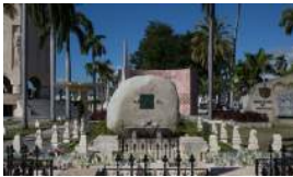
PROFANACIÓN REVOLUCIONARIA EN SANTA IFIGENIA