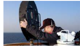
HACE 40 AÑOS EE UU SUFRIÓ UN BOMBARDEO SÓNICO