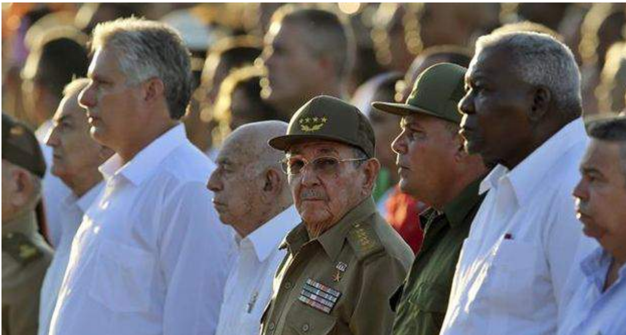
Raúl Castro ocupó un segundo plano respecto a su delfín, el vicepresidente Díaz-Canel, que llevó el peso del acto.