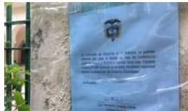
LA EMBAJADA COLOMBIANA CALLA SOBRE LOS VISADOS