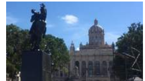
MARTÍ DESDE NUEVA YORK, SIN VISA Y CON ERRATAS