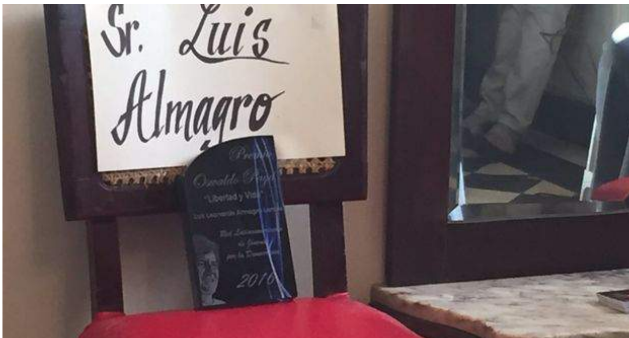
La silla vacía con el premio Oswaldo Payá "Libertad y Vida" que el Secretario General de la OEA, Luis Almagro, no pudo recoger en la pasada edición.