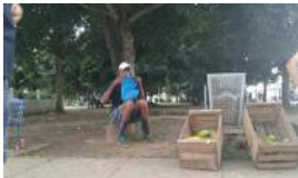
AGRICULTORES SE QUEJAN DE IMPAGOS ESTATALES