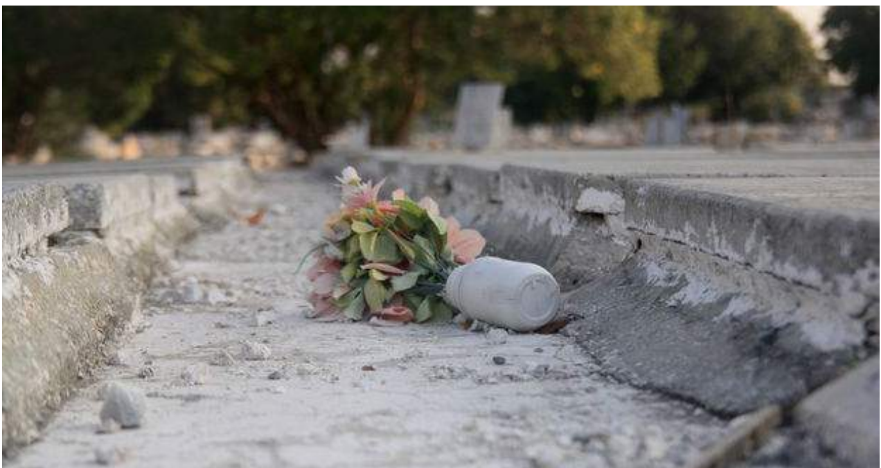
El cementerio de Colón en La Habana.

Una selección con lo mejor de la semana del primer diario independiente hecho en Cuba