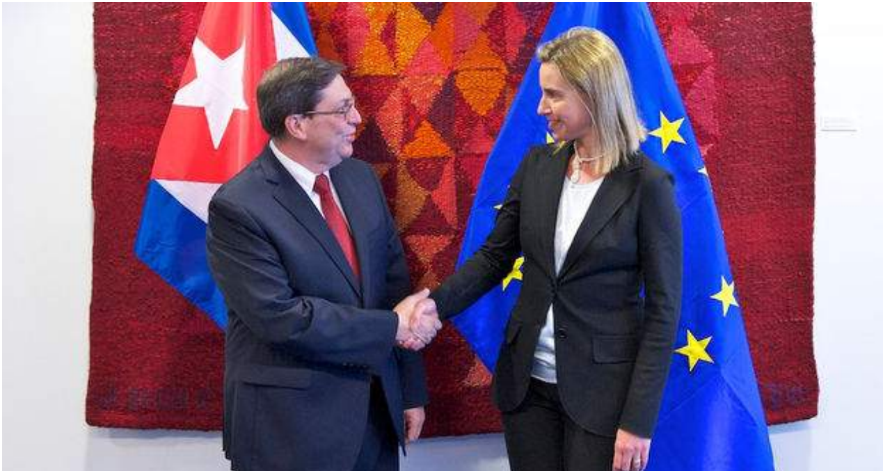
Federica Mogherini, alta representante de la UE, y Bruno Rodríguez, canciller cubano.