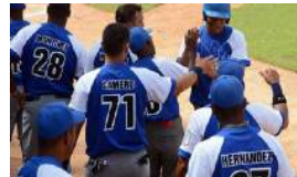
EL LEÓN INDUSTRIALISTA VUELVE A RUGIR