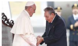
RAÚL CASTRO, EL MONAGUILLO