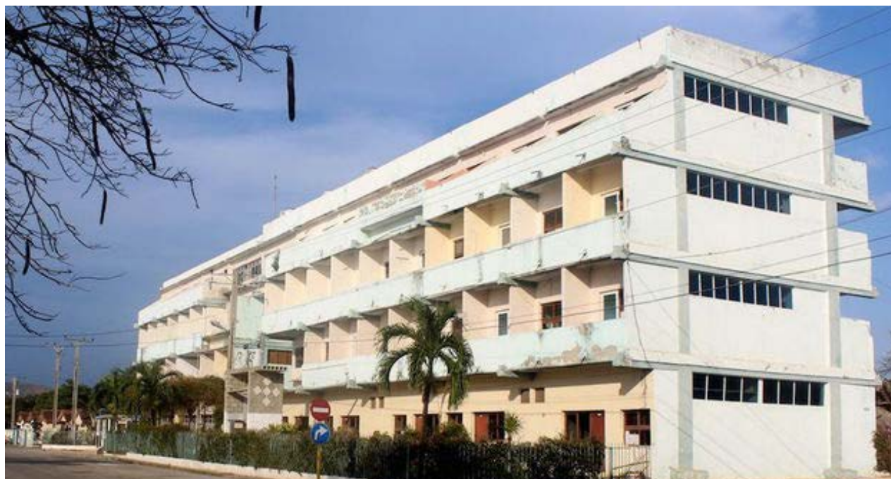
El hotel Costa del Sol.