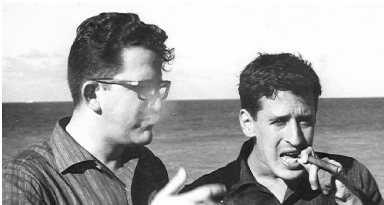
El periodista salvadoreño Roque Dalton junto al poeta cubano Heberto Padilla (a la izquierda) en La Habana en 1966.