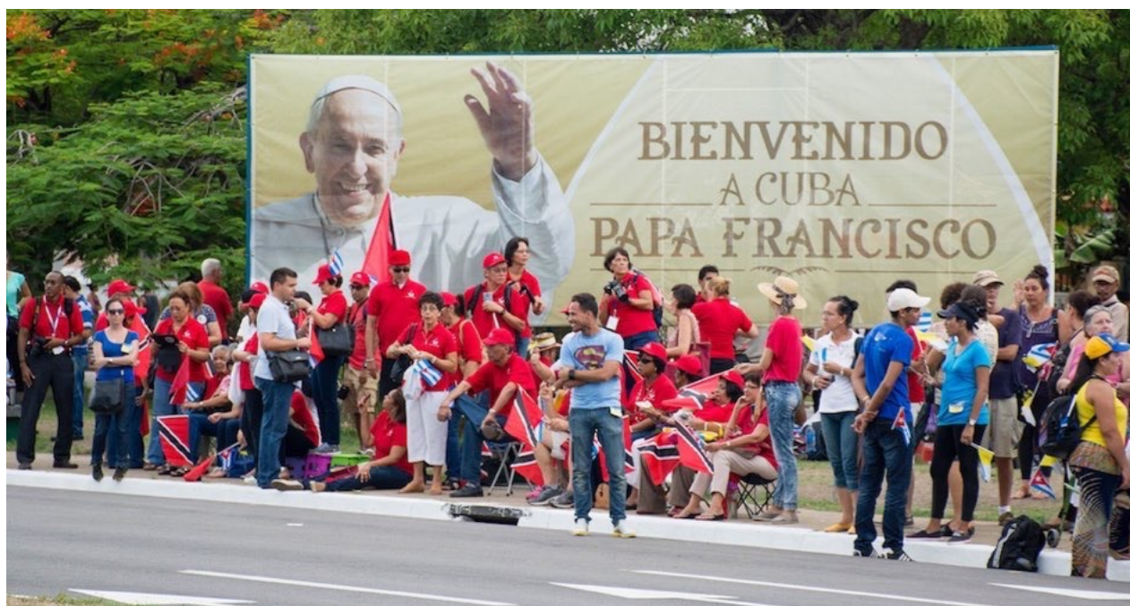
Un grupo de personas aguardan por la misa del papa Francisco en la Plaza de la Revolución