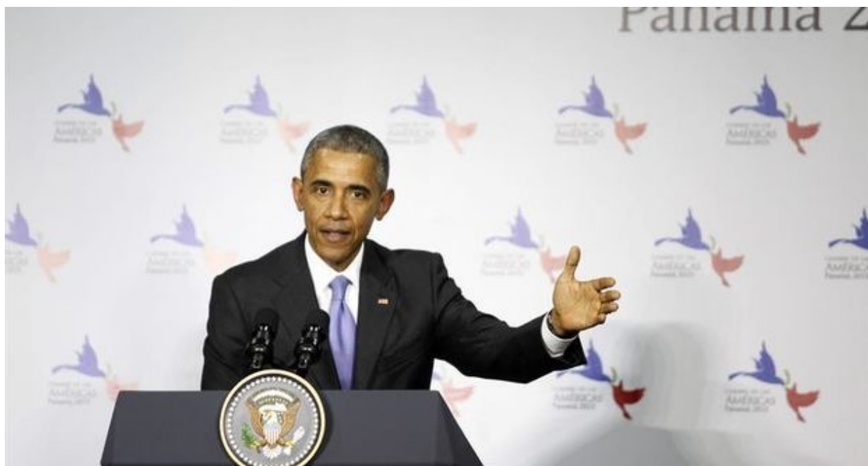
Barack Obama durante una conferencia de prensa en la VII Cumbre de las Américas