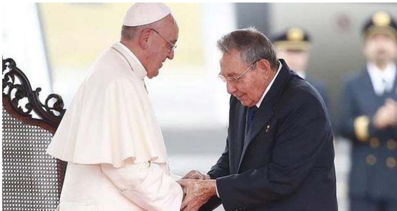
El papa Francisco saluda Raúl Castro a su llegada a Cuba.