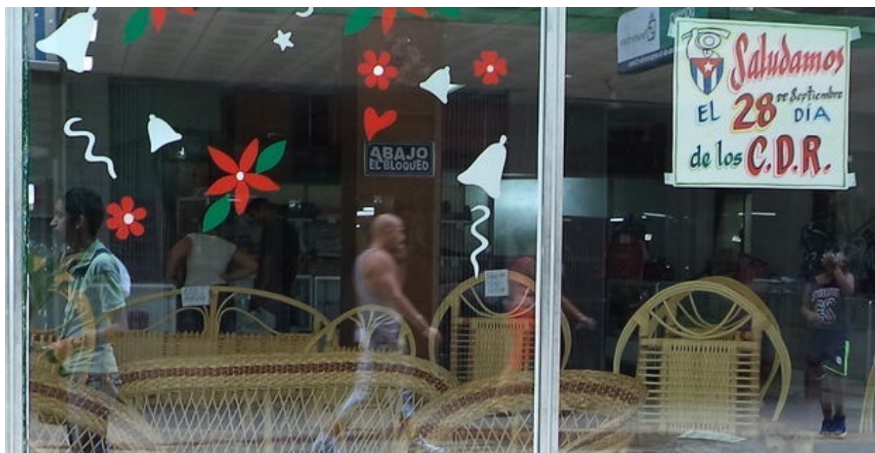
Un cartel saluda el aniversario de los CDR