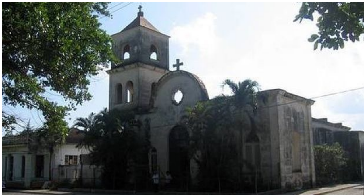
Parroquia Nuestra Señora de la Candelaria, en Candelaria, Artemisa.