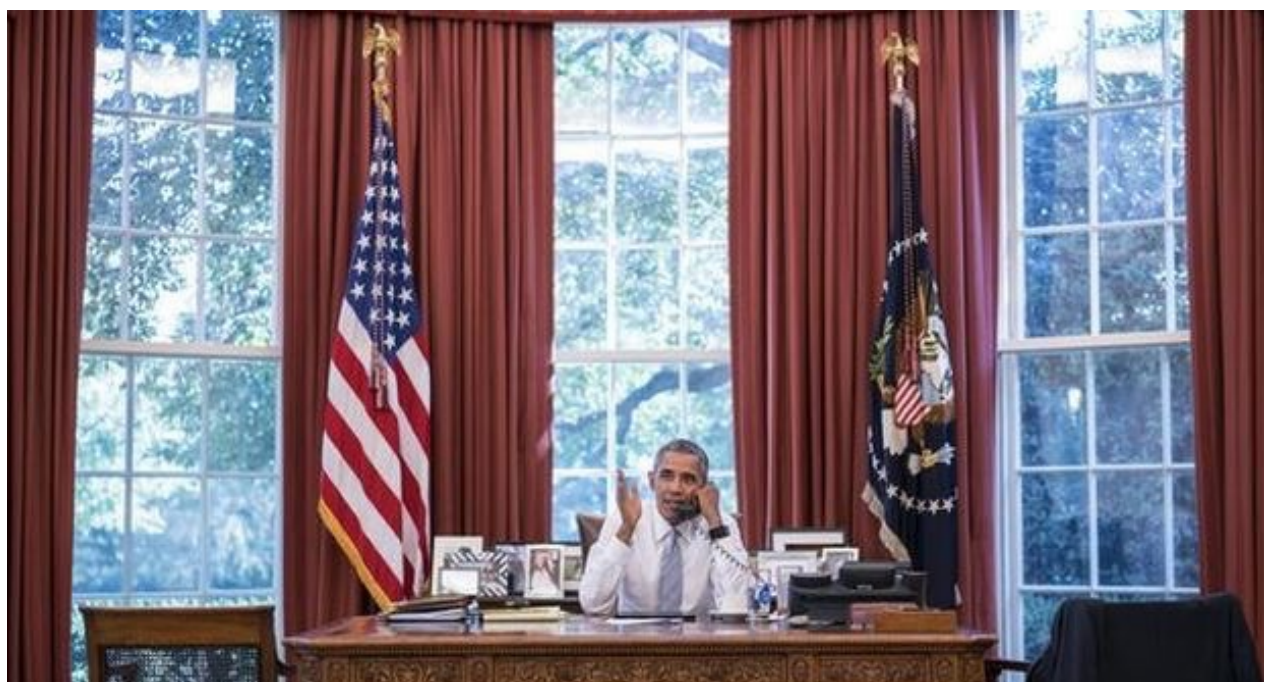
Barack Obama en su despacho de la Casa Blanca (CC)