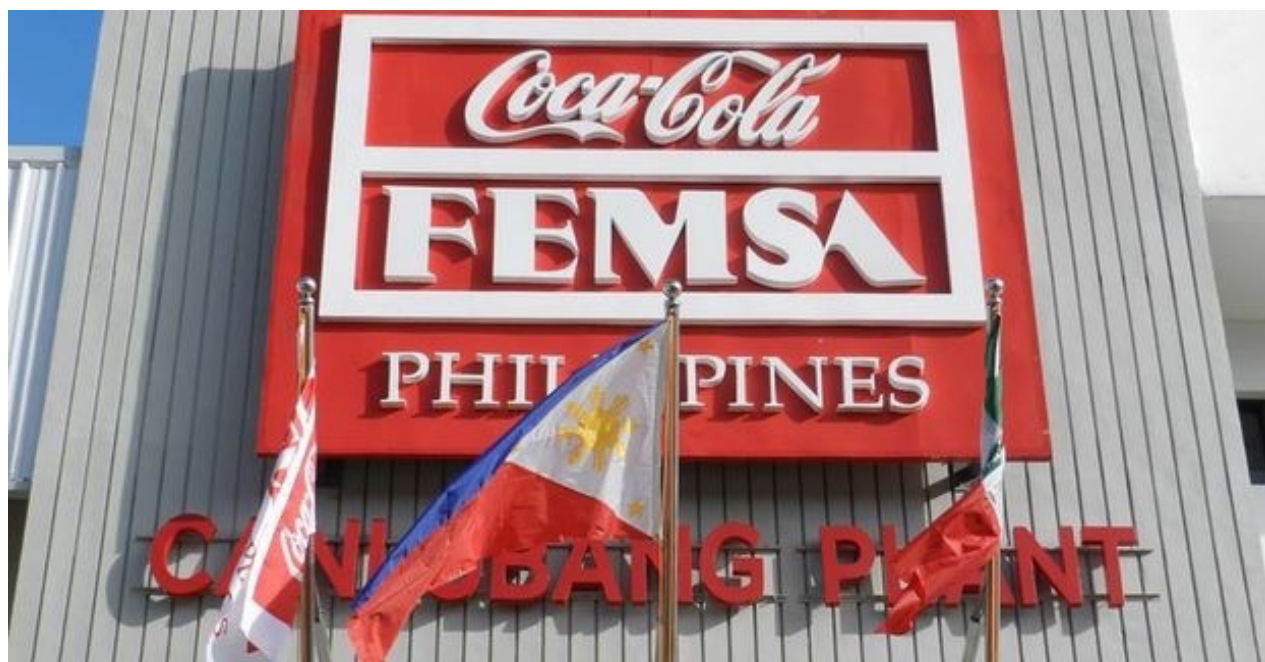
El grupo Coca Cola Femsa (CC)