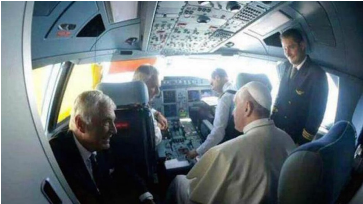
El papa Francisco en la cabina del avión de Alitalia durante su viaje a Cuba