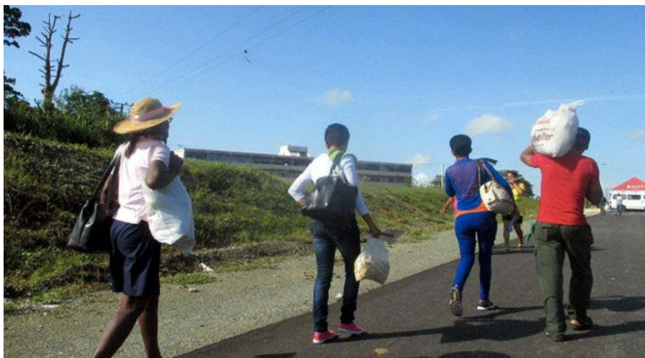
Un grupo de personas cargan sacos y bolsos con los productos gastronómicos ofertados especialmente por la llegada de Francisco.

Ahora sólo nos falta escuchar el próximo discurso público de Raúl Castro para comprobar si también ha sustituido el belicoso ¡Patria o muerte! por el conciso ¡Amén!