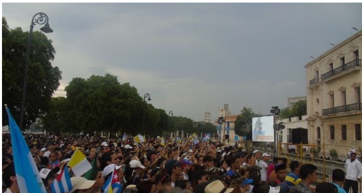
Encuentro del papa Francisco con los jóvenes de la C tedra F lix Varela y la FEU este domingo en La Habana.

Durante su visita, el papa celebrará varias misas, la primera de ellas el domingo en la plaza de la Revolución, otra el lunes en Holguín y una última el martes día 22 en la Basílica menor del Santuario de la Virgen de la Caridad del Cobre, en Santiago de Cuba.