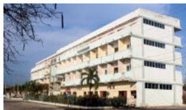
EL COSTA DEL SOL SIN ALBAÑILES