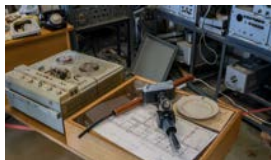
ASÍ ESPIABA EL KGB EN TALLIN