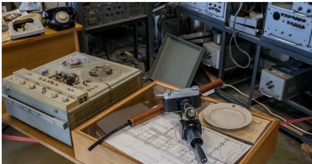
Una cámara usada por los agentes del KGB para capturar imágenes a través de agujeros en las paredes.

En el próximo quinquenio, la empresa espera crecer en otras 500 millones de cajas, y obtener 3.700 millones de dólares adicionales en ingresos, añadió Otazua.