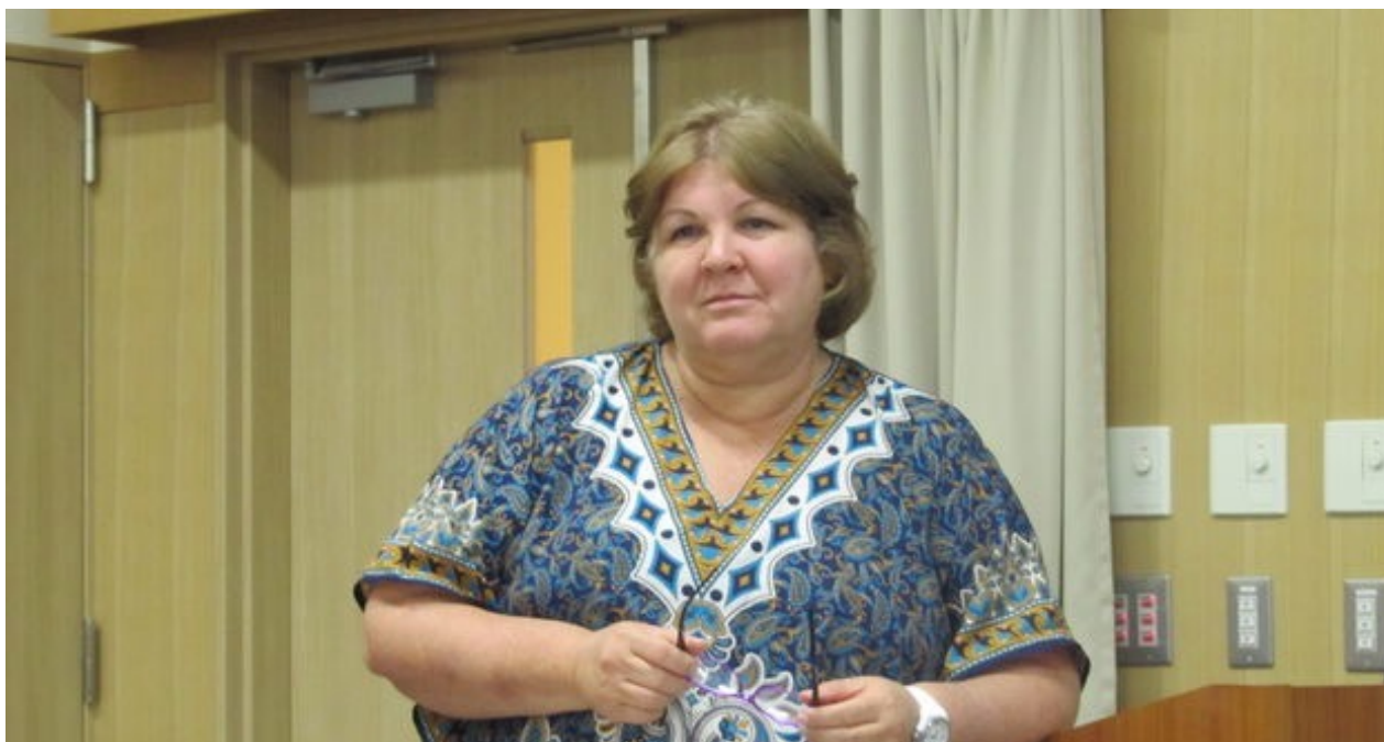
Aleida Guevara en junio de 2014.