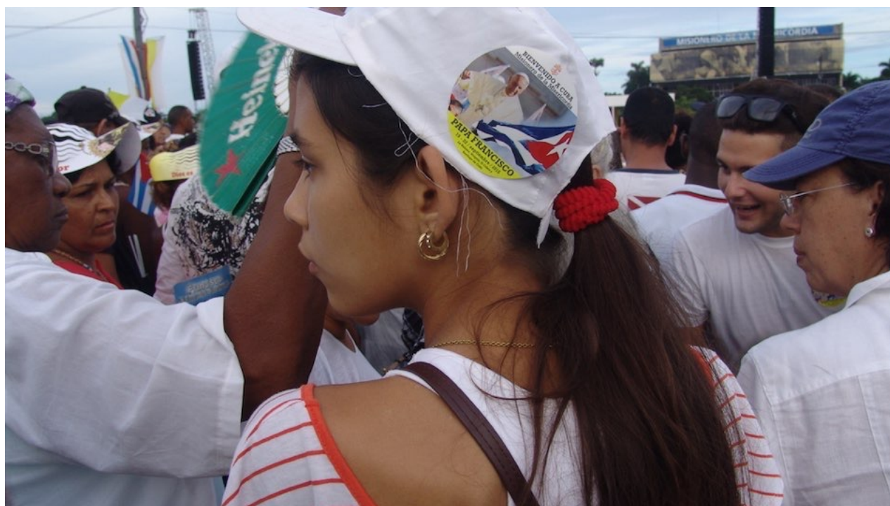
Una joven aguarda por el comienzo de la misa del papa Francisco en la Plaza de la Revolución en La Habana