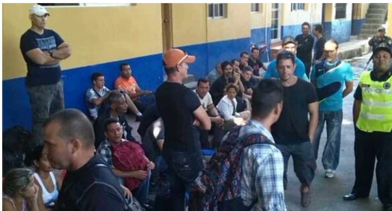
Cubanos detenidos en Honduras mientras intentaban entrar por la frontera