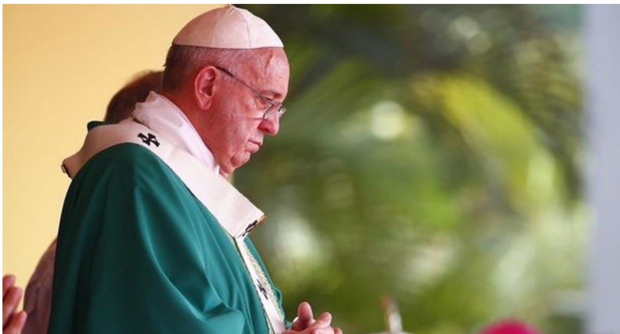
El papa Francisco durante su misa en La Plaza de la Revolución en La Habana

una selección con lo mejor de la semana del primer diario independiente hecho en Cuba