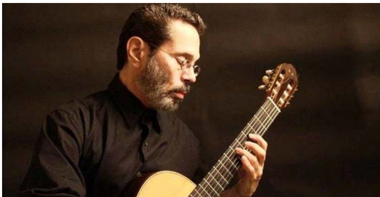
Leo Brouwer interpretando con la guitarra 'Eleanor Rigby'.