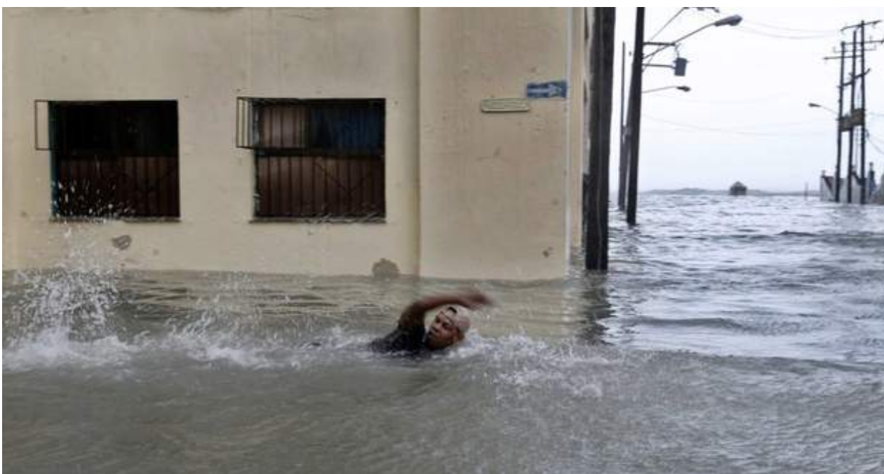
Una calle de San Leopoldo, en Centro Habana, quedó completamente inundada y algunos se desplazaban a nado.

Una selección con lo mejor de la semana del primer diario independiente hecho en Cuba