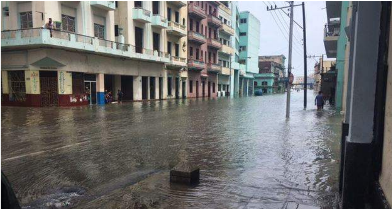
La calle San Lázaro, en Centro Habana, amaneció este domingo inundada.