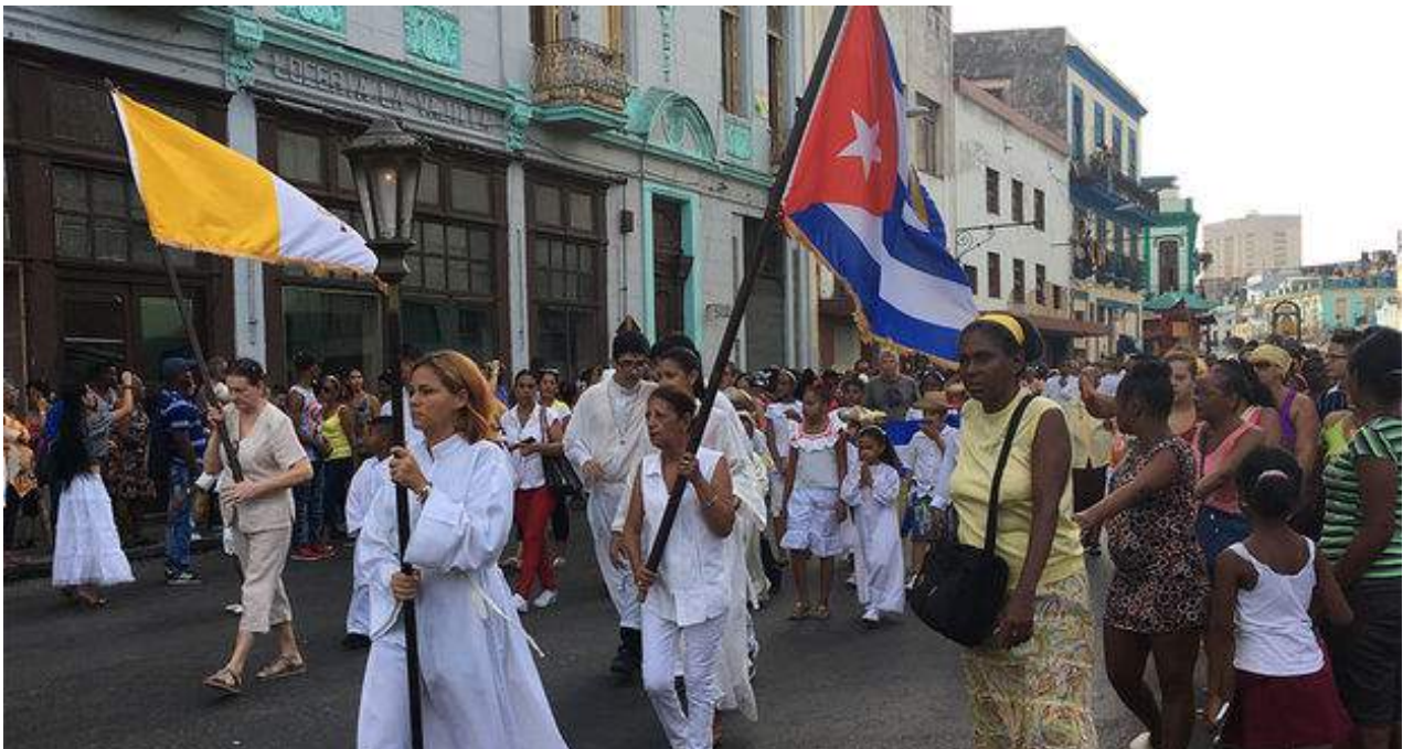
Miles de feligreses participaron este viernes en la procesión por la Virgen de la Caridad del Cobre, Patrona de Cuba.

El huracán ha causado la muerte de al menos 25 personas en su paso por el Caribe y supone una "amenaza para la vida", en los Cayos y la costa occidental de Florida, según el Centro Nacional de Huracanes (CNH). Las autoridades cubanas todavía no han dado reportes de fallecidos.