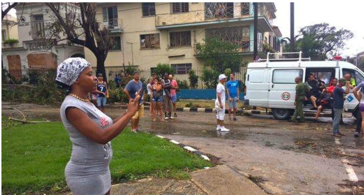
Una mujer filma con su teléfono en La Habana imágenes de los daños dejados por Irma.