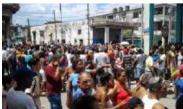
PROTESTA EN LA HABANA POR LA FALTA DE LUZ