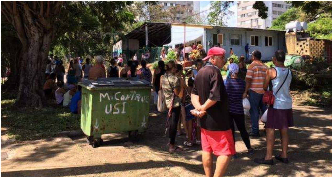
Cola para comprar el pan liberado tras el paso del huracán Irma por La Habana. (14ymedio)