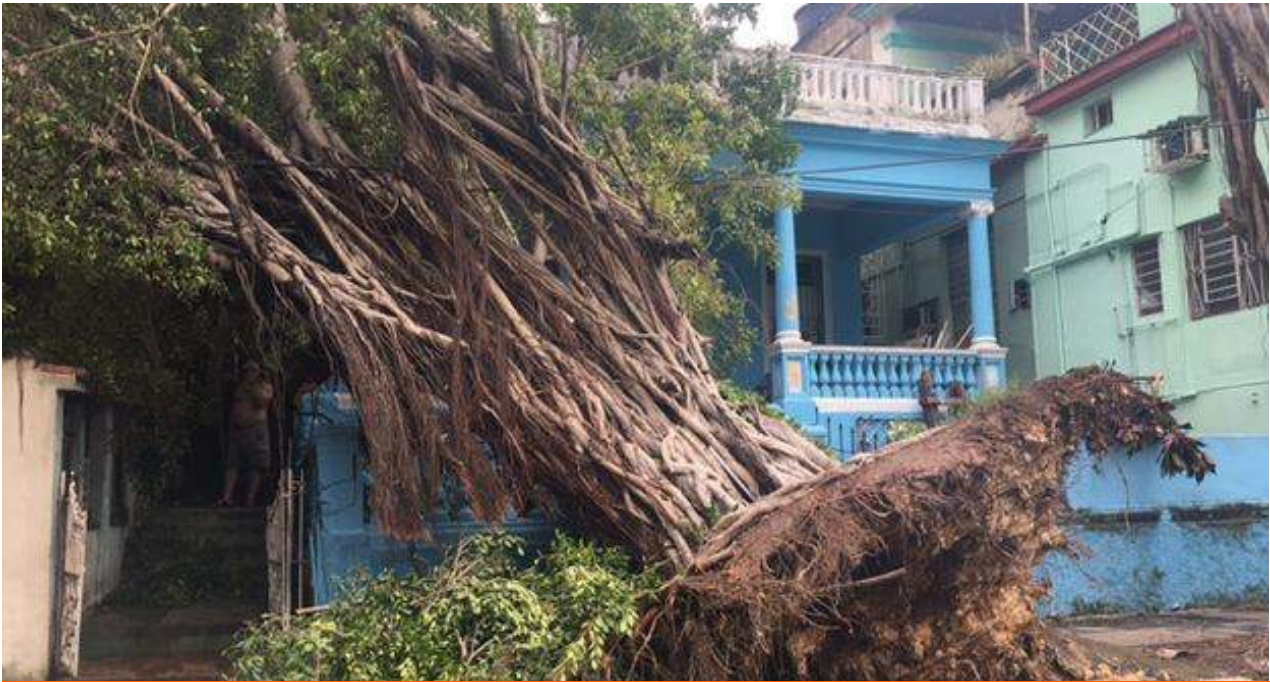
En La Habana han caído numerosos árboles debido a los fuertes vientos del huracán Irma.