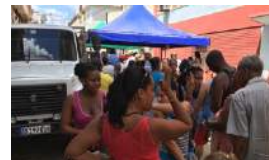
INDIGNACIÓN ANTE LA GESTIÓN DEL GOBIERNO