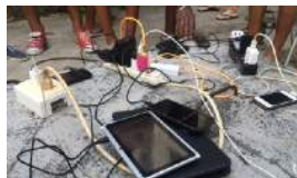
LOS NEGOCIOS DE LA URGENCIA Y LA PRECARIEDAD