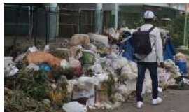
LAS LECCIONES QUE DEJA EL HURACÁN IRMA