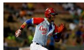
DE VUELTA AL TERRENO DE JUEGO