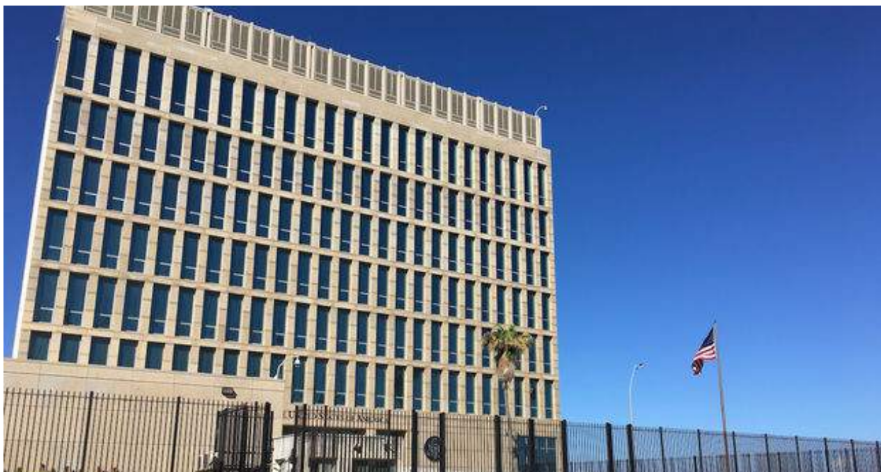
La embajada de EE UU en La Habana.

El líder opositor advierte de que "todos los casos en que el Gobierno trate de impedir la presentación de candidatos independientes, el resultado será la instauración de asambleas municipales viciadas por falta de legitimidad".