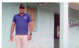
LA SEGURIDAD DEL ESTADO RETUVO A UN CANDIDATO