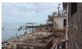
"EL HURACÁN DIO UN TIRO A PUNTA ALEGRE"