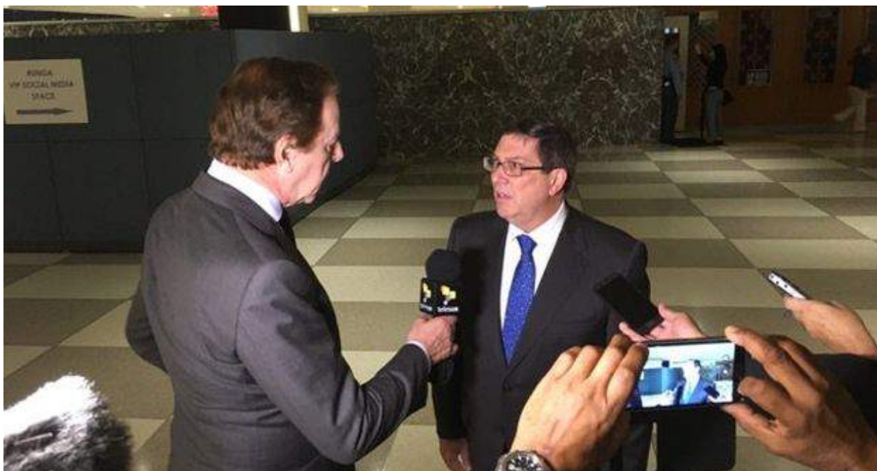
Bruno Rodríguez en declaraciones a 'Telesur' sobre el discurso de Donald Trump.