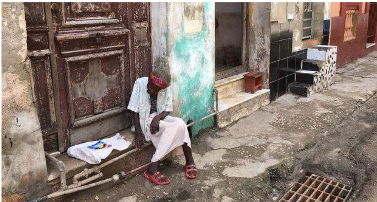
Una anciana sentada en frente de su hogar en La Habana espera a que vuelva la electricidad.