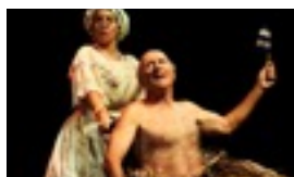
EL HARTAZGO DE LOS CREADORES