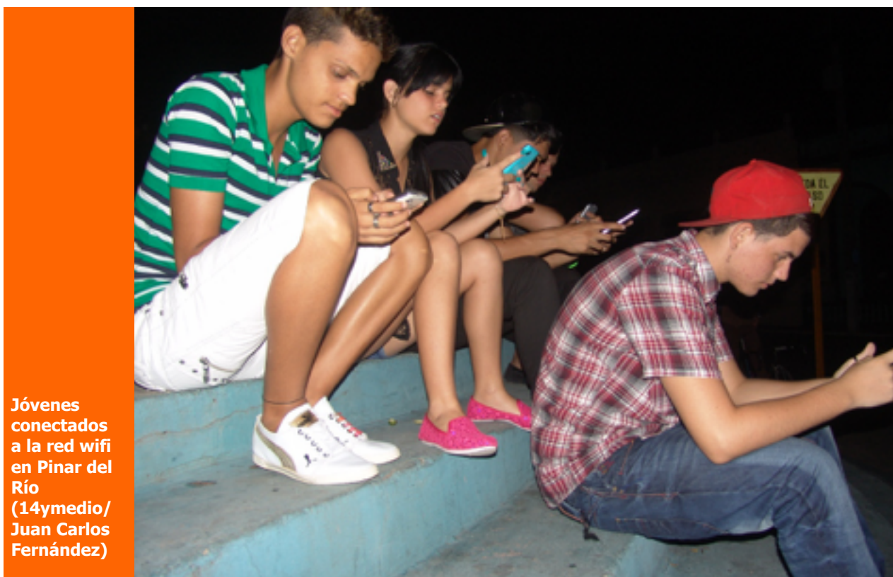
Jóvenes conectados a la red wifi en Pinar del Río

una selección con lo mejor de la semana del primer diario independiente hecho en Cuba