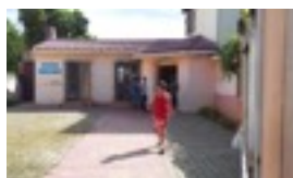
LAVAR, PLANCHAR, TEÑIR