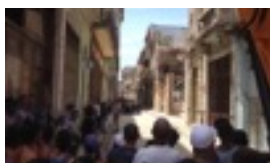
CUATRO MUERTOS EN DERRUMBE