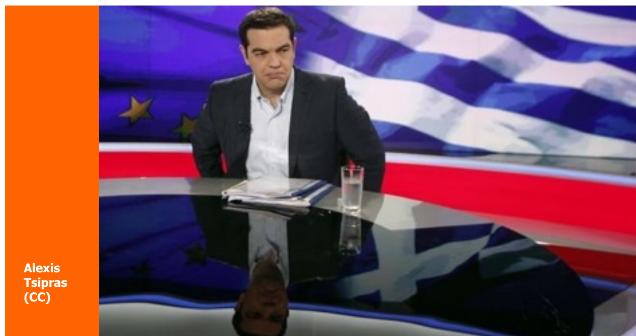
Alexis Tsipras

El investigador destaca que el estrecho vínculo entre la economía nacional y el mercado del petróleo está afectando a las reservas del país, debido a la caída del precio de los hidrocarburos.