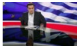
LA "TRAICIÓN" DE TSIPRAS