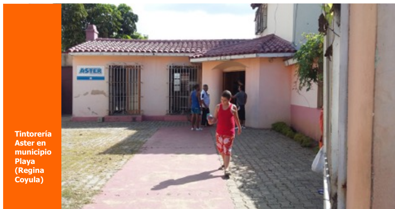
Tintorería Aster en municipio Playa (Regina Coyula)

Algunos rechazan tantos cuidados para las mascotas. "¿Cómo un perro va a comer mejor que un ser humano?", se quejaba Chicho, un septuagenario que fue a comprar una escoba plástica al complejo de Tiendas Galerías Paseo, frente al hotel Cohiba, pero se topó con una tienda para mascotas donde una saco de tres kilogramos de comida para perros supera los 15 pesos convertibles. "¡Hay veces que a uno le dan ganas de ladrar y de mover la cola!", soltó el anciano con un gran sonrisa.