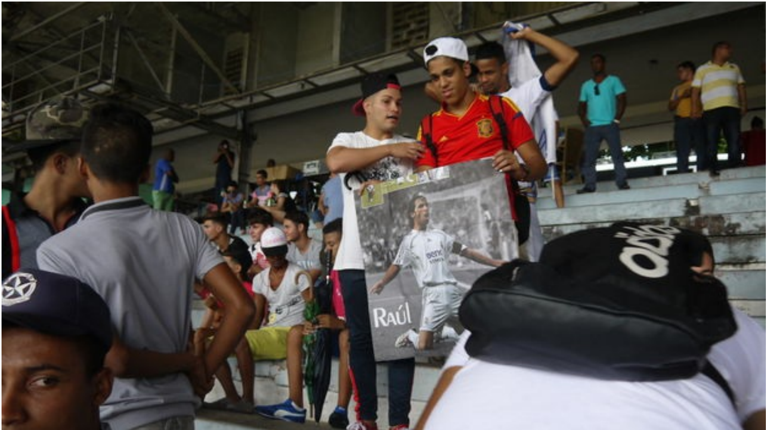
El más esperado y aplaudido por la afición fue el jugador exmadridista Raúl González