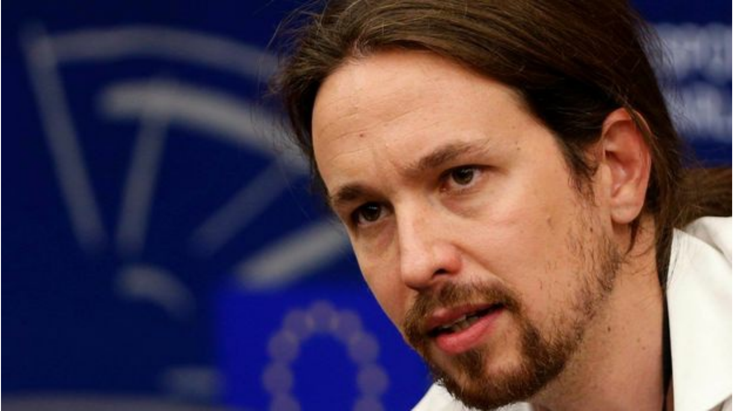
Pablo Iglesias, secretario general de Podemos.