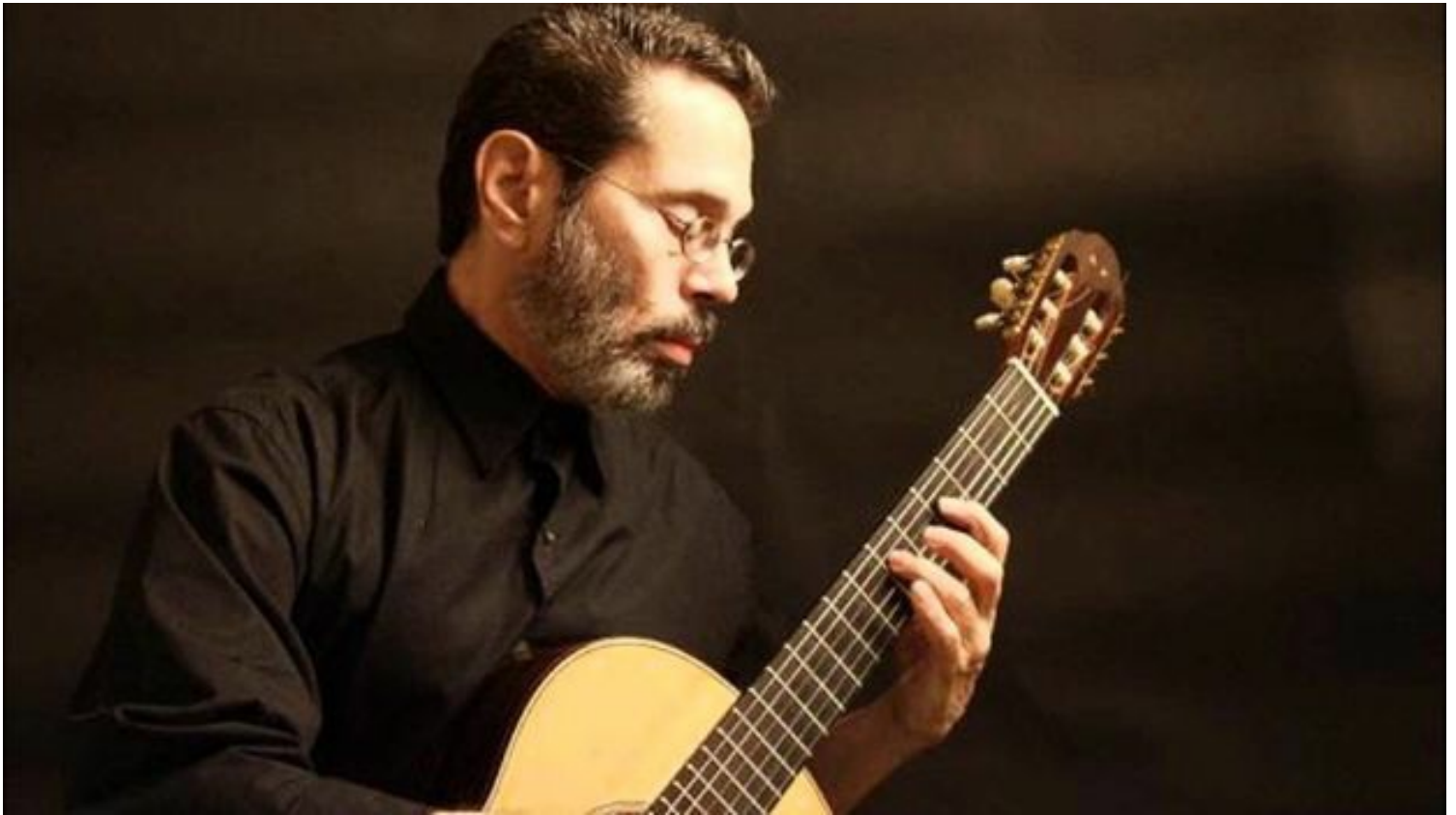
Leo Brouwer interpretando con la guitarra 'Eleanor Rigby'.