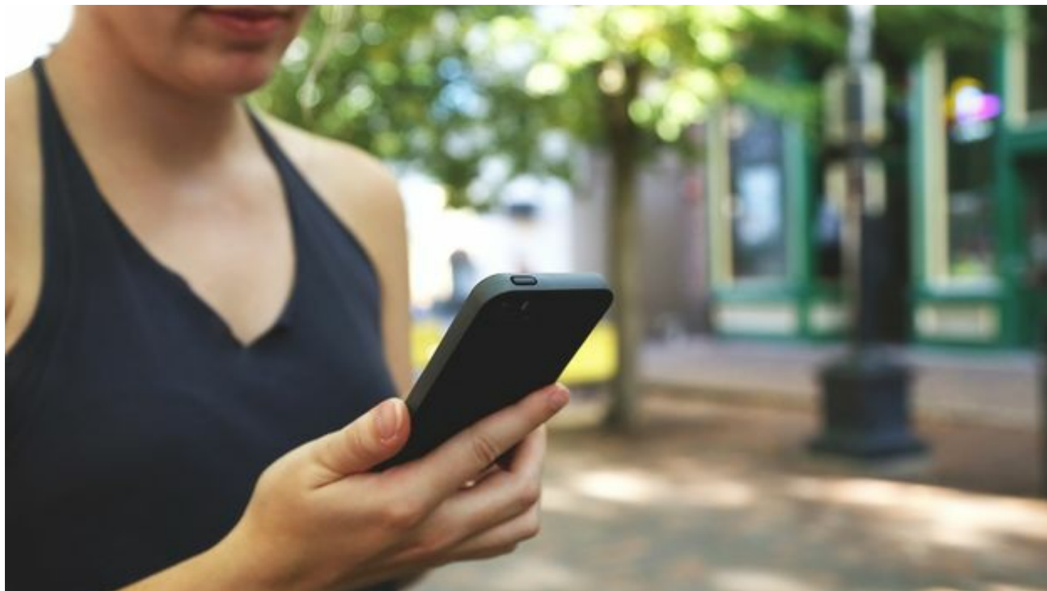
Una mujer consulta su teléfono móvil. (CC)