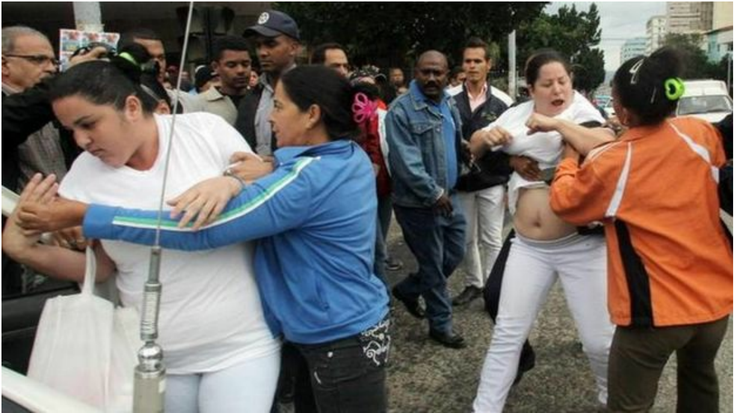
Arresto contra disidentes en Cuba