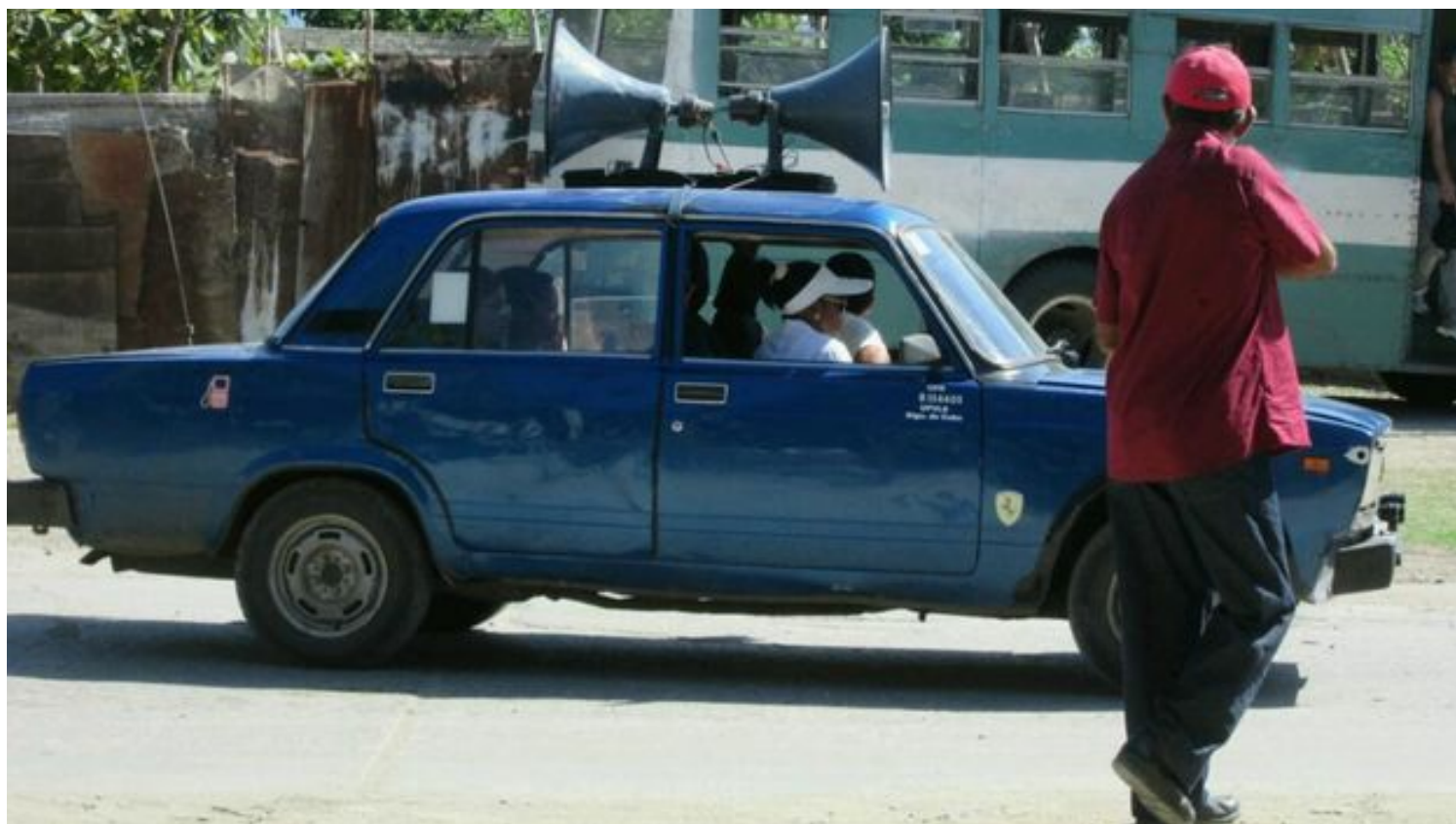
Uno de los autos, con altoparlantes, anuncia las medidas epidemiológicas a tomar.