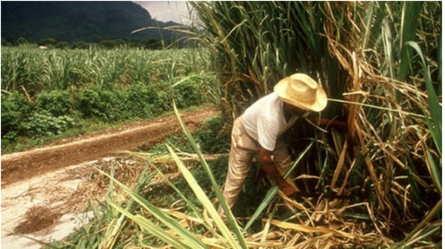
Corte de caña en Cuba.