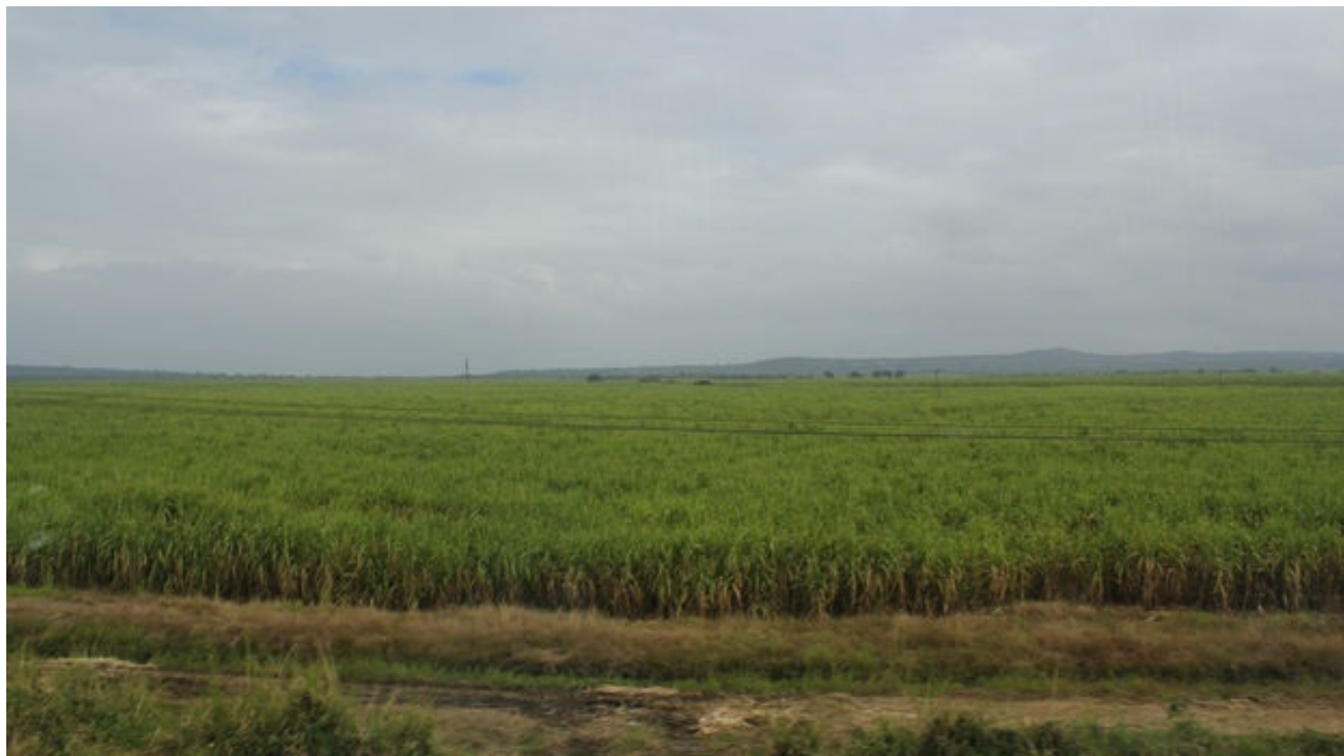
Un campo de caña de azúcar en Cuba.