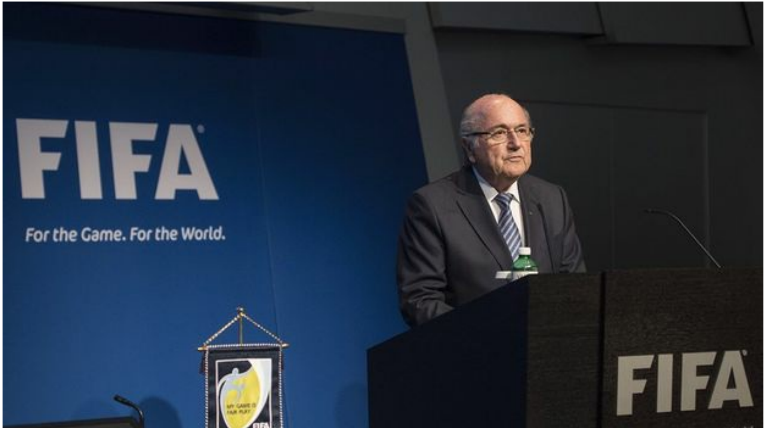
Joseph Blatter dimite tras 17 años al frente del cargo y con la institución inmersa en un gran caso de corrupción.