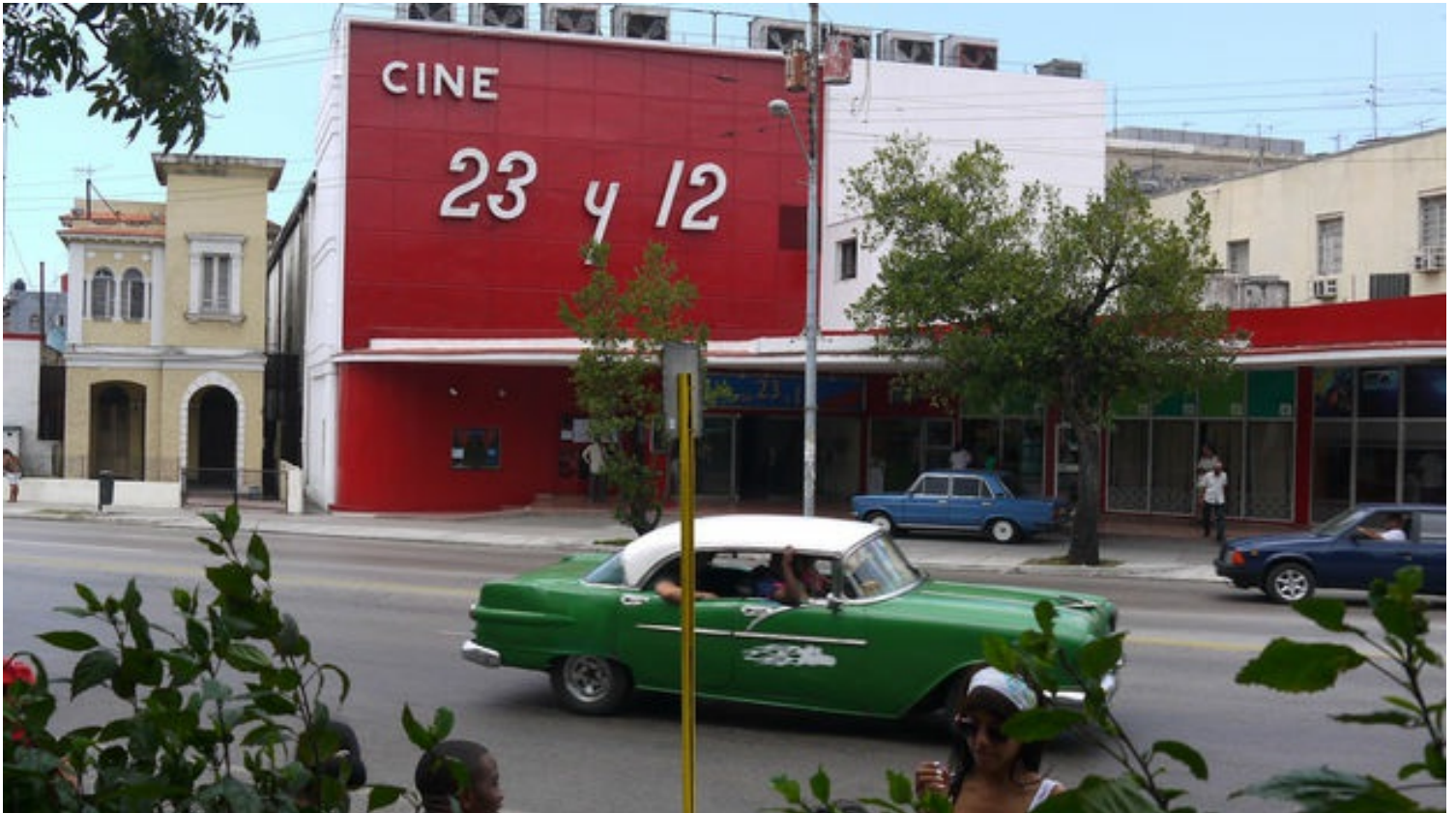
El Cine 23 y 12, en el Vedado, cuenta con tecnología de proyección digital, pero no puede reproducir formato de alta definición en DCP.