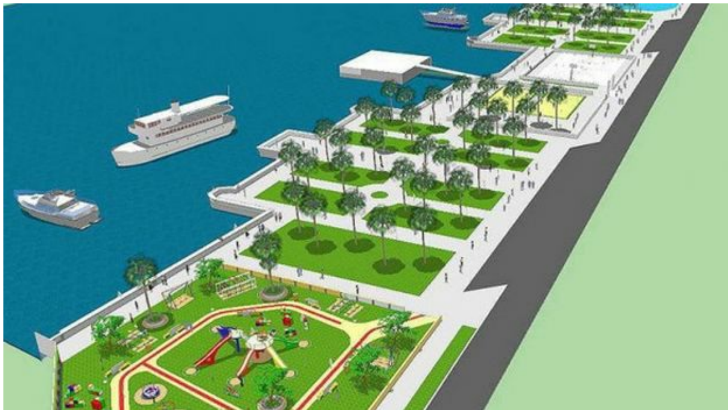
Maqueta del futuro malecón de Santiago. (Oficina del Conservador de Santiago)