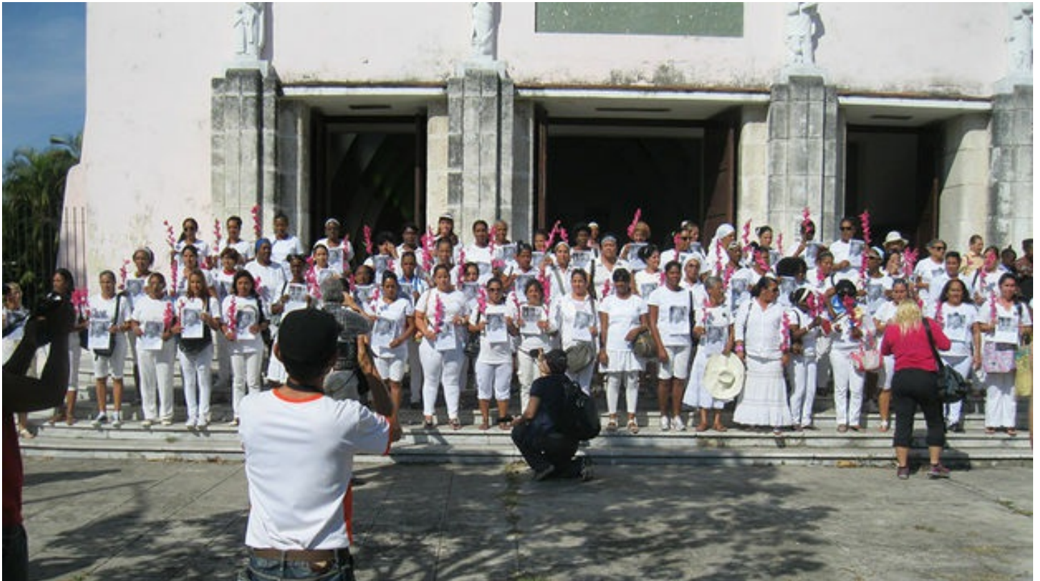
Damas de Blanco frente a la iglesia de Santa Rita en La Habana.