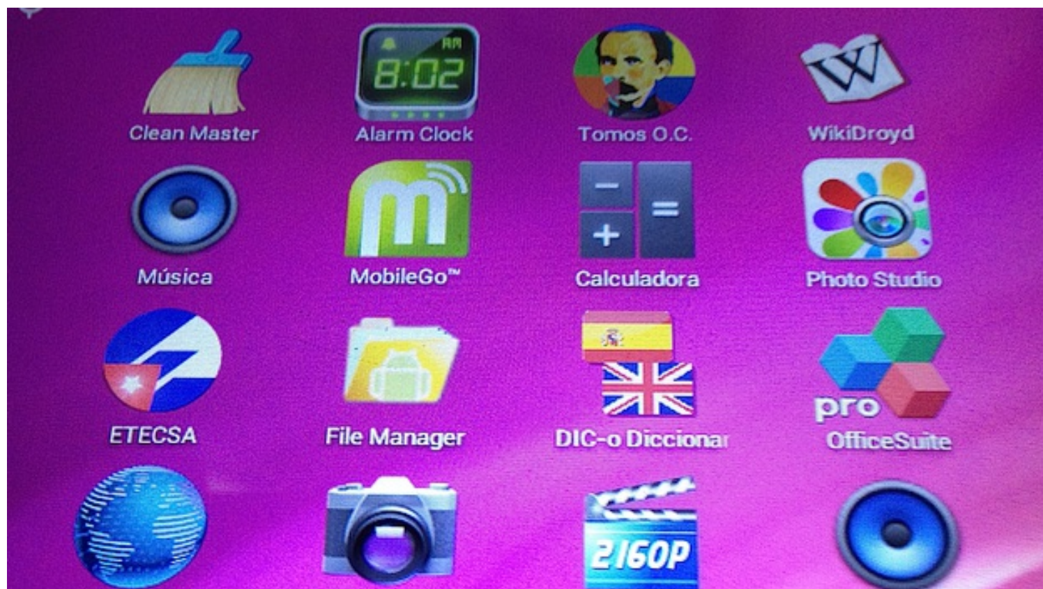
Imagen de la aplicación que contiene las obras completas de José Martí.