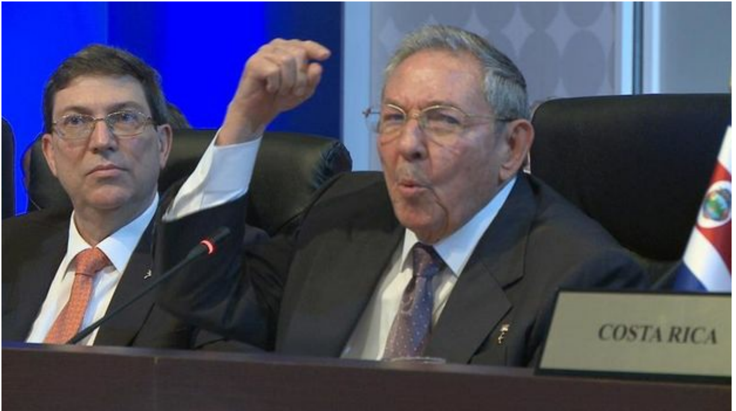
Raúl Castro durante su discurso en la Cumbre de las Américas