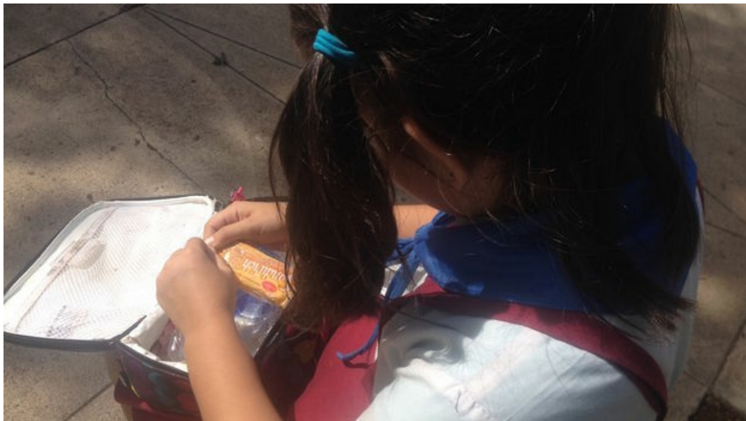
La merienda escolar marca las diferencias económicas entre los niños cubanos. (Luz Escobar)