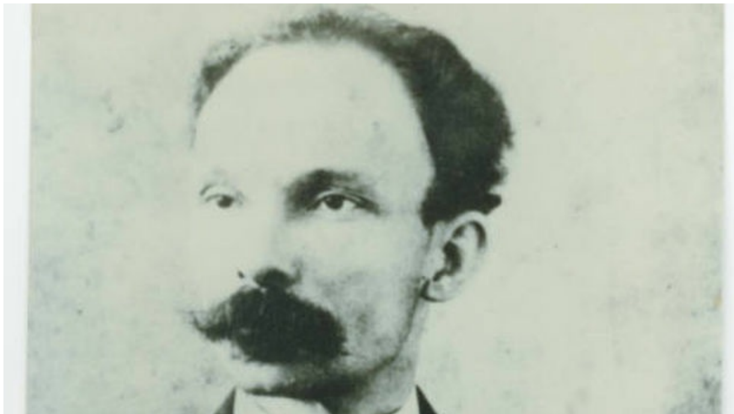
José Martí en una imagen de 1891.