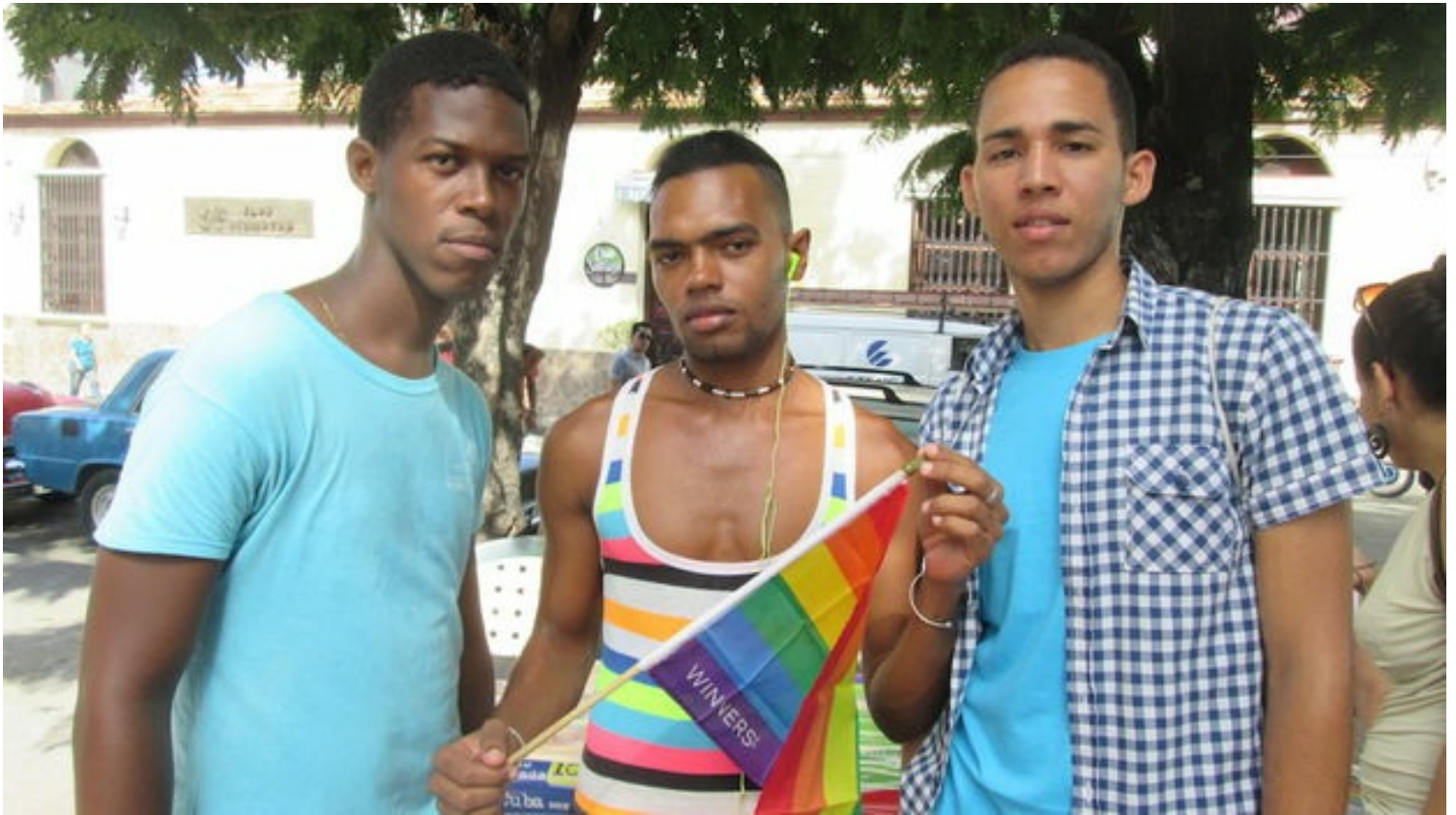
Algunos de los participantes se quejaron de la falta de concurrencia al desfile este año. (14ymedio)