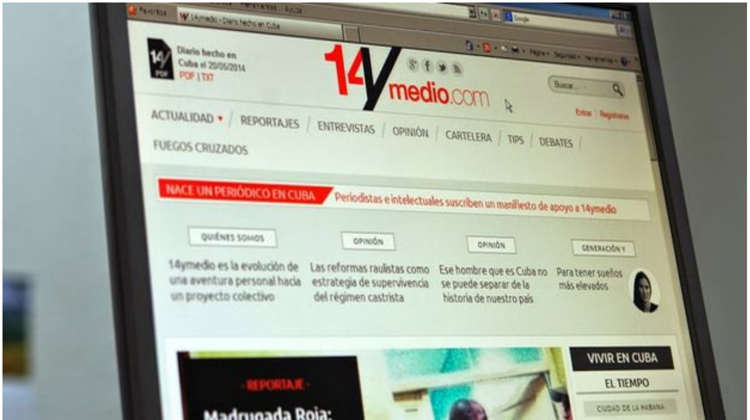
Primera portada de 14ymedio.