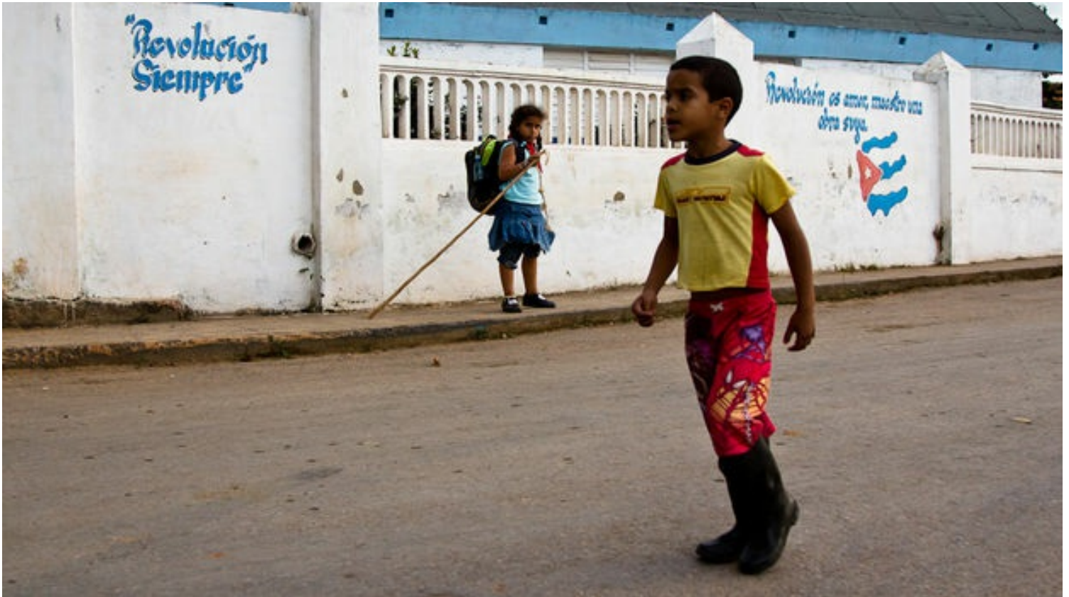
Las nuevas generaciones también tendrán que definir que pasará en Cuba.