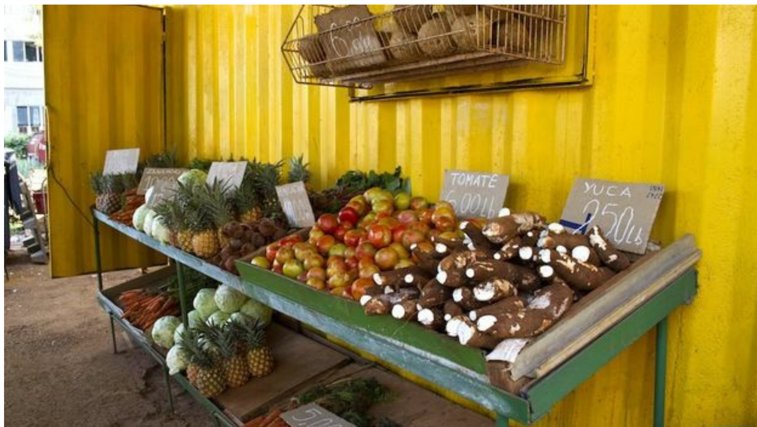
La población se queja de los altos precios de los productos agrícolas.