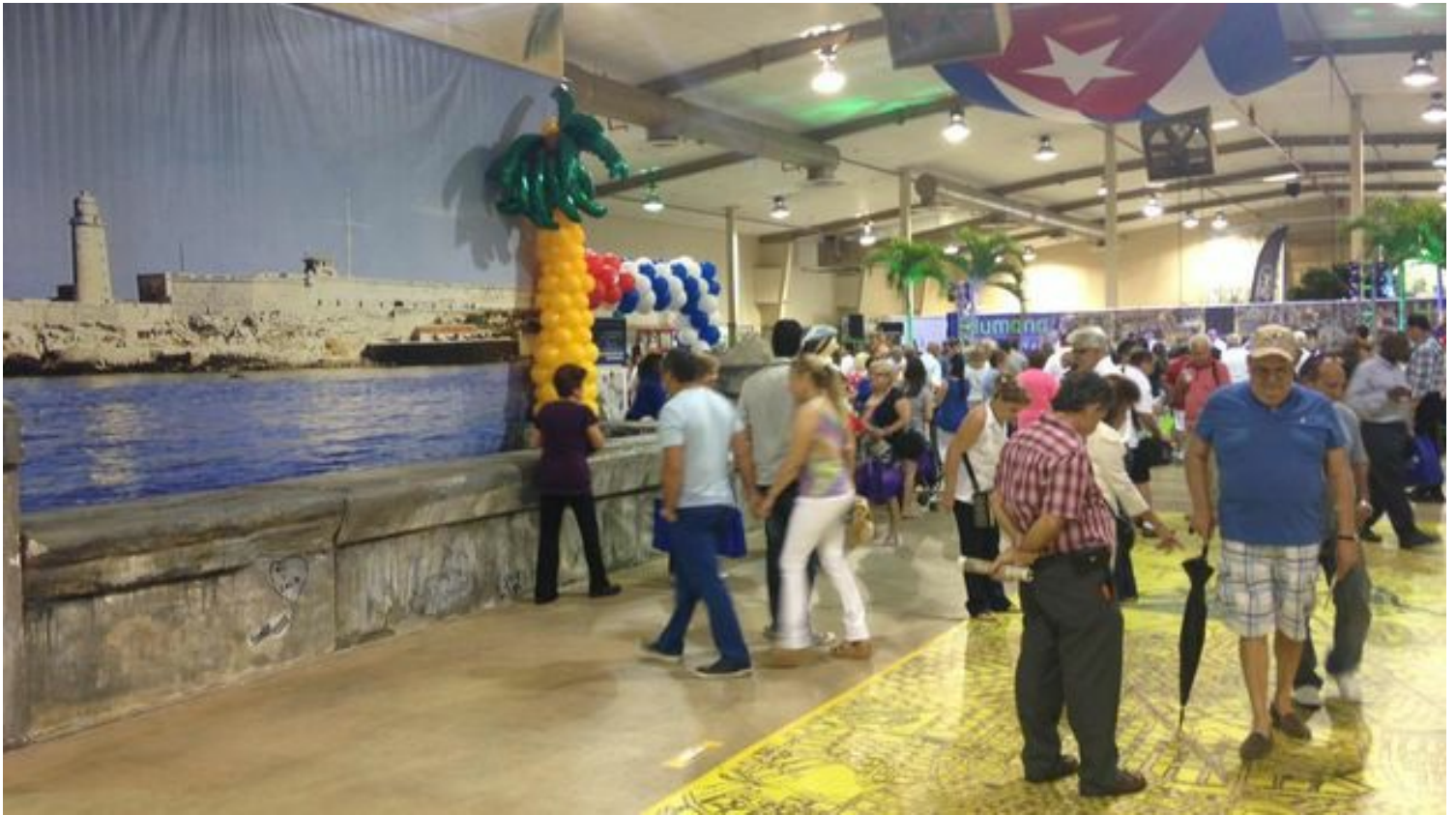
Cuba Nostalgia 2015 se celebró entre el 15 y el 17 de mayo.