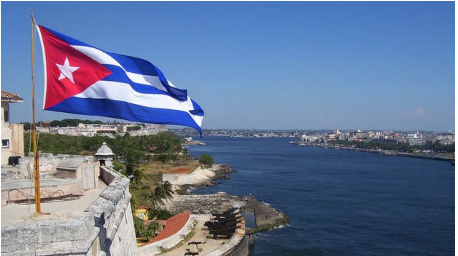
El 20 de mayo de 1902 Cuba se independizó de los Estados Unidos de Norteamérica. (14ymedio)