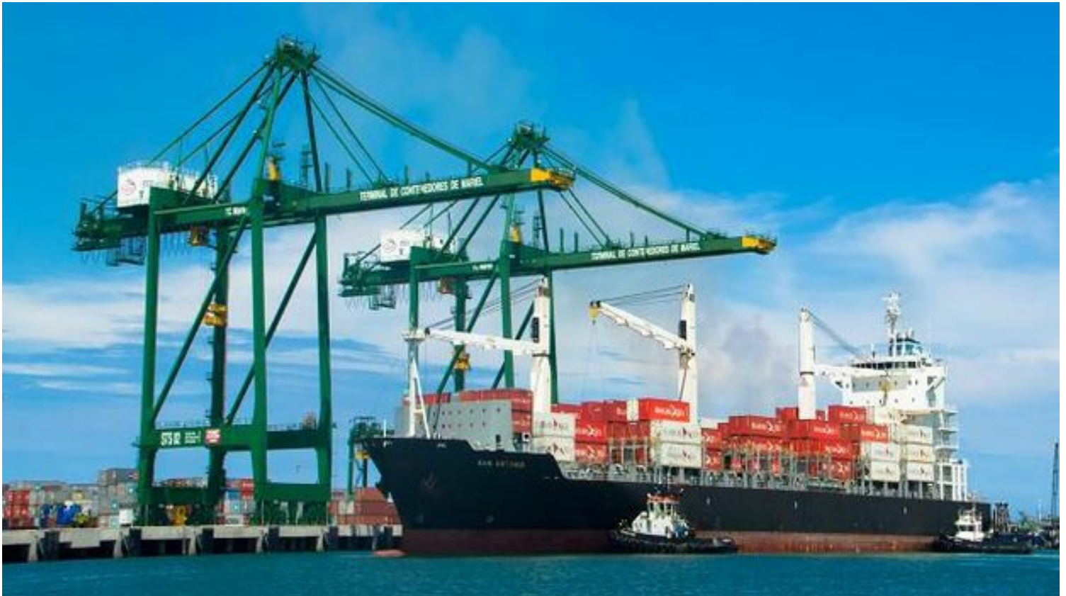
Terminal de Contenedores de la Zona Especial de Desarrollo Mariel