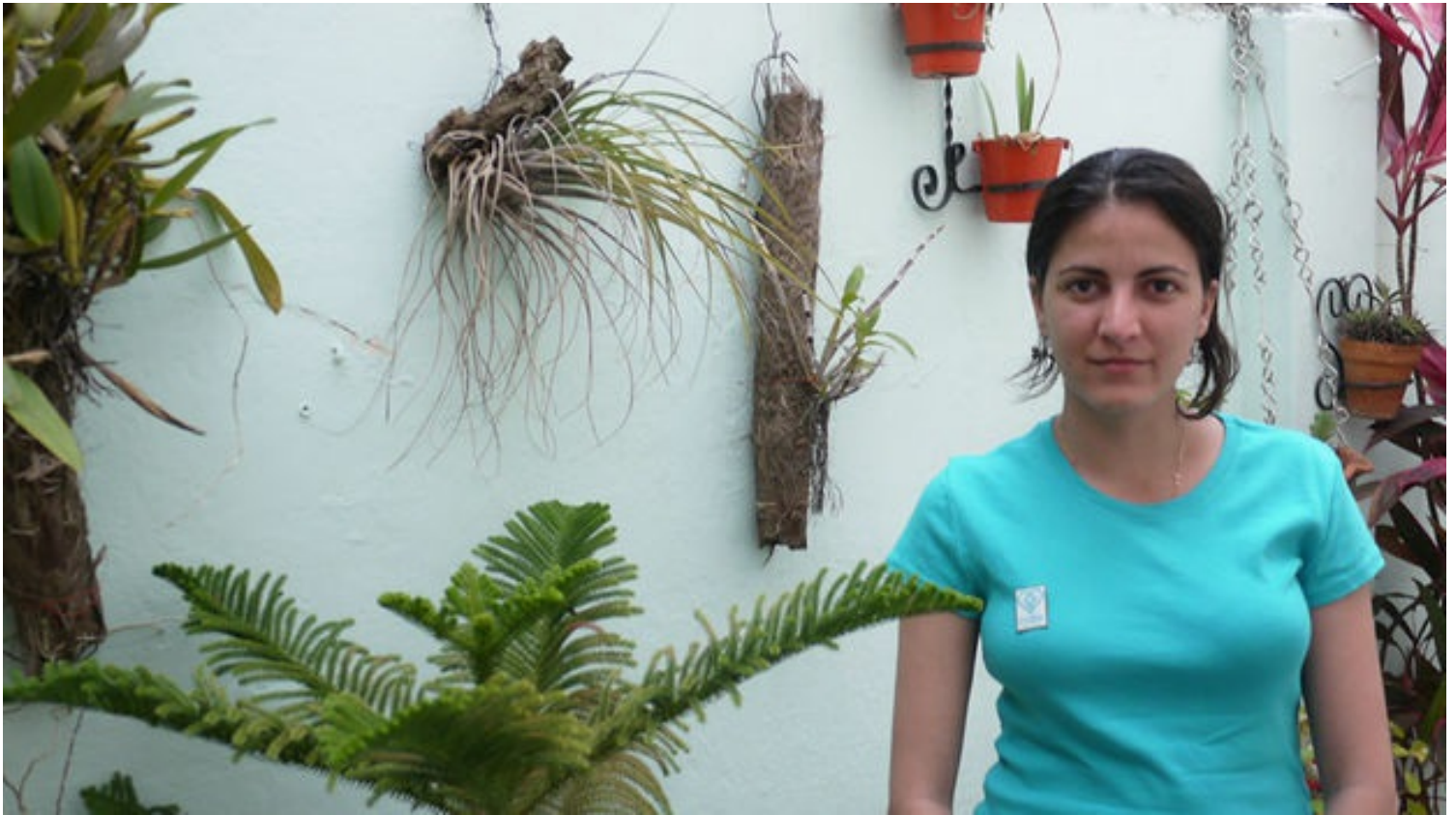
Rosa María Payá.