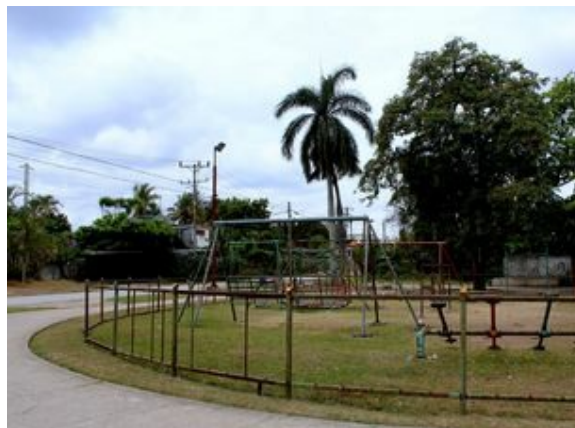
Una valla sin barrotes intenta cuidar un parque descuidado. (Héctor Darío Reyes)

Se trata de lugares de esparcimiento, donde el juego podría convertirse en peligro o en tragedia. Los equipos, todos de metal, presentan herrumbre y torceduras a lo largo de sus piezas. Filosos fierros se esconden en la inocencia de una canal o un columpio. Posibles accidentes evitables.