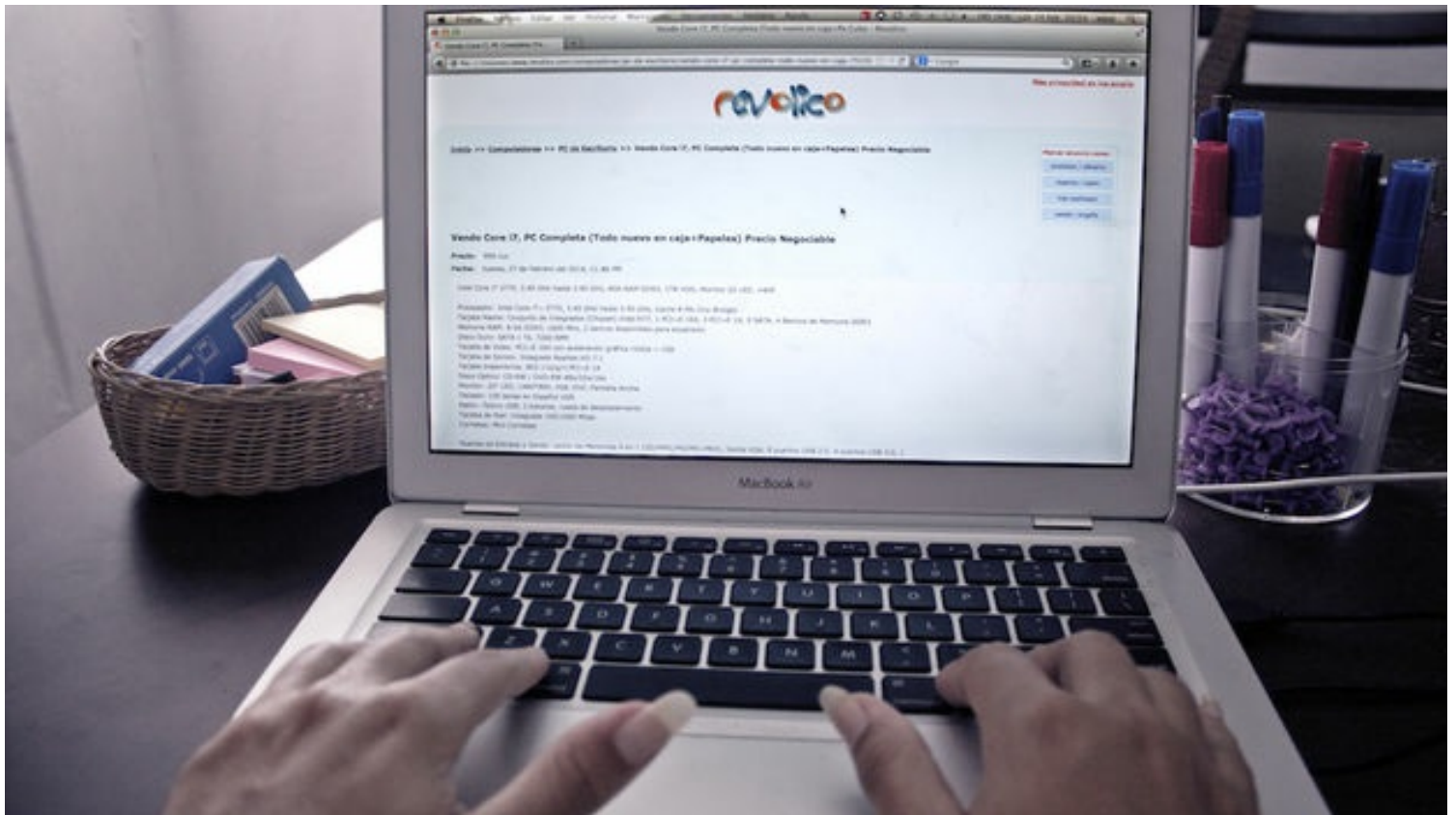
Una usuaria del portal Revolico .