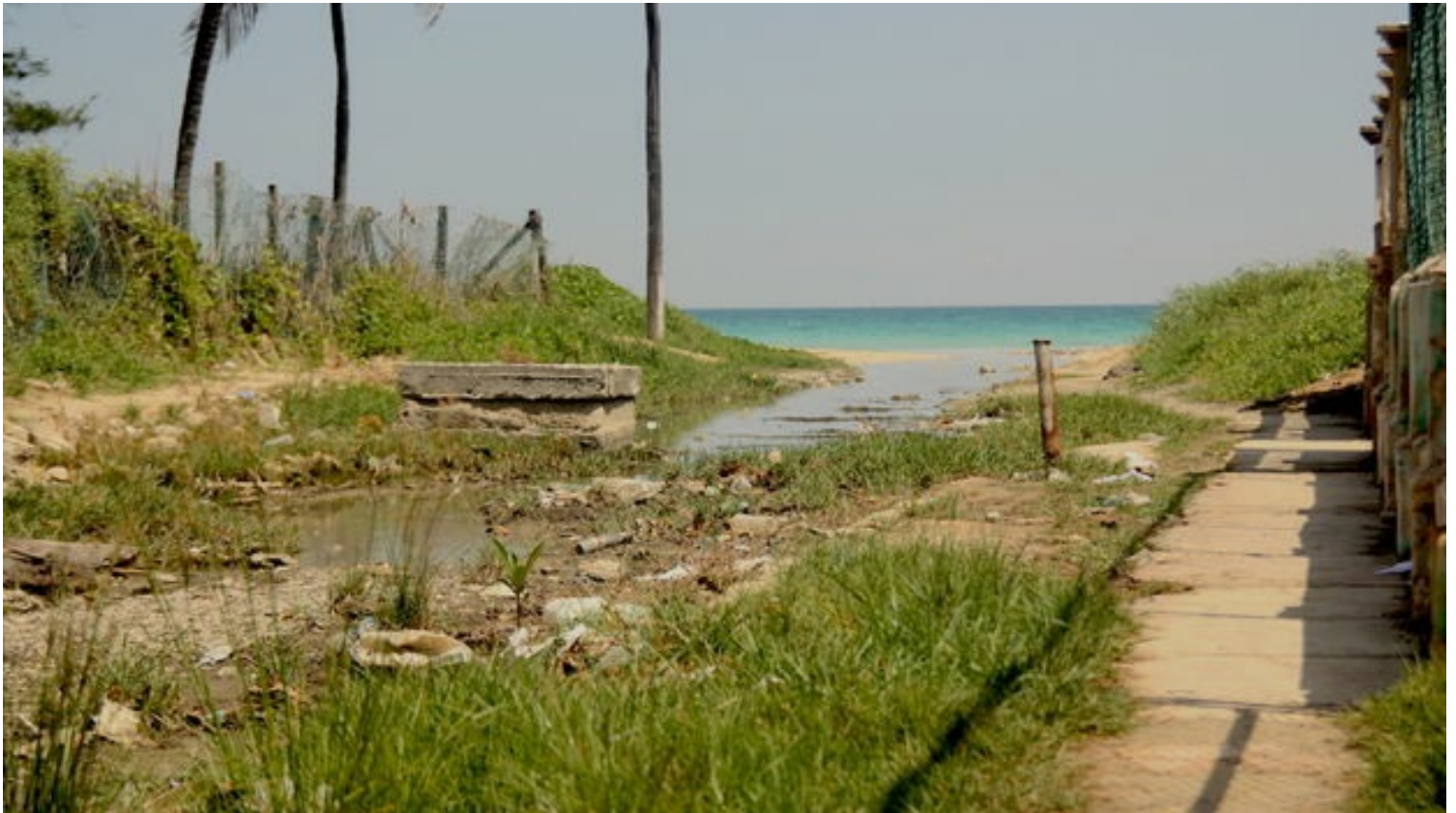
Zanja con aguas albañales del poblado de Guanabo, al Este de La Habana.