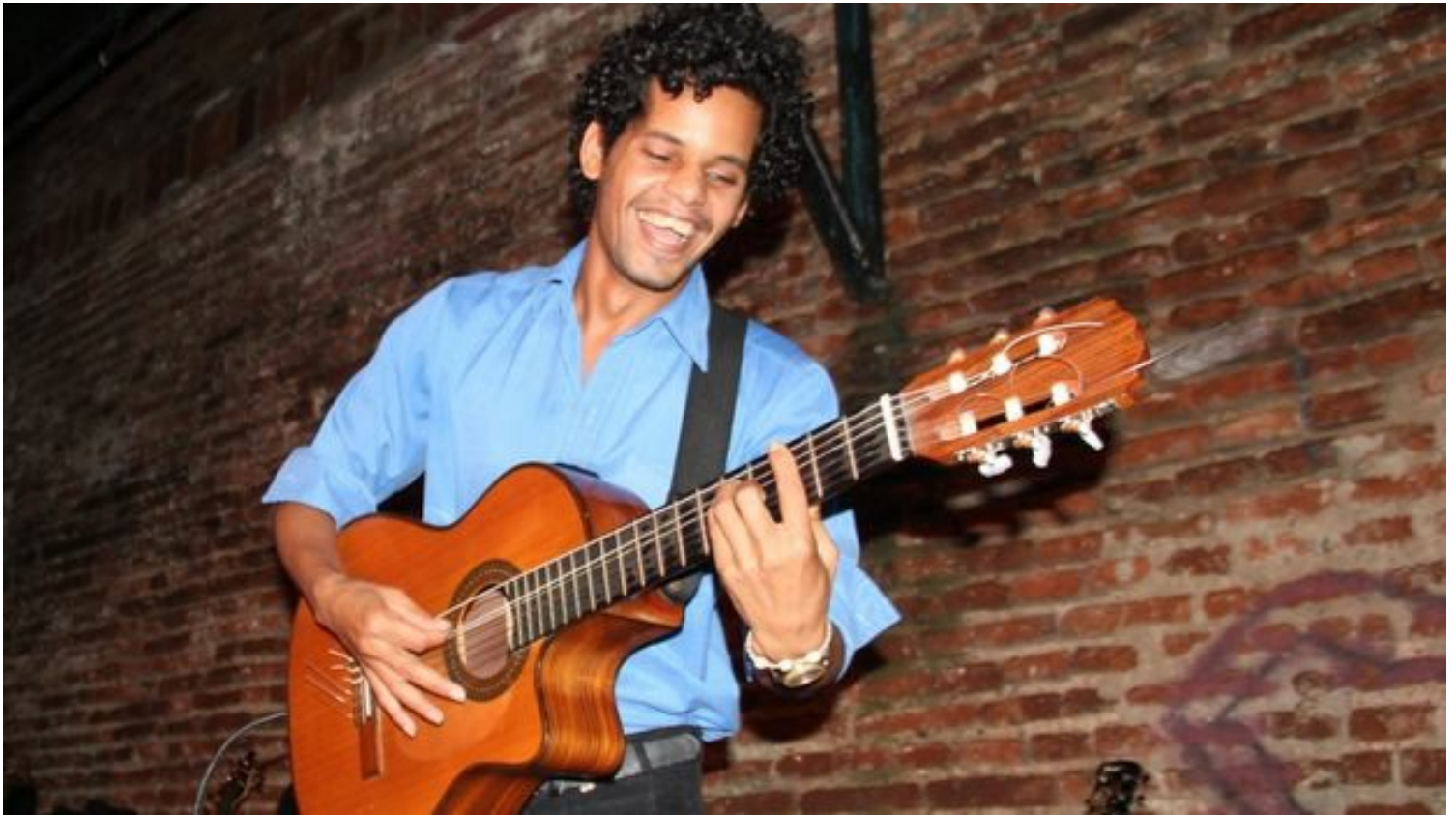
Trovador en El Mejunje, Santa Clara. (Héctor Darío Reyes)