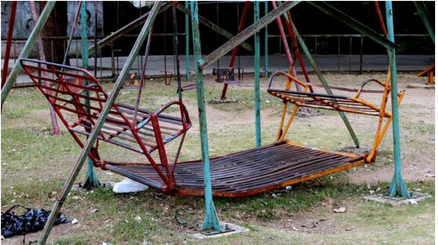
Columpios hundidos, canales agrietadas, sillas que no volarán en el parquecito de Domínguez. (Héctor Darío Reyes)