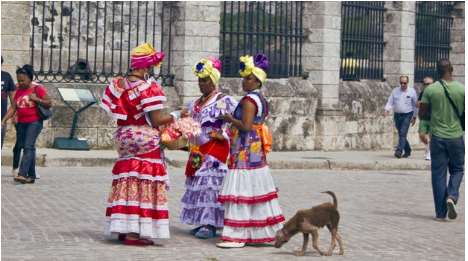
'Damas de compañía' para lograr unos pesos convertibles haciéndose fotos con los turistas extranjeros.