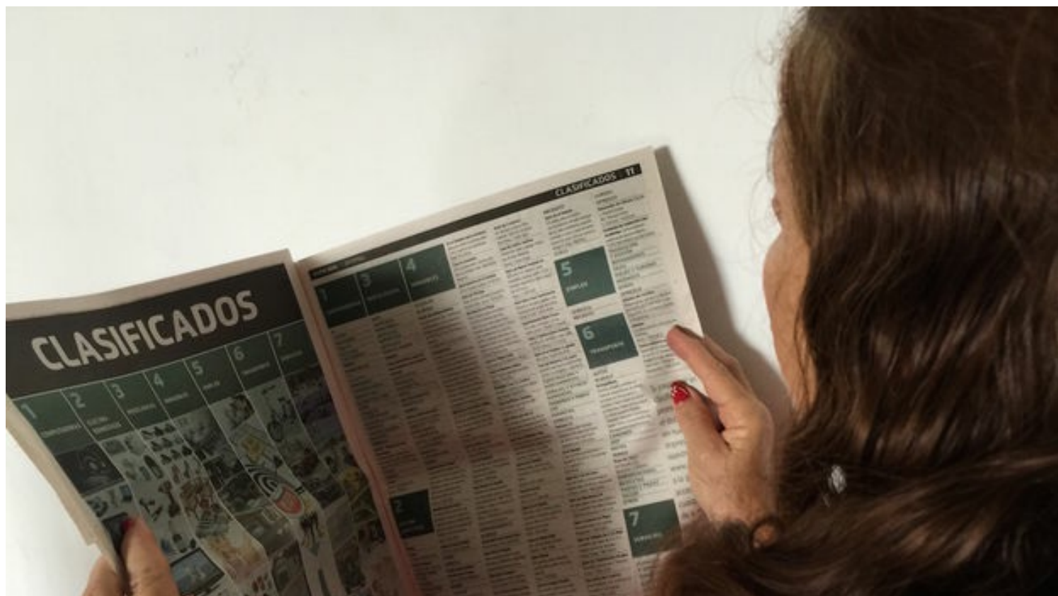
'Ofertas', el nuevo medio de anuncios clasificados.