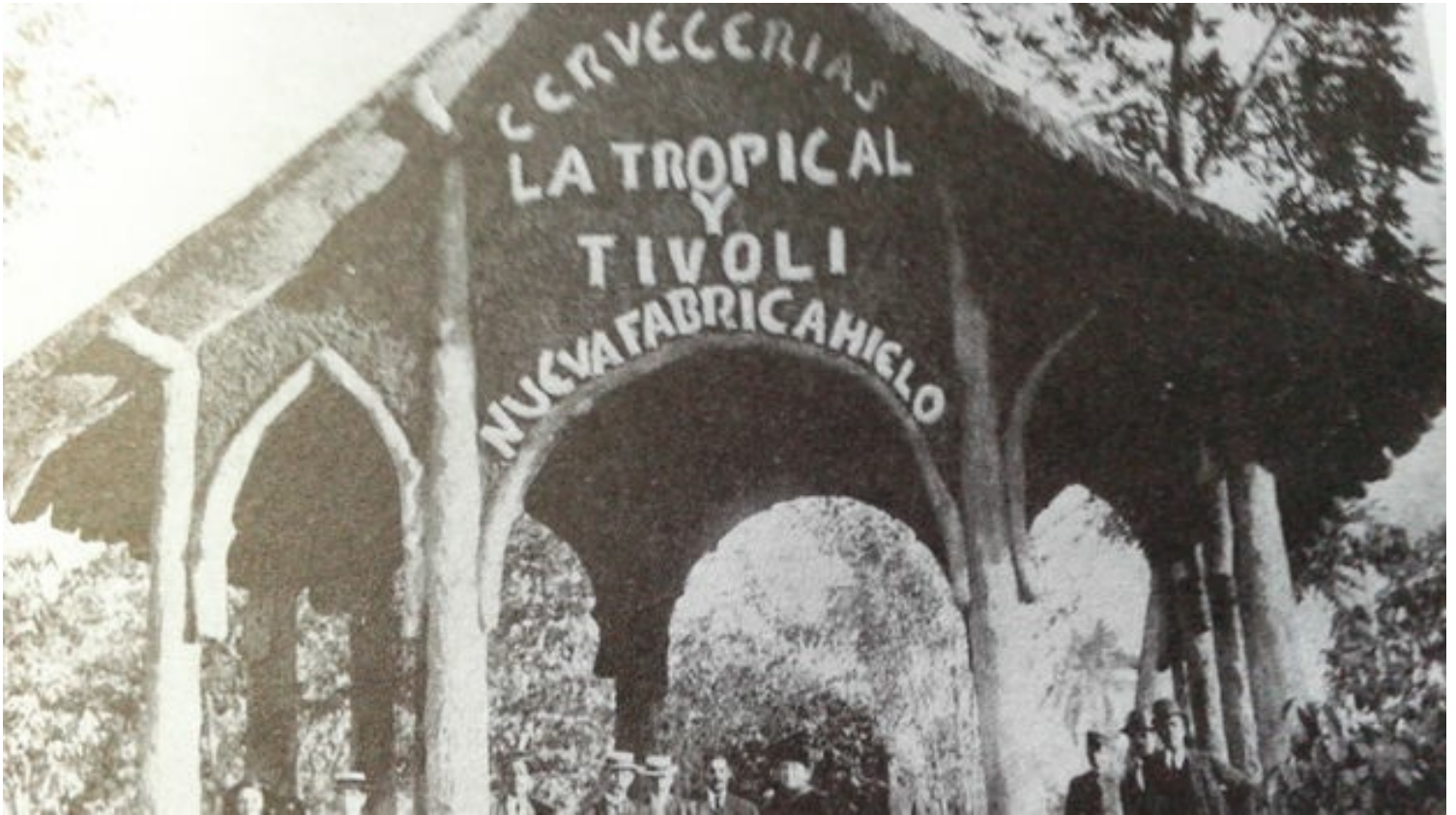
Cervecería La Tropical.