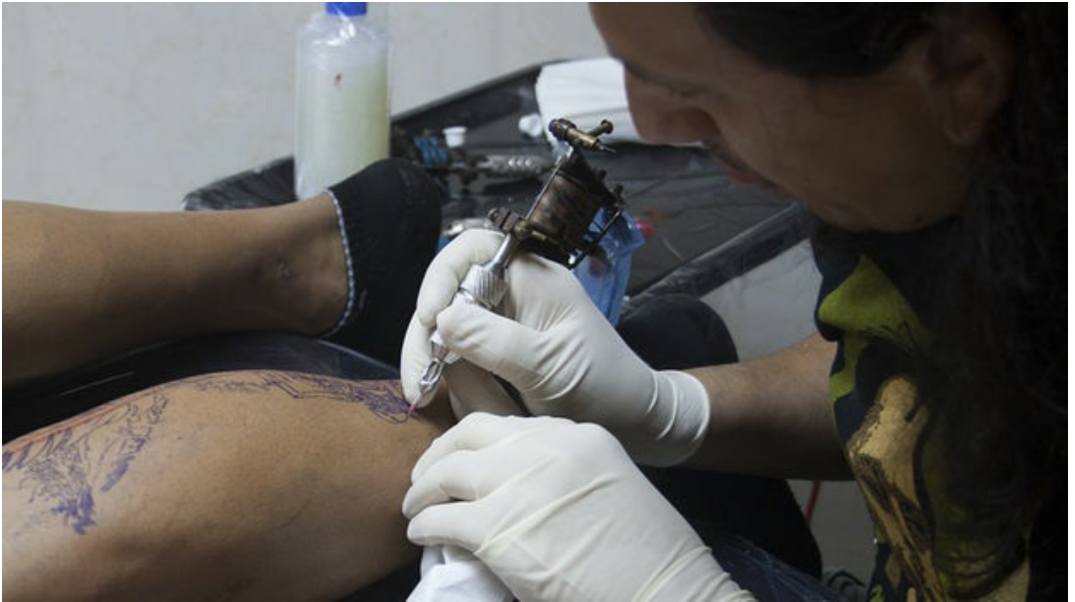
Un tatuador.