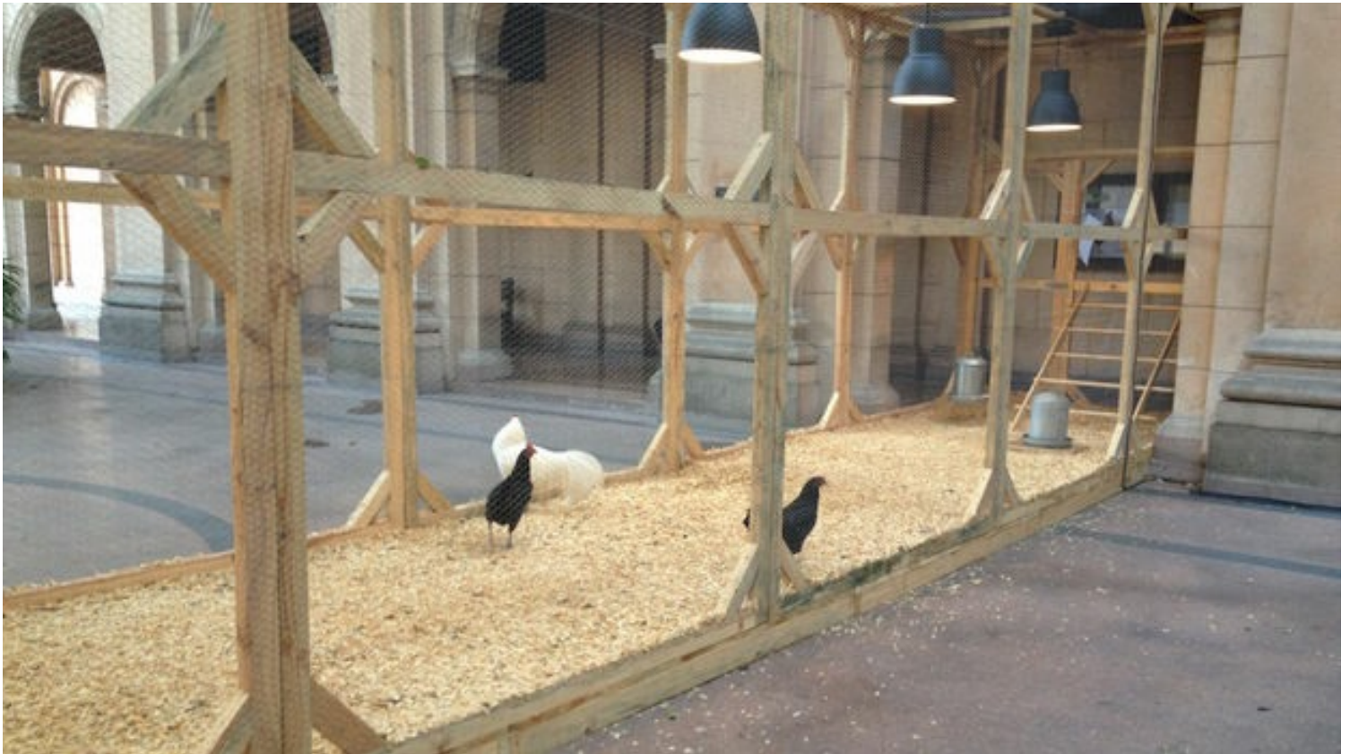
Las gallinas cubalaya en la Universidad de La Habana.