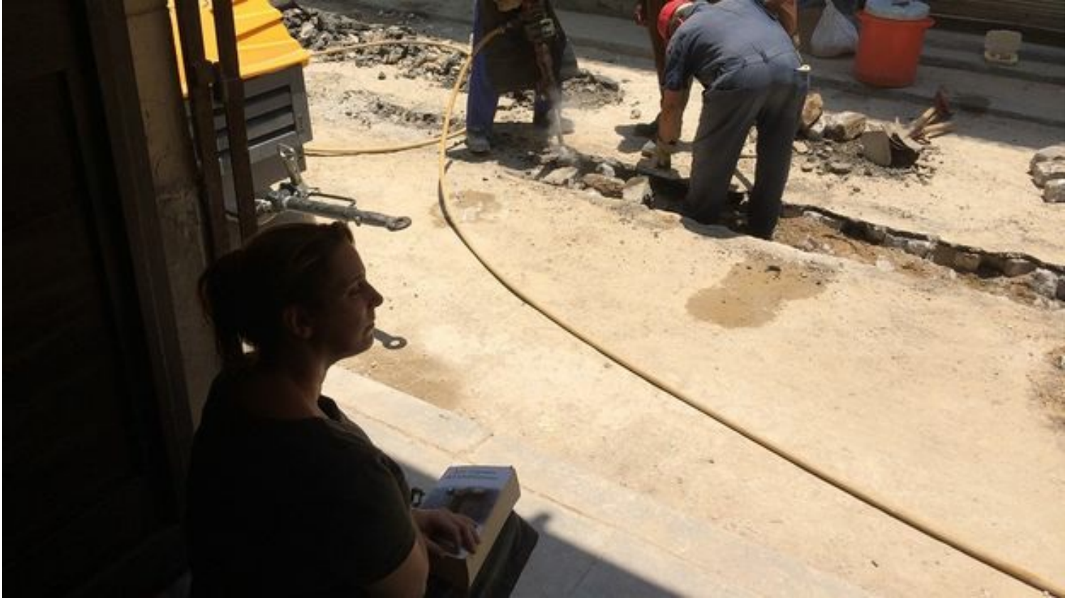
La artista Tania Bruguera en el umbral de su casa. (Yania Suárez)