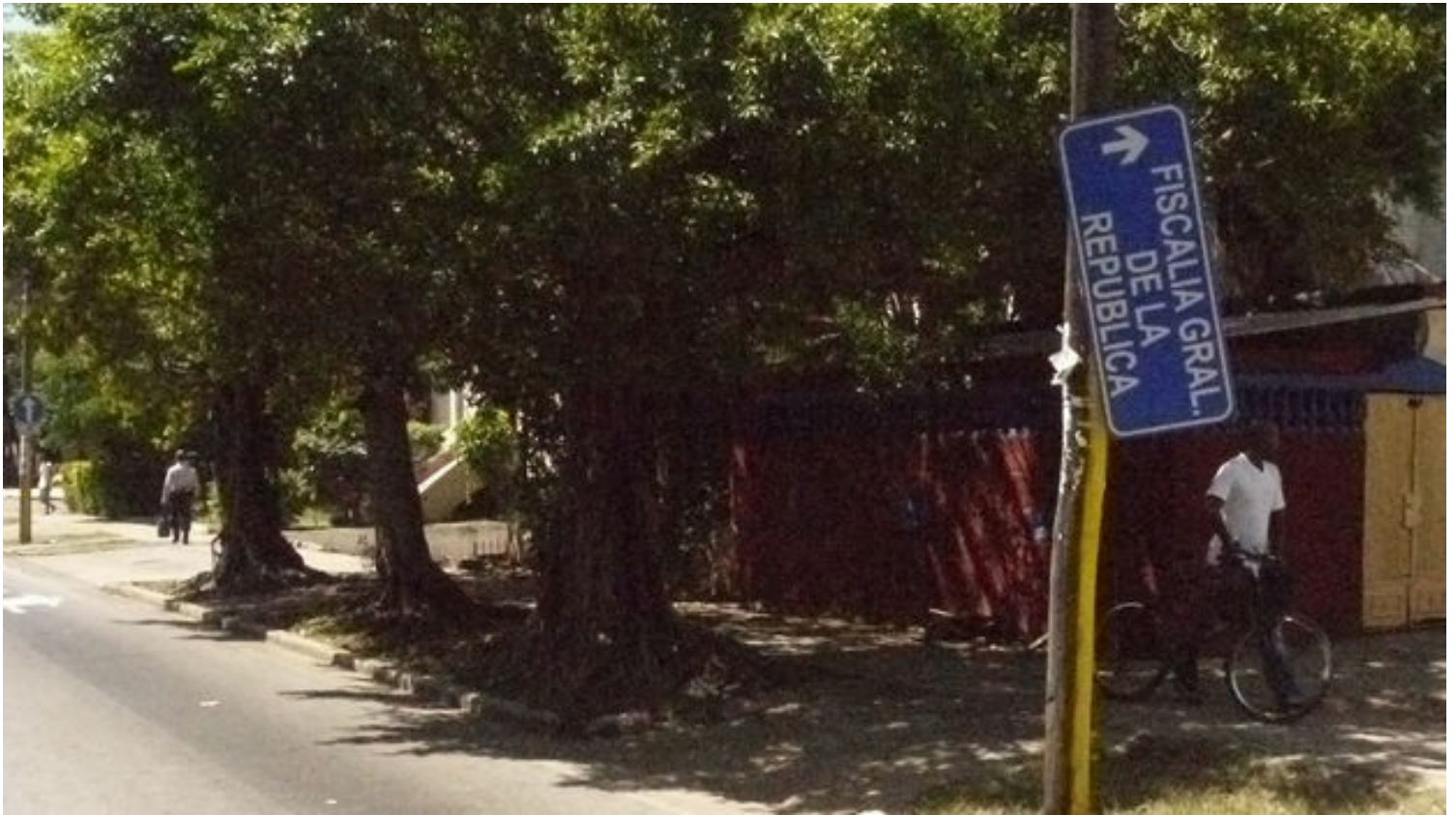
Una señal a punto de desaparecer.