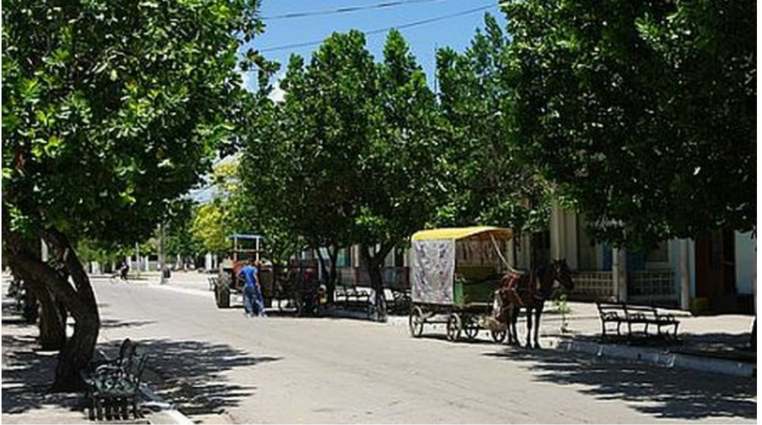
Santa Isabel de las Lajas.