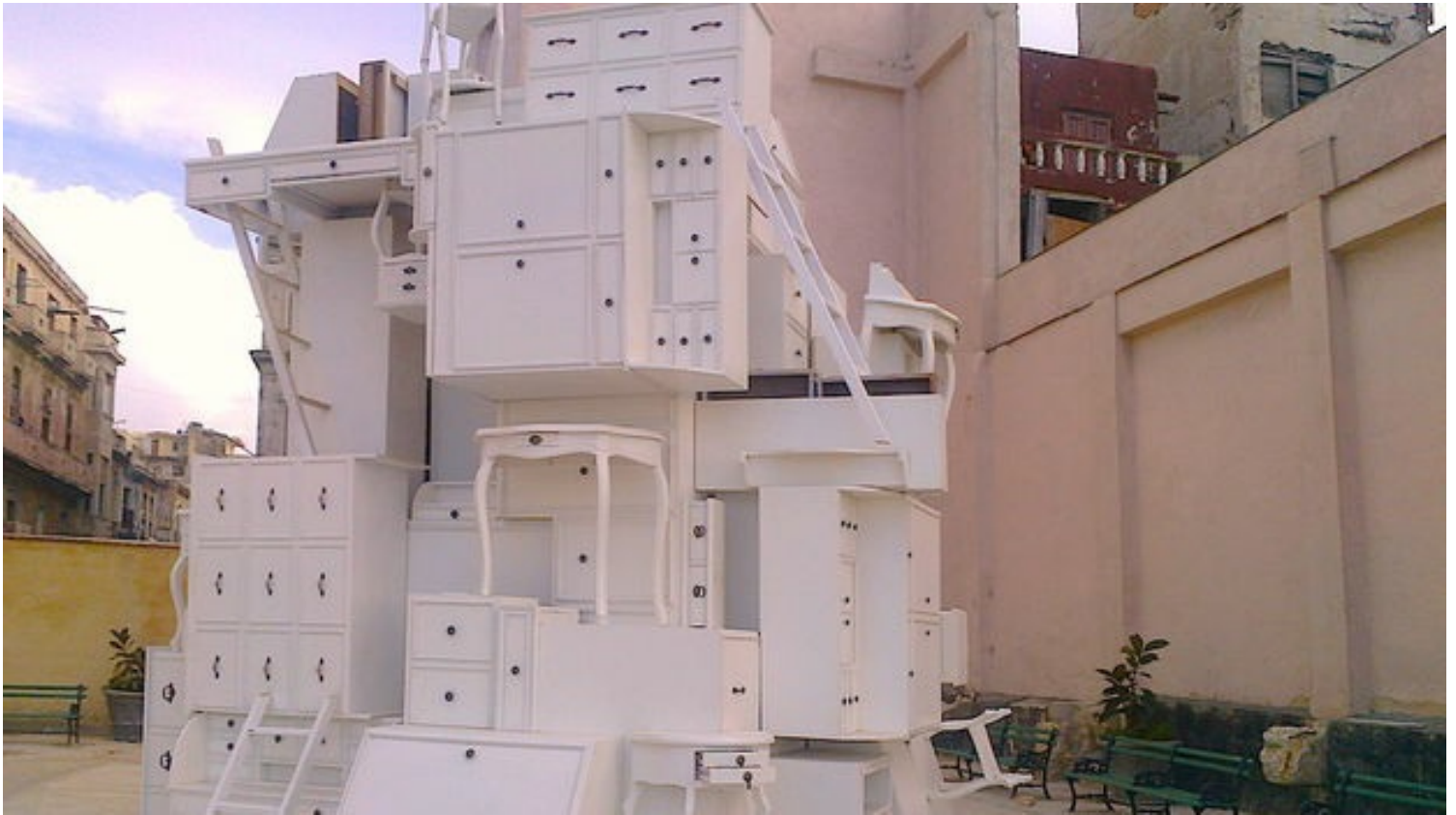
Instalación en el malecón de La Habana por la XII Bienal.