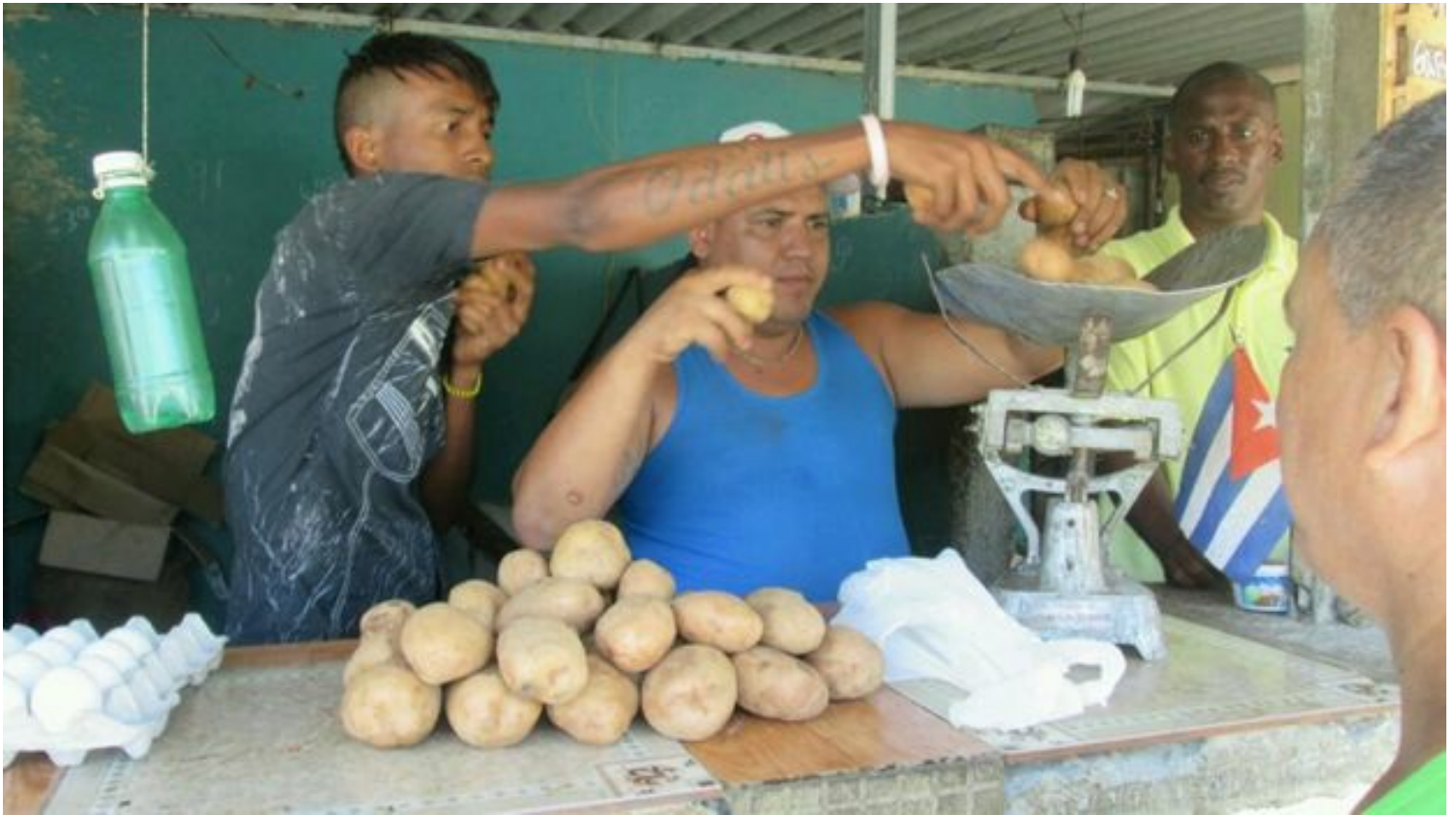
Venta de papa en Santiago de Cuba.