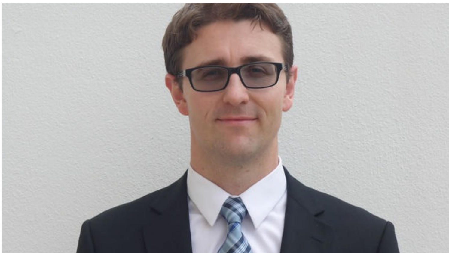
El diplomático checo Frantisek Fleisman.