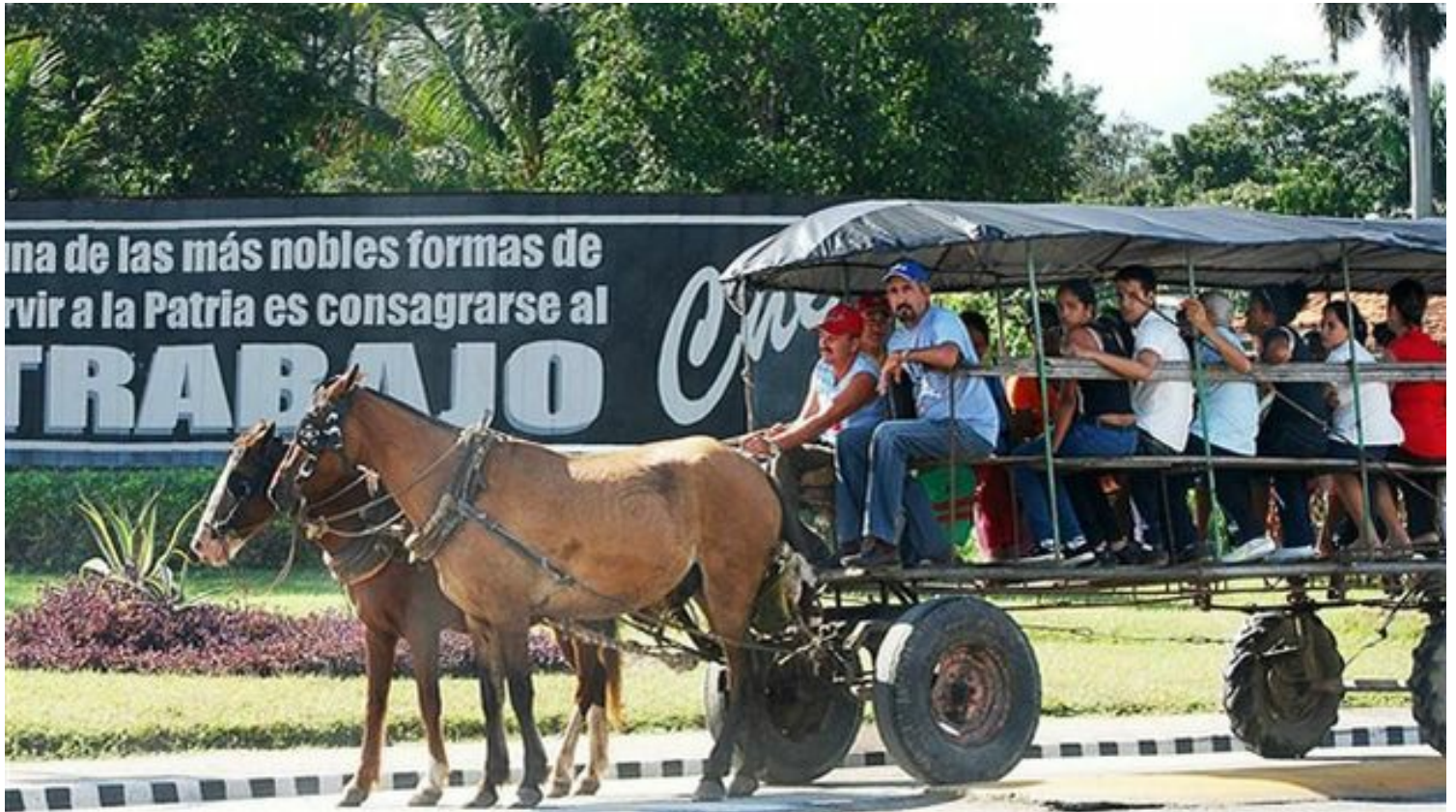
Coche de caballos en Cuba.