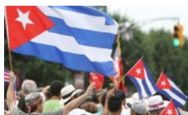
DOS HOJAS PARA UNA TIJERA