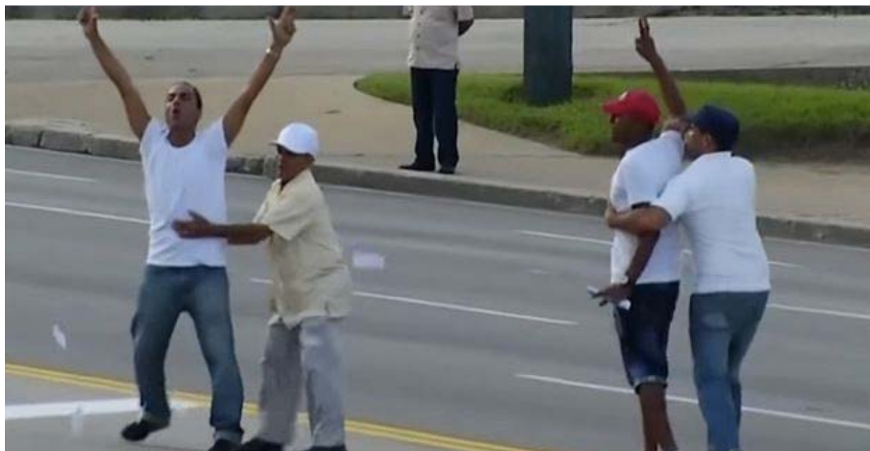
Activistas detenidos durante la misa del papa Francisco en la Plaza de la Revolución. (Fotograma)