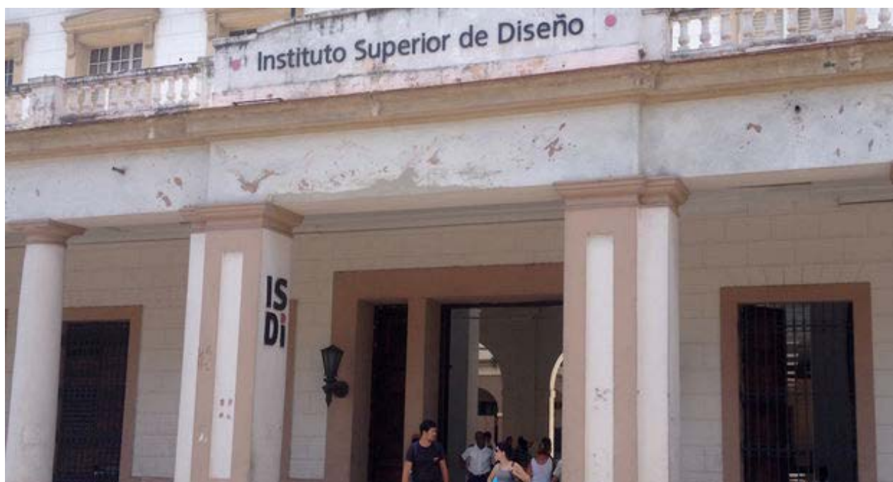
Fachada del Instituto Superior de Diseño, en La Habana.