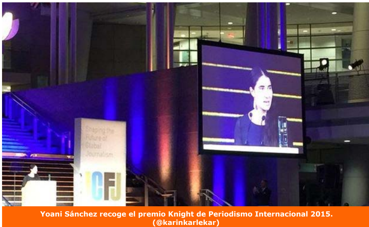
Yoani Sánchez recoge el premio Knight de Periodismo Internacional 2015. (@karinkarlekar)

país y están pactando con la dictadura, mientras dentro de Cuba quienes aspiramos con todo derecho a refundar la nación seguimos sin encontrar ese pivote de unión imprescindible para hacer las dos hojas filosas de una tijera que corte el nudo gordiano del castrismo. Mañana podría ser demasiado tarde.