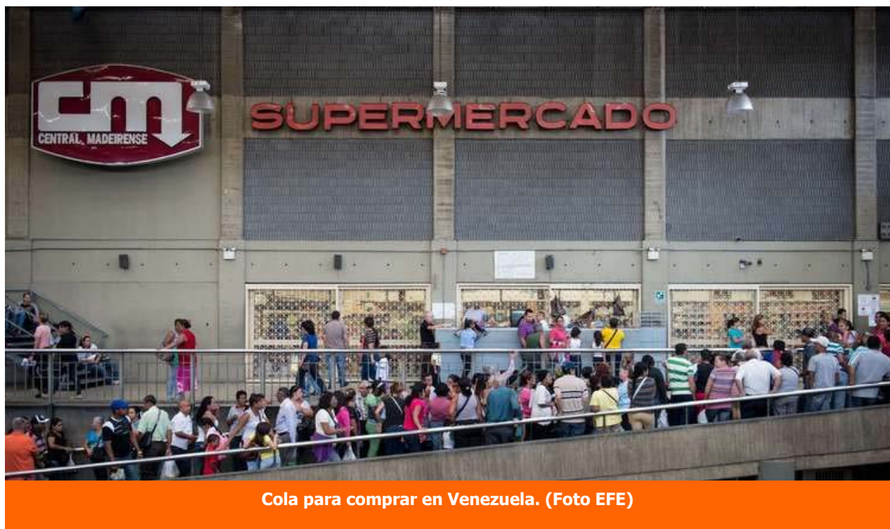
Cola para comprar en Venezuela.