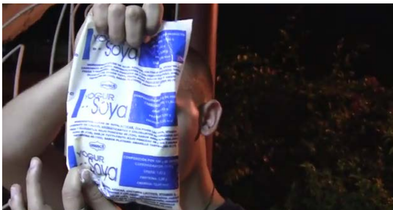
Los consumidores denuncian la pérdida de calidad del producto por los fallos en la refrigeración y en el control sanitario. (YouTube)

En noviembre del año pasado la prensa oficial publicó la alarmante cifra de 33.889 familias (132.699 personas) que necesitan un hogar, muchas de las cuales han vivido por dos décadas en albergues para damnificados. Según el censo de población de 2012, el 60% de las 3,9 millones de viviendas que existen en la Isla están en mal estado.