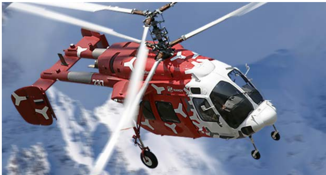
Modelo Ka-226T, de la compañía Helicópteros de Rusia