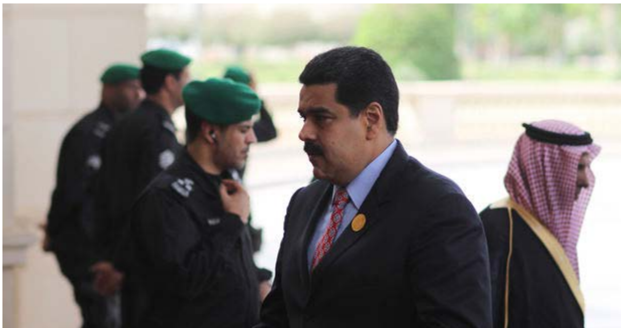
Nicolás Maduro entra a la cumbre de ASPA (América del Sur y Países Árabes) este miércoles en Riad.