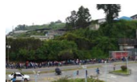
SOBREVIVIR EN VENEZUELA