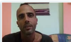
"DEBEMOS Luchar AQUÍ DENTRO"