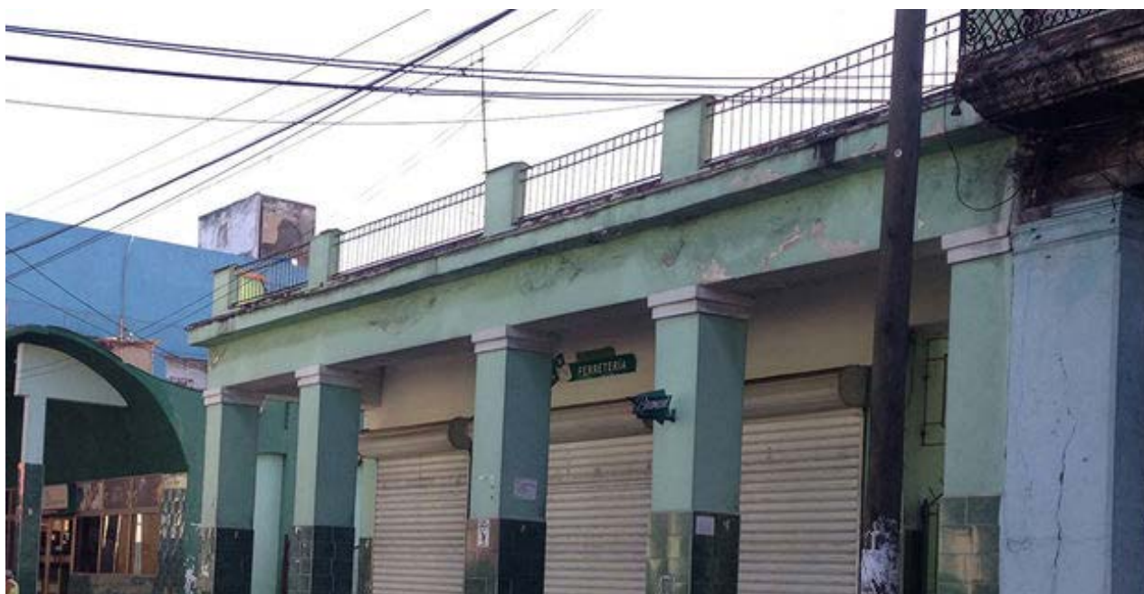
Ferretería enclavada donde una vez estuvo el cine Tosca.