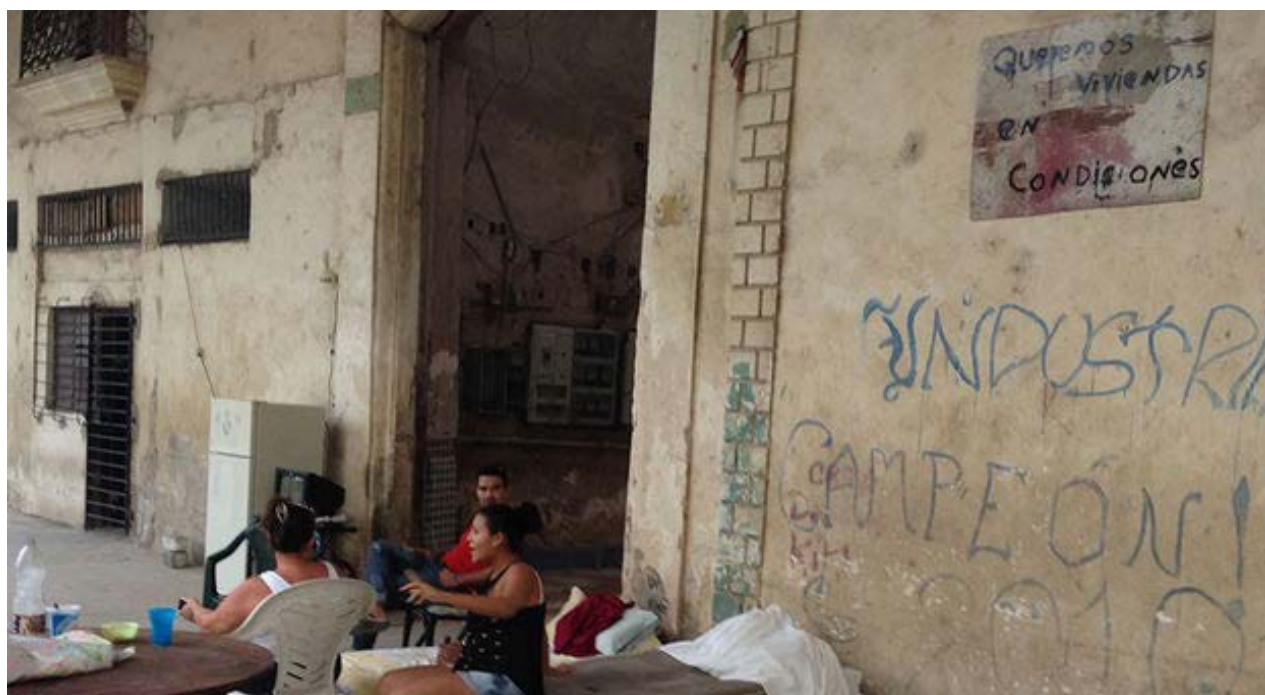
Los residentes en una cuartería de Habana Vieja exigen "viviendas en condiciones".