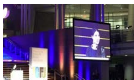
INFORMACIÓN Y ACCIÓN