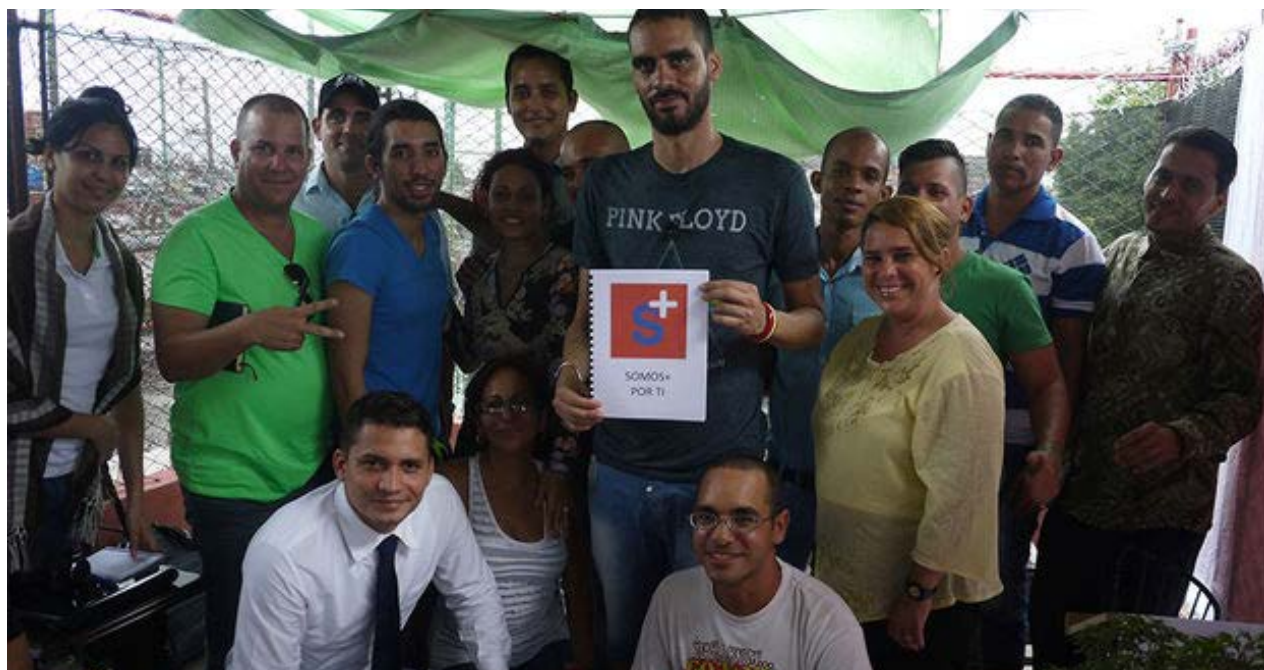
Danilo Maldonado, El Sexto, con los miembros de Somos+.

En mayo, ocurrió un incidente similar cuando Águila fue detenido a la fuerza a las afueras del Museo de Bellas Artes de La Habana por portar un cartel con la imagen del grafitero El Sexto, junto a la palabra "libertad".