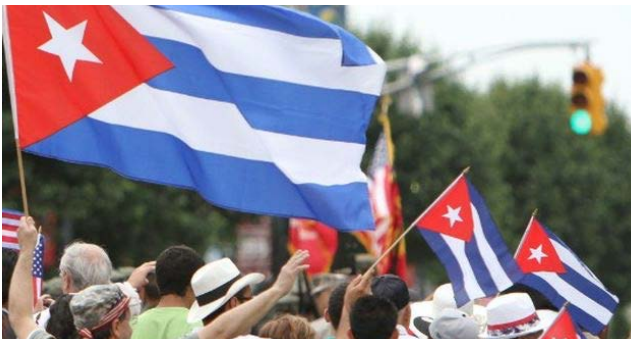
La oposición cubana marcha unida durante la Cumbre de las Américas.

La realidad cubana supera cualquiera de estas narraciones por muy fantasiosos y exagerados que hayan sido sus autores. En la película Memorias del Subdesarrollo , de Tomás Gutiérrez Alea, el protagonista parafrasea al Che Guevara cuando dice: "Esta gran humanidad ha dicho basta y ha echado a andar... y no se detendrá hasta llegar a Miami".