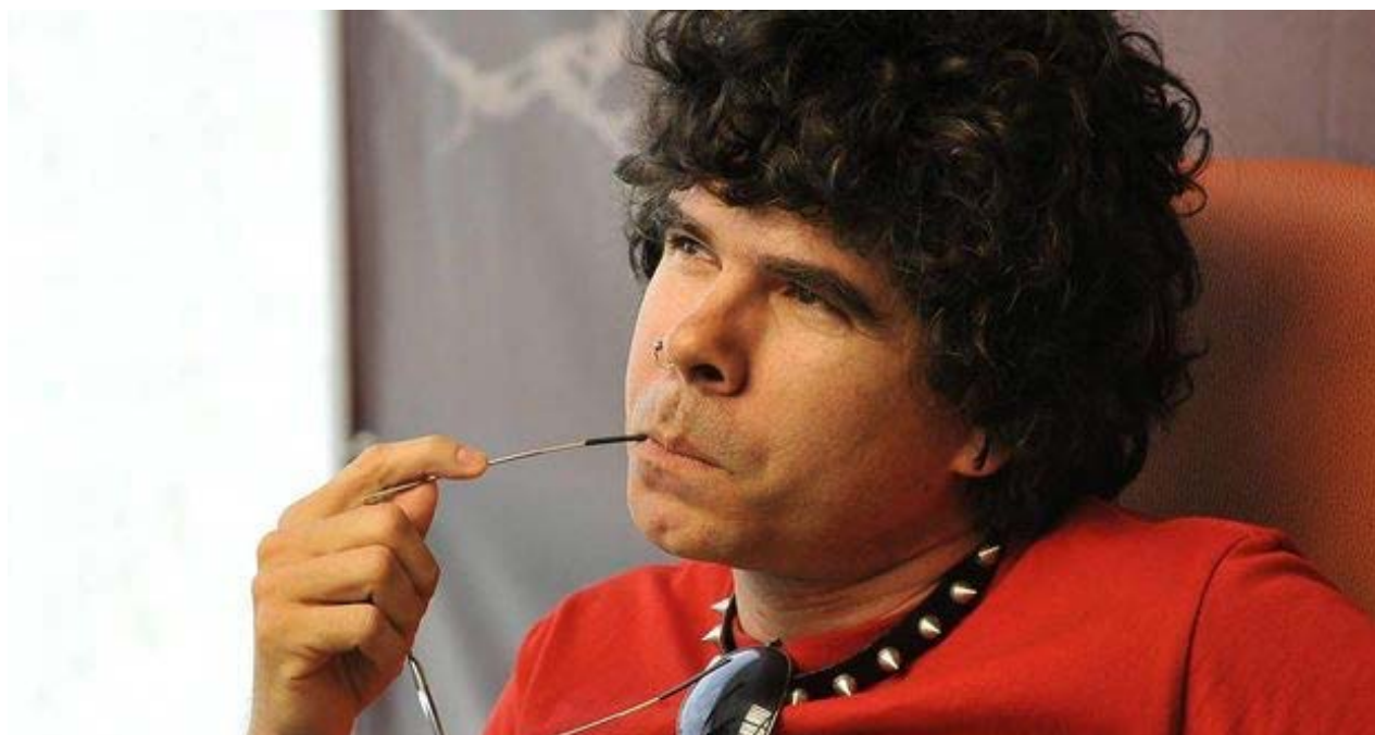
Músico Gorki Águila