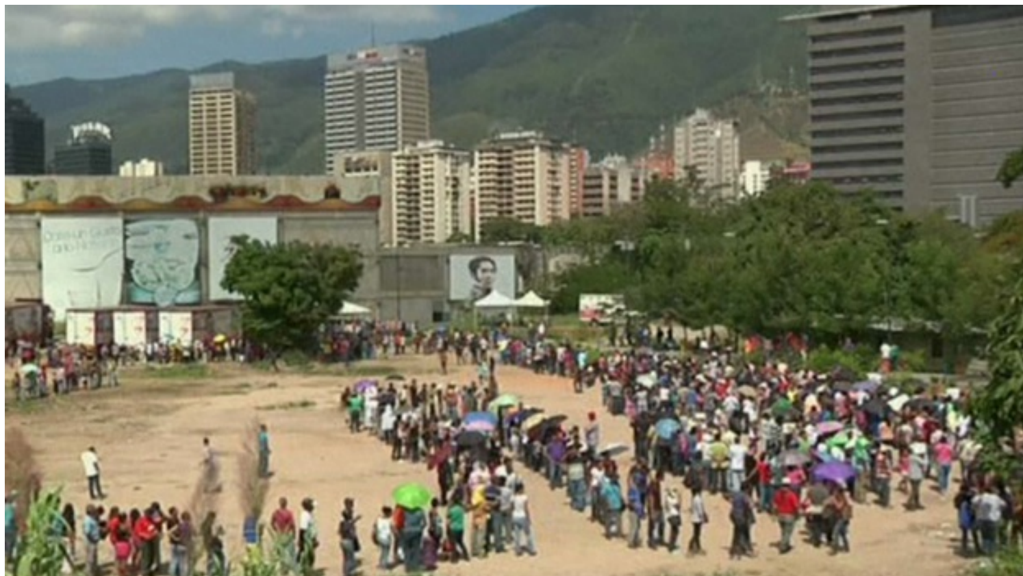
Una cola para conseguir alimentos en Venezuela.