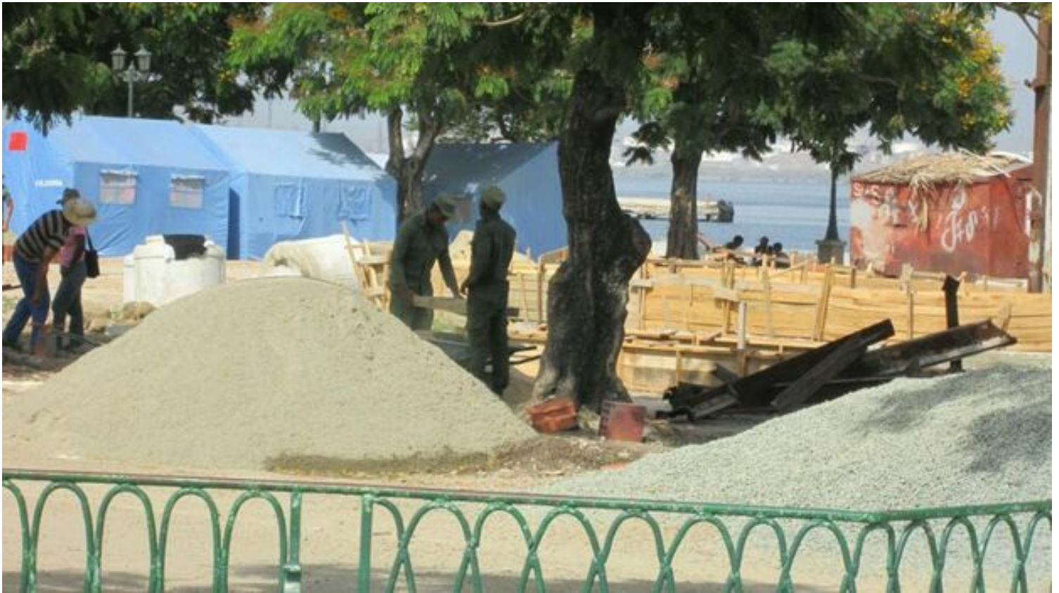
Trabajadores de la construcción en el malecón de Santiago de Cuba.