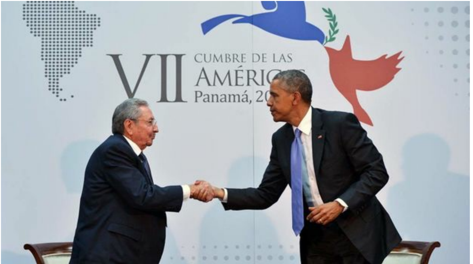
Raúl Castro junto a Barack Obama en conferencia de prensa durante Cumbre de las Américas