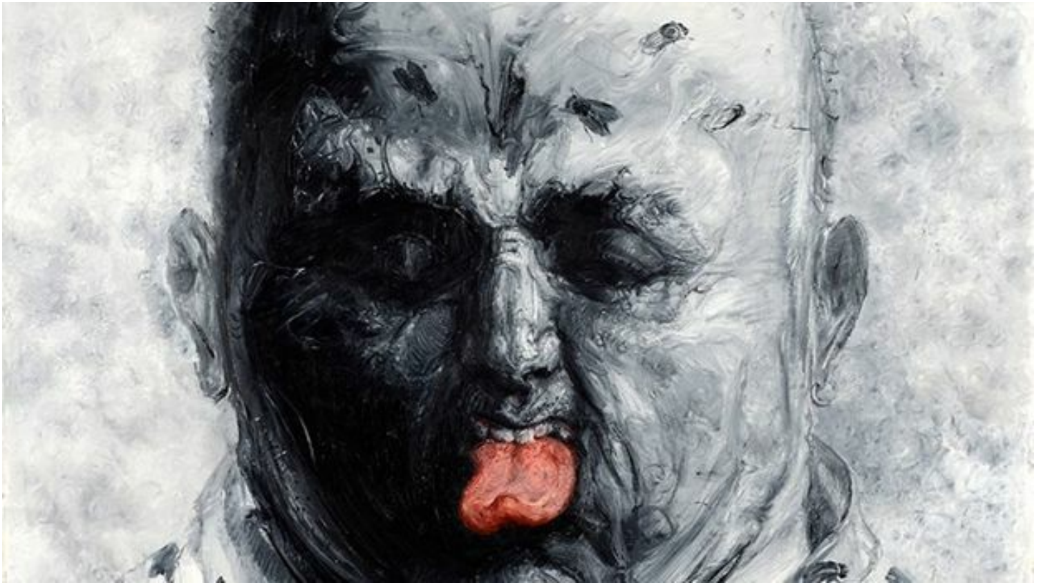
Una obra del proyecto 'Persistencia' de Roberto Fabelo.