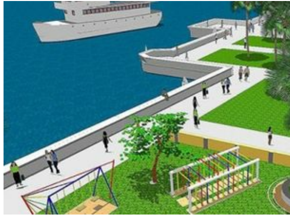
Parque del malecon de Santiago de Cuba.