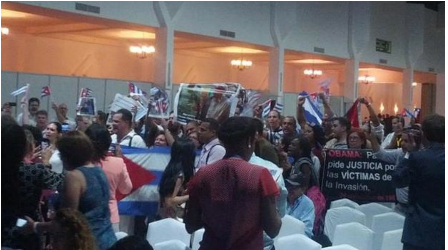
Acto de repudio en el Foro de Sociedad Civil en Panamá