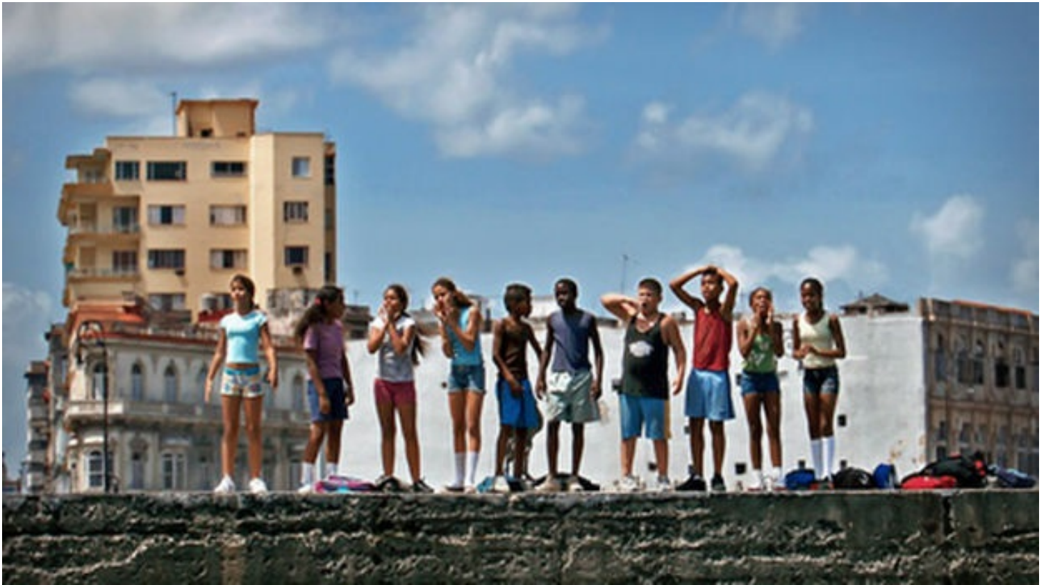
Fotograma de 'Conducta', de Ernesto Daranas. (Cineteca Nacional)