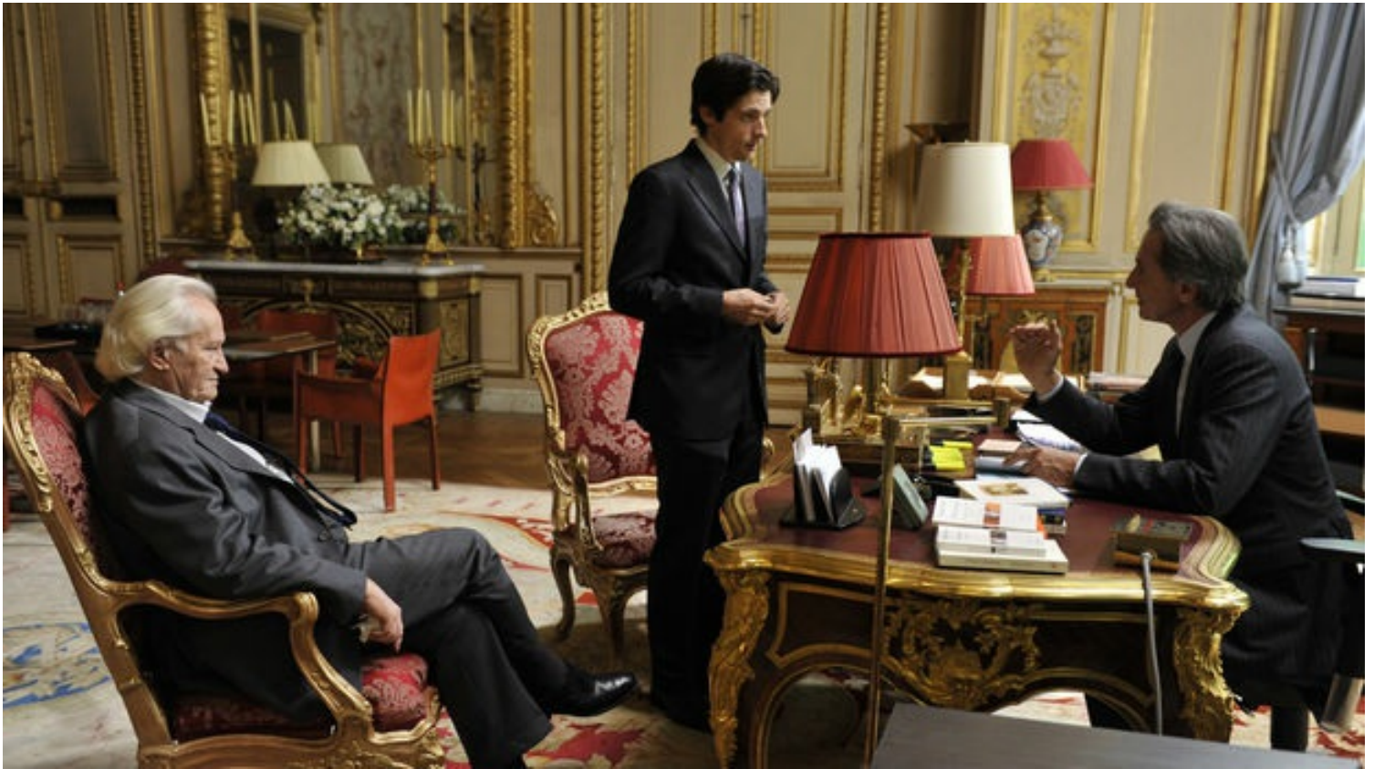
Fotograma de la película 'Crónicas diplomáticas' (Quai d'Orsay), de Bertrand Tavernier