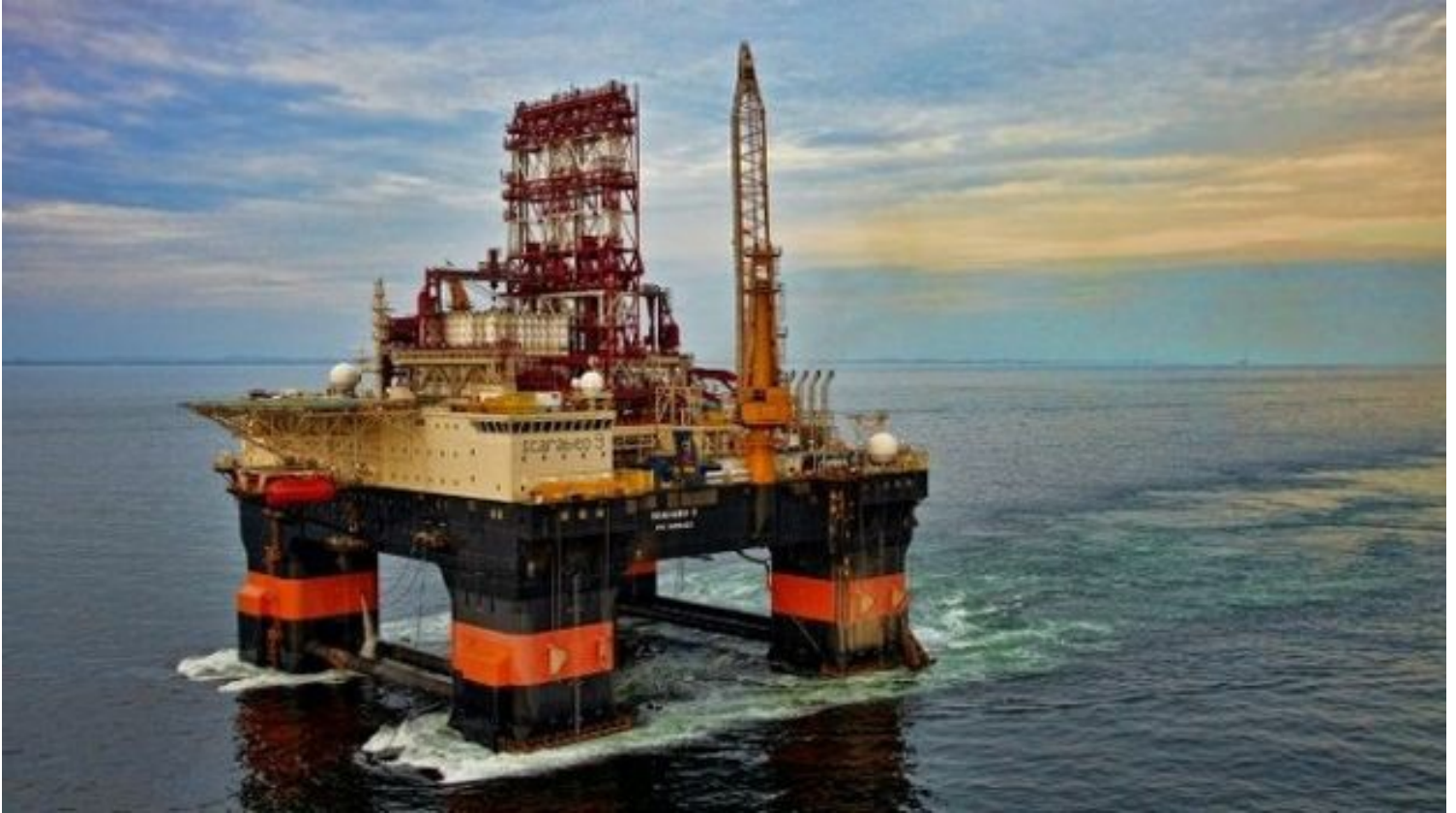
Plataforma petrolera de Cupet