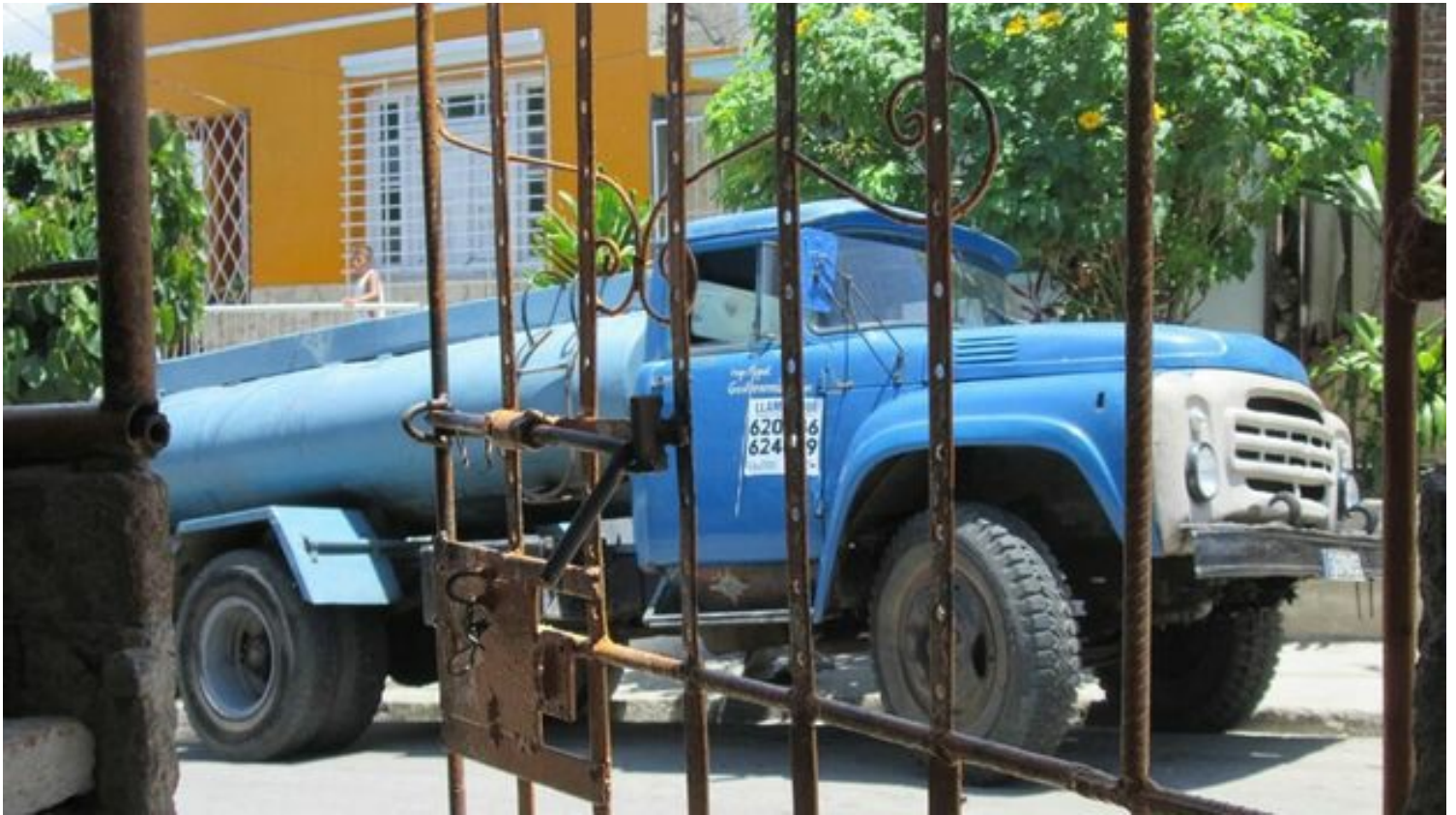
Camión cisterna en una calle de Santiago de Cuba. (Yosmani Mayeta)