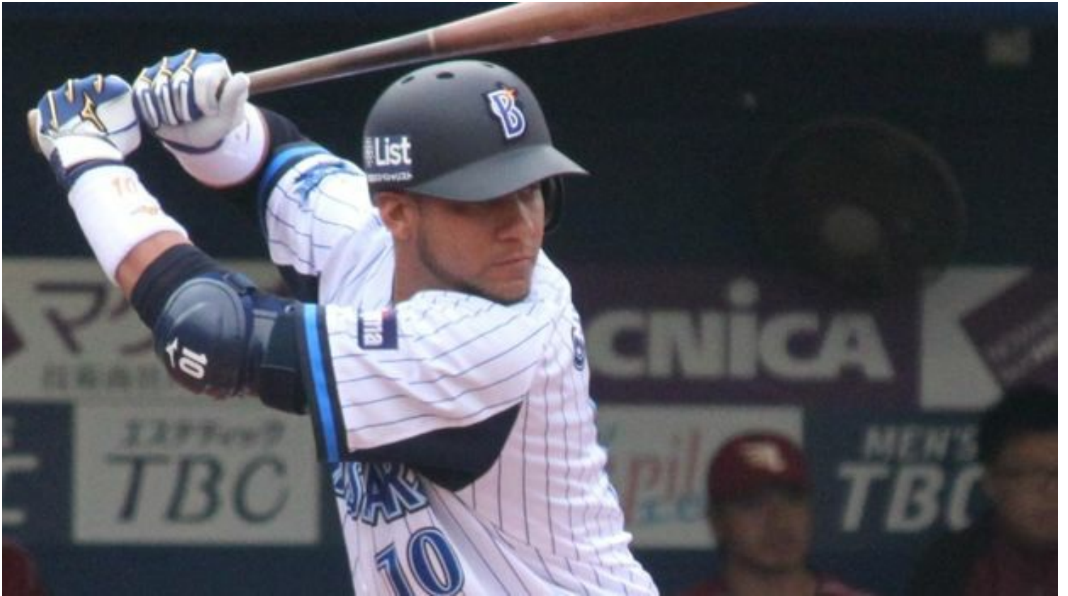
Yulieski Gourriel, que recientemente acaba de cancelar su contrato con los Yokohama Baystars, de la Liga Japonesa de Béisbol Profesional.