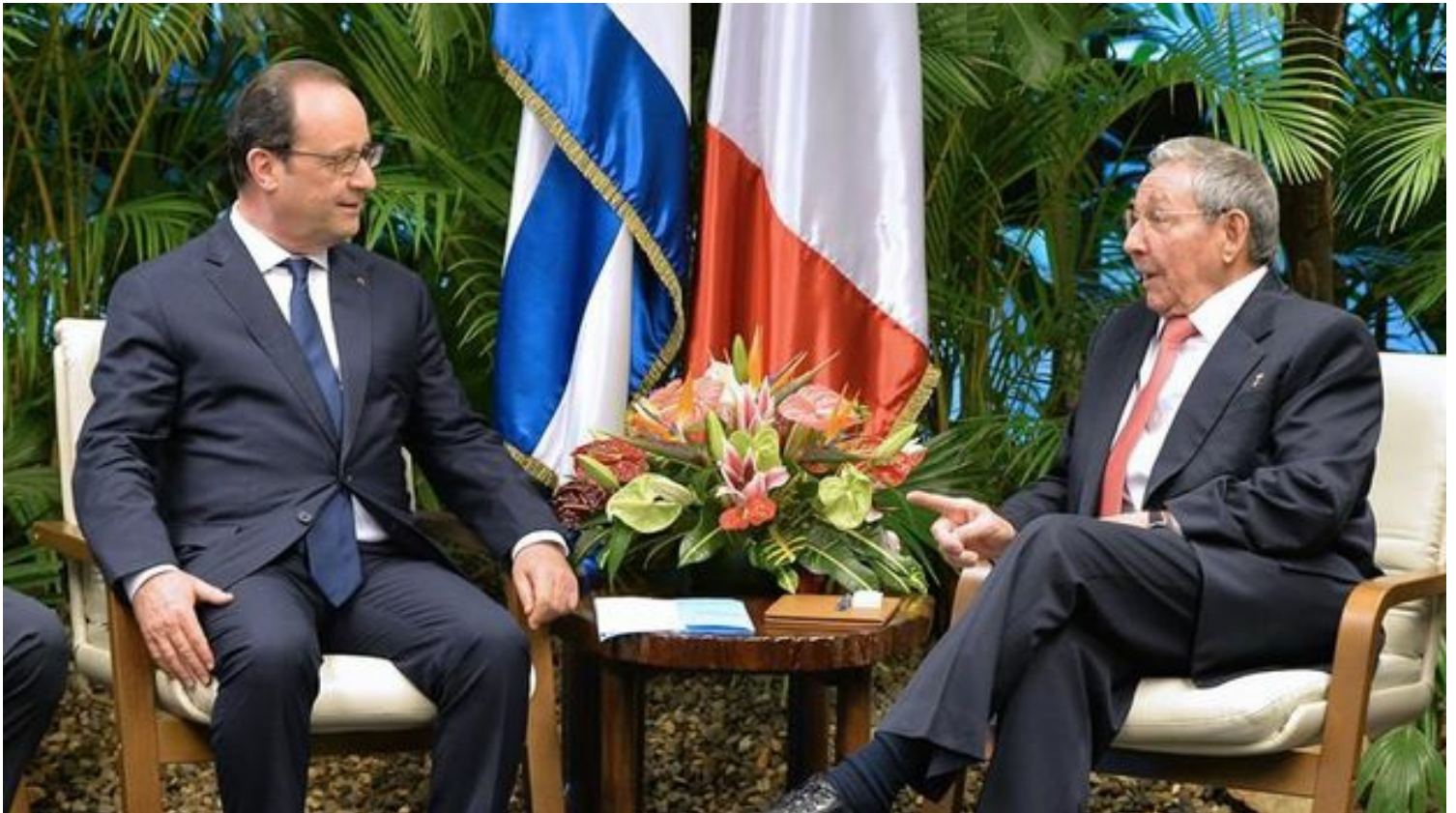
François Hollande y Raúl Castro, en su reunión de hoy en el Palacio de la Revolución.