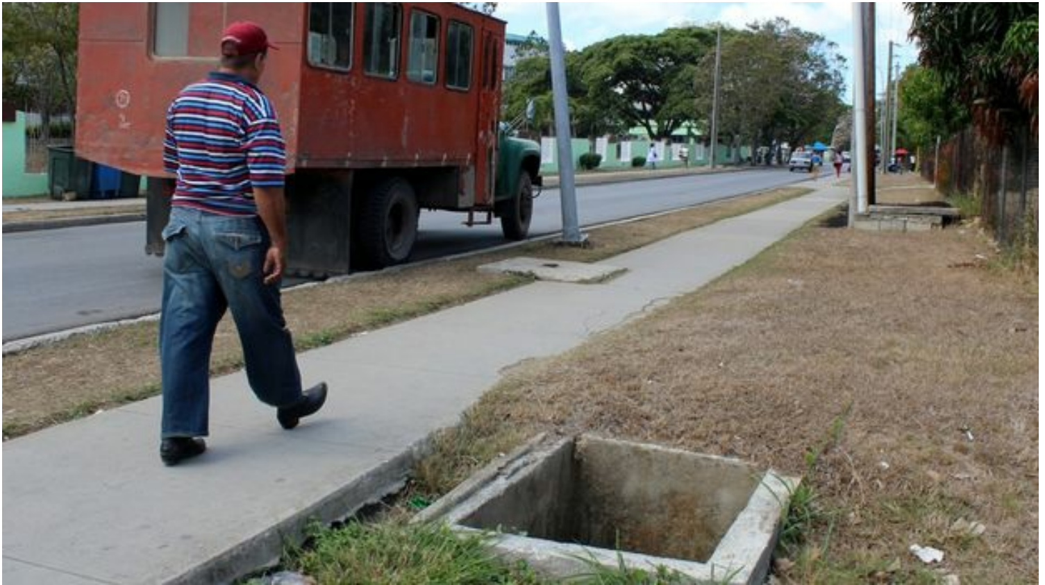
Las trampas acechan a los viandantes en las calles de Santa Clara. (Héctor Reyes)