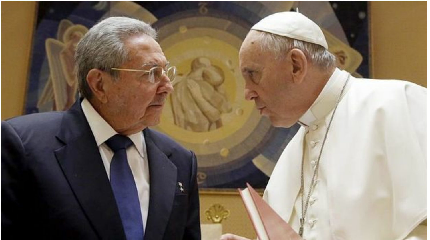
El encuentro entre Raúl Castro y el papa Francisco.