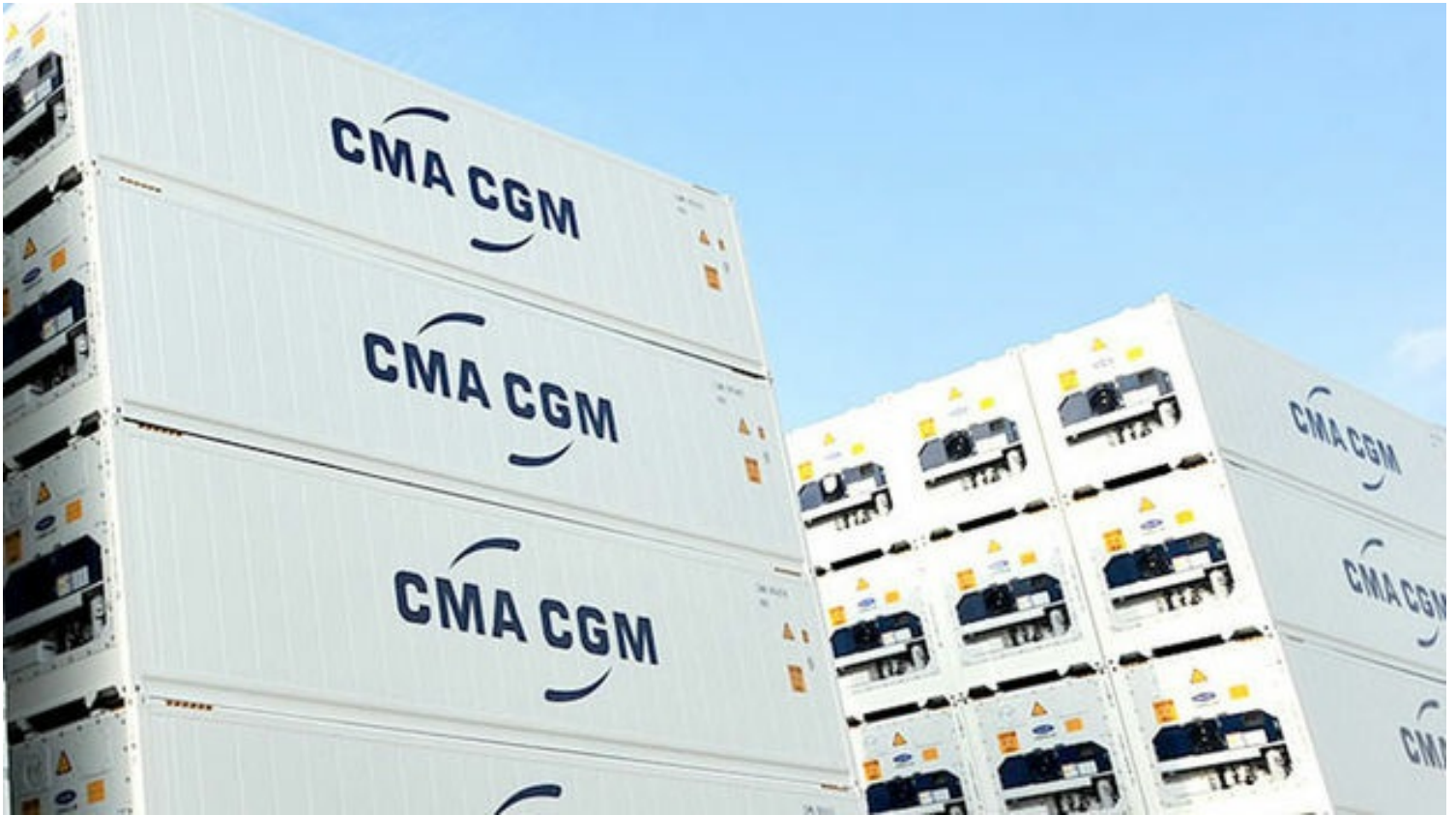
Contenedores del armador francés CMA CGM.