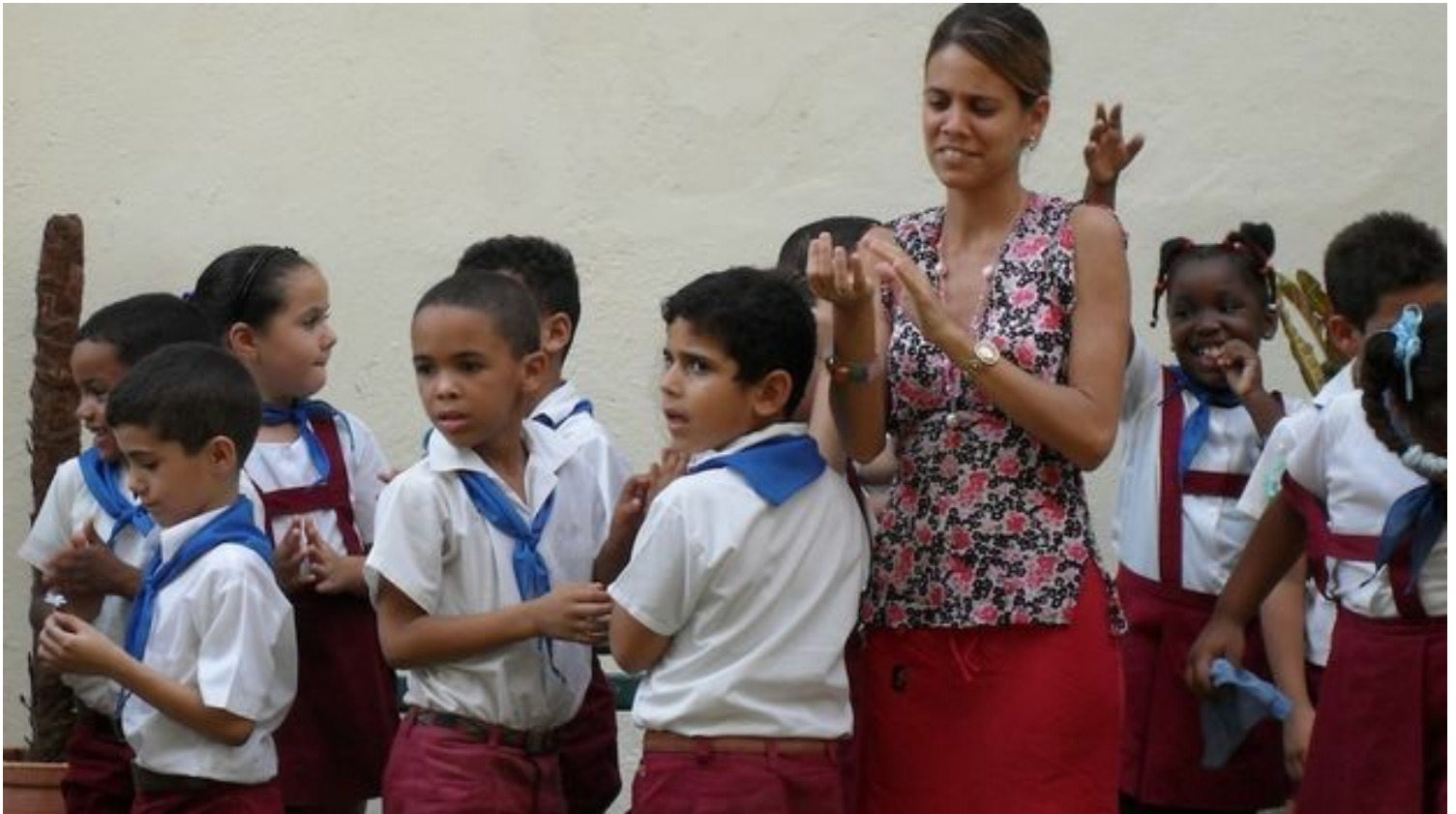
Maestra de una escuela primaria junto a un grupo de alumnos. (Luz Escobar)