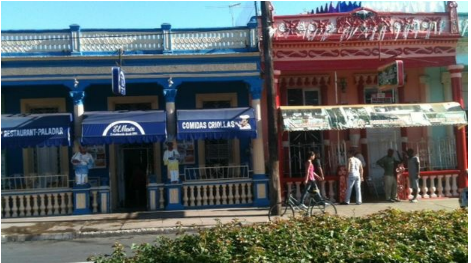
Los dueños de restaurantes privados y cafeterías podrán cobrar en CUC.