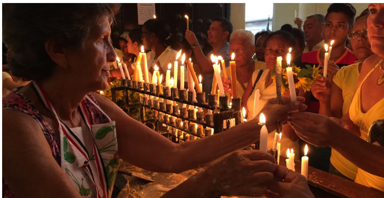
Devotos de la Caridad del Cobre en una parroquia de Centro Habana