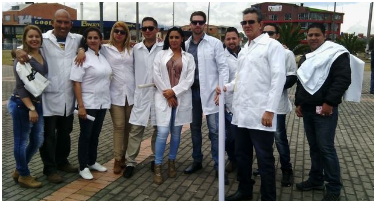
Galenos cubanos varados en Colombia a la espera de un visado para emigrar a Estados Unidos (CC)