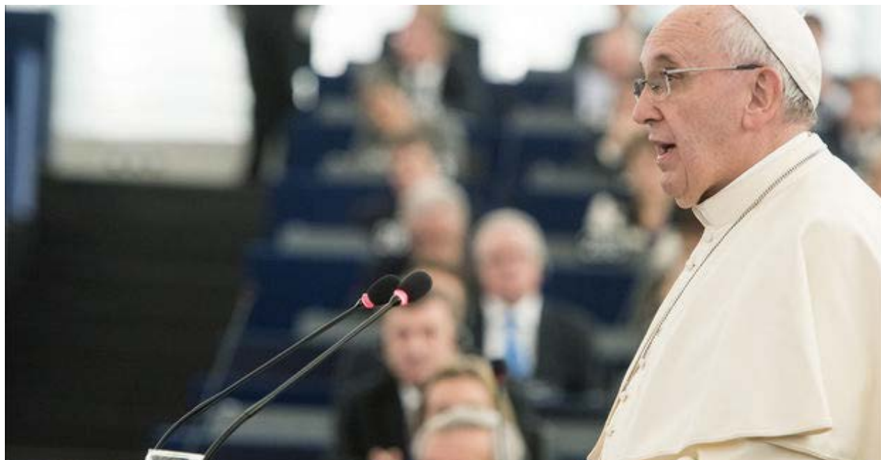
El papa Francisco en el Parlamento Europeo el pasado mes de noviembre.

Nuestra Vía Sacra es hueca, pura utilería, atrezo del más burdo, del menos creíble.