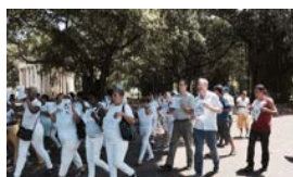
FELIPE KAST: "NO EXISTIÓ DIÁLOGO"