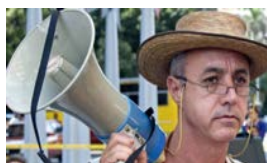
REVOCAN CONTRATO A CREMATA