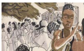
LOS DIRIGENTES NO MONTAN EN GUAGUA