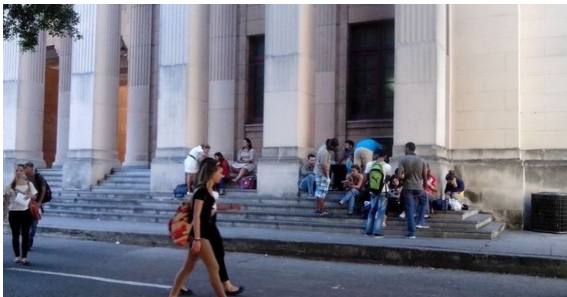
Jóvenes estudiantes en la Universidad de La Habana