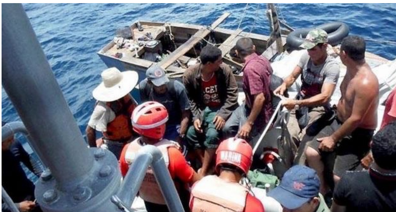
Balseros cubanos durante un rescate en aguas mexicanas (CC)

Sin esa legitimidad que me ha otorgado la democracia mexicana no hubiera podido tener los brazos abiertos para ayudar a mis compatriotas.