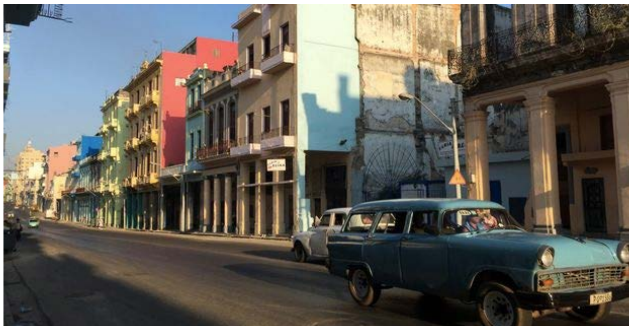
La calle Reina, en Centro Habana.

En septiembre del año pasado, México liberó a 14 balseros que habían sido acogidos en el centro migratorio de Chetumal (Quintana Roo), después de que su embarcación quedara a la deriva y muriera la mitad de sus ocupantes. En una decisión sin precedentes, les daba un mes para regularizar su estancia, algo que no se ajustaba a los acuerdos migratorios entre ambos países, que establecen la repatriación a la Isla.