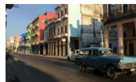
LA VÍA SACRA DE LA HABANA