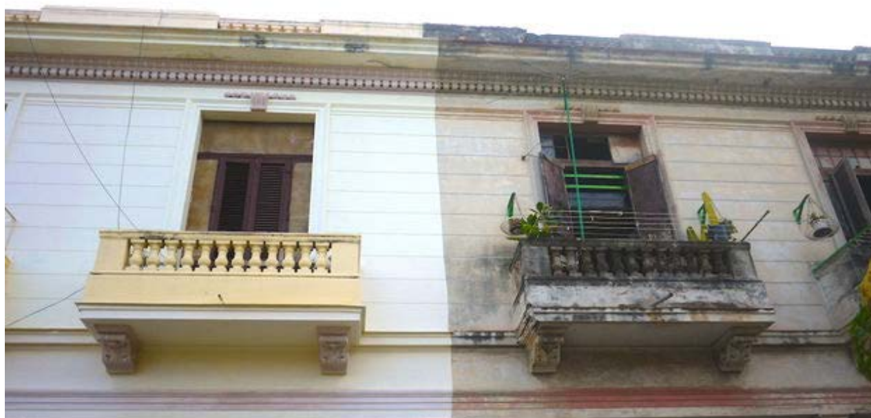
Diferencias sociales

El problema es que todo eso queda restringido bajo el grosero capítulo de estímulo material y ya no tiene el encanto de ser "un regalo del Máximo Líder".