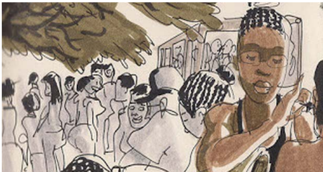
Colas interminables para subir a una guagua en La Habana.