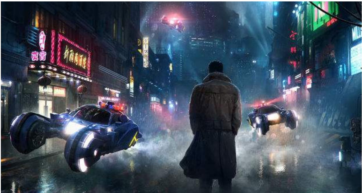
Una escena de la película 'Blade Runner' protagonizada por el actor Harrison Ford. (Fotograma)

Una escala de ese viaje personal y artístico que han emprendido Lisa-Kaindé y Naomí Díaz las ha traído a La Habana, donde es muy probable que las inquietas Ibeyi den mucho que hablar en los próximos años en la escena musical de la Isla.