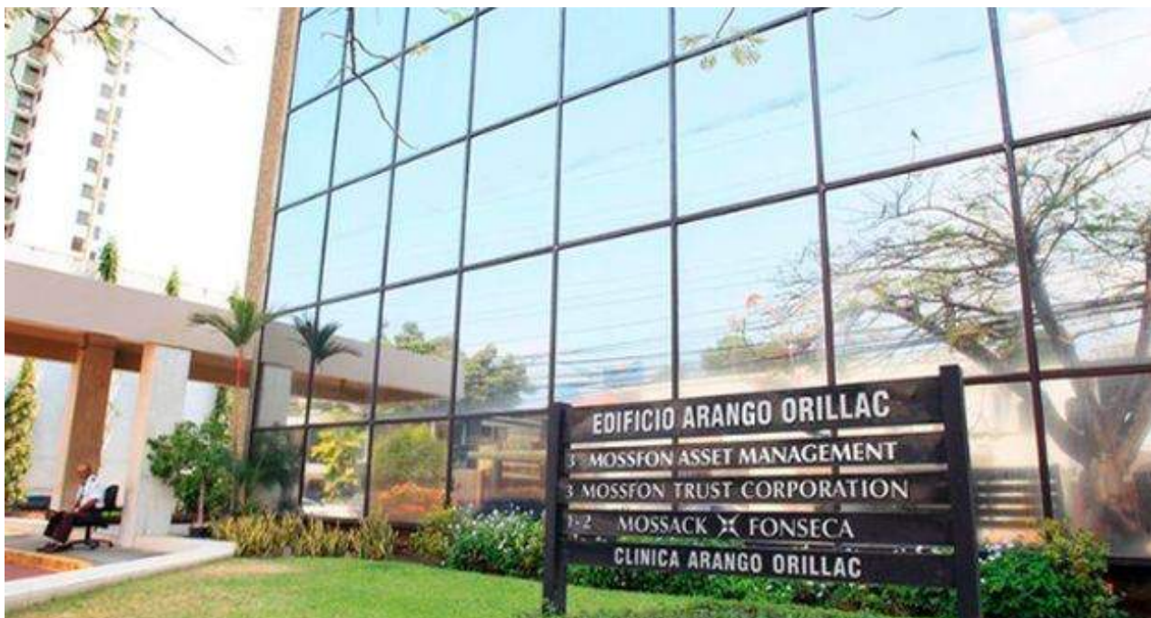
El edificio donde está ubicado el bufete Mossack Fonseca del caso de los Papeles de Panamá.