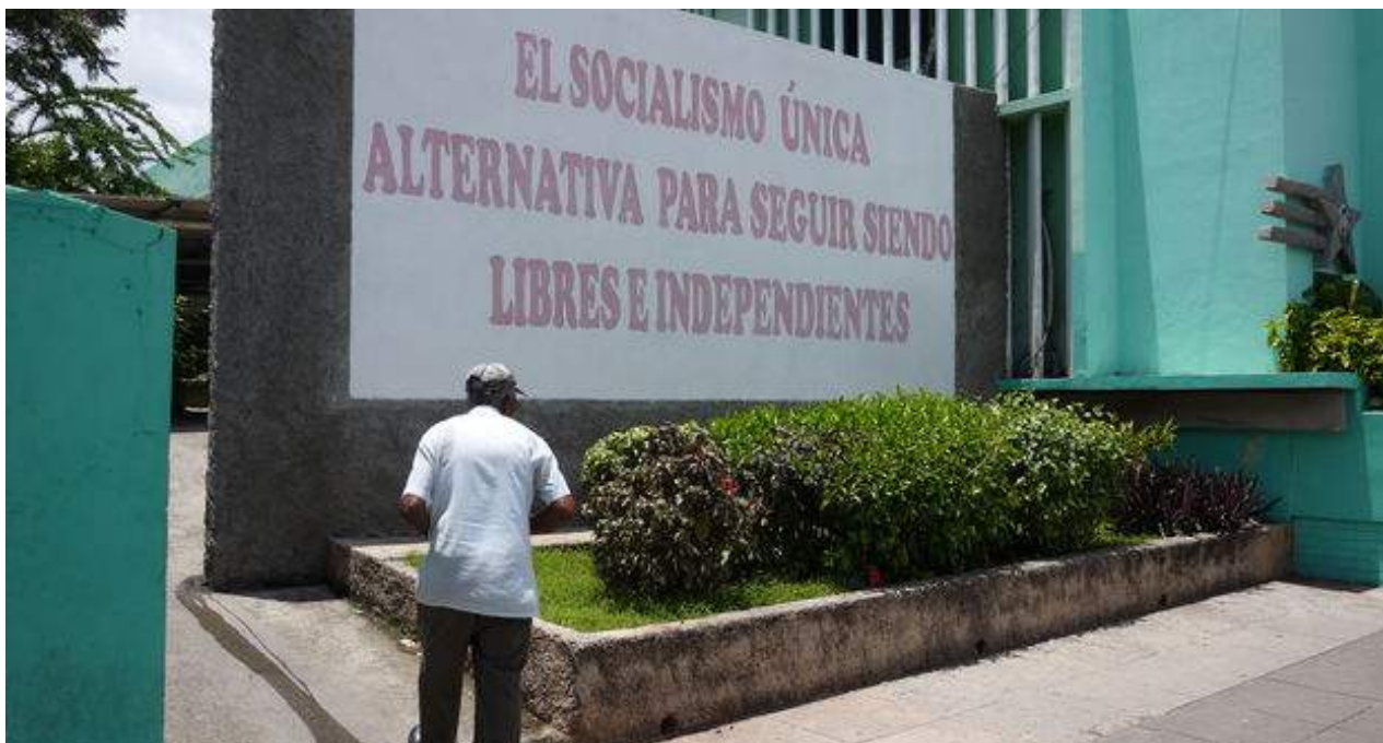
Un hombre camina junto a una valla política en La Habana.