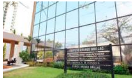
LAS 'OFFSHORE' CUBANAS