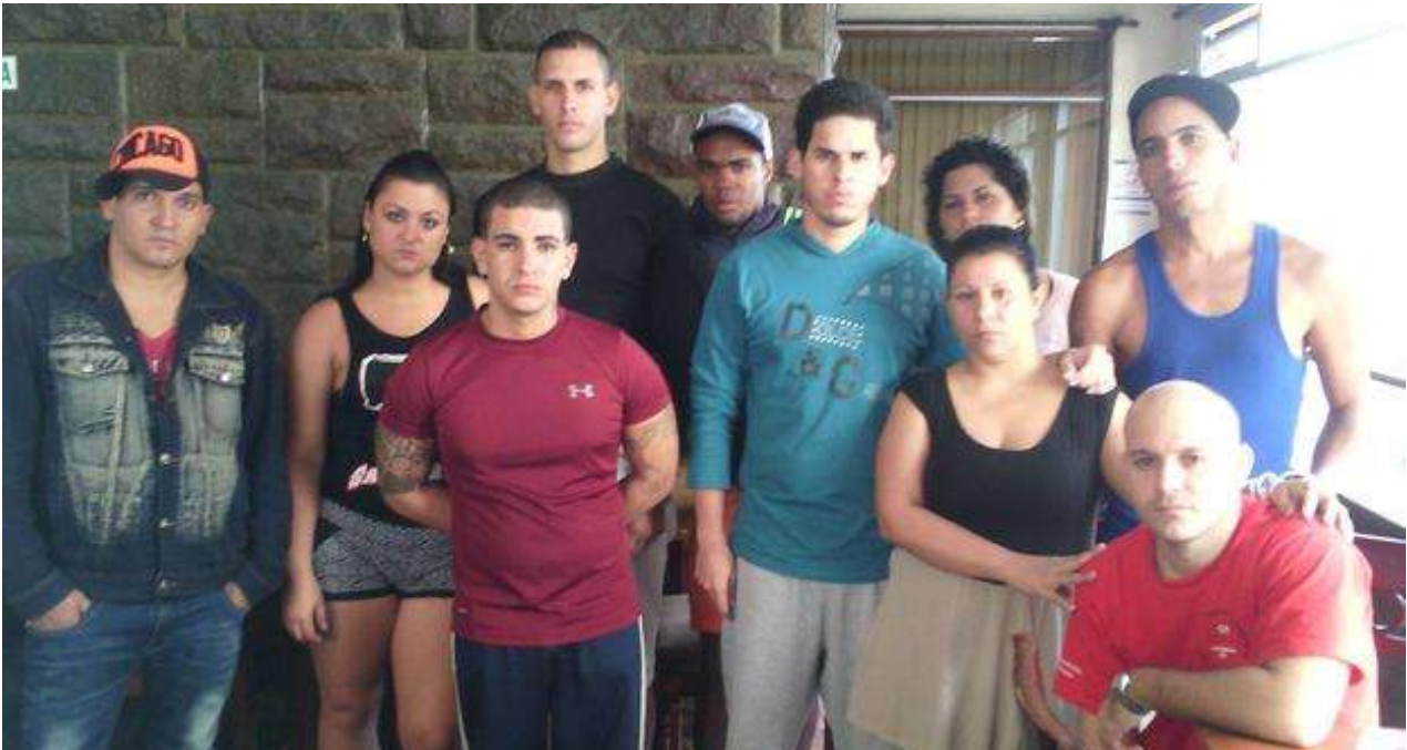
Grupo de cubanos que se declararon en huelga de hambre en el hotel Carrión.