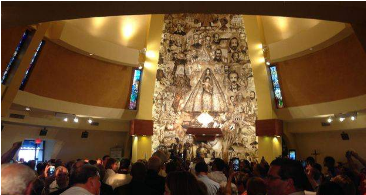
La Virgen de la Caridad del Cobre que llegó a Miami había sido entregada al papa Francisco en su reciente visita a la Isla.