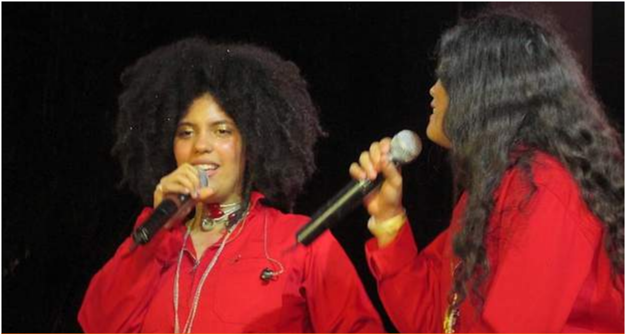
EL dúo franco cubano Ibeyi durante su presentación en el Festival Musicabana.