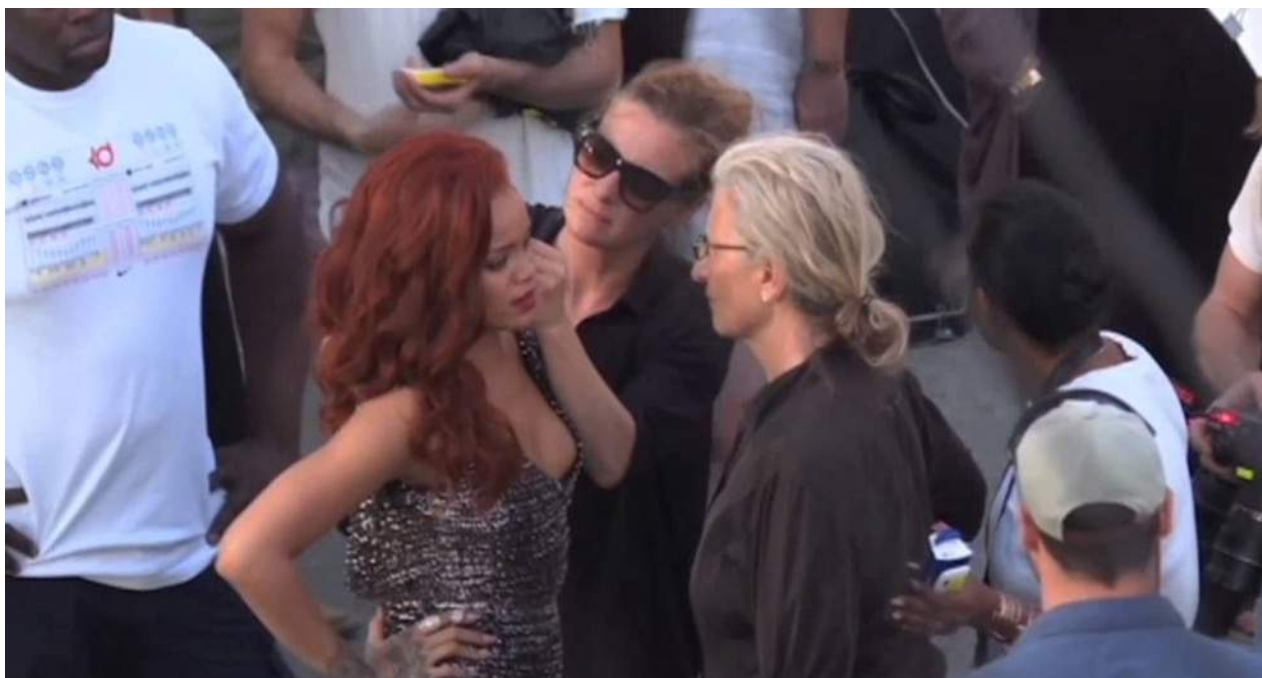
Rihanna durante su visita a La Habana en 2015.