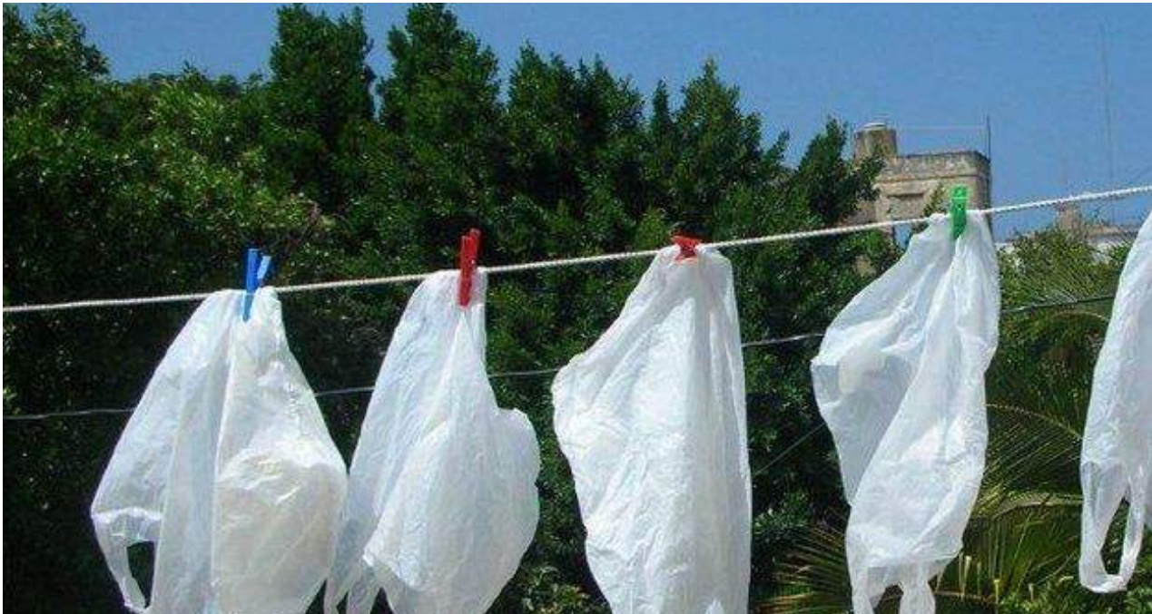
Bolsas de polietileno secándose en una tendedera después de ser lavadas para ser reutilizadas.