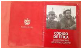
EL "CUADRO" OFICIAL