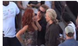
RIHANNA OFRECE BECAS