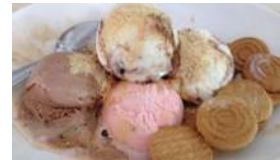
COPPELIA SE MAQUILLA