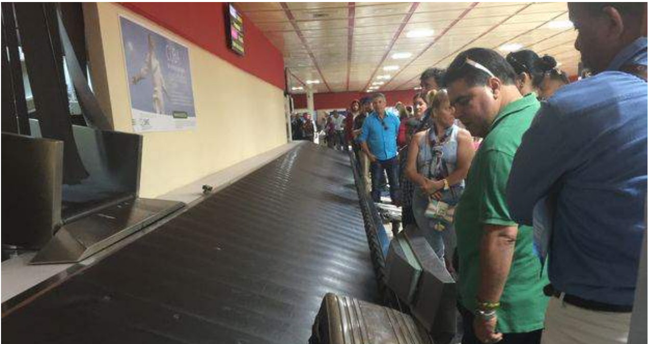
Terminal 3 del aeropuerto José Martí durante la llegada de un vuelo procedente de Panamá.