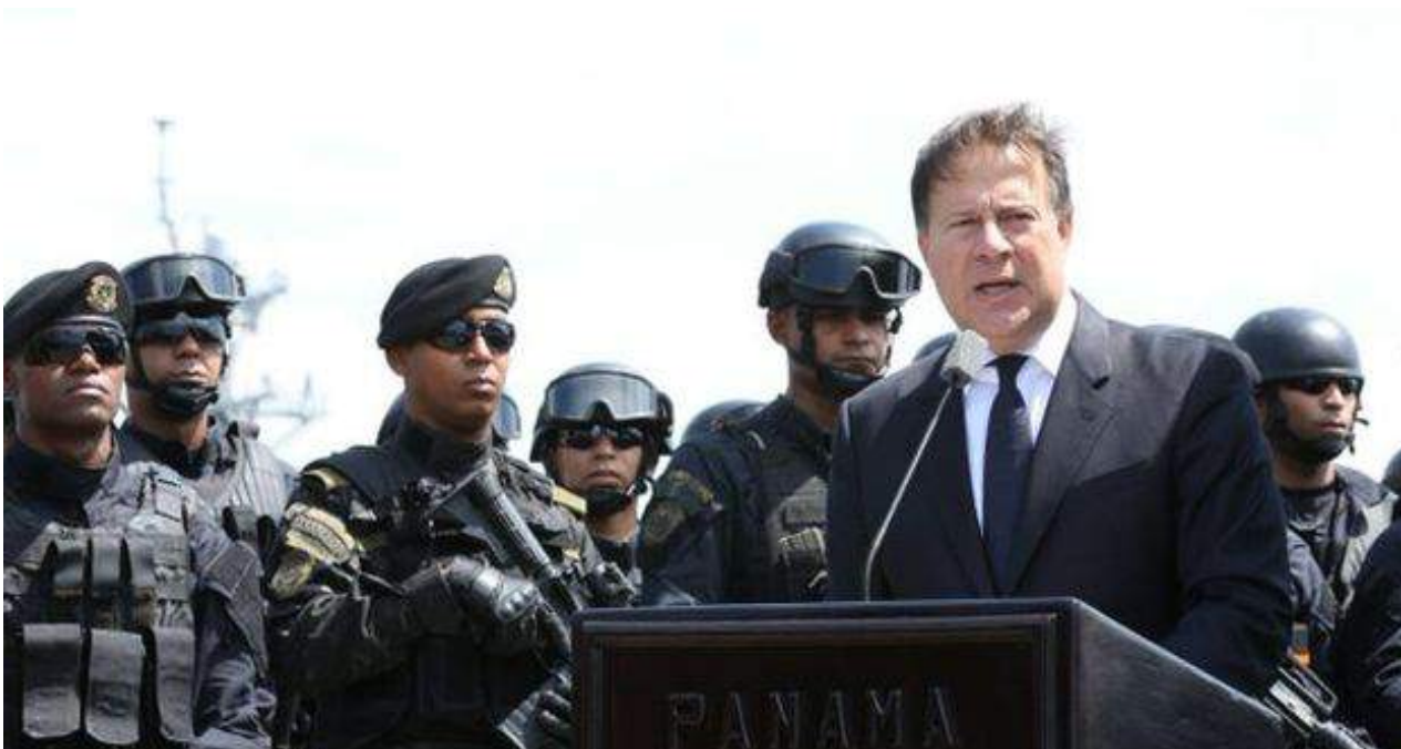
El presidente panameño Juan Carlos Varela.

Una selección con lo mejor de la semana del primer diario independiente hecho en Cuba