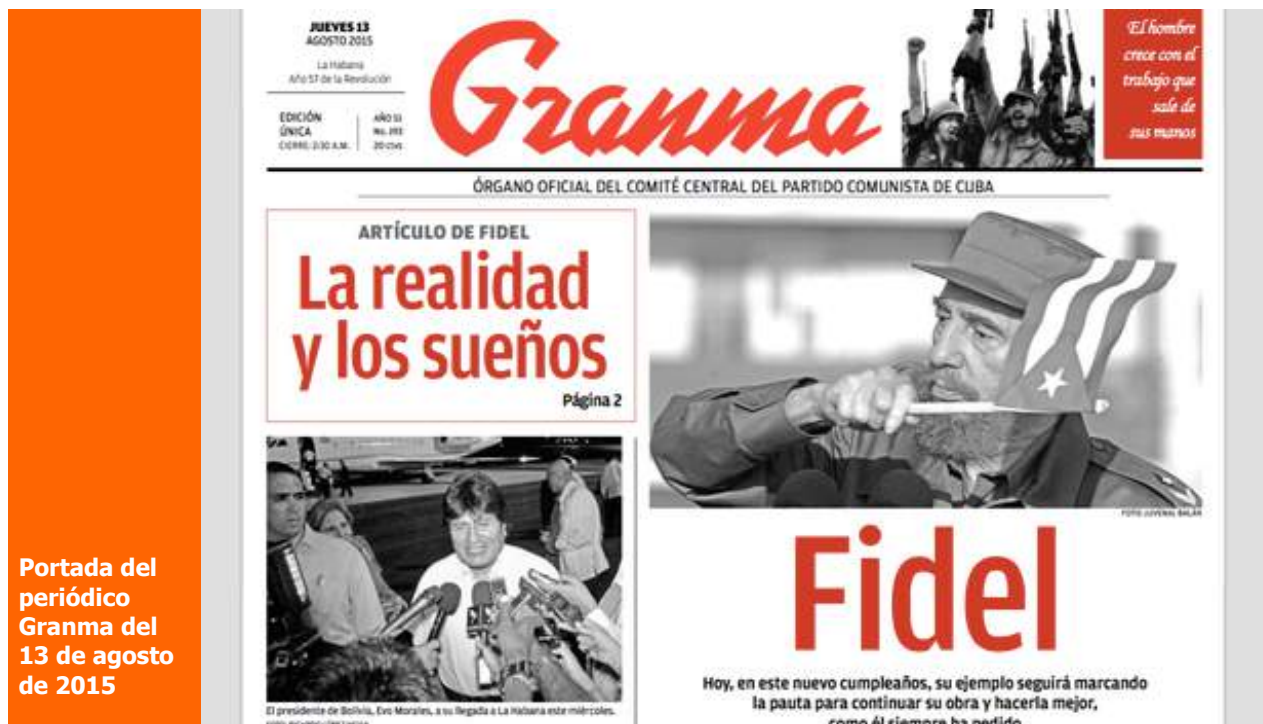
Portada del periódico Granma del 13 de agosto de 2015

Para concluir, Eliécer Avila agradeció a los presentes su decisión de "comprometerse con el futuro de Cuba y de su pueblo desde una posición donde la seriedad, la inteligencia, la constancia, el conocimiento y el respeto son las piezas claves para lograr el éxito que esperamos".