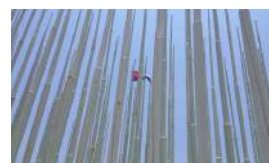
LA DEMOCRACIA DE CUBA Y EE UU