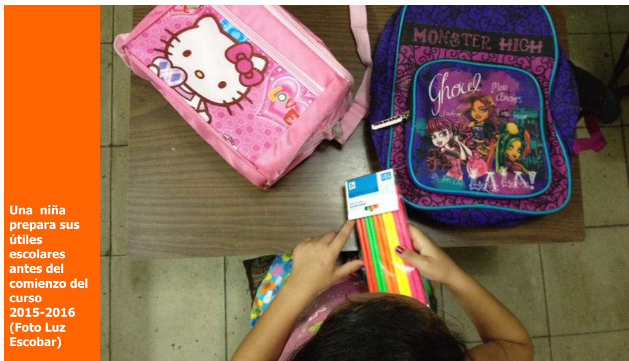
Una ni a prepara sus  tiles escolares antes del comienzo del curso 2015-2016

Aunque sus  ltimas palabras tienen sabor a despedida, "les doy las gracias, queridos compatriotas" habr  que seguir leyendo lo que queda de su pensamiento, aunque en la vida real no tenga ninguna repercusi3n pr ctica.