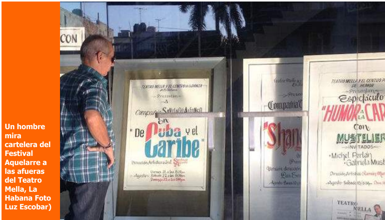
Un hombre mira cartelera del Festival Aquelarre a las afueras del Teatro Mella, La Habana