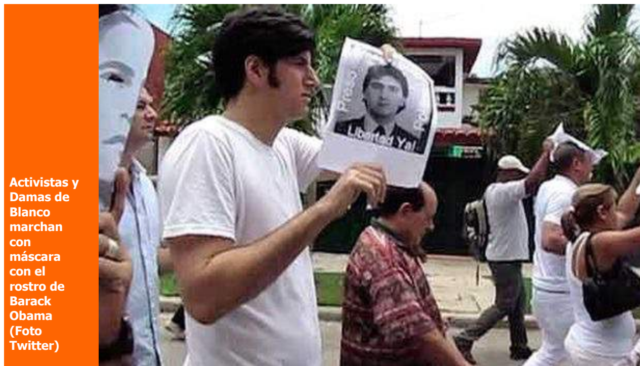
Activistas y Damas de Blanco marchan con máscara con el rostro de Barack Obama