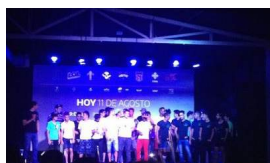
'DOTA 2', LA VIDA EN LA ARENA VIRTUAL