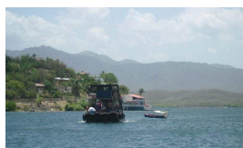
SUEÑOS DORADOS DE CAYO GRANMA