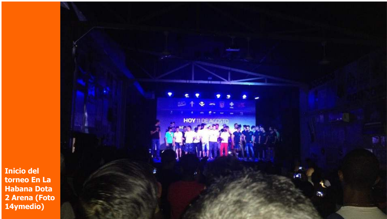
Inicio del torneo En La Habana Dota 2 Arena