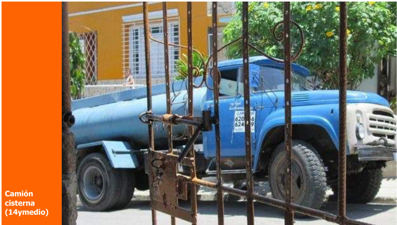
Camión cisterna

En el primer semestre de 2015 han viajado a Cuba más de dos millones de turistas extranjeros. Los estadounidenses son el grupo que más ha crecido: llegaron alrededor de 90.000, un 54% más que en el periodo correspondiente de 2014.