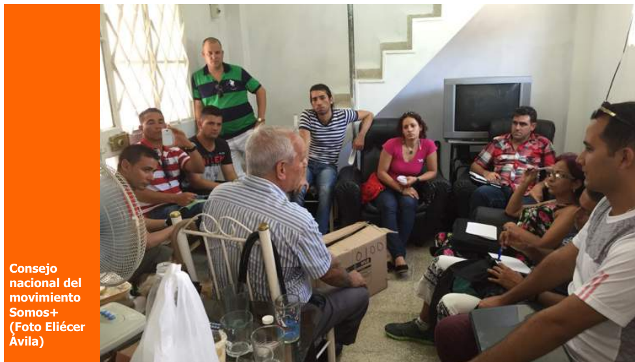
Consejo nacional del movimiento Somos+