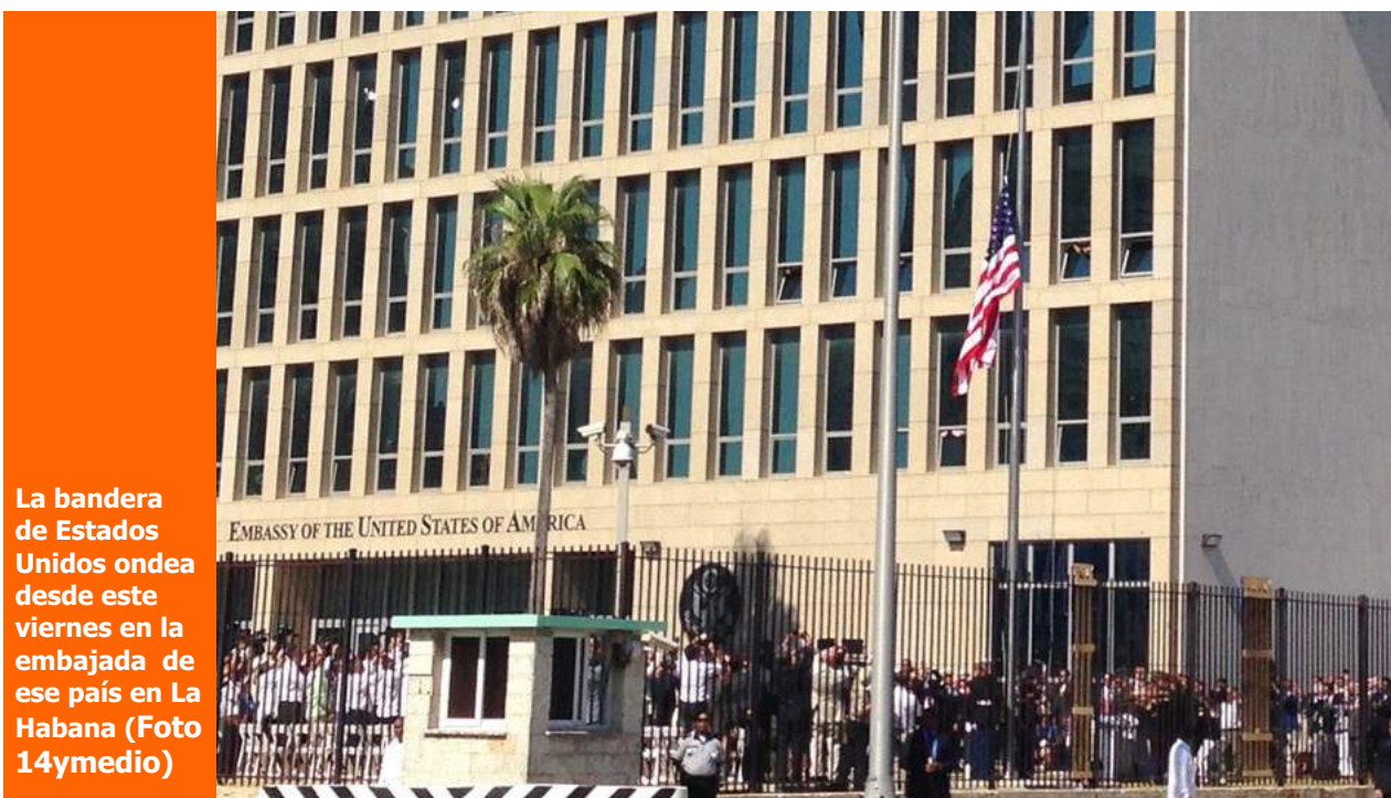
La bandera de Estados Unidos ondea desde este viernes en la embajada de ese país en La Habana

una selección con lo mejor de la semana del primer diario independiente hecho en Cuba