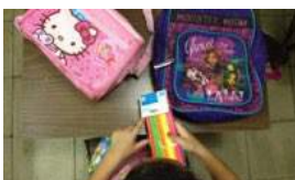
LA CARRERA POR LOS ÚTILES ESCOLARES