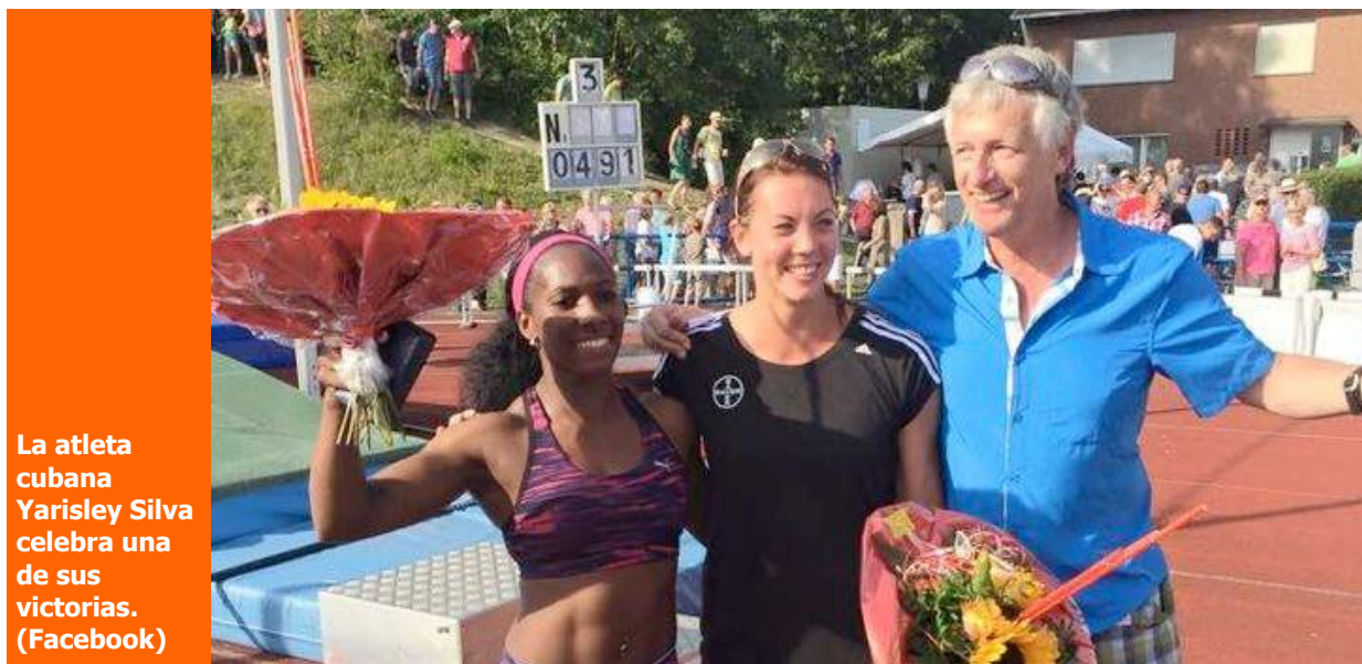
La atleta cubana Yarisley Silva celebra una de sus victorias.