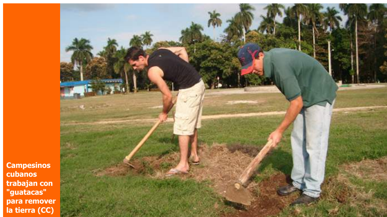
Campeŕinos cubanos trabajan con "guatacas" para remover la tierra (CC)