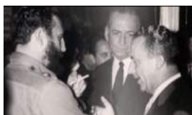
SUIZA, EL MEDIADOR DISCRETO