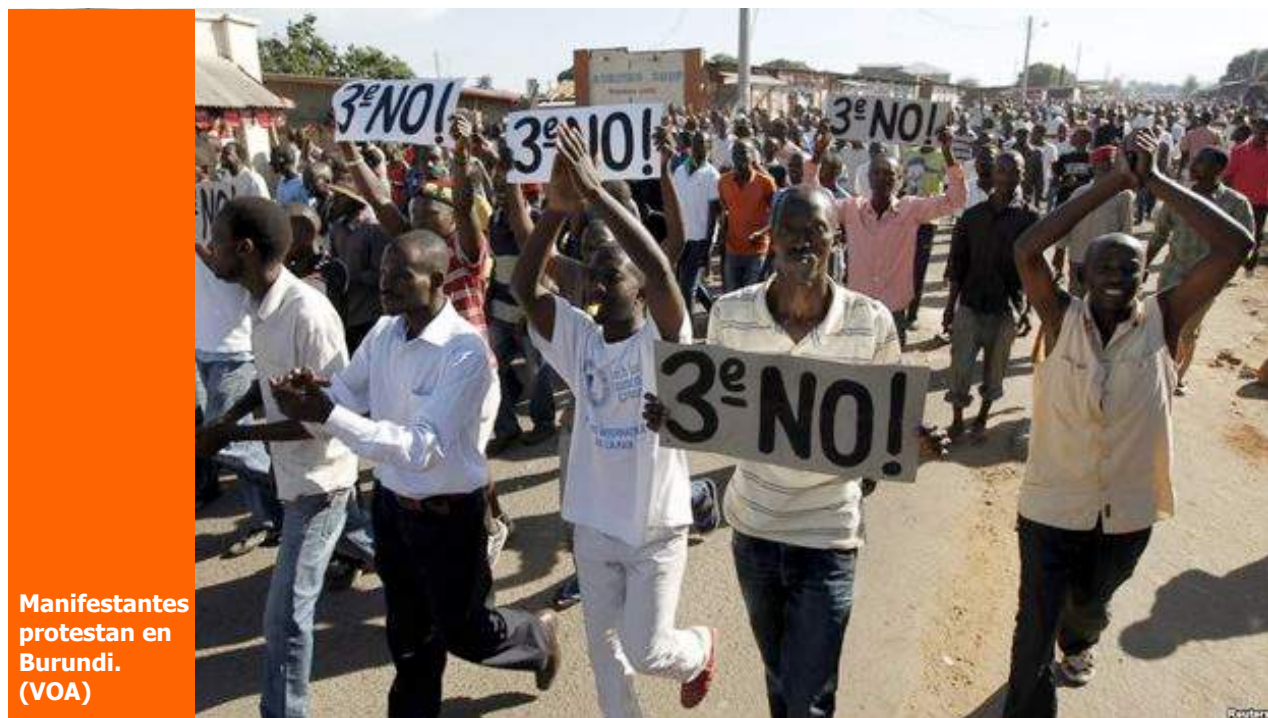
Manifestantes protestan en Burundi.