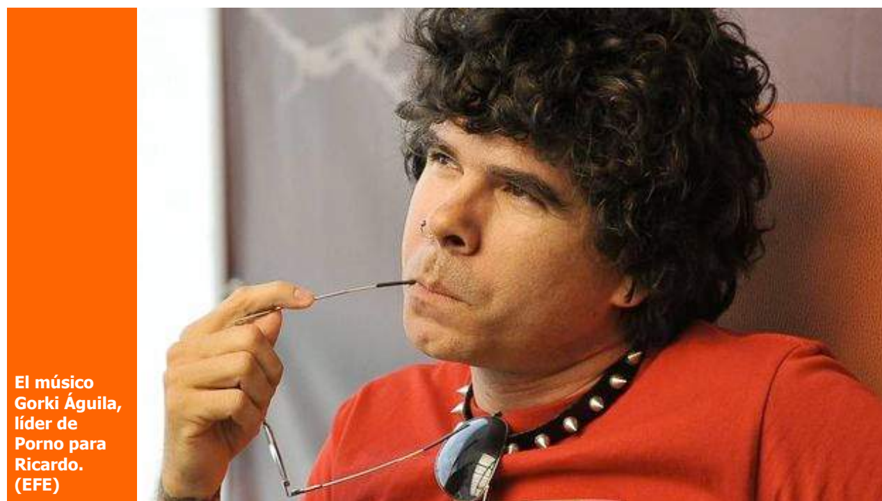
El músico Gorki Águila, líder de Porno para Ricardo.

disquisiciones acerca de los límites de la oposición leal y por ende, de "la otra", debemos empezar a utilizar el término de Gobierno leal para definir el Gobierno que necesitamos: un Gobierno leal dentro de un Estado de derecho.