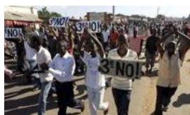
LOS PREJUICIOS QUE PROVOCAMOS