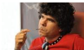
LA POLICÍA ADVIERTE A GORKI