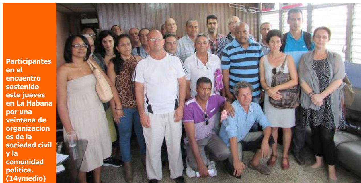
Participantes en el encuentro sostenido este jueves en La Habana por una veintena de organizaciones de la sociedad civil y la comunidad política.

"los de adentro" y "los de afuera"; superar el recelo solipsista que habita en algunos de los primeros y el realismo pedante de quienes, desde fuera del país, creen que en esas condiciones internas no hay una obra digna de reconocerse y valorarse.