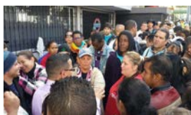
MÉXICO FRENA EL PASO DE CUBANOS