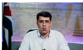
INCUMPLIMIENTOS DE FIDEL CASTRO