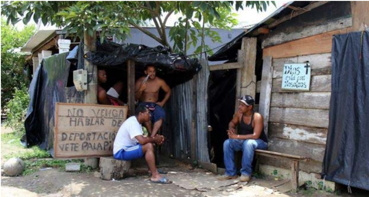
El pasado junio, migrantes cubanos en Ecuador se plantaron ante la embajada de México en Quito para pedir la entrega de visados humanitarios.