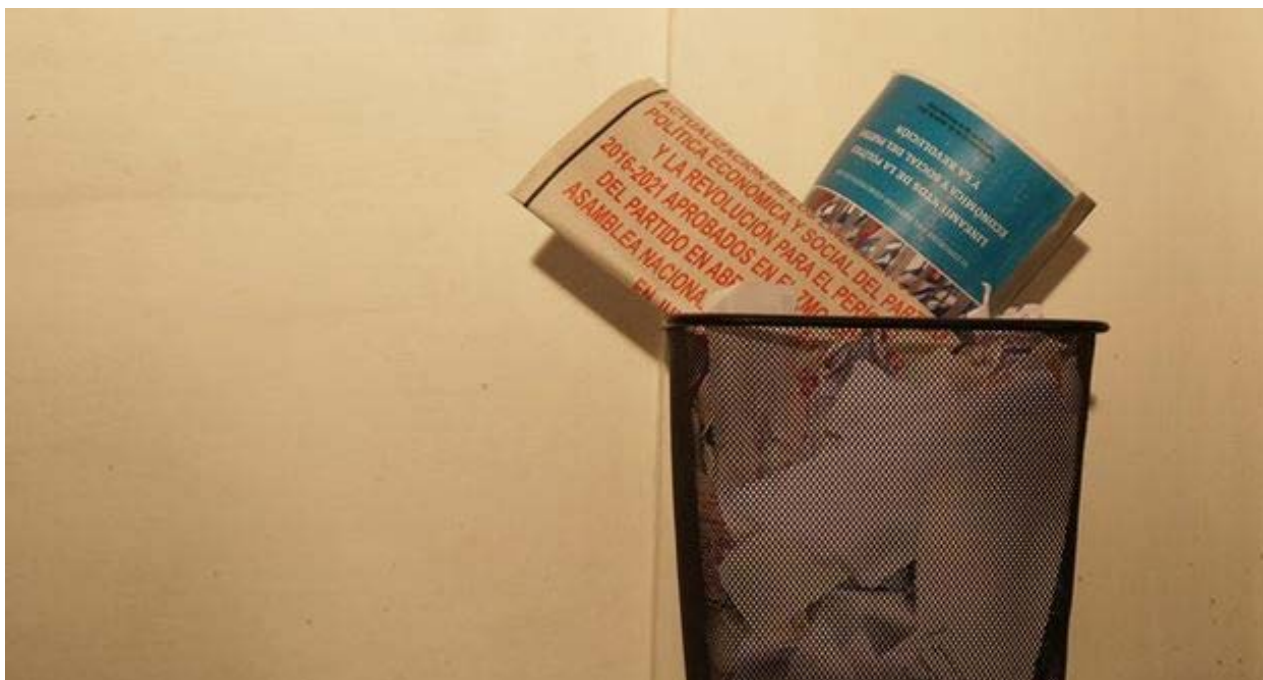
Lineamientos del VI Congreso del Partido Comunista.