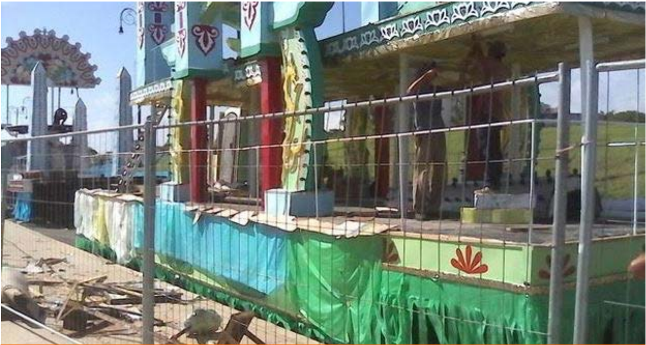
Los carnavales del Comandante.