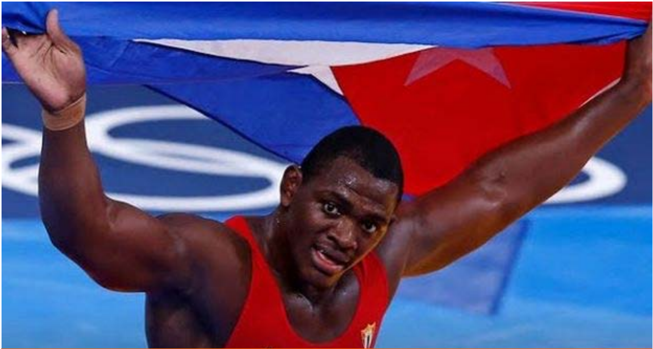
Mijaín López tras alzarse este lunes con el oro en Río.