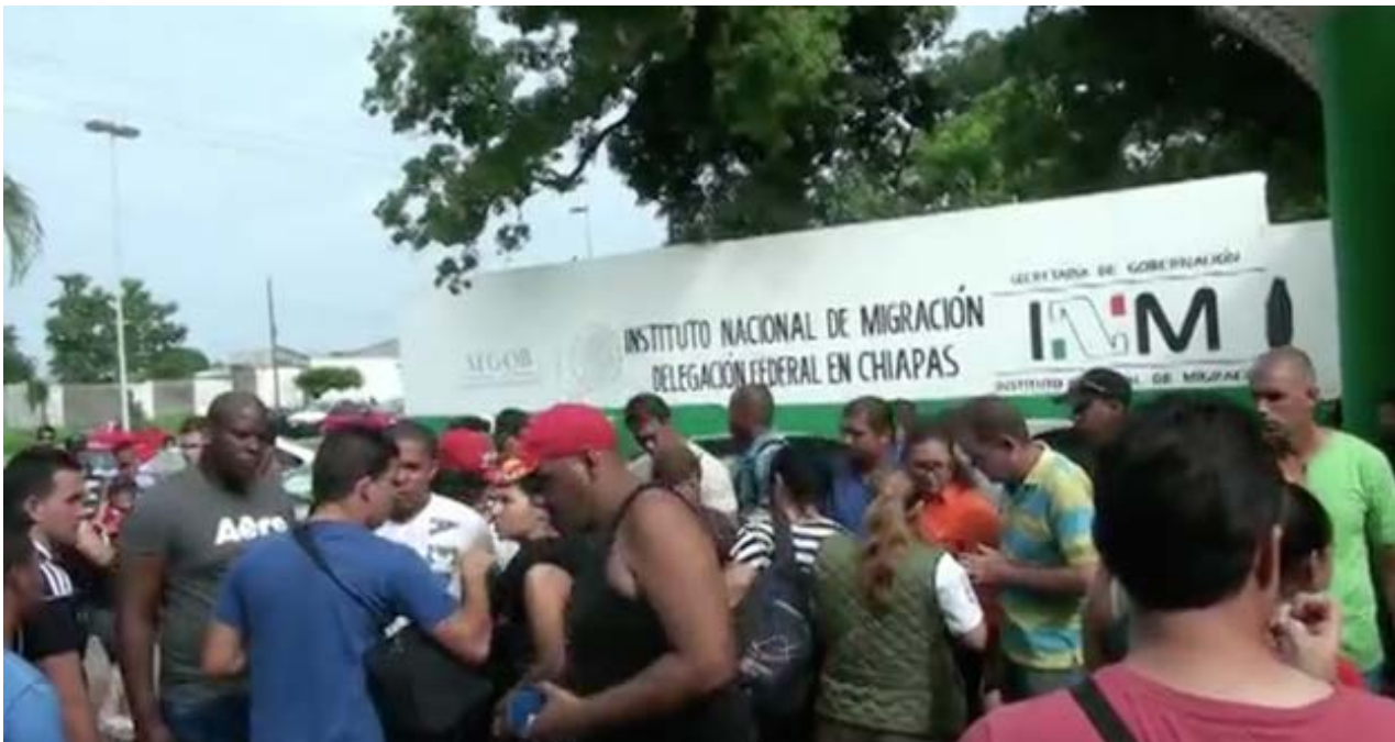
Estación migratoria Siglo XXI donde son retenidos los inmigrantes para su posterior deportación.

Guillermo Toledo : Cubanos Unidos de Puerto Rico