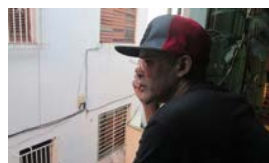
'CANDYMAN', LA LEYENDA