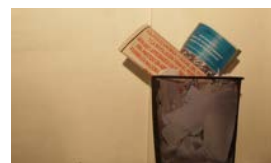
LOS NUEVOS LINEAMIENTOS