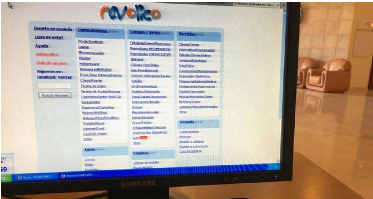
El Gobierno cubano levanta la censura sobre Revolico.