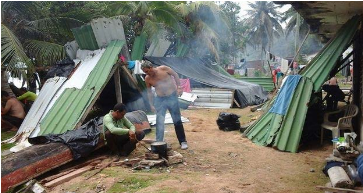
Cubanos en el campamento de La Miel, Panamá.