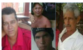
BALSEROS SIGUEN DESAPARECIDOS