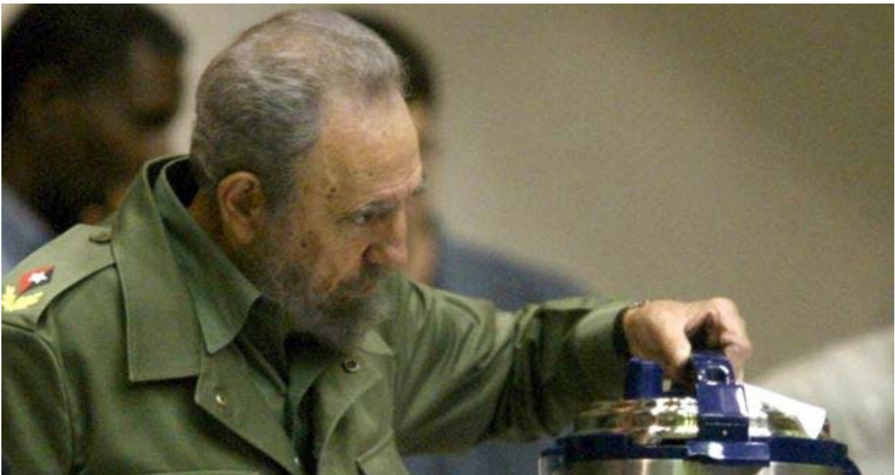
El expresidente Fidel Castro sostiene una olla reina de fabricación china.