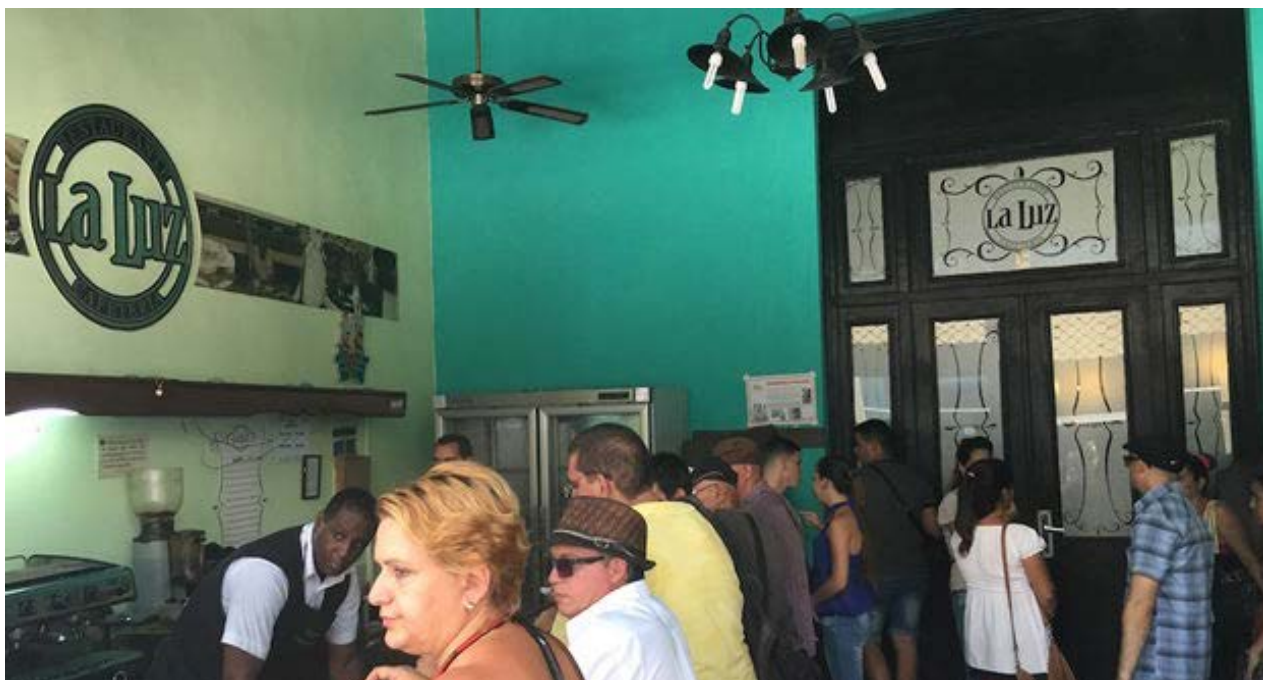
Barra de la cafetería del Restaurant La Luz.