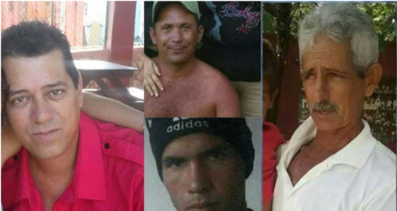
Balseros desaparecidos en las costas mexicanas.