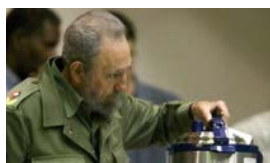
OLVIDAR A FIDEL CASTRO