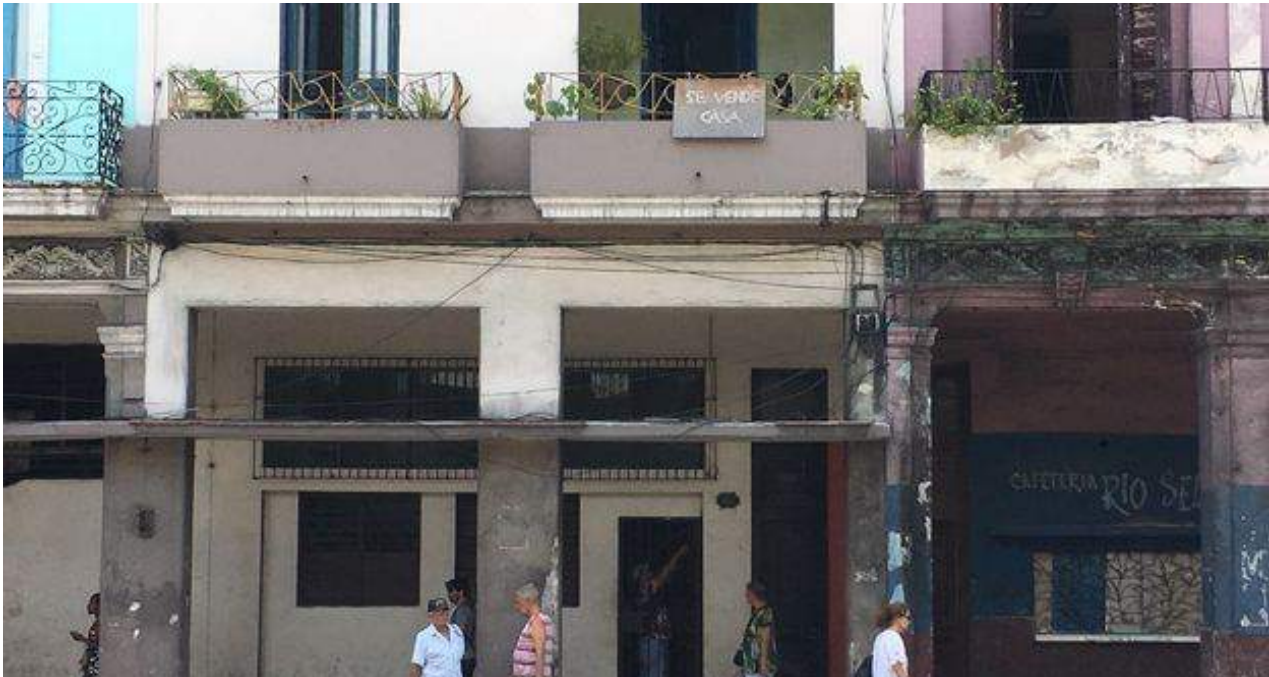
Las nuevas restricciones para la compraventa de viviendas en "zonas de alta significación para el turismo".