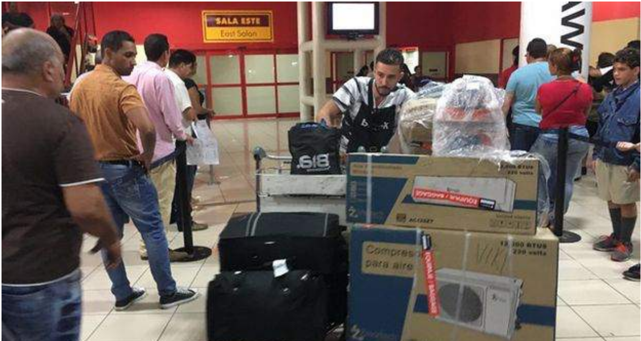
Las cajas de aires acondicionados se acumulan en el aeropuerto de La Habana.