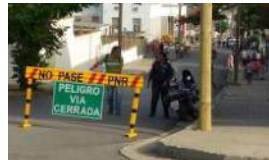
CIENFUEGUEROS PIDEN PAREDÓN PARA ASESINOS