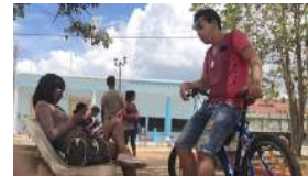
FACEBOOK, ¡NO NOS DEJES EN MANOS DE ETECSA!