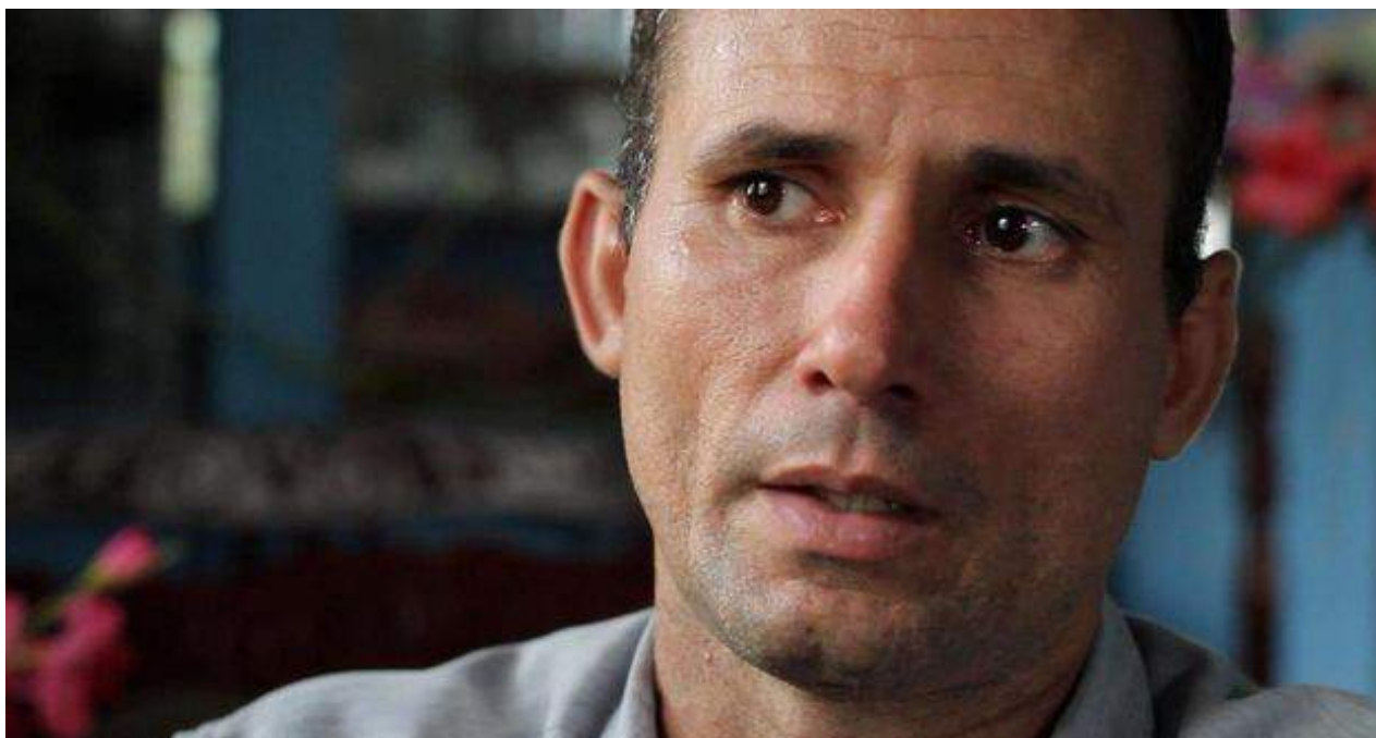
El líder de la Unión Patriótica de Cuba, José Daniel Ferrer.