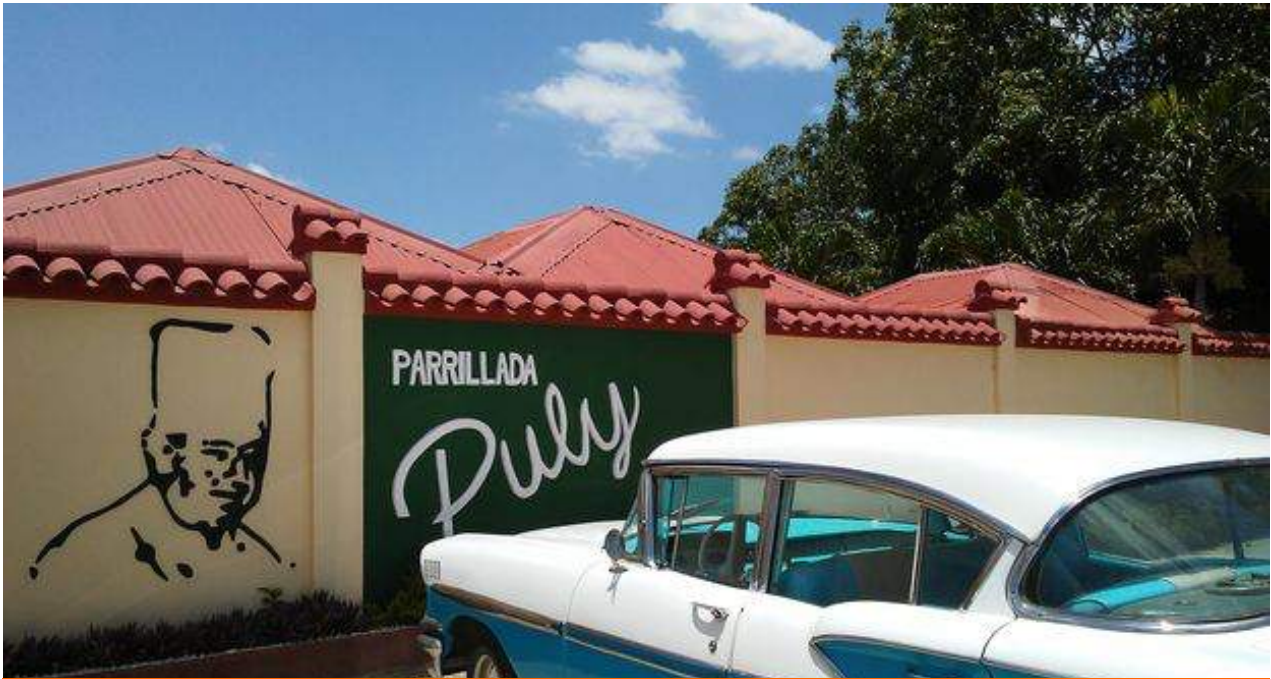
La Parrillada de Puly era un lugar muy visitado en la región oriental.