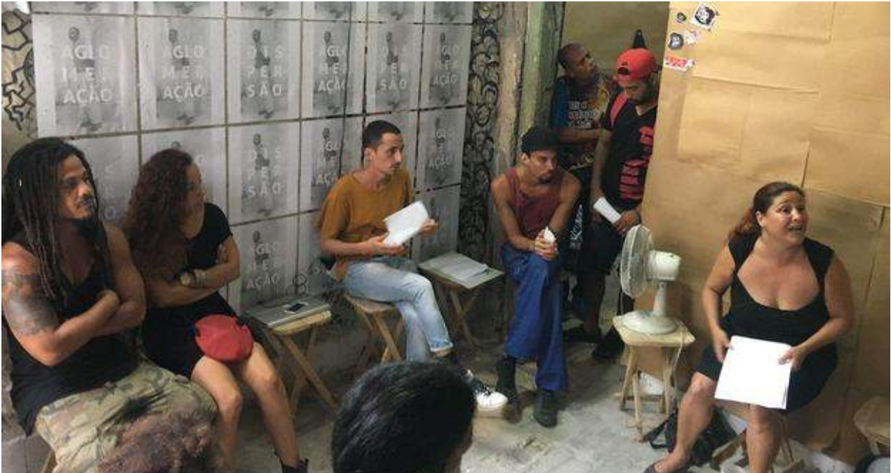
Artistas contra el decreto 349 durante el debate de este miércoles y jueves.