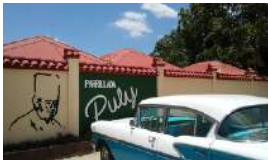
EL PLAN CONSPIRA CONTRA LA VENTA DE CONGRÍ