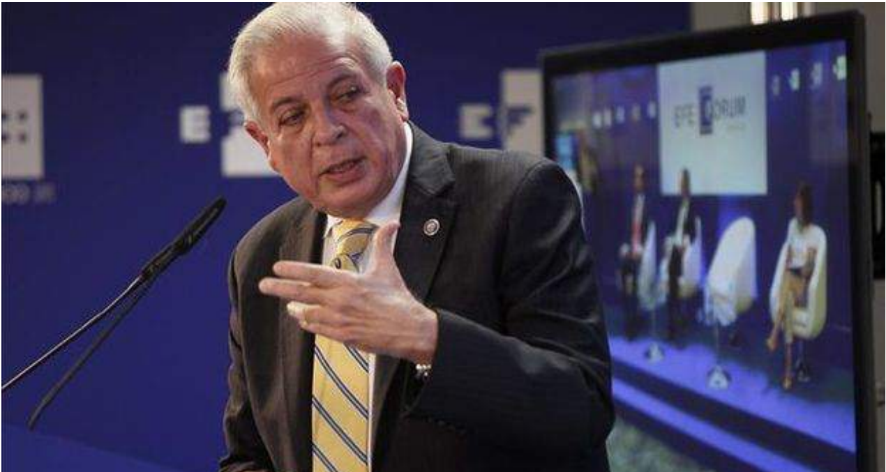
Tomás Regalado anunció las novedades de Radio y TV Martí en una entrevista con 'Diario de las Américas'.