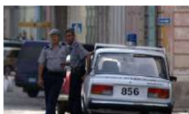
UN TIROTEO EN LA HABANA TERMINA CON UN HERIDO