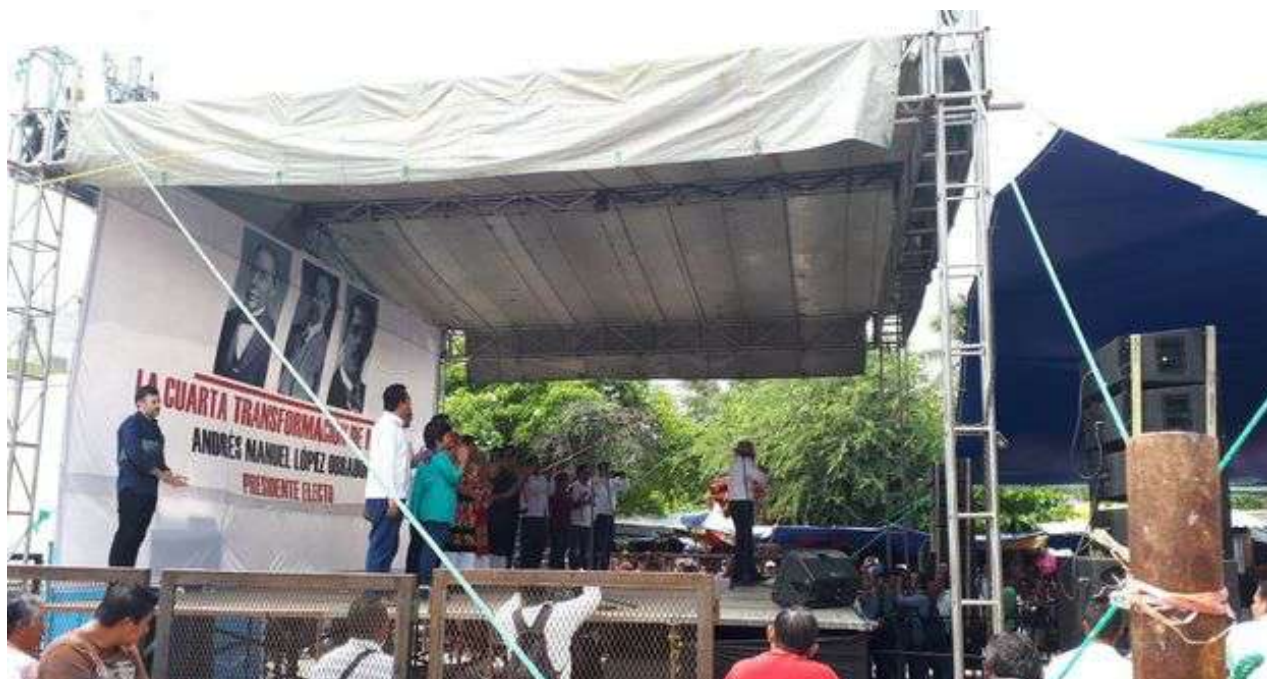
Andrés Manuel López Obrador durante un acto en Juchitán de Zaragoza, México, en septiembre pasado.