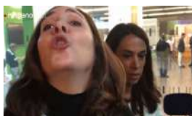
MARIELA CASTRO EXPULSA A DOS REPORTEROS