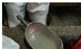
EL RIESGO DE UNA NAVIDAD SIN ARROZ EN LA MESA