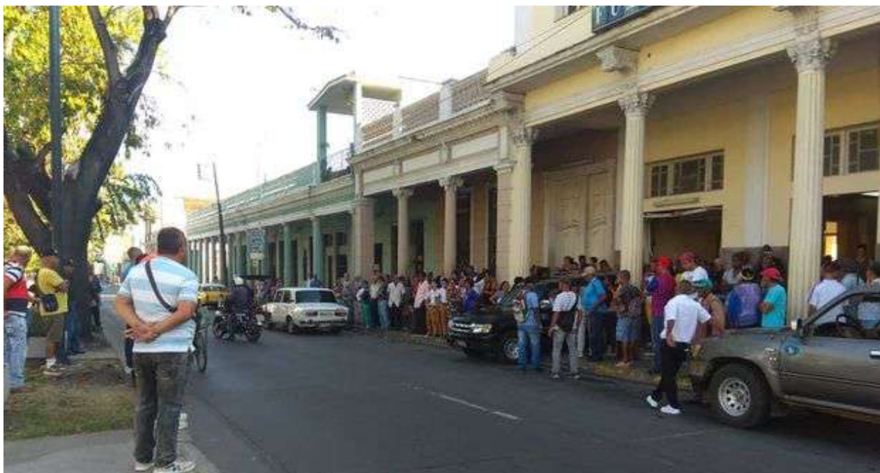
Un fuerte dispositivo policial acompañó el sepelio del presunto asesino de dos mujeres en Cienfuegos. (Justo Mora)