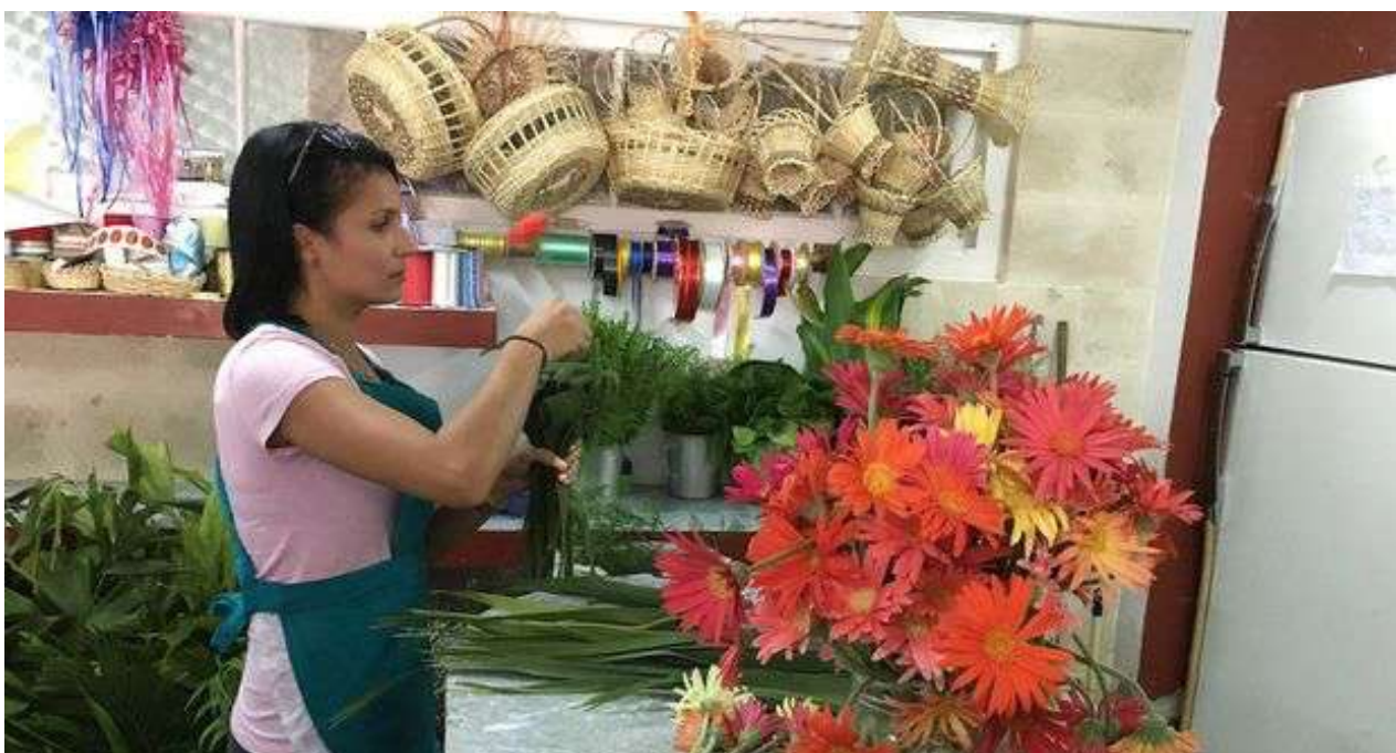
Las quejas fueron subiendo de tono desde que se anunciaron las medidas para "reordenar el trabajo por cuenta propia". (14ymedio)

Una selección con lo mejor de la semana del primer diario independiente hecho en Cuba