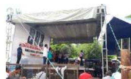
LÓPEZ OBRADOR Y EL EXCESO DE PROMESAS