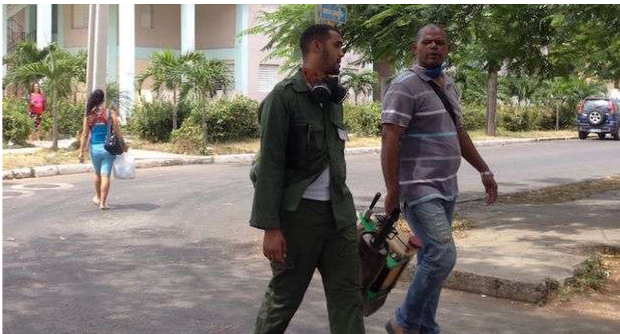
Militares en la campaña de fumigación contra el Aedes aegypti .