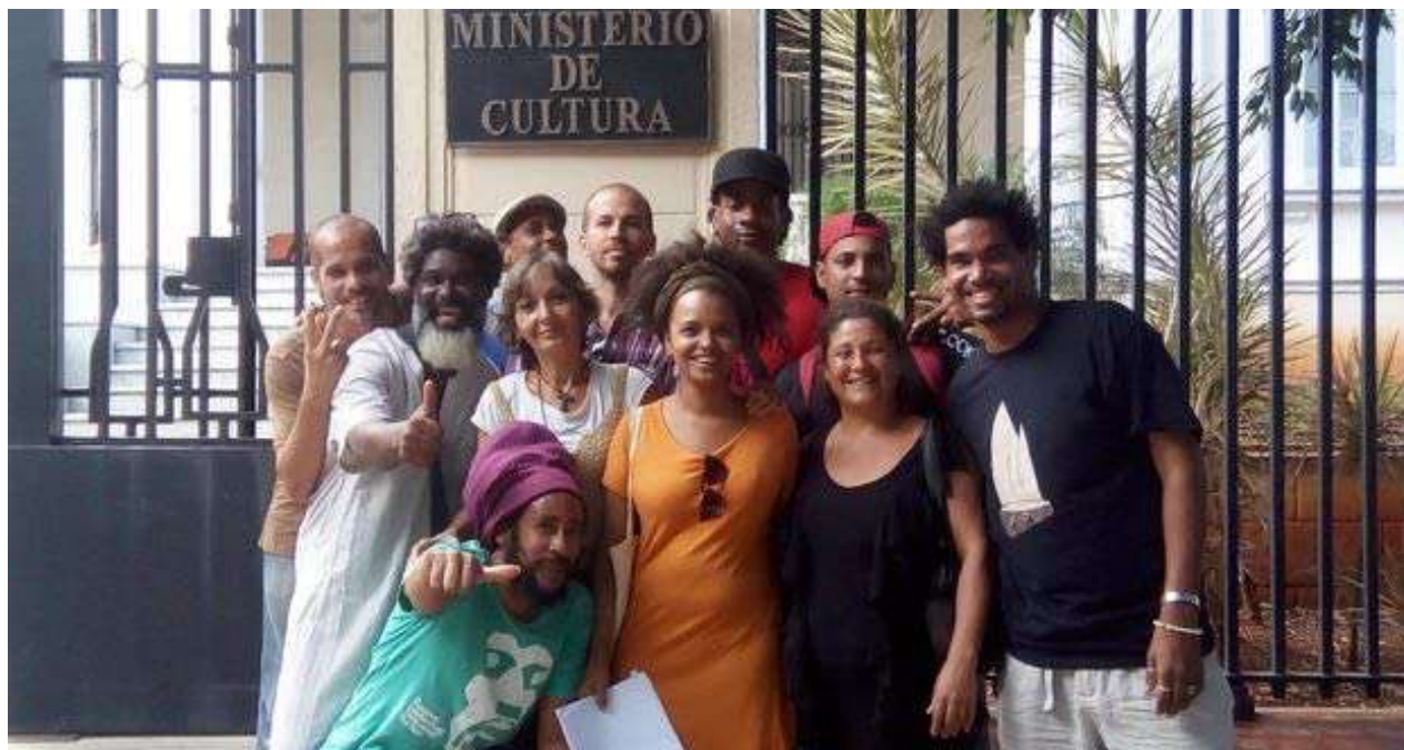
Varios de los artistas que impulsan la campaña contra el Decreto 349 fueron arrestados.