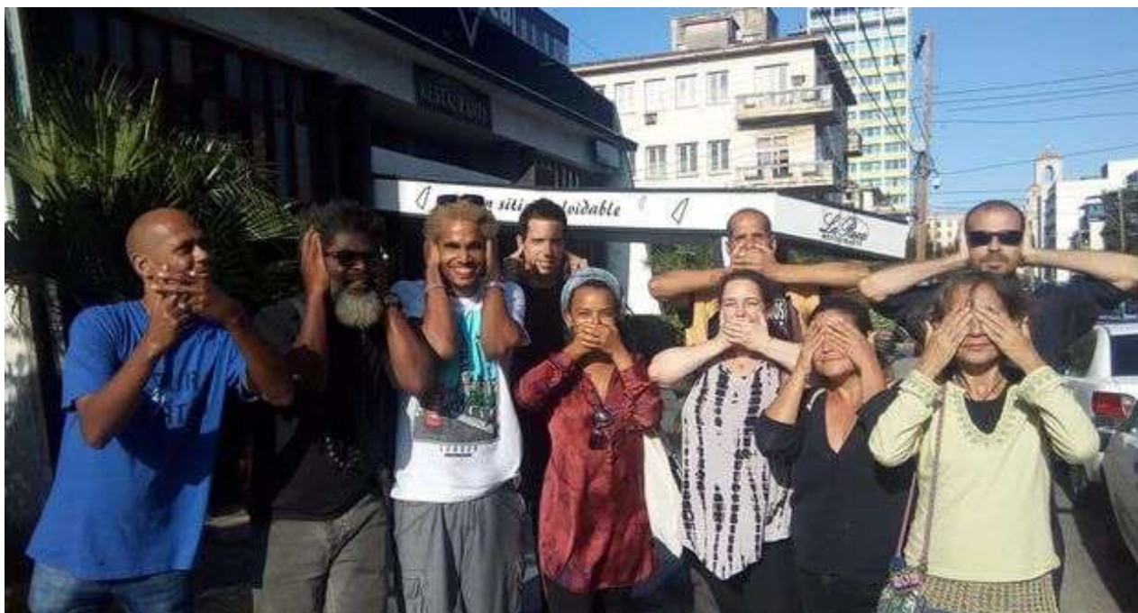
Grupo de artistas que impulsan la campaña contra el Decreto 349.