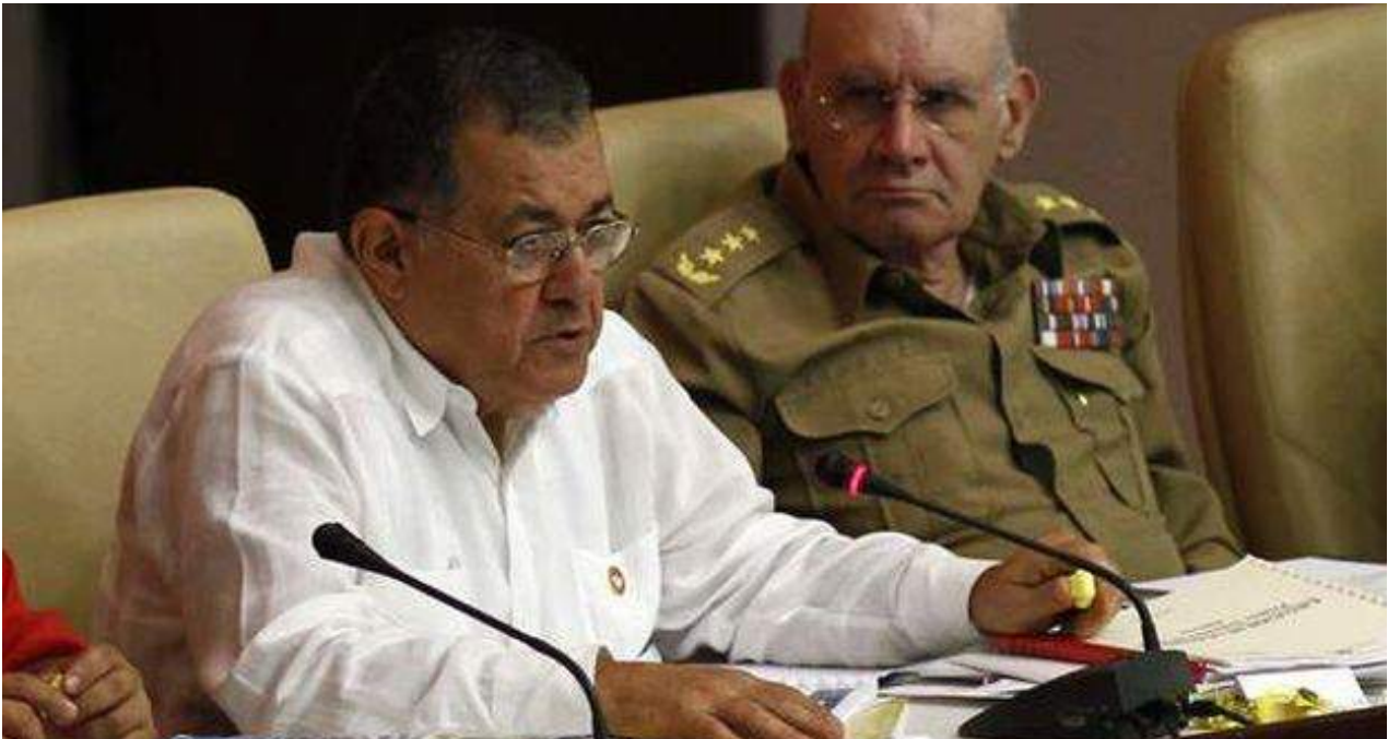
Adel Yzquierdo Rodríguez se desempeñaba como Ministro de Transporte desde 2015.