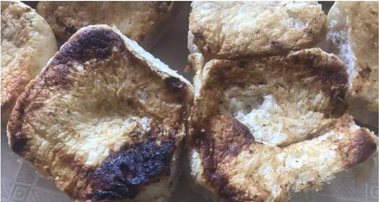
Pan del racionamiento vendido en la barriada de Cojímar, Habana del Este. (Iliana Hernández)