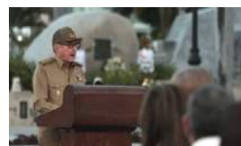
REVOLUCIÓN ES DECEPCIÓN, POR YOANI SÁNCHEZ