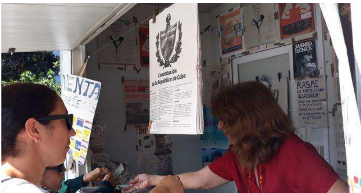
Más de tres millones de ejemplares del texto constitucional están a la venta. El referendo se celebrará el próximo 24 de febrero. (14medio)

Una selección con lo mejor de la semana del primer diario independiente hecho en Cuba