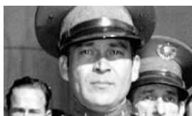
LAS "TRAICIONES", SEGÚN BATISTA