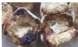
BONIATO Y YUCA PARA SUSTITUIR LA HARINA