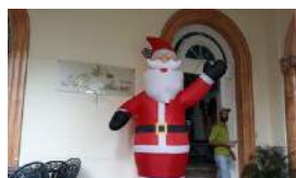
CUBA VA DE LOS CAMELLOS AL TRINEO