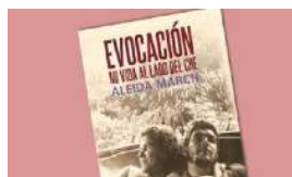
LA VIUDA DEL CHE JUSTIFICA LOS FUSILAMIENTOS