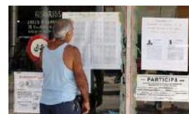
INCERTIDUMBRE SOBRE EL VOTO EN EL EXTRANJERO