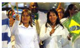
LOS MÉDICOS DESERTORES PIDEN PUESTOS