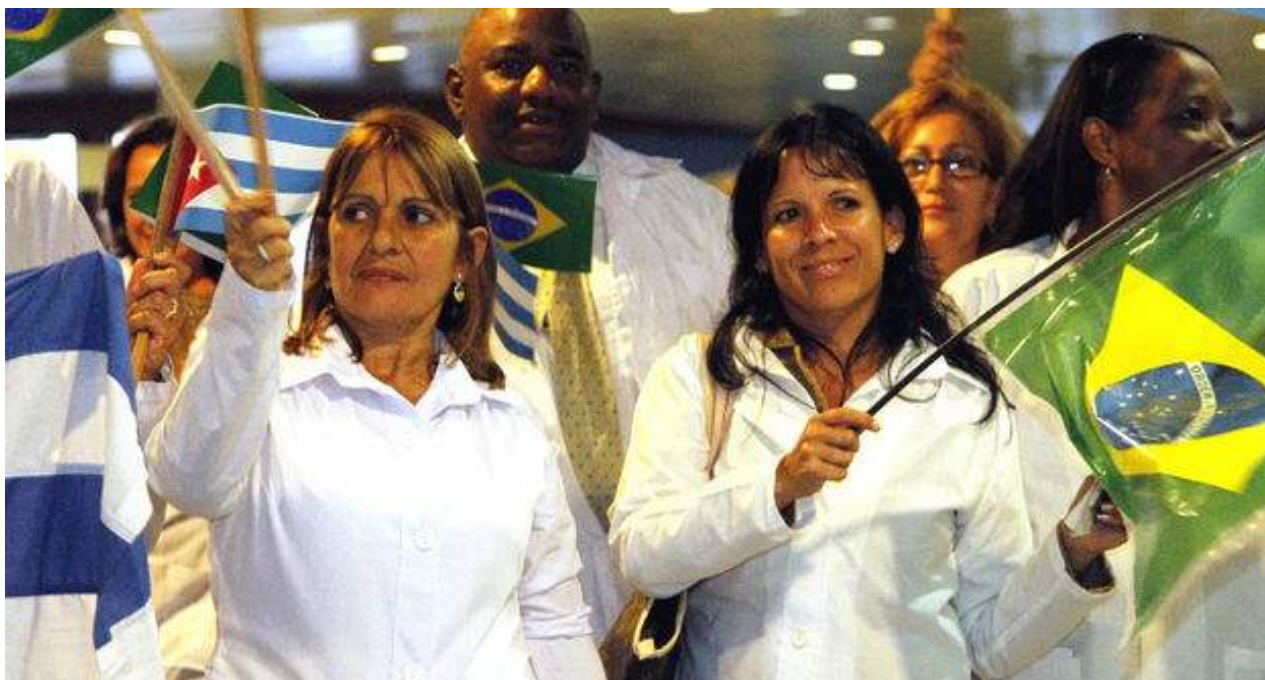
Profesionales cubanos llegando a Brasil al inicio del programa Mais Médicos.