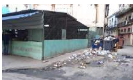
EL SERVICIO DE LIMPIEZA BAJO INVESTIGACIÓN