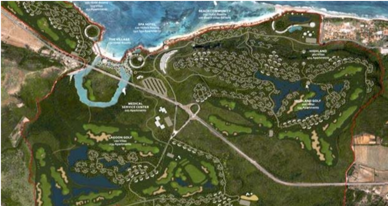
El proyecto inmobiliario de Wilton Properties en Jibacoa. (Wilton Properties)