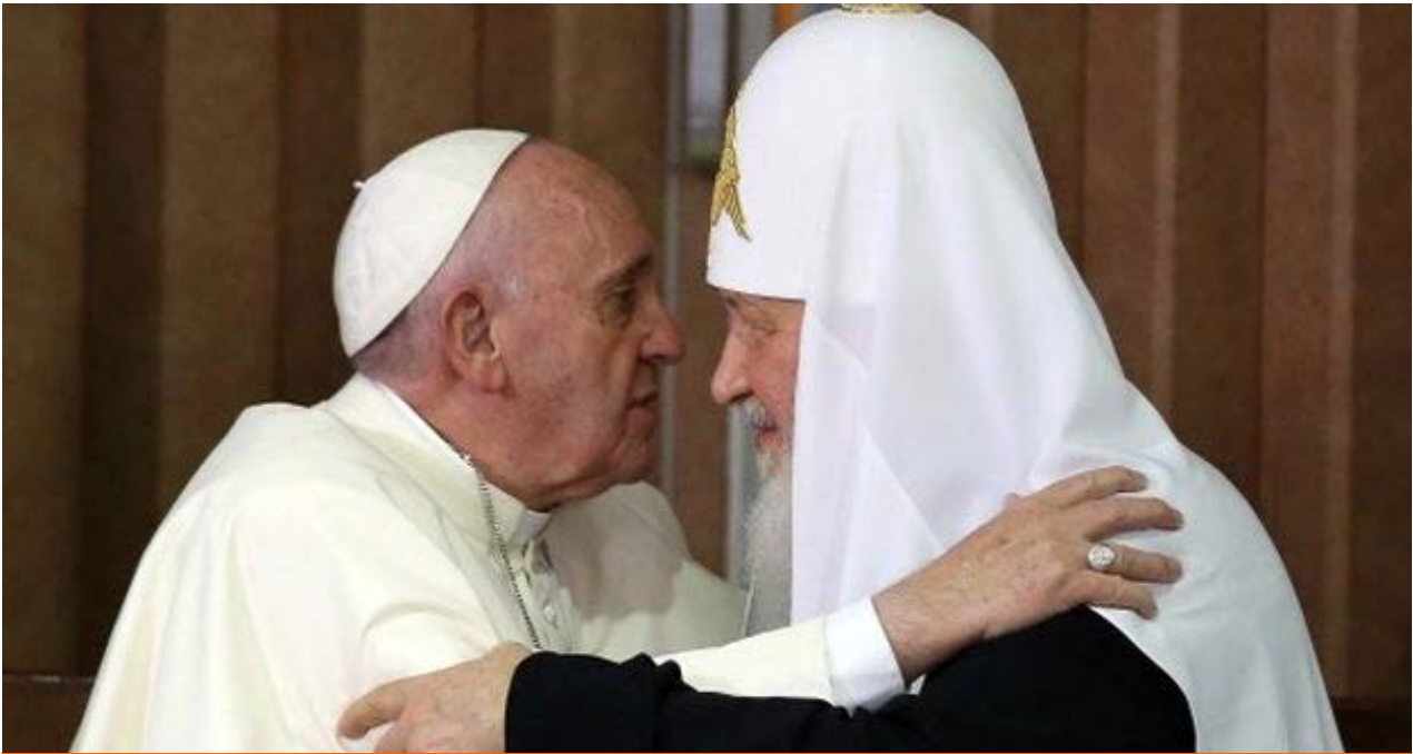
El papa Francisco y el patriarca Kiril durante su encuentro en La Habana.