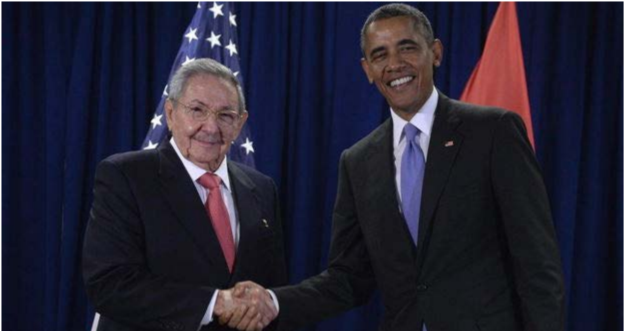
El presidente de Estados Unidos, Barack Obama, y su homólogo cubano, Raúl Castro, en la sede de las Naciones Unidas.