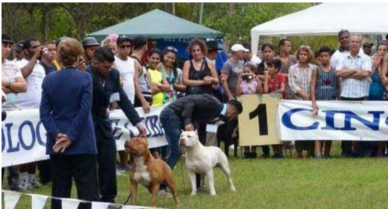
Perros durante una demostración.