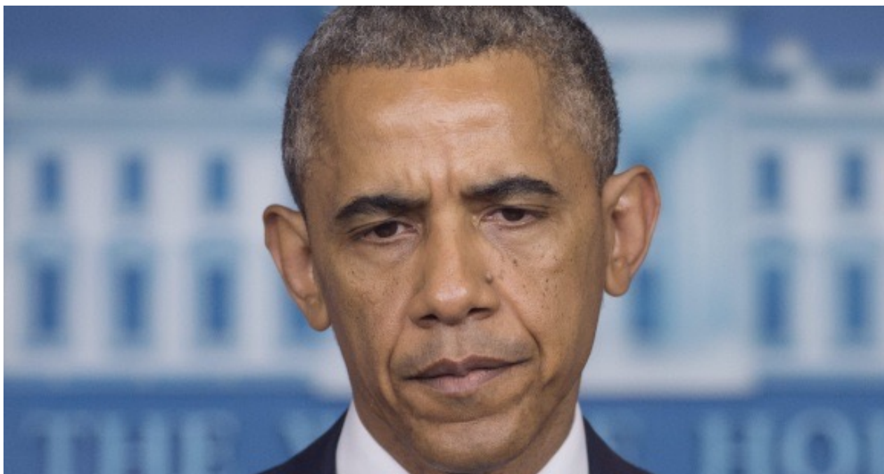
El presidente de EE UU, Barack Obama.