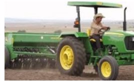
TRACTORES OGGÚN PARA CUBA