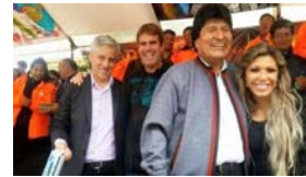
CAMBIO DE CICLO EN BOLIVIA