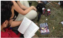
'1984' DE ORWELL VUELVE A CUBA