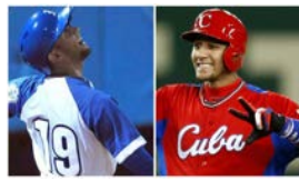
"LISTOS PARA JUGAR"