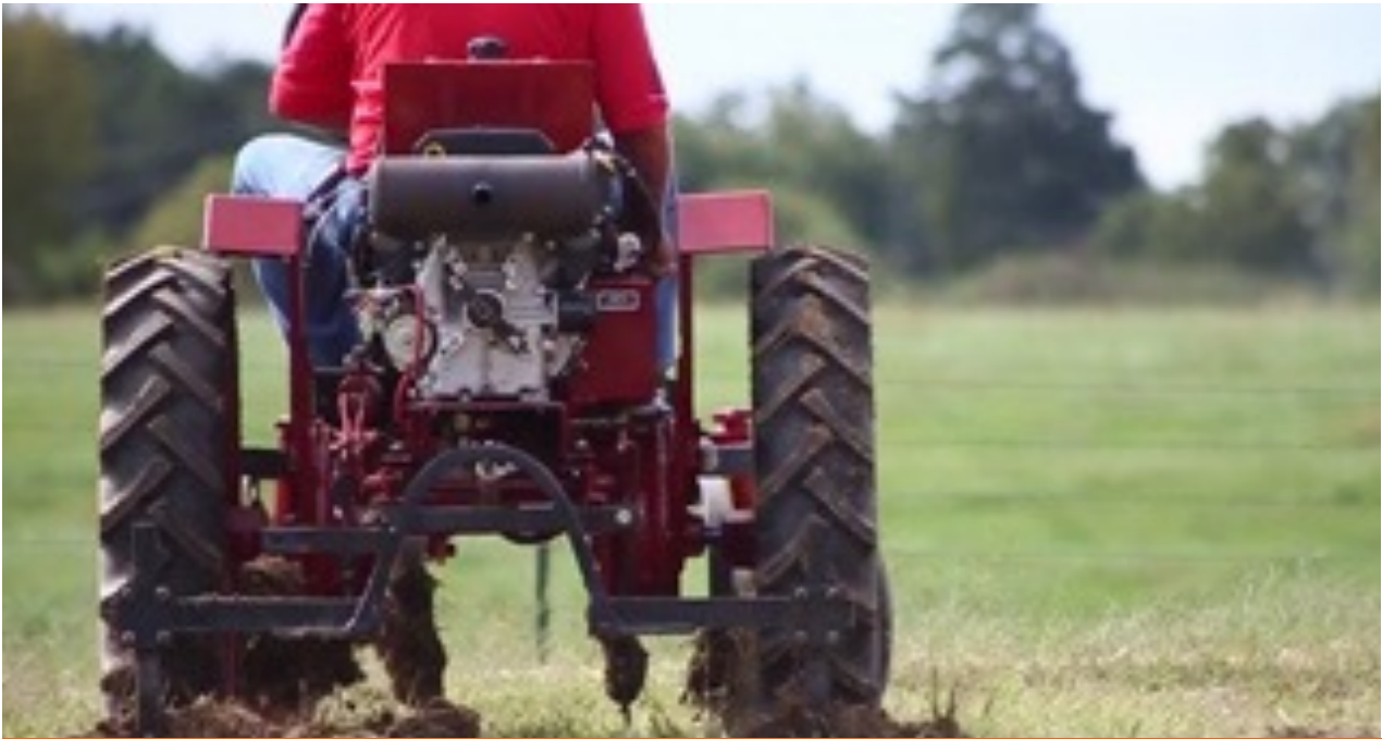
Tractor Cleber.