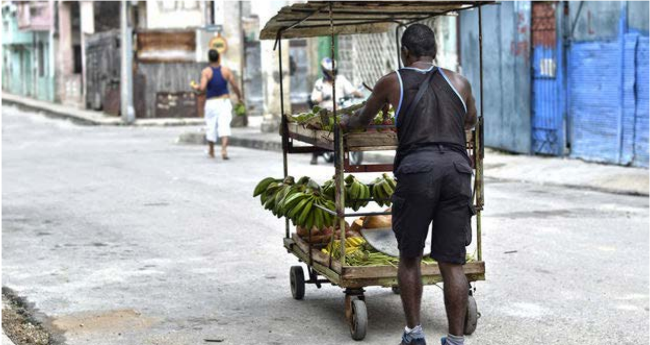
Carretillero en una calle de La Habana.

mejora de los derechos humanos en la Isla. "Creo que hay que darle un voto de confianza de que algo así se puede lograr, porque de lo contrario él sabe lo desamparados que dejaría a los activistas si le da un espaldarazo al Gobierno cubano", dice.