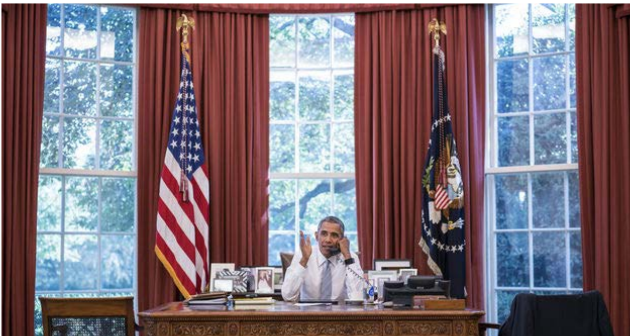
El presidente de EE UU, Barack Obama, habla con su homólogo cubano, Raúl Castro.

Una selección con lo mejor de la semana del primer diario independiente hecho en Cuba