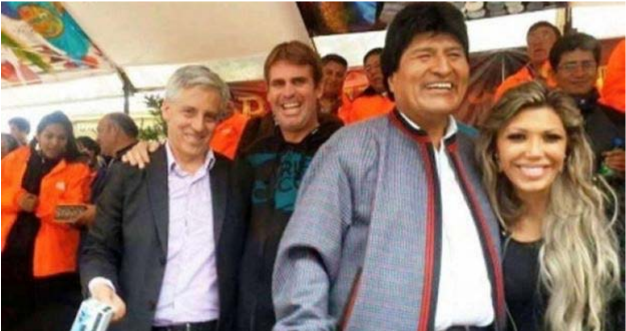
Evo Morales y Gabriela Zapata compartieron en el palco oficial del Carnaval de Oruro 2015.